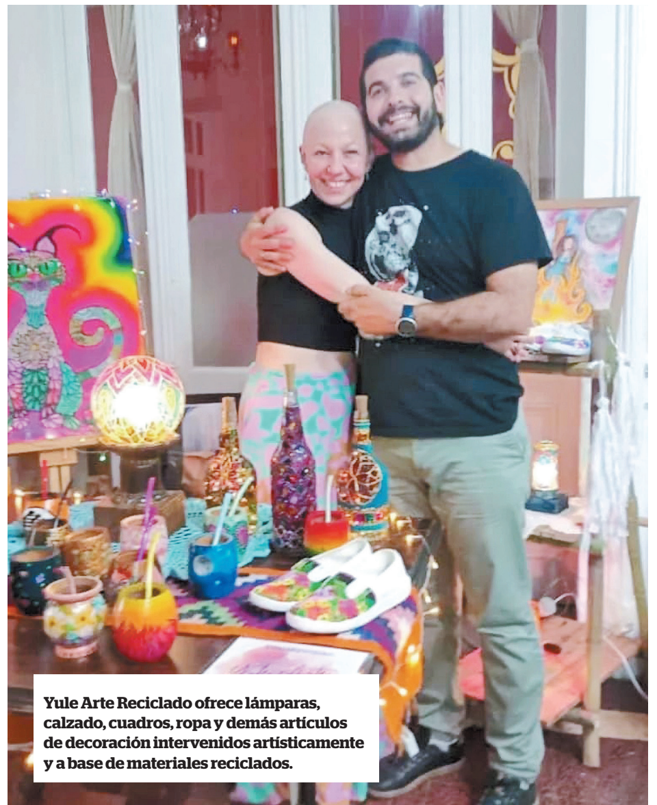
Yule Arte Reciclado ofrece lámparas, calzado, cuadros, ropa y demás artículos de decoración intervenidos artísticamente y a base de materiales reciclados.

Siempre supo lo que quería hacer pero el camino fue sinuoso. “Trabajé 17 años en un estudio jurídico. En paralelo, hacía bijouterie en alpaca para vender o pintaba para regalar. Es difícil vivir económicamente del arte y no tener la tranquilidad de la estabilidad. En 2017 me propusieron vivir en México para trabajar en una sucursal del estudio. Allá estuve mucho tiempo sola y mi refugio era el arte. México fue una explosión de colores, sentidos, murales”.