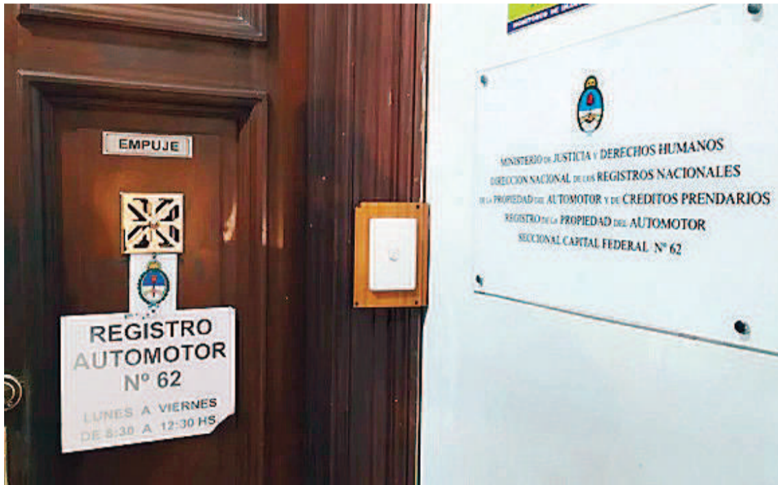
Se reducirá el 30 % del personal de la Dirección Nacional de Registros Automotor.

- Se cerrará el 40% de los Registros Automotores, comenzando