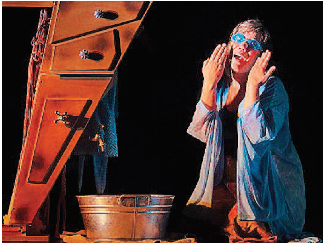
Esta noche desde las 21, se presenta "Yo, Odisea" en la Escuela del Bardo.

Hoy a partir de las 20, Chavela Itinerante: Aquellas Viejas Cumbias + Dj Rayolaser. En la Casa