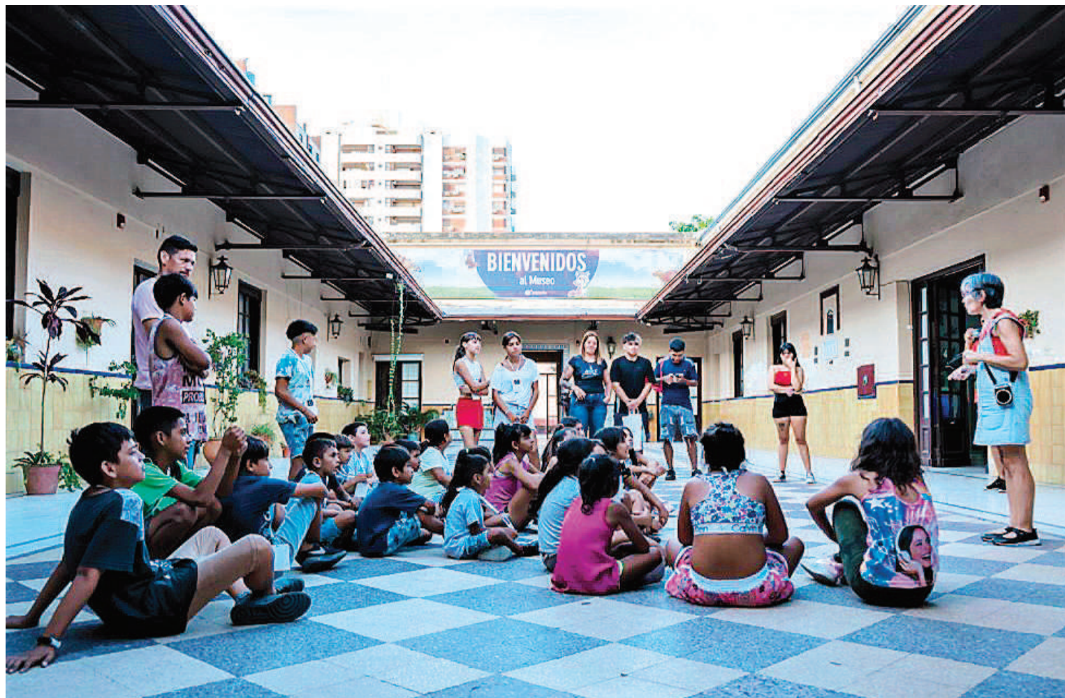
Se realizan visitas guiadas en museos provinciales para estudiantes y público en general.