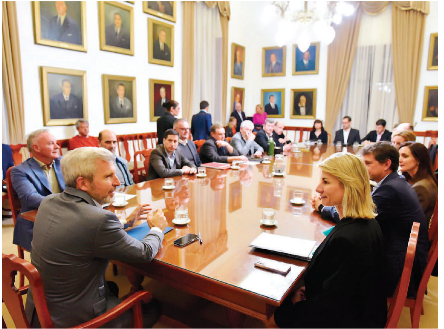
Frigerio se reunió con integrantes de la Cámara de la Construcción, de Uocra y del Ministerio de Planeamiento.

a dirigentes de la Unión Industrial de Entre Ríos (UIER), las Bolsas de Comercio y de Cereales, el Consejo de Empresarios, los Colegios de Ingenieros, de Arquitectos y de Corredores, y la Federación Agraria Argentina (FAA) Entre Ríos, con quienes avanzaron en una mesa de diálogo para planificar de ma-