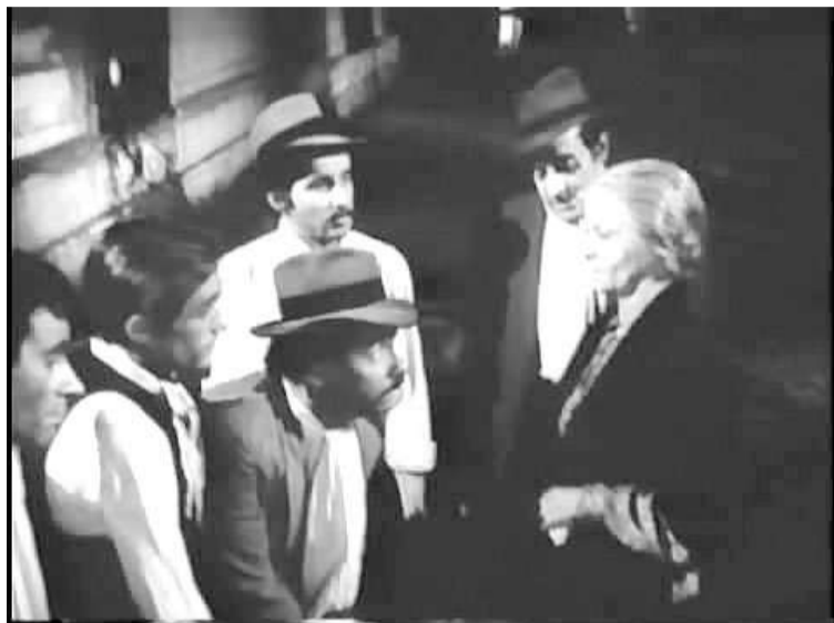
Escena del filme “Un guapo del 900”, de Eichelbaum, filmada en 1960.

Su propuesta implicaba sustituir los bachilleratos comunes por un sistema de colegios secundarios descentralizados que respondieran a las características de cada región, con una considerable reducción de los contenidos humanistas, como la en-