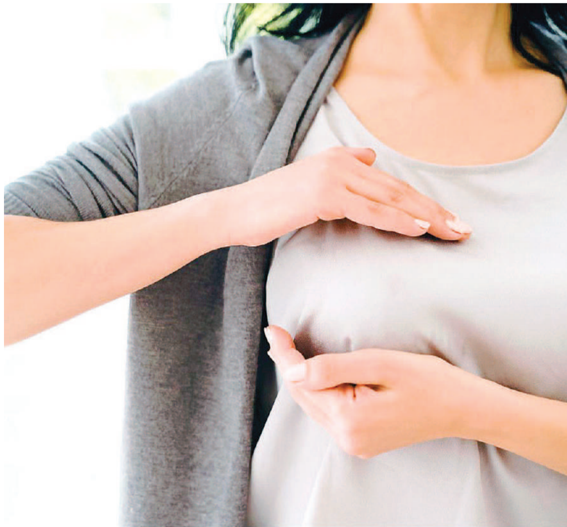
El cáncer de mama es el tumor más frecuente en Argentina, con más de 22 mil nuevas detecciones anuales.

Esta tendencia fue uno de los ejes centrales que se abordaron en el Simposio Multidisciplinario so-