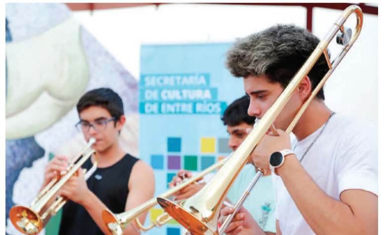
La nueva agrupación que se incorpora al programa desde Gualeguaychú, lleva por nombre Yaguarí Guazú, que significa "nutria grande", en guaraní.

TRAYECTORIA. El programa de Orquestas, Ensamblés y Coros de Entre Ríos se desarrolla desde el año 2012 en la provincia, garantizando el acceso a este bien cultural a niños y jóvenes de 7 a 21 años que deseen aprender a leer música y a tocar un instrumento de manera individual y colectiva. Desde la Coordinación se busca apostar al fortalecimiento de la iniciativa como política pública cultural, social