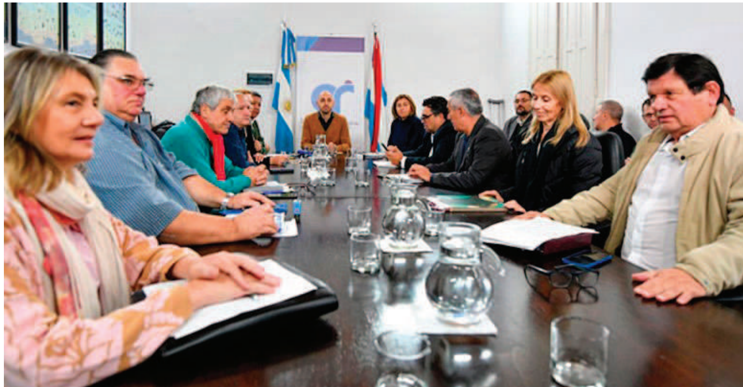
El gobierno provincial se reunió con los sindicatos docentes.