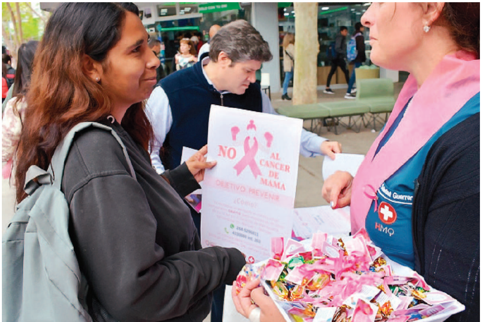
Las últimas investigaciones internacionales en cáncer de mama brindan evidencias que permiten detectar pacientes que podrían verse beneficiadas con un desescalamiento de los tratamientos.

Y tras remarcar que "el objetivo final de todo tratamiento es modificar y aumentar los porcentajes de curación de las pacientes", amplió: "Si bien hay distintos parámetros para medirlo en el aspecto científico (sobrevida, tiempo libre de enfermedad, etc.), siempre se está detrás de ese objetivo. Pero cada vez más se considera la calidad de vi-