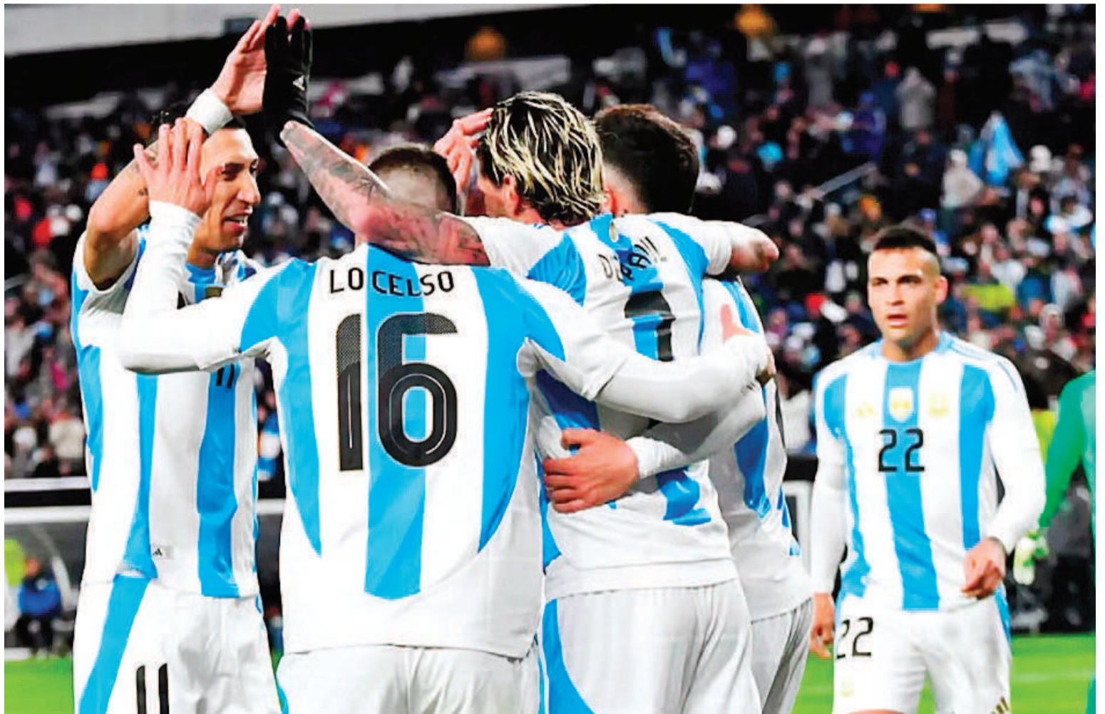
La 'Scaltoneta' sigue arriba en el ranking mundial y prevé ir por mucho más.

gentino no cedió su posición e incluso mantuvo su lugar tras sufrir la derrota contra Uruguay, en la quinta fecha de las Eliminatorias