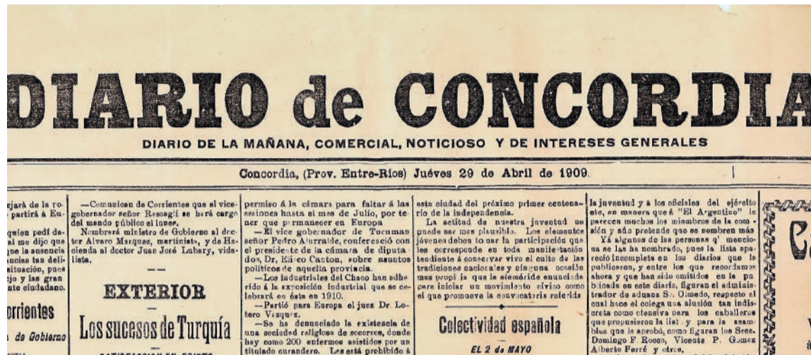
Diario de Concordia dirigido por Damián P. Garat - 1909.