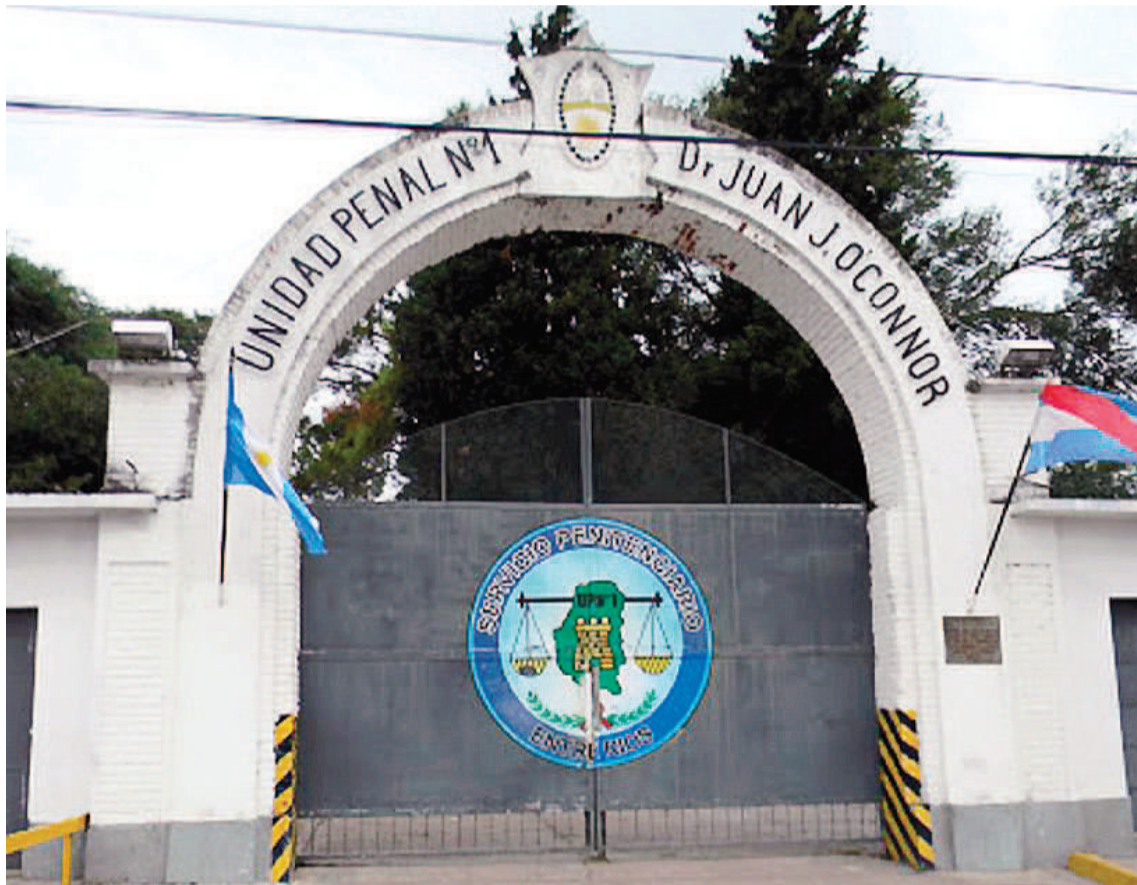
El ex funcionario policial transitaba su condena en la Unidad Penal N°1 de Paraná.

Desde el Ministerio Público Fiscal de Concordia indicaron que ya se encuentran trabajando para remitir nuevamente la causa a juicio.