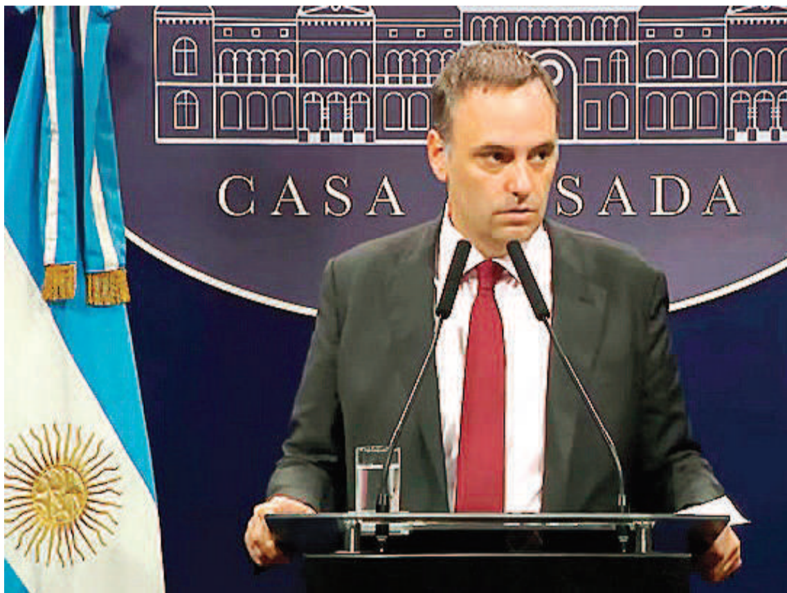
Adorni dio ayer una de sus habituales conferencias de prensa.

“Por decisión del Gobierno nacional se va a enviar un proyecto