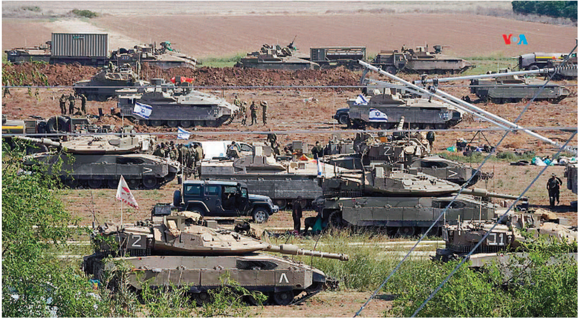
El ejército israelí concentra sus tropas y se prepara para el peor escenario posible.

► MANTIENE SUS TROPAS PREPARADAS PARA CUALQUIER ATAQUE