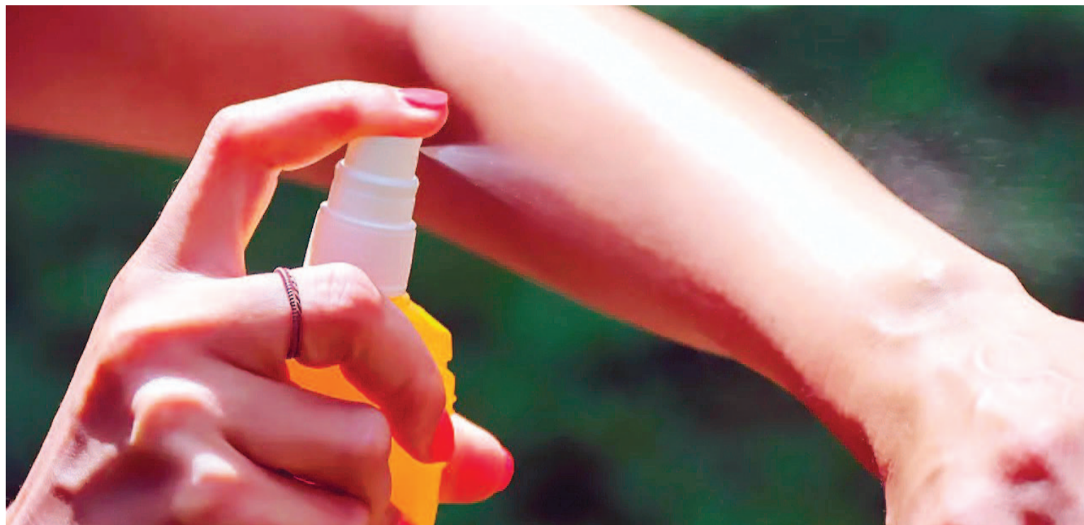
La medida regirá para aerosol, crema, spray y gel, en medio de la inédita epidemia de dengue.

La Anmat exceptuará su intervención para importar aerosol, crema, spray y gel repelente de mosquitos, tanto para importadores como para la adquisición de particulares por servicios puerta a puerta.