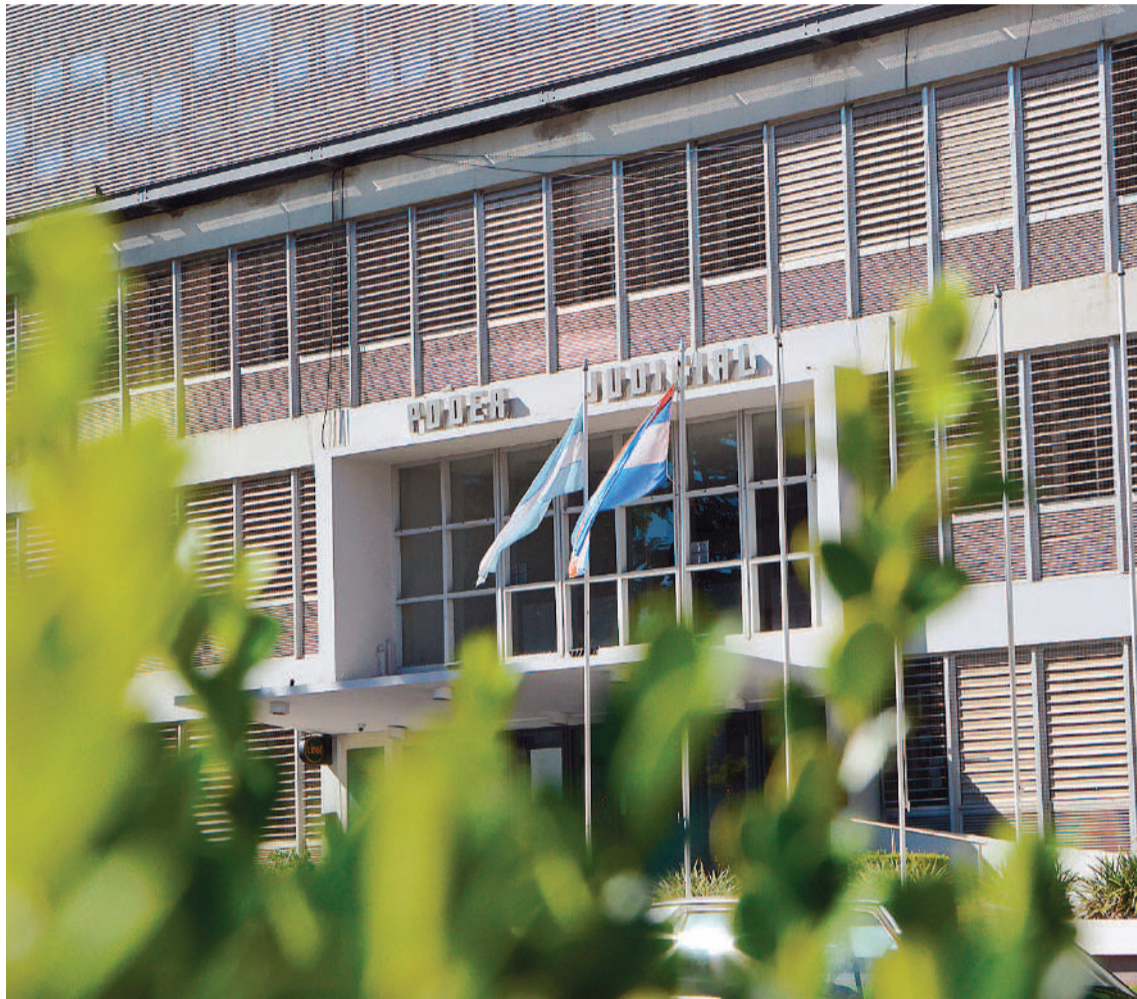
Continúan desarrollándose tensas audiencias en la causa.