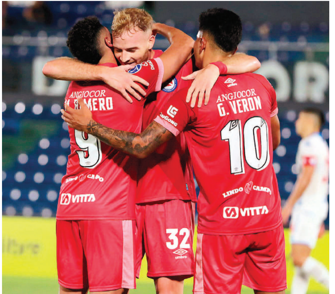
La Copa de la Liga transitará la anteúltima fecha de la fase de grupos. El Bicho es el actual puntero, a dos de su escolta, por lo que apunta a ganar para asegurar el pase.

En la última fecha, los del Sur se enfrentarán a Gimnasia en el