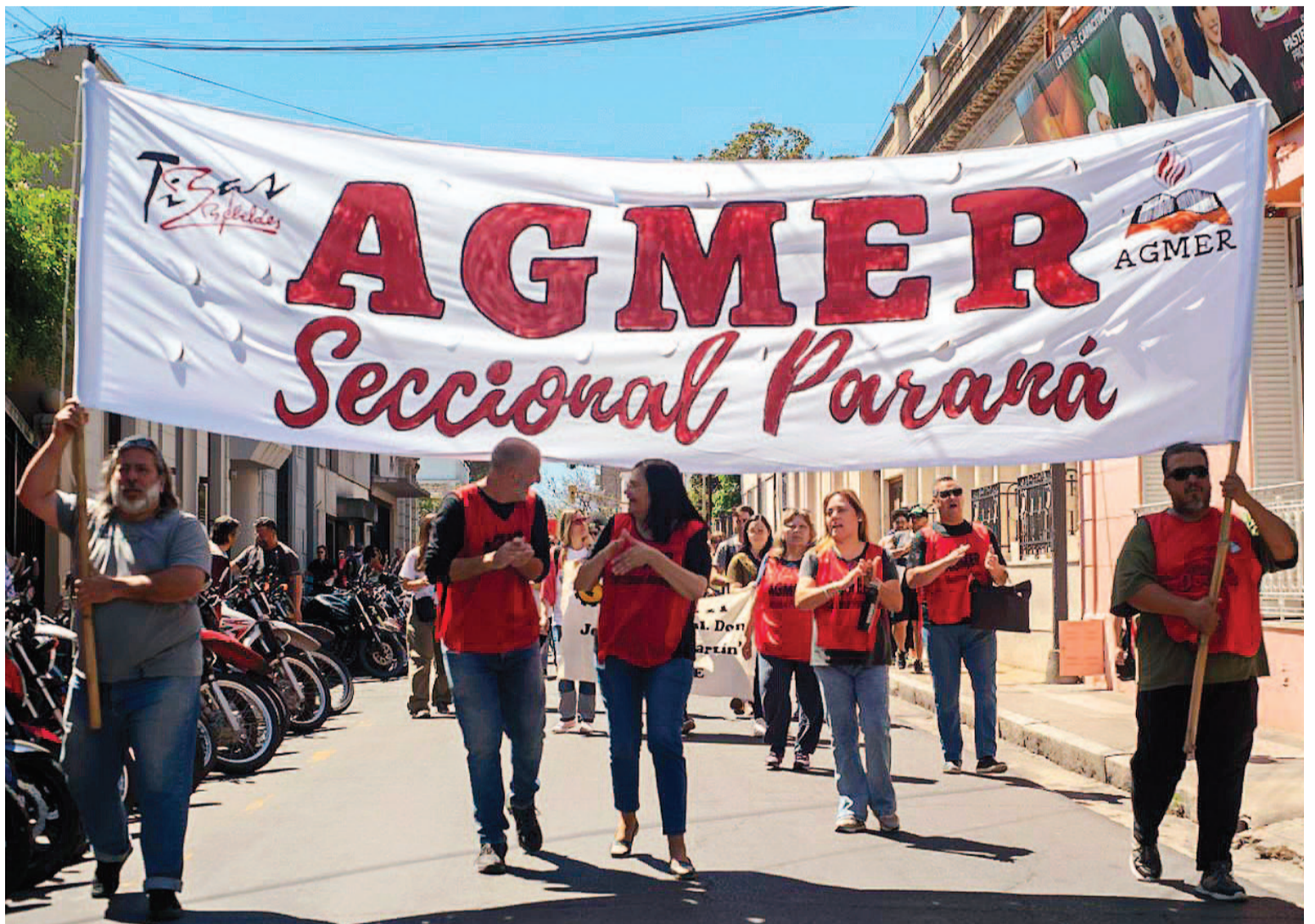
Miembros del gremio se movilaron por las calles de la capital entrerriana y realizaron su reclamo.

TENSIÓN EN BUENOS AIRES. El gremio CTERA realizó el paro nacional docente, un día después de