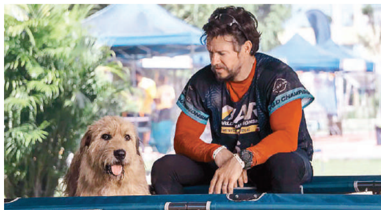
Arthur, estreno en Cine Círculo y Sunstar.

Sala 1 15.00 (sab y dom) | 17.00 | 19.00 - Kung Fu Panda 4, 3D