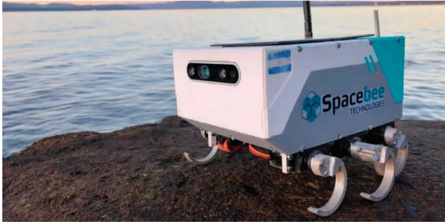
RoverTito, el primer rover lunar de Latinoamérica.