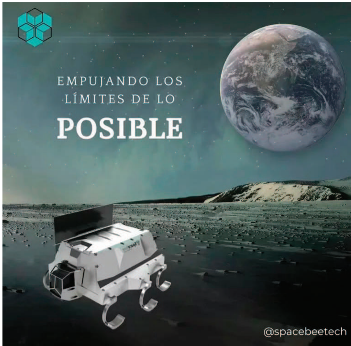
Ya tienen un nombre propio, que eligieron para identificarse en la competencia: Spacebee Technologies.

CAMPAÑA PARA VIAJAR. Actualmente cuentan con un prototipo, pero construir un robot que pueda soportar las condiciones del espacio tiene un costo elevado. “Se requieren de componentes espaciales, y nosotros estamos intentando hacerlo súper lowcost, y reducir el