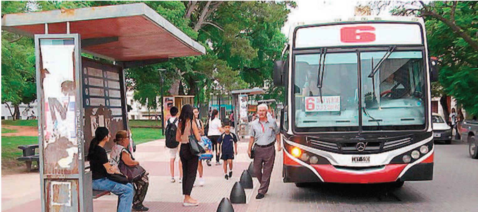
El Área Metropolitana contará nuevamente desde hoy con el servicio de transporte.