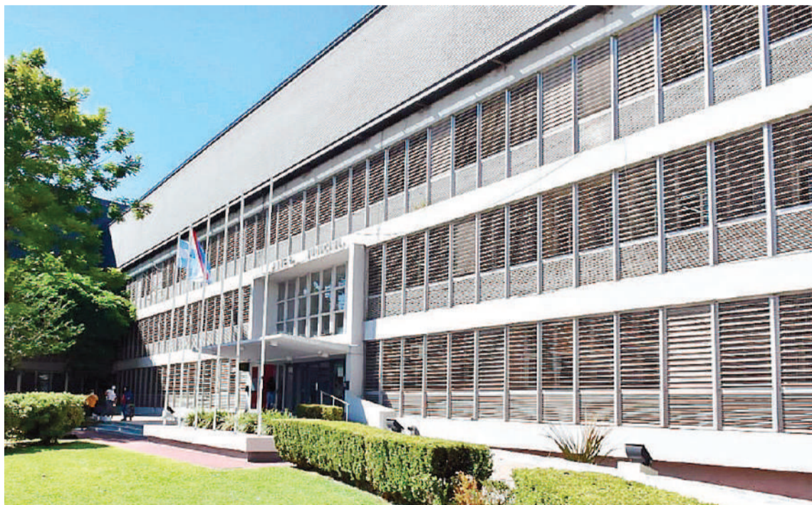
Los funcionarios y particulares vinculados a contrataciones del Estado provincial fueron juzgados entre 2021 y 2022.

El ex gobernador fue condenado a ocho años de prisión en el marco del megajuicio por corrupción. Además solicitaron la inmediata detención del exministro de Cultura, Pedro Báez, para que sea derivado a la Unidad Penal número 1 de Paraná.