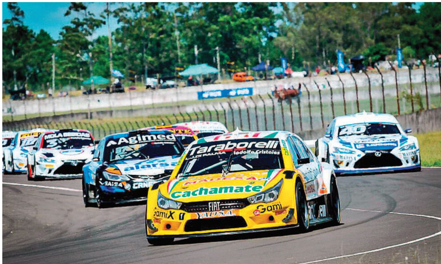
Con vastas expectativas, el Top Race comenzará a girar este sábado en el circuito ubicado en Sauce Montrull.

Dará comienzo este sábado en el autódromo Ciudad de Paraná, con tandas de entrenamientos y clasificación, la tercera fecha del Top Race. Mañana será la final.