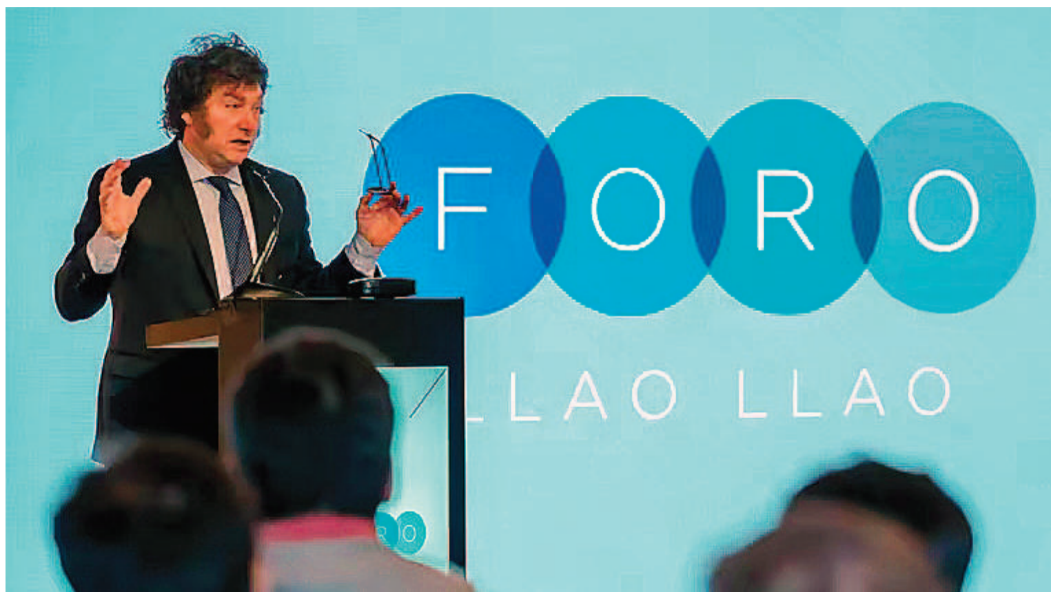
Milei habló durante más de una hora ante el círculo rojo, que apoyó su discurso.

“No me voy a conformar con ser como Alemania, quiero una profunda revolución liberal”, dijo en su discurso. El presidente habló poco más de una hora, no participó del almuerzo de cierre y anticipó su regreso a Buenos Aires.