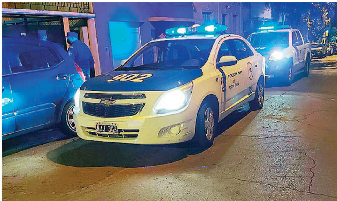
Funcionarios policiales investigan los posibles causantes del hecho.

“Estamos colaborando con el personal de la Comisaría 12º, para poder establecer lo que ocurrió”, resaltó el comisario y agregó que “el arma estaba entre las piernas de la víctima, por eso, se busca determinar si fue él quien realizó el dispa-