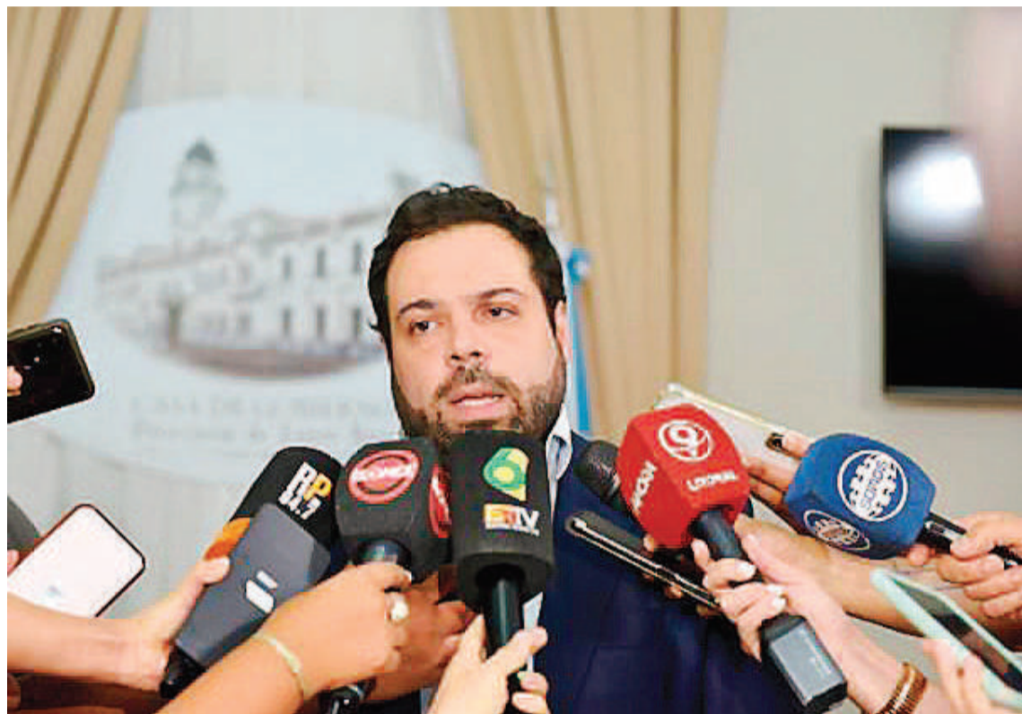
Las declaraciones de Troncoso generaron la respuesta de Agmer.

EN SANTA FE. El Gobierno de Santa Fe anunció este lunes la creación