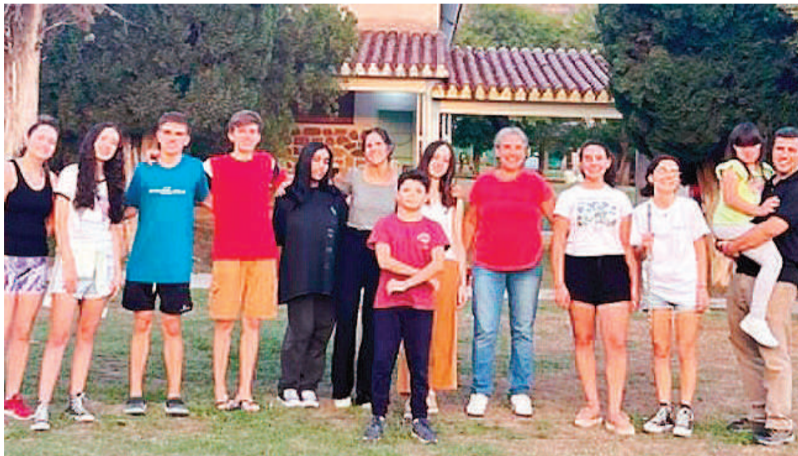
Integrantes de la orquesta junto a adultos que los acompañaron en un encuentro de formación realizado a fines de mayo en la provincia de Córdoba.

Redacción coordinacion@eldiario.com.ar EL DIARIO