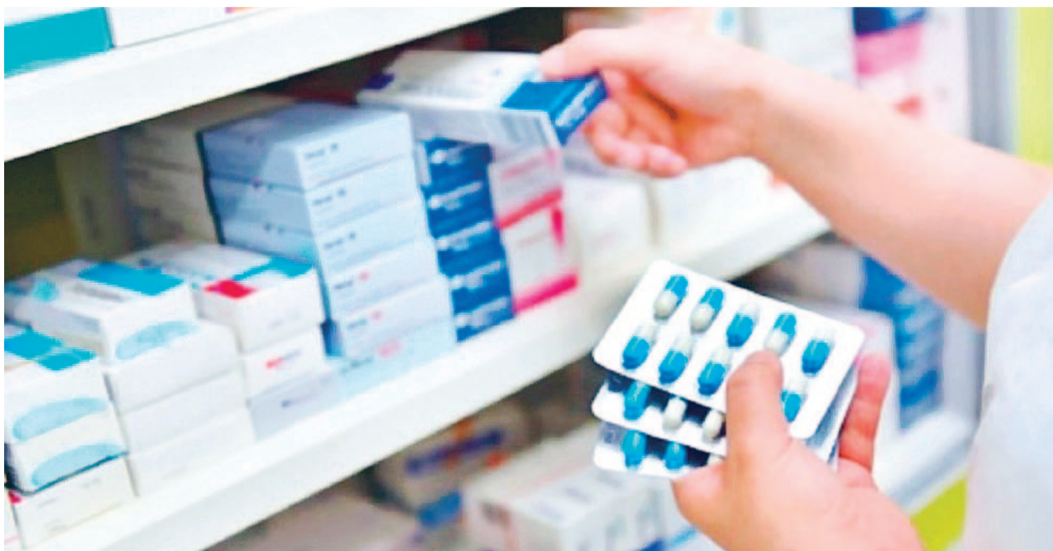
El Ministerio de Economía conversó a través de la Secretaría de Comercio con los principales actores del sector para lograr este compromiso.

“El sector farmacéutico de innovación es un importante motor de la economía del país. Es el número uno en inversión privada en investigación y desarrollo en la Argentina. En 2022 la inversión en I+D clínica superó los $75 mil millones de pesos corrientes, cifra que creció 149,5% en valores constantes desde el 2017. Dicha inversión representa el 42,5% del total de la inversión privada realizada en I+D por