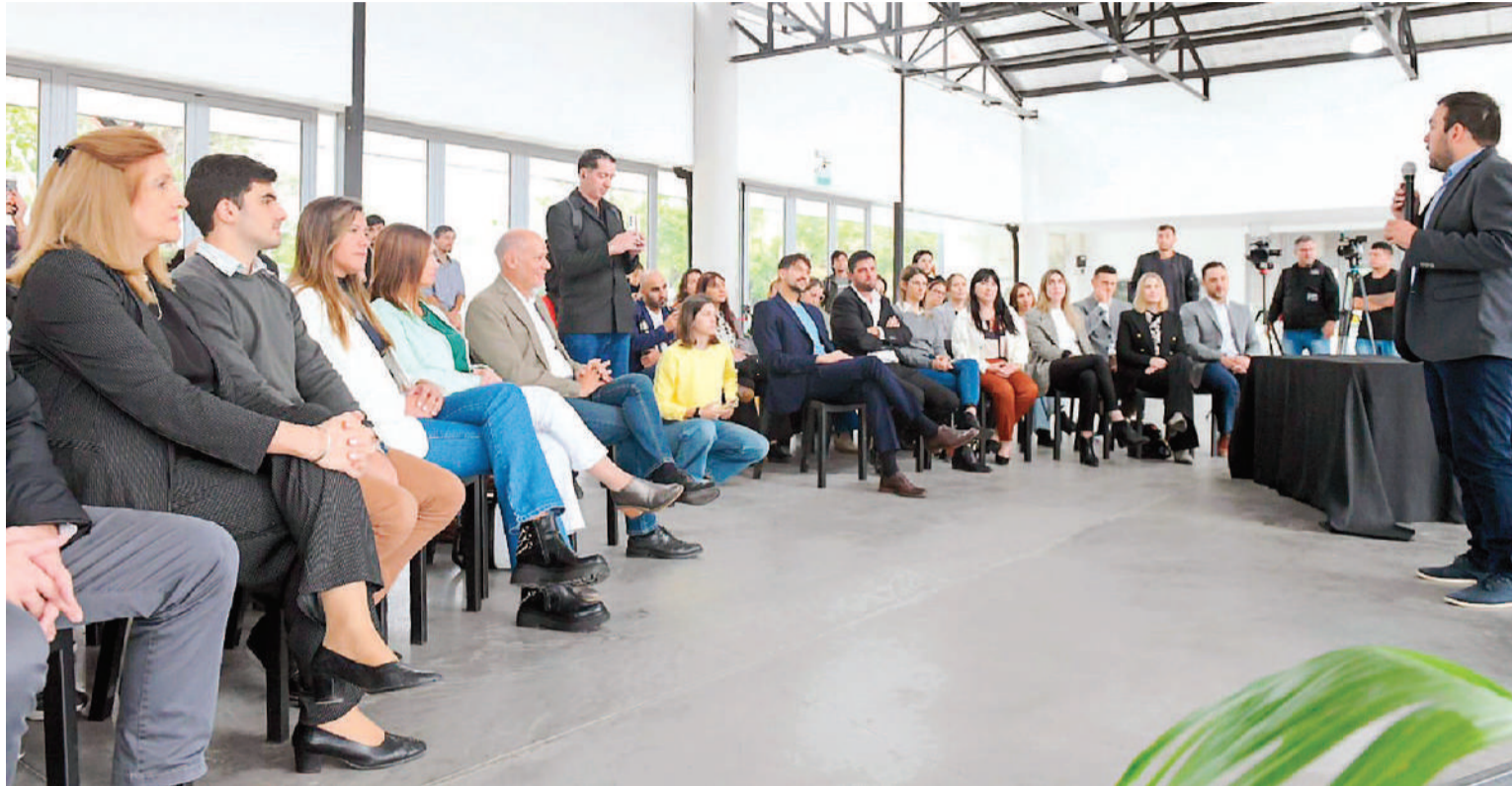
Se intensifica el apoyo a jóvenes emprendedores.