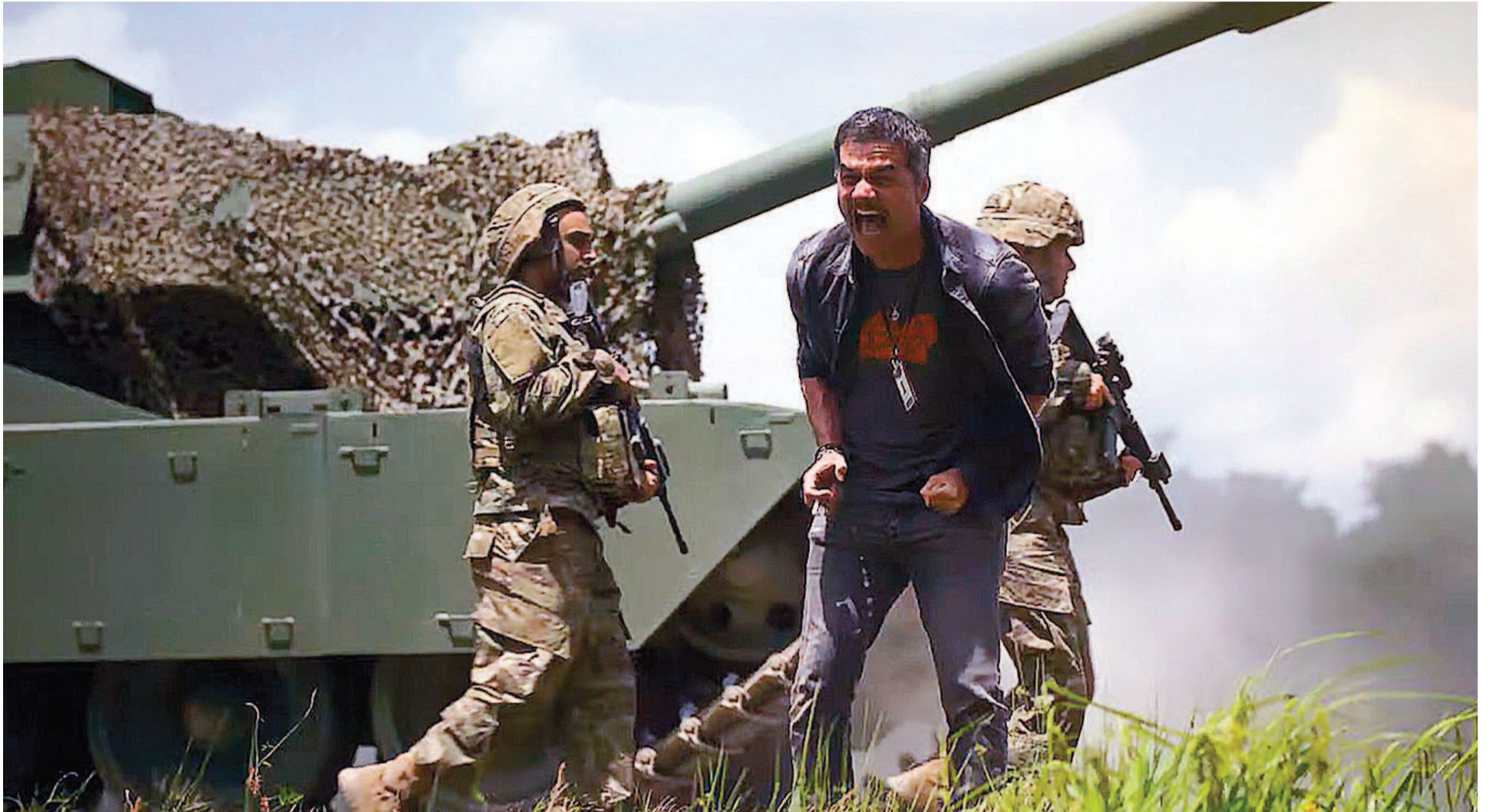
"Guerra Civil", diariamente en cine Círculo y Sunstar.