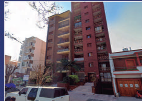
ANDRÉS PAZOS 367 FRENTE A PZA. DEL BOMBERO

Cocina con sector de lavadero, living comedor, 3 dormitorios con placares, baño. Listo para escriturar. USD 60.000