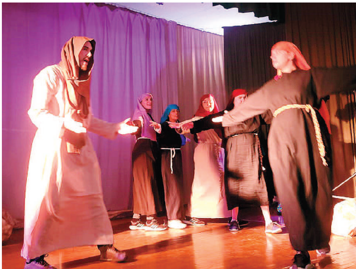
El Centro de Día Don Uva de Paraná viajará a Buenos Aires para presentar la obra de teatro “Luz del mundo”.

LUZ DEL MUNDO. Por su parte, “Luz del Mundo” la obra que representará el elenco paranaense ofrece una experiencia teatral úni-