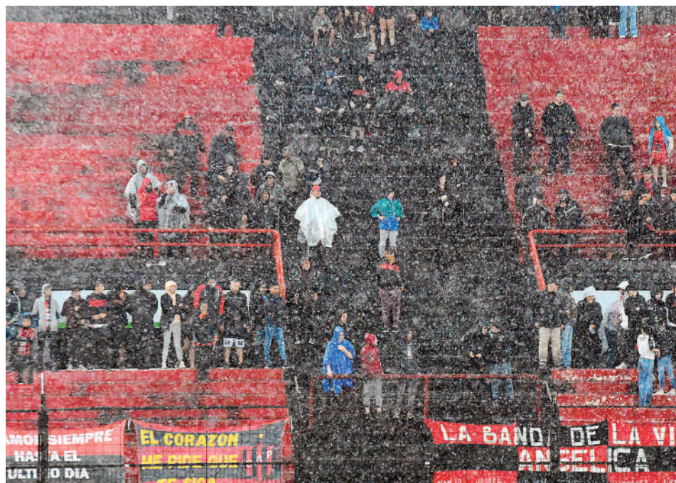
La cortina de agua fue constante. Aquí mostrando de fondo la tribuna de calle San Nicolás, donde la gente buscó refugiarse de la intensa lluvia debajo de las graderías.