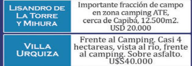
LISANDRO DE LA TORRE Y MIHURA

Lote de 300 m2, 10 x 30. En esquina, sobre asfalto, cimientos. Agua y Luz en la zona. USD 13.000