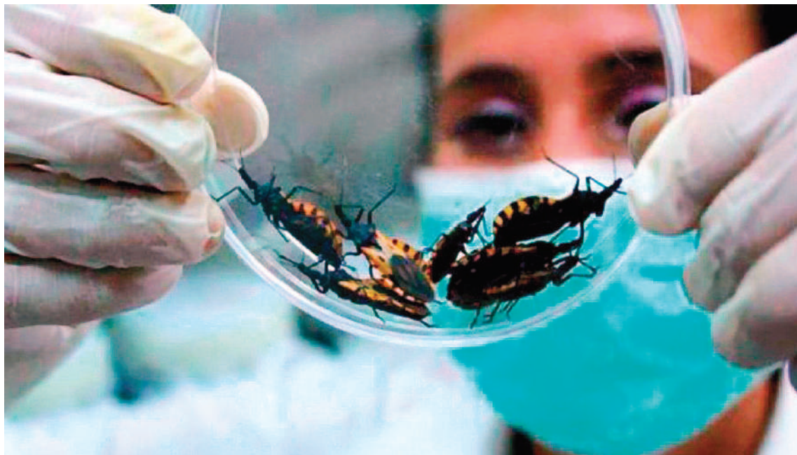
El Chagas es una patología que tiene un período asintomático que brinda una ventana de oportunidad, porque en ese momento se puede realizar el tratamiento para llegar a una cura.

Los esfuerzos de organismos internacionales como la OMS, la Organización Panamericana de la Salud