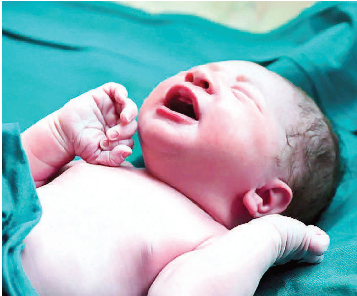
La OPS estima que alrededor de 8 mil bebés nacen con Chagas cada año en la región.