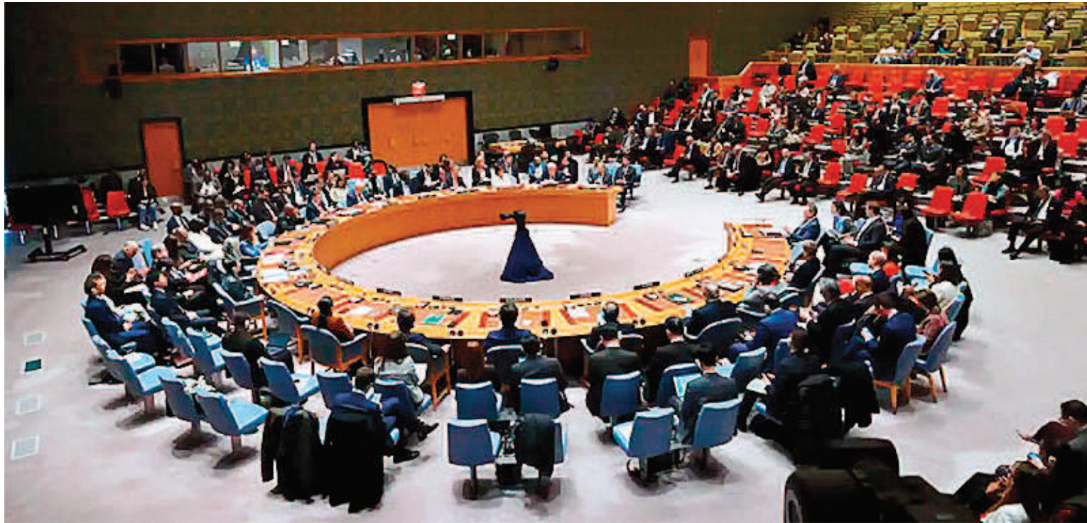
El Consejo de Seguridad de la ONU se reunió ayer de urgencia.

► “EL MUNDO NO SE PUEDE PERMITIR MÁS GUERRA”, DIJO EL TITULAR DEL ORGANISMO INTERNACIONAL