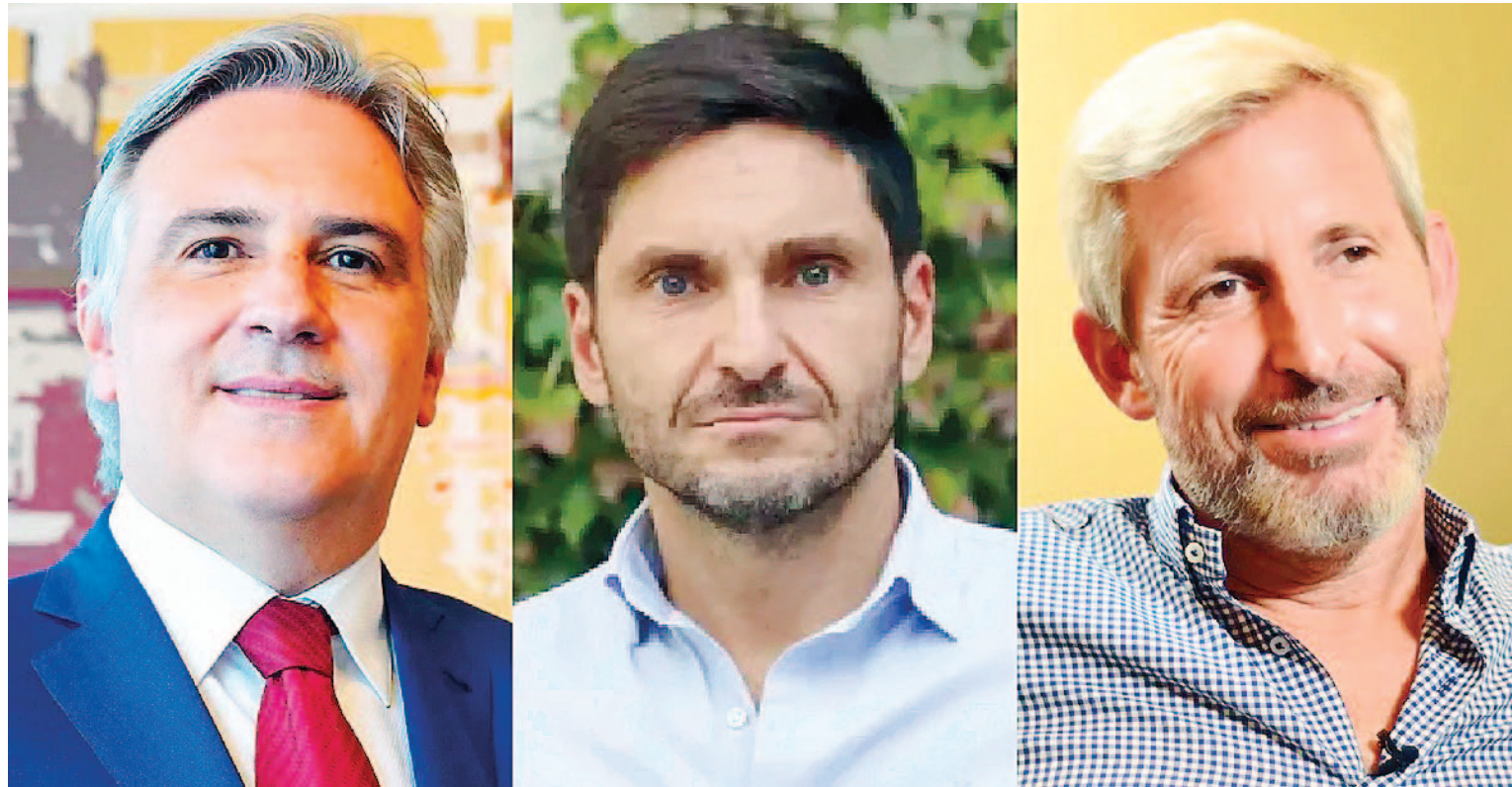
Los gobernadores de la Región Centro se reunirán mañana en Paraná.

► LOS GOBERNADORES ENVÍAN UNA SEÑAL DE UNIDAD ANTE EL GOBIERNO