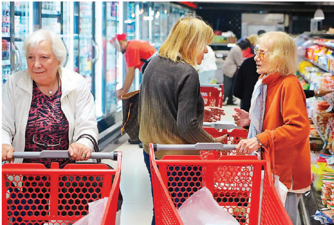
Las expectativas transmitidas por el Gobierno apuntan al dígito de inflación en abril. Hay dudas entre las consultoras.

Desde la consultora de Orlando Ferreres, el economista Fausto Spotorno indicó que la inflación será de entre 10 y 11 por ciento dependiendo de cómo se imputen las tarifas de gas y de agua que aumentan en abril.