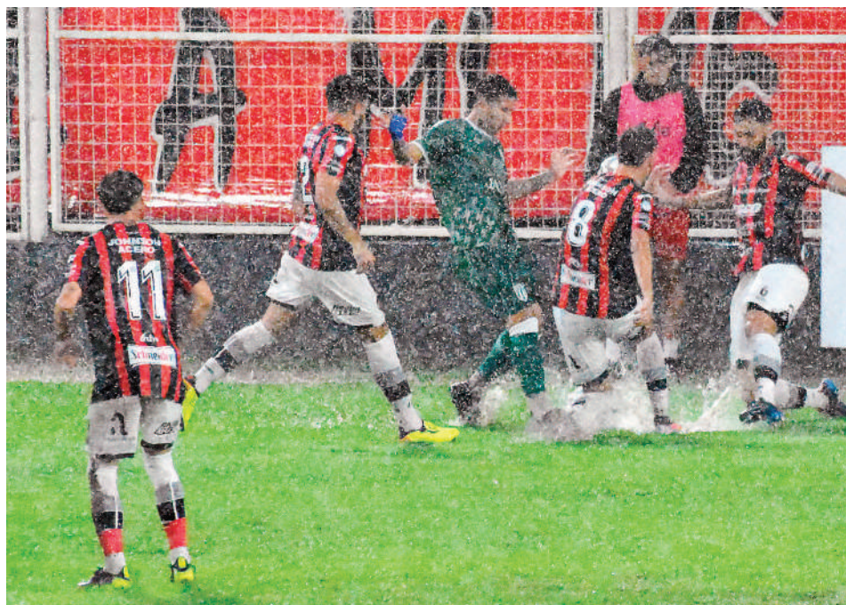
La disputa del balón se hacía casi imposible en algunos sectores de la cancha, donde los jugadores aparecían solos, sin resistencia y de todas formas perdían la pelota.