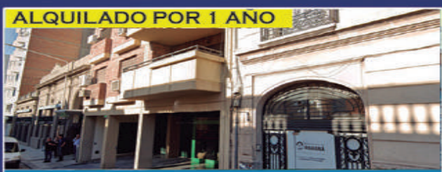
ALQUILADO POR 1 AÑO

Living comedor, cocina con sector de lavadero, 2 dormitorios con placares, baño, espacio de estacionamiento. USD 50.000