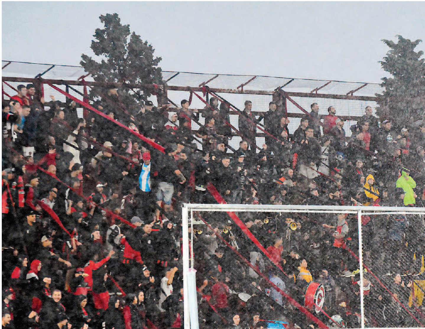
En la cabecera de calle Grella, la parte más bullanguera de la hinchada de Patronato dijo presente, con sus instrumentos musicales y con sus banderas.