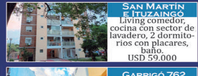
SAN MARTÍN E ITUZAINGÓ

PB: Living, recibidor, patio, comedor diario, coc-com, escritorio o dorm, garage, lavadero, fondo c/ parrilla PA: 3 dorm, uno en suite con vestidor, balcón con rejas y baño. USD 139.000