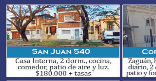
SAN JUAN 540

Casa Interna, 2 dorm., cocina, comedor, patio de aire y luz. $180.000 + tasas