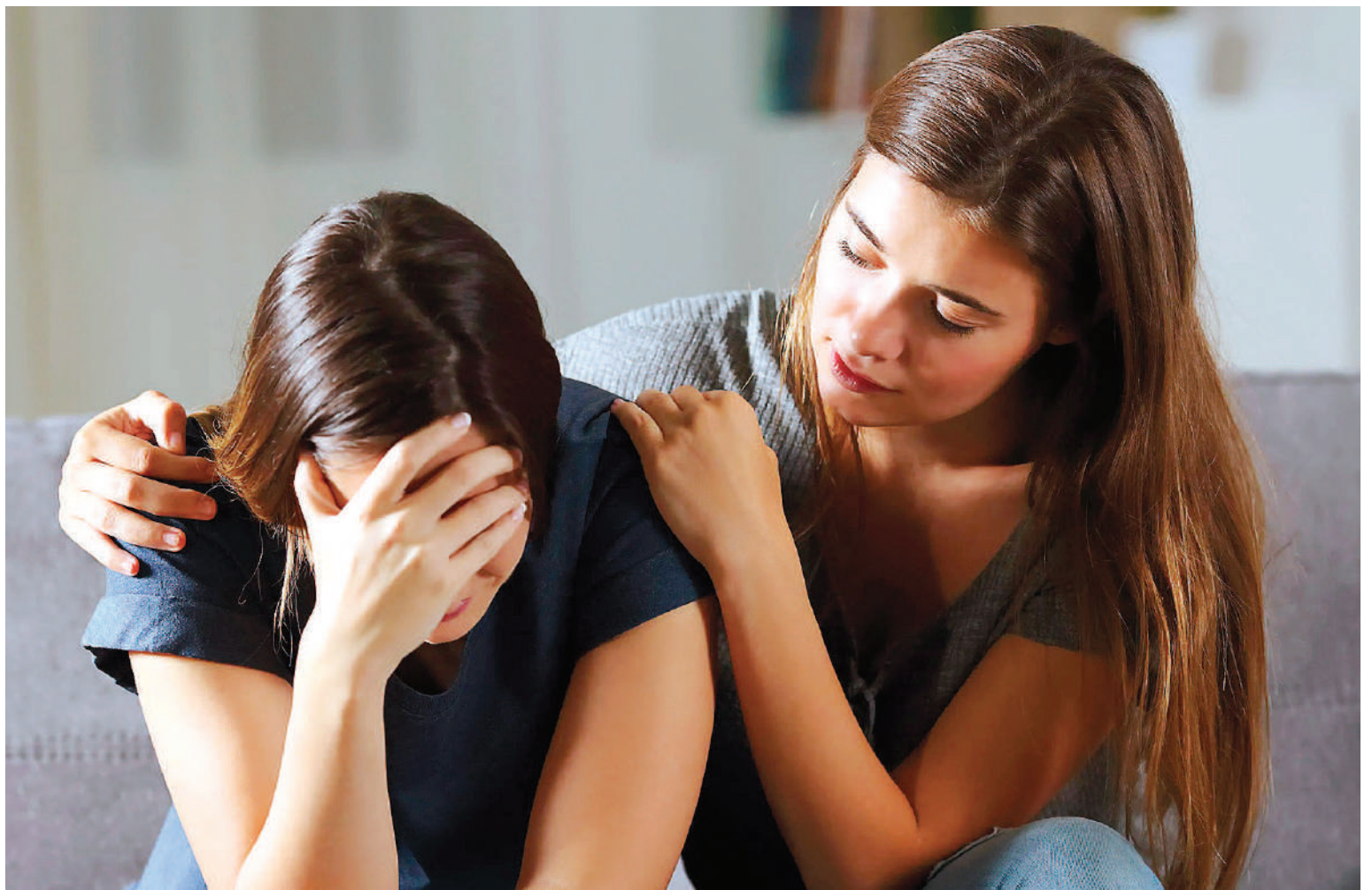
La Organización Mundial de la Salud estima que al menos 280 millones padecen de depresión, un 18 % más que hace una década.

La médica dijo que muchos autores hablan de cierta superficialidad en los vínculos de las nuevas generaciones: "Lo que estamos viendo, según algunos estudios, es lo que llamamos desde la salud mental, mayor predominio de apegos inseguros, que hacen