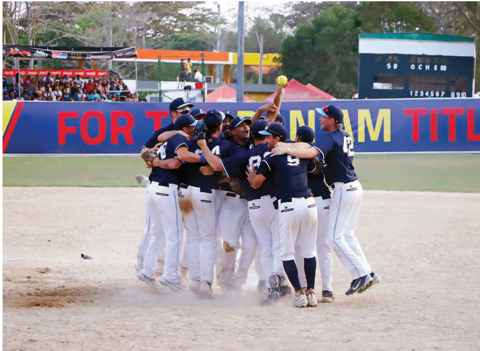
El softbol argentino continúa de parabienes con la selección nacional mayor, que logró ayer un nuevo campeonato panamericano.