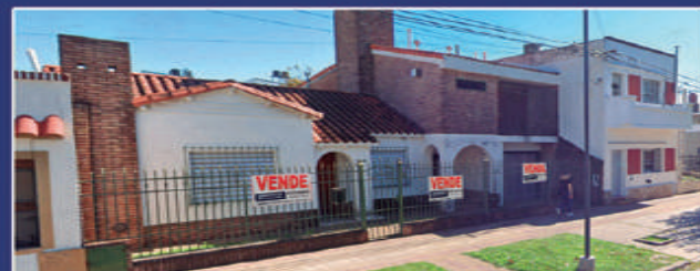
RUPERTO PEREZ 358

Casa sobre Nogoyá de 3 dormitorios, living comedor, cocina comedor, cochera, galpón, depósitos, 2 patios. Sobre calle Zuviria: ingreso por pasillo, 2 galpones y fondo. Sup total 621 m2. USD 95.000