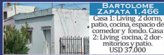
BARTOLOME ZAPATA 1.466

Living comedor, cocina, 2 dormitorios, baño, patio de luz y fondo, cochera descubierta. Gas env. 11,30x40. USD 40.000