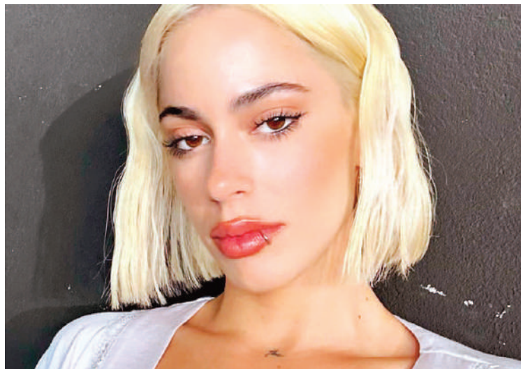
Tini Stoessel habló sobre su salud mental y afirmó que tiene depresión.

Para poder establecer el diagnóstico de Episodio Depresivo Mayor, es necesario que al menos cinco de estos síntomas estén presentes durante un período mínimo de dos semanas.