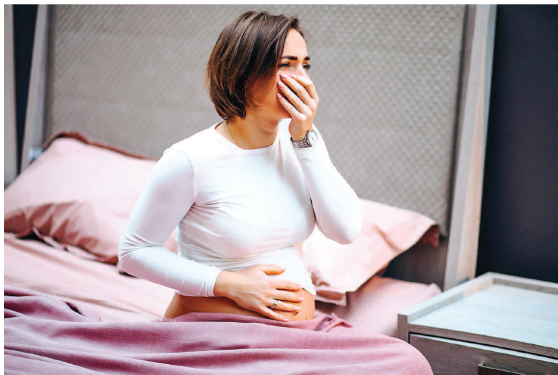
El Chagas es una enfermedad que suele ser asintomática que debe ser detectada antes o durante el embarazo.

Son muchos los actores que pueden y deben participar para asegurar el diagnóstico temprano, el tratamiento equitativo y el seguimiento de todos los pacientes con la enfermedad de Chagas. Visibilizar y romper el silencio para que toda la sociedad civil tenga conocimiento de que aún en 2024, 9.000 bebés en el mundo nacen con la enfermedad.