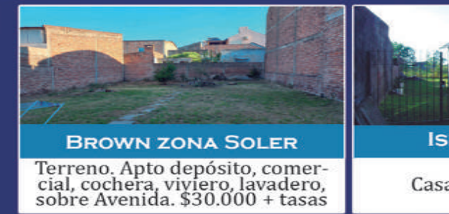
BROWN ZONA SOLER

Living com., cocina, dorm c/placard, cochera cubierta. $190.000+tasas+ Exp. $230.000 c/ cochera