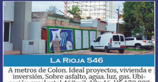
LA RIOJA 546

Campo de casi 8 hectáreas c/casa de campo a reciclar, trifásica y agua corriente. U$S 79.000