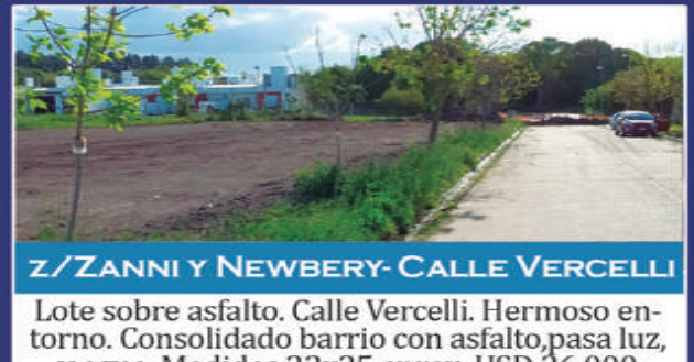
Z/ZANNI Y NEWBERY-CALLE VERCELLI

A metros de Colon. Ideal proyectos, vivienda e inversión. Sobre asfalto, agua, luz, gas. Ubicación excelente! 460m2. 10x 46. U$ 170.000