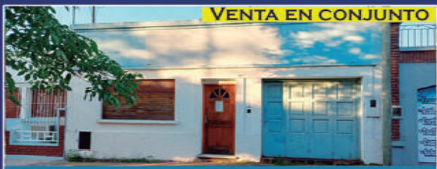
VENTA EN CONJUNTO

Osinalde esq. Panamá. 2 casas independientes. 1º casa: 1 dorm, living, cocina comedor, patio. 2º casa: 3 dorm, cocina comedor, ambas tienen jardín y cochera. USD 120.000