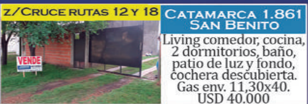
Z/CRUCE RUTAS 12 Y 18 CATAMARCA 1.861 SAN BENITO

Living, coc-comedor, patio al frente, cochera, patio trasero, lavadero, 2 dorm, baño. Depto de 1 dorm. USD 69.000