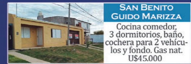
SAN BENITO GUIDO MARIZZA

Casa 1: Living 2 dorm, patio, cocina, espacio de comedor y fondo. Casa 2: Living cocina, 2 dormitorios y patio. USD 37.000