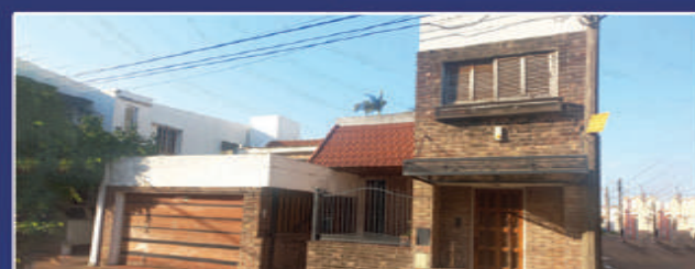
ROSARIO DEL TALA 441

Departamento en microcentro. Living, comedor diario, cocina, 3 dormitorios con placares, 2 baños, amplio balcón. Metros Totales 97,61. USD 180.000