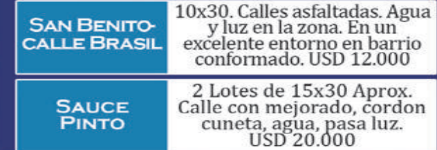
SAN BENITO-CALLE BRASIL

Lote sobre asfalto. Calle Vercelli. Hermoso entorno. Consolidado barrio con asfalto, pasa luz, y agua. Medidas 22x25 aprox. USD 26.000