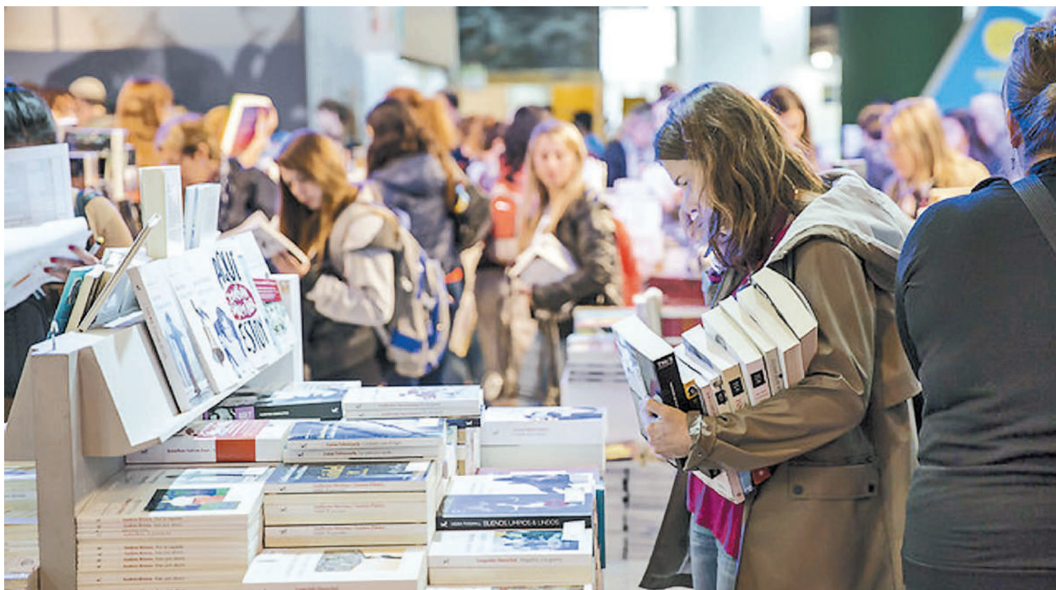
En un marco de fuerte restricción, los organizadores de la Feria del Libro apuestan a seguir convocando lectores a pesar de la crisis económica que vive el país.

12 años, jubilados y docentes entran gratis presentando sus credenciales.