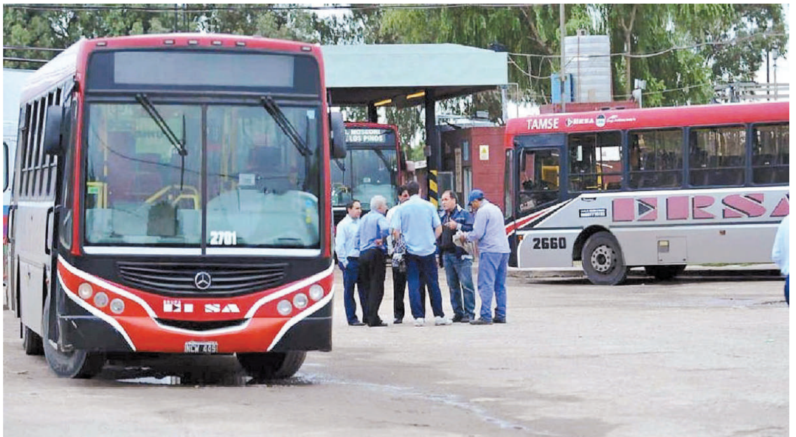
Ayer tampoco circularon los colectivos en el Área Metropolitana. Los empresarios aseguran que la actualización tarifaria no fue suficiente para afrontar la estructura de costos.

ron que mantendrán la medida de fuerza por tiempo indeterminado, hasta tanto se efectúe el pago de los salarios de manera completa.