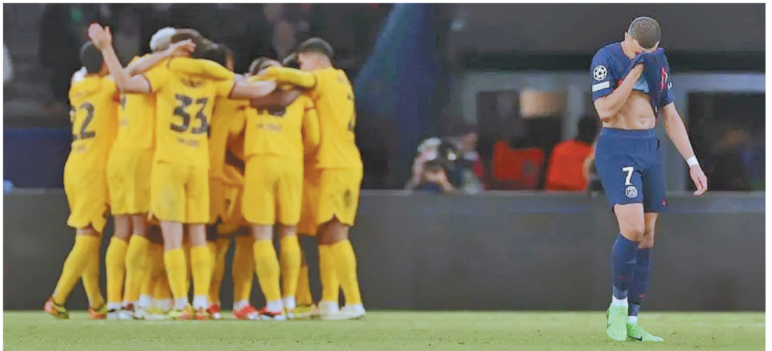
Los jugadores del Barcelona festejan de fondo, mientras el crack francés Kylian Mbappé camina resignado rumbo al centro de la cancha.

El elenco de Xavi venció 3 a 2 al Paris Saint Germain, en el marco de los cuartos de final de ida, la máxima competencia europea. Raphinha (en dos ocasiones) y Andreas Christensen hicieron los tantos del ganador, mientras que Ousmane Dembélé y Vitinha hicieron los del equipo francés.