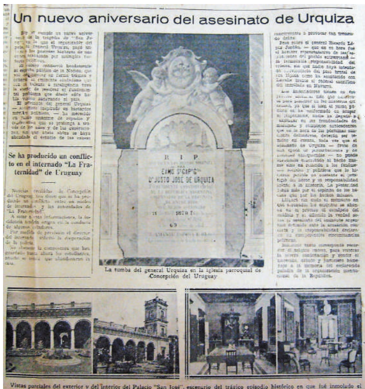
El recuerdo del asesinato de Urquiza en El Diario de Paraná del 11 de abril de 1933.

Otro de los factores que concurre a restar al organizador su popularidad, es su aceptación de participar en la guerra del Paraguay contrariando el sentimiento del pueblo entrerriano. Para Entre Ríos, Paraguay no era su enemigo. Su enemi-