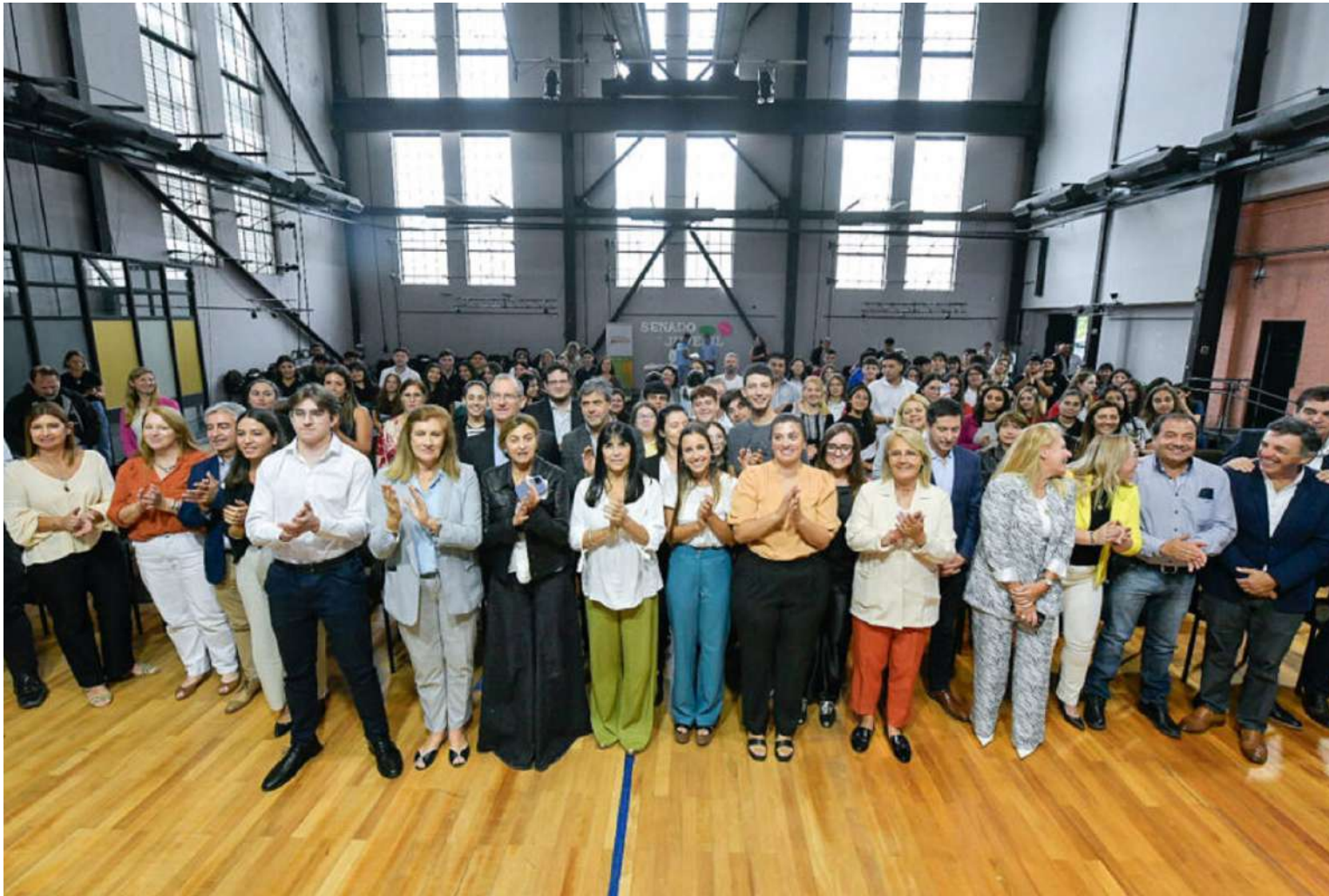
La actividad se realizó en el Centro Cultural y de Convenciones La Vieja Usina.