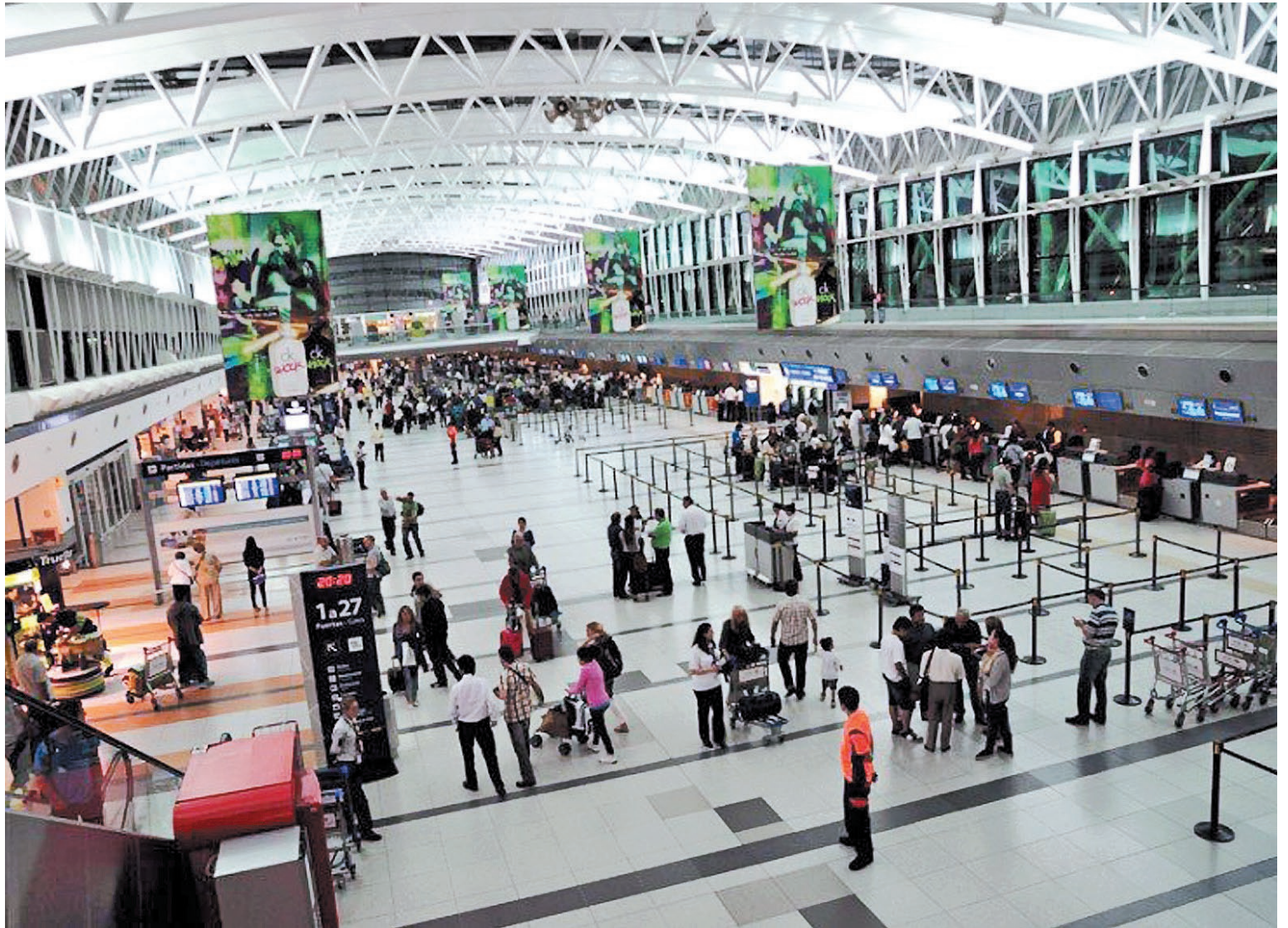
En el primer bimestre del año llegaron al país 1.555.300 turistas extranjeros.

El 65,2% del turismo receptivo provino de países limítrofes; los principales fueron: Chile, que aportó 30,6%; Brasil, 14,0%; y Uruguay, 12,5%. Además, el 51,4% de