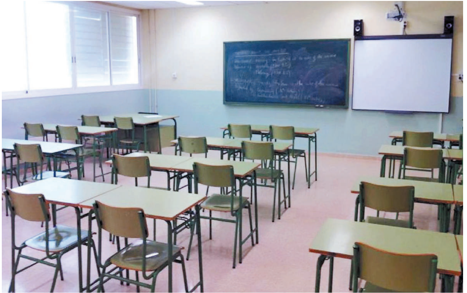
Las aulas de las escuelas entrerrianas volvieron a estar vacías.

ciones, manifestando una vez más, nuestra inquebrantable voluntad de diálogo, pero también con firmeza en nuestros justos reclamos y definiciones gremiales. Para nosotras y nosotros, las necesidades y urgencias de la docencia no son un juego, tampoco entran las especulaciones y dilaciones. Así que concurrirémos el 16/04, con la expectativa clara de que la patronal lleve una propuesta salarial que mejore los salarios de nuestras y nuestros compañeros en la provincia”.