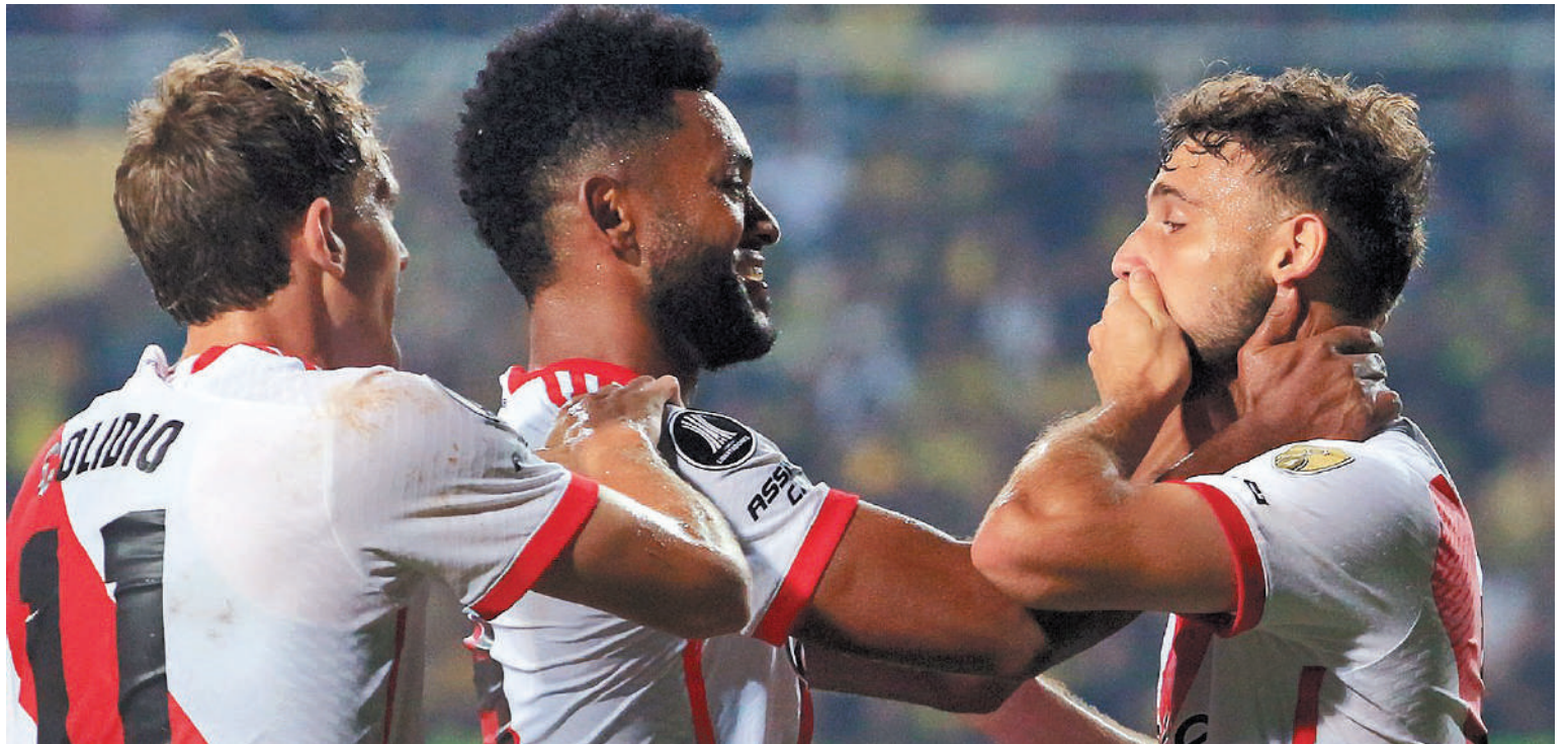
El elenco Millonario viene de vencer al Deportivo Táchira como visitante y esta noche busca una nueva victoria, pero en condición de local.

quema con tres volantes ofensivos y un solo contención, similar al que paró en el Superclásico. Esequiel Barco y Nacho Fernández son los que volverían a la titularidad.