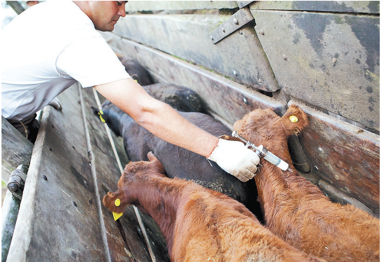
En cuanto a quiénes concierne la medida, el funcionario dijo que “este es un beneficio para 200.000 productores ganaderos.”

Según pudo saber Infobae de fuentes de Biogénesis Bagó, desde la compañía tomaron conocimiento de lo dicho por el vocero del Presidente, pero desconocían si existía, en paralelo, una resolución del SENASA. En una reunión de técnicos de ese organismo con directivos del laboratorio manteni-