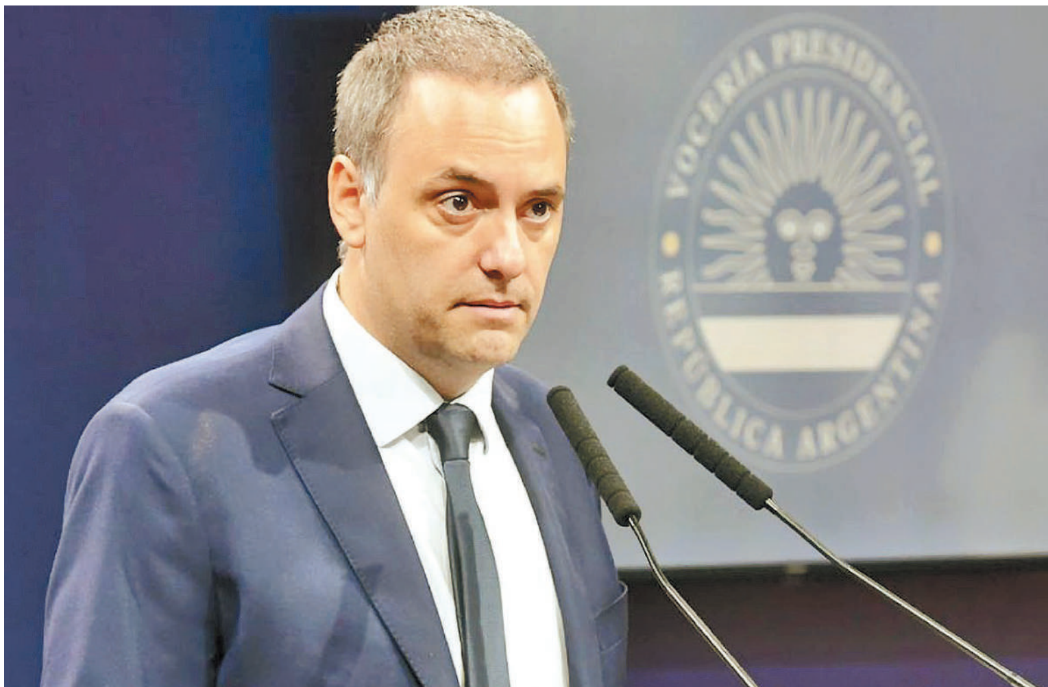
“Queremos que la gente tenga las mejores alternativas y calidad en bienes y servicio”, explicó el vocero presidencial en la conferencia de prensa.

Durante el anuncio en Casa Rosada, el portavoz dejó entrever que