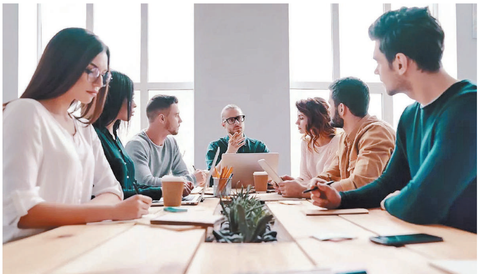
La Organización Mundial de la Salud estima que el 15% de los adultos en edad laboral padecen un trastorno mental, entre ellos, la depresión y la ansiedad.

La OMS estima que el 15% de los adultos que tienen empleo padecen un trastorno psicológico en algún momento de sus carreras. Los expertos explicaron cómo prevenirlos y favorecer un entorno saludable en el trabajo.