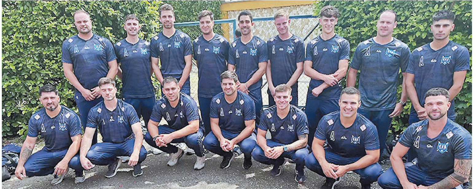
El calendario del representativo nacional continuará mañana con dos juegos, ante Cuba y República Dominicana. Para cerrar esta fase de grupos, actuará el sábado con Panamá.

CALENDARIO. La agenda de partidos para la albiceleste continuó anoche, tras el cierre de esta edición. El partido fue contra el local