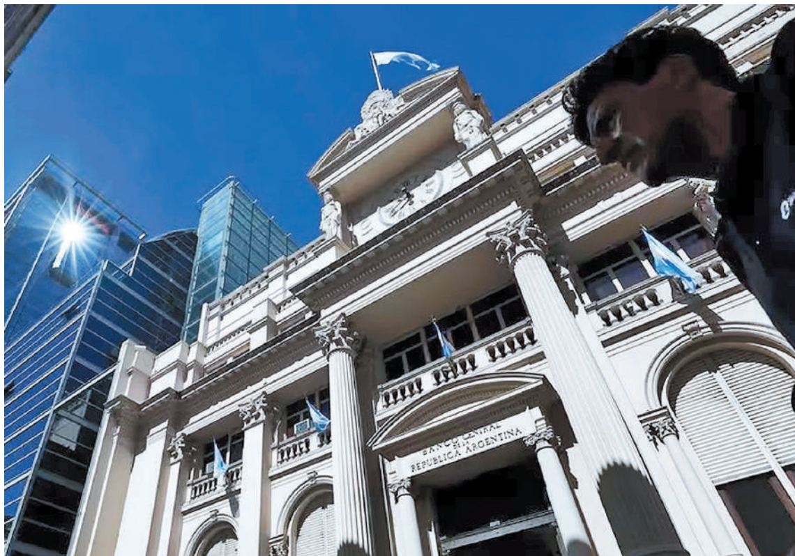
El Banco Central ultima detalles para el lanzamiento de los billetes con los nuevos valores.

Los funcionarios confirmaron que ambos billetes serán fabricados en el exterior. "La puesta en marcha de un billete es un proceso muy largo, por eso nos montamos con un proceso que ya estaba vigente desde la gestión anterior porque de lo contrario no hubiéramos llegado con los tiempos que necesitábamos", señalaron. La llegada de los nuevos billetes servirá para cubrir la demanda estacional coincidente con el pago de los aguinaldos y las vacaciones de