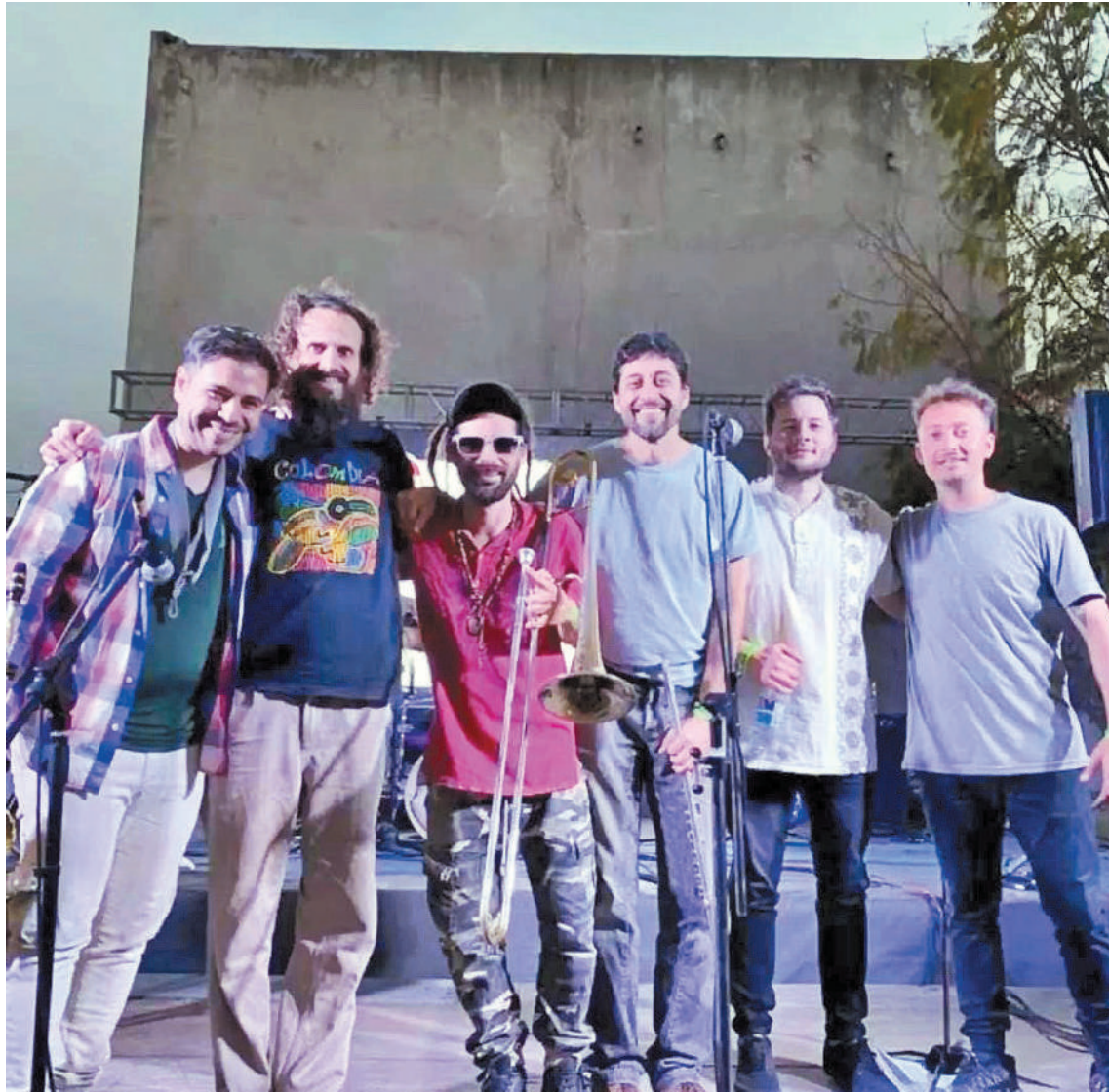
El grupo Cuero al Viento se presenta el sábado en la Casa de la Cultura.

Espacio de encuentro y fomento de la danza litoraleña, este jueves a las 20, en La Vieja Usina, Gregoria Matorras 861. Entrada voluntaria: costo clase $2000. Reservas al 3435189449.