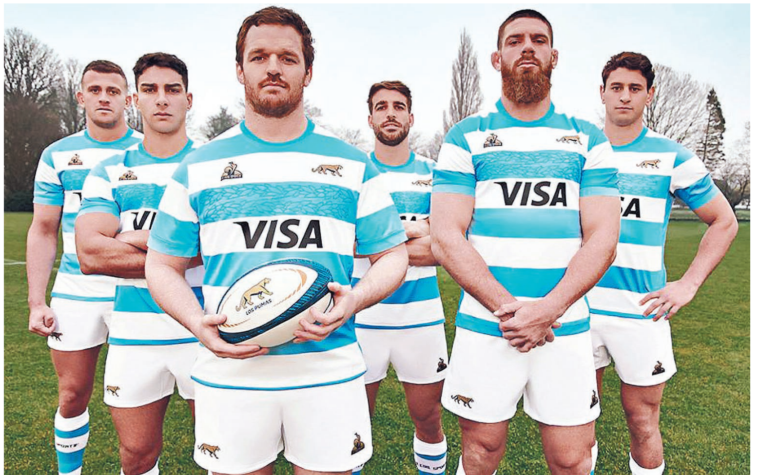
Gran expectativa en la localidad santafesina y alrededores por el evento internacional que reunirá a los amantes del rugby en el Brigadier López.

El seleccionado argentino será anfitrión ante Australia por la cuarta fecha del certamen internacional. La expectante cita está pautada para el 7 de septiembre en el estadio de Colón. El último antecedente, fue derrota del conjunto nacional, en aquella oportunidad ante Gales.