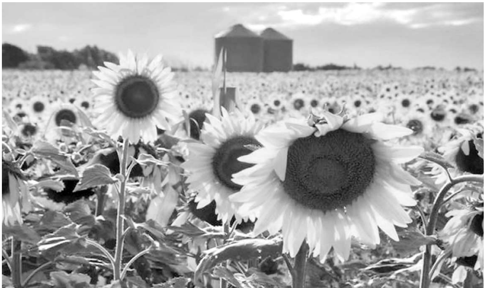
La producción total de girasol en la provincia fue de 7.725 toneladas.