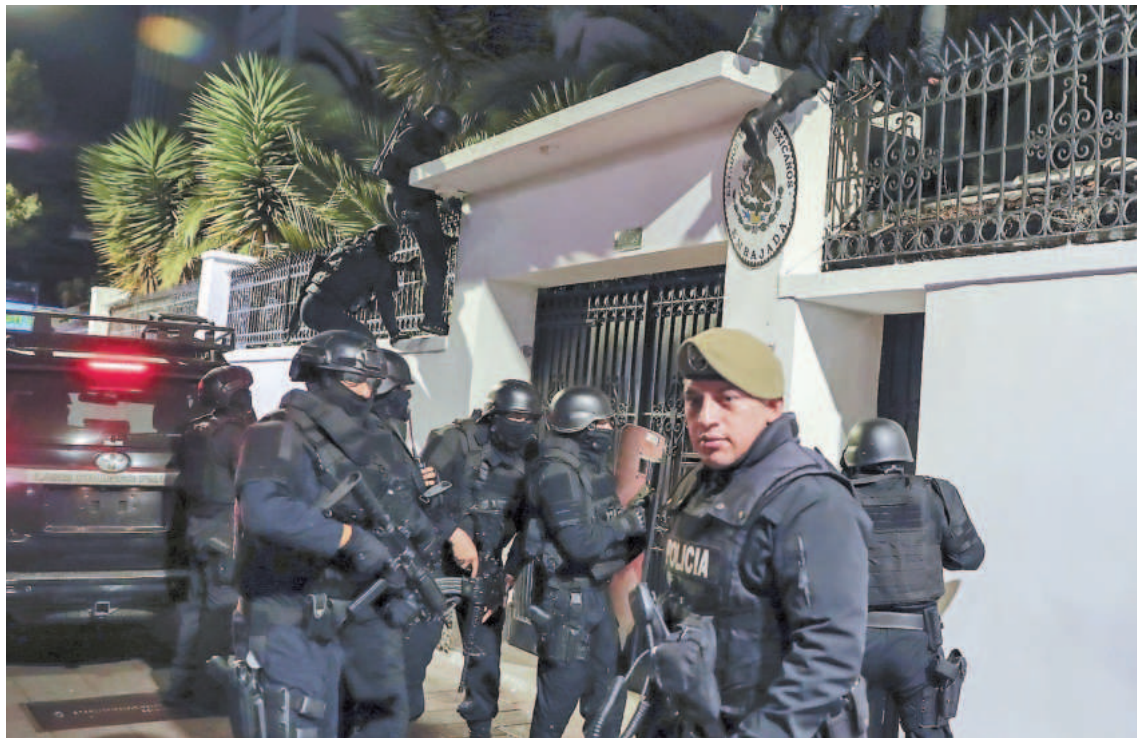
Las fuerzas policiales irrumpieron en la Embajada mexicana en el territorio ecuatoriano y se profundizó el conflicto entre los países latinoamericanos.

“Ante la flagrante violación de la Convención de Viena sobre Rela-