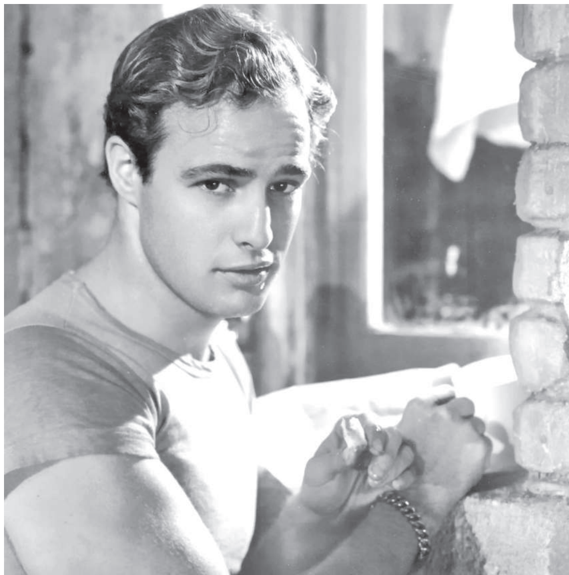
Marlon Brando, un genio que se hastió de su talento.

encia errática, fuera a Nueva York a estudiar interpretación, recalando en el Actors Studio.