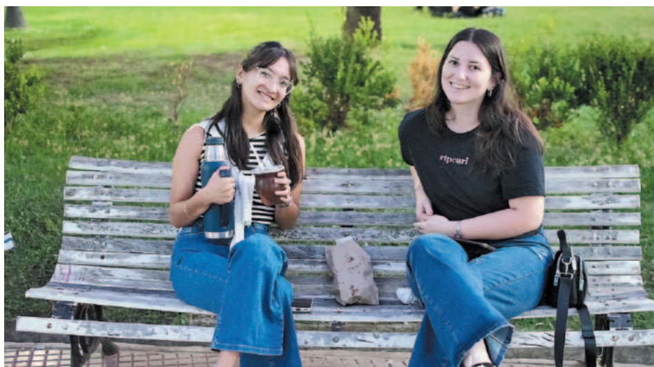
Para Agustina y Sofía, las tardes en la plaza Alvear son incomparables.