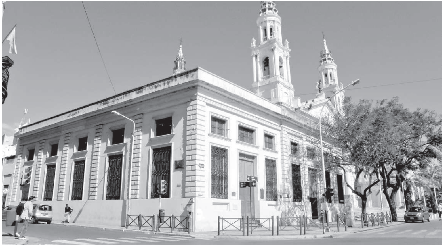
El Congreso Legislativo Federal tuvo como ámbito de sesiones el Senado de la Confederación, ubicado junto a la catedral. Allí se inició una vastísima y trascendente tarea legislativa.