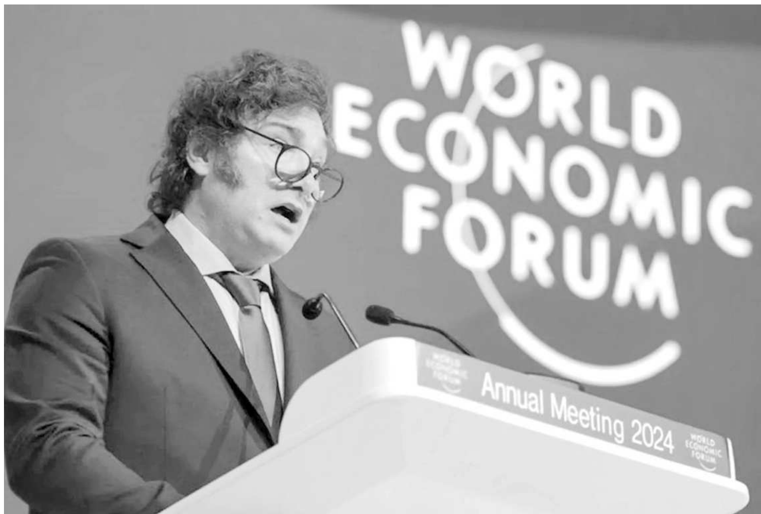
Para Lafferriere, la opción de Milei por el capital concentrado empobrecerá a la sociedad.

cursos, es tomada para pagar una deuda externa que es fraudulenta, que nunca recibió el pueblo argentino, que la pagamos más de diez veces y que, curiosamente, cada vez debemos más. Eso afecta negativamente la calidad de vida de la gente, en detrimento de las mayorías.