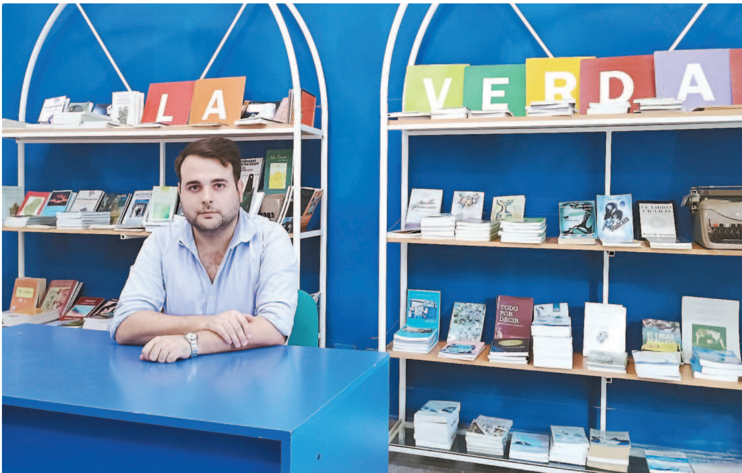
Para el funcionario, una de las claves de gestión es "lograr llegar a todo el territorio de la provincia".

trabajo, sentimiento de pertenencia. La verdad es que si la Biblioteca logra mantener 170 mil obras, y hacer todo el trabajo que desarrolla con incluso las limitaciones presupuestarias que existen, es gracias a los empleados. El personal es el activo más valioso con el que cuentan la BIPER y la EDER.