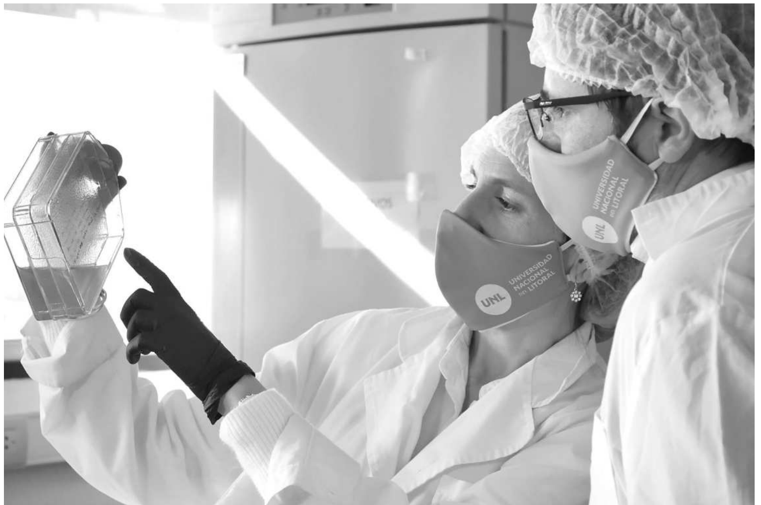
Israel, que es una potencia en desarrollo tecnológico, ponderó el trabajo de los investigadores argentinos.

“La primera inversión de 125.000 dólares fue propia y privada de los