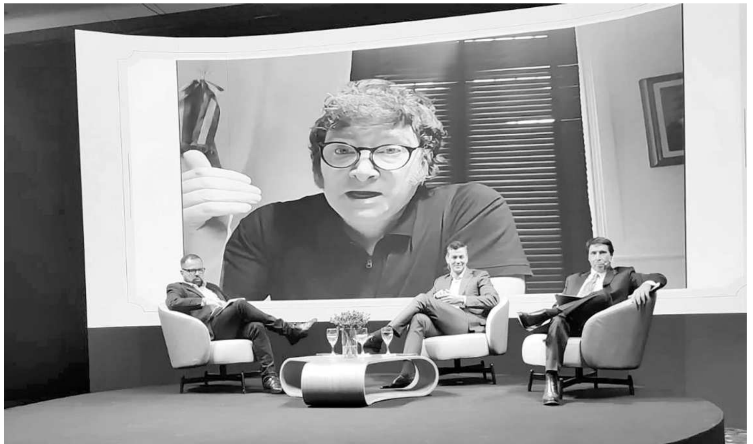
El presidente Javier Milei durante su aparición vía zoom en la presentación de un libro en Paraguay.

Además, el líder libertario se cruzó con un periodista al que acusó de insultarlo y faltarle el respeto.