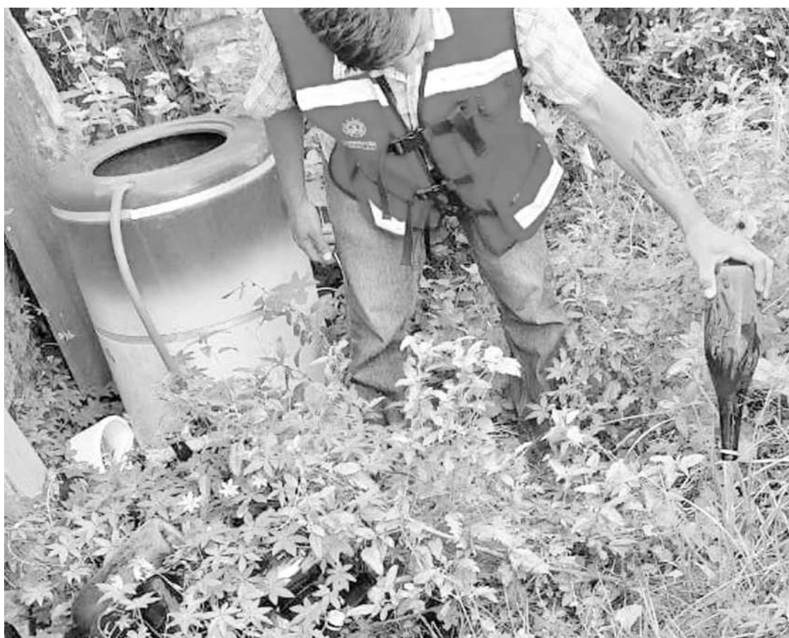
La descacharrización sigue siendo clave para combatir al Aedes Aegypti, conocido como "mosquito mascota", porque se aloja en los domicilios y no en lugares abiertos.

Sin embargo, aquellas personas con la enfermedad pero que presentan condiciones asociadas a embarazo, adultos mayores de 65 años, obesidad mórbida, hiper-