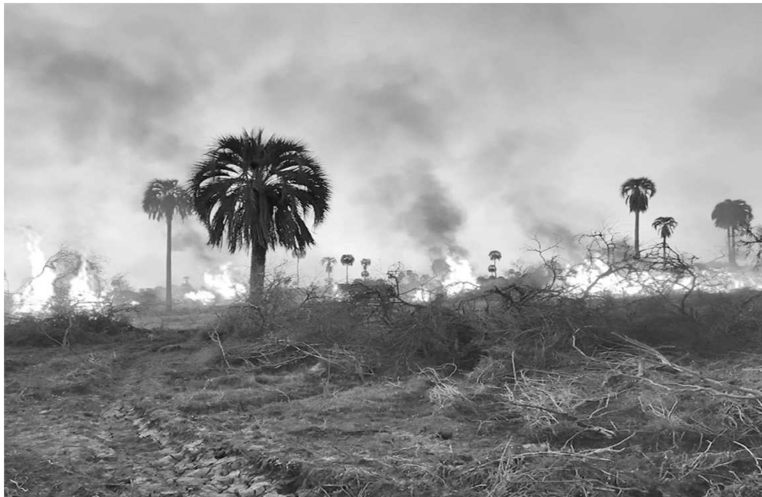
El fuego consumió gran parte de lo que iba a ser el área protegida Selva de Montiel, que se convertiría en el tercer parque nacional en nuestra provincia.

Según trascendió extraoficialmente, en la sede administrativa de la Coordinación de Bosques Nativos del Ministerio de Producción se acumulan presentaciones y ac-