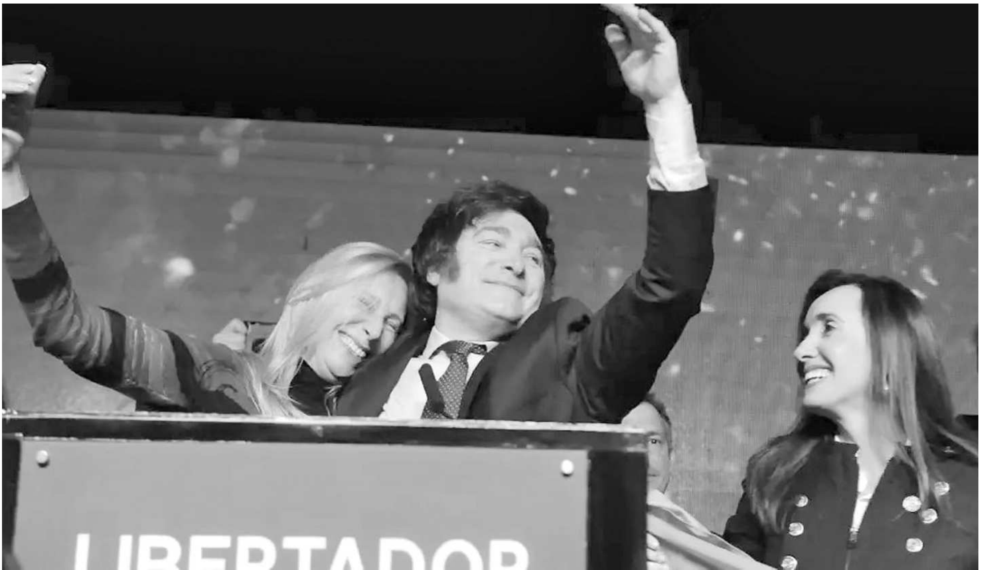
Los Milei y Victoria Villarruel, figuras clave en la estructura del actual gobierno.

tiene efecto multiplicador negativo sobre la actividad económica. Va a haber cada vez menos consumo y menos demanda, lo que achica las ventas y genera desempleo.