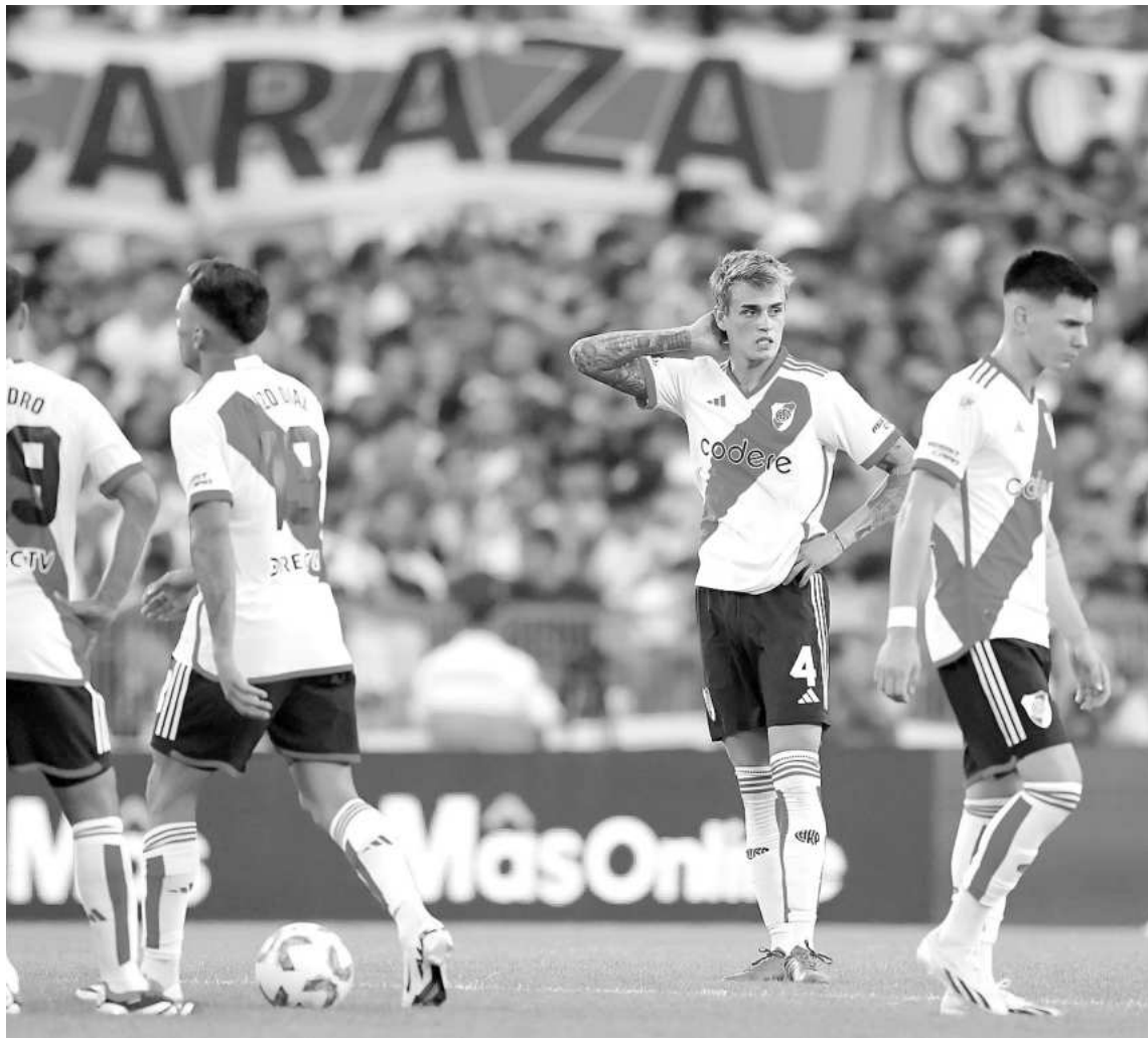
El plantel de River Plate sabe que está ante un partido clave para poder meter en los play off de la Copa de la Liga, cuando juegue ante su gente en el Más Monumental.

tral en el Gigante de Arroyito y perdieron una racha que podría haber sido histórica: 32 partidos sin caer de local. A pesar de ese duro revés, el Canalla también debutó en la Copa Libertadores con triunfo 1