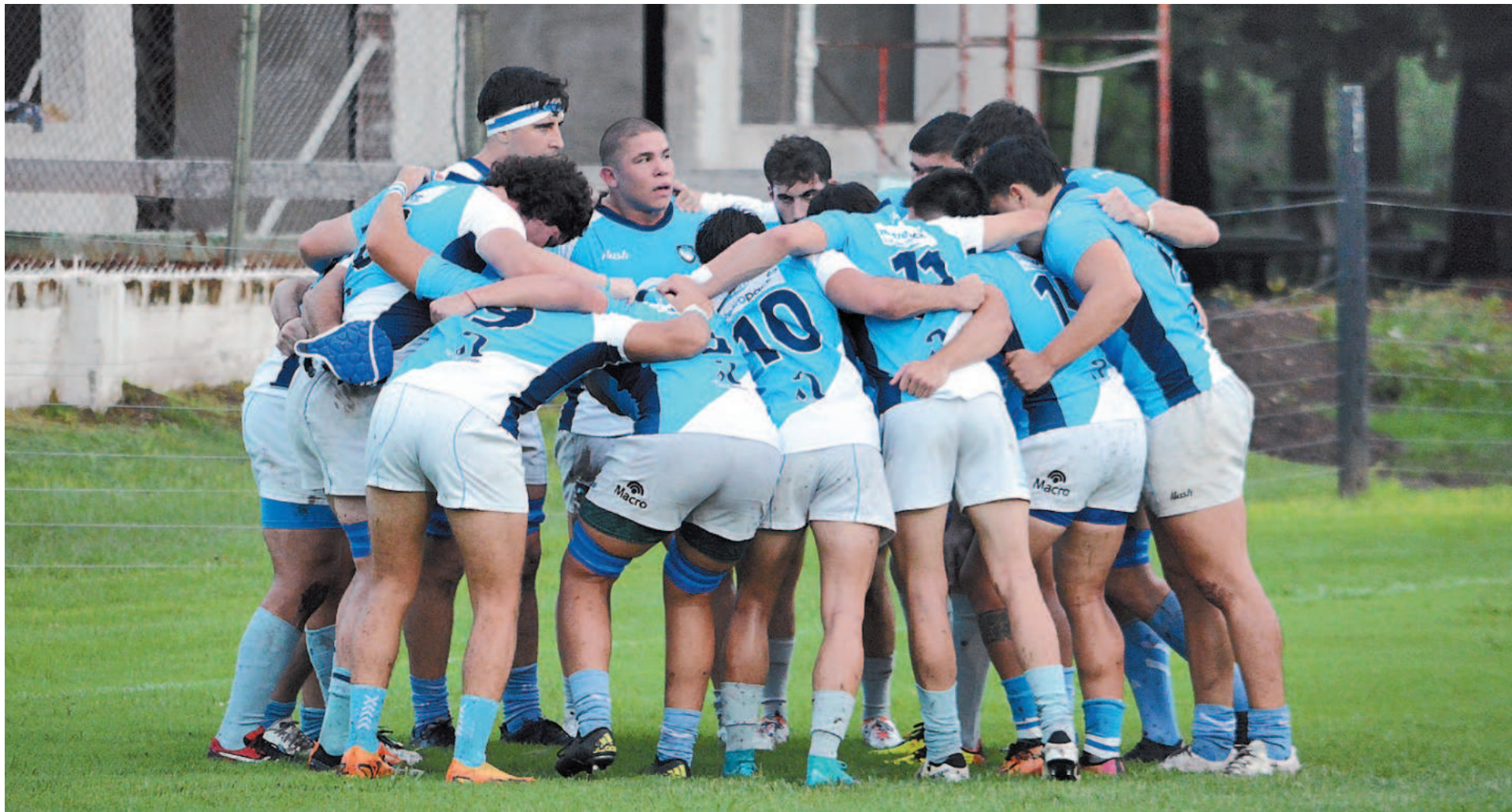
El Paraná Rowing Club registró ayer su primera victoria de la temporada, como visitante sobre Universitario de Rosario.

En el marco de la tercera fecha del Top 9 del Torneo Regional del Litoral, Rowing superó como visitante a Universitario de Rosario, 20-13. Estudiantes, en tanto, cayó fuera de casa ante CRAI, 19-15. En Segunda, Tilcara tuvo fecha libre.