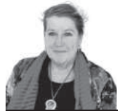
Griselda De Paoli Especial para EL DIARIO

La tarea encarada por los legisladores que integraron el primer Congreso Legislativo Federal, en la etapa de la Confederación Argentina fue titánica. Durante el primer período de sesiones, en 1854, se sancionaron 292 leyes.