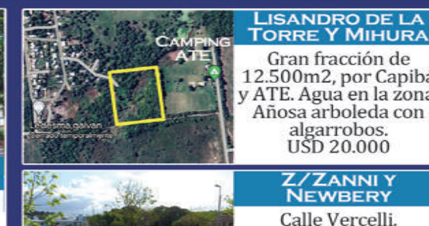
LISANDRO DE LA TORRE Y MIHURA

A metros de Colon. Ideal proyectos, vivienda e inversión. Sobre asfalto, agua, luz, gas. Ubicación excelente! 460m2. 10x 46. U$ 170.000