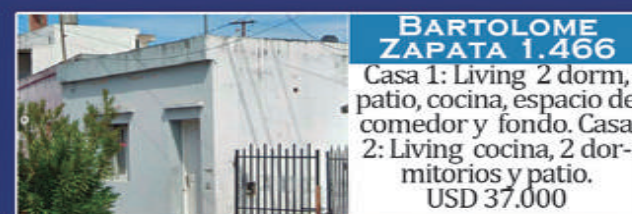
BARTOLOME ZAPATA 1.466

Living comedor, cocina, 2 dormitorios, baño, patio de luz y fondo, cochera descubierta. Gas env. 11,30x40. USD 40.000