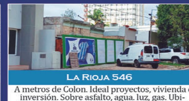
LA RIOJA 546

Campo de casi 8 hectáreas c/casa de campo a reciclar, trifásica y agua corriente. U$89.000