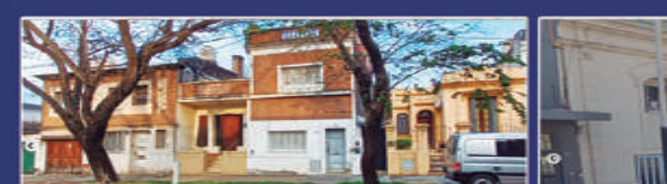
SAN JUAN 540

Casa Interna, 2 dorm., cocina, comedor, patio de aire y luz. $180.000 + tasas