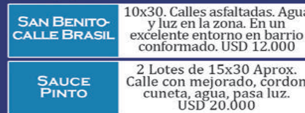
SAN BENITO- CALLE BRASIL

Calle Vercelli. Lote sobre asfalto. Calle Vercelli. Hermoso entorno. Consolidado barrio con asfalto, agua y luz. USD 26.000