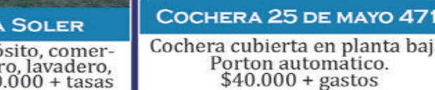
COCHERA 25 DE MAYO 471

Terreno. Apto depósito, comercial, cochera, vivero, lavadero, sobre Avenida. $30.000 + tasas