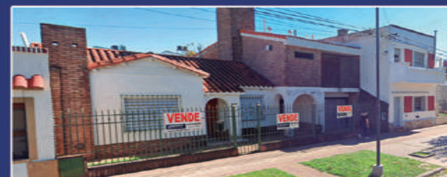
RUPERTO PEREZ 358

Casa 2 plantas. P.B.: cochera 2 autos, 1 dorm, baño, patio de luz, living com, cocina, pileta.P. Alta: 2 dorm a terminar, sector de baño y terraza. Lote 10x45, cubierto 120m2. USD 60.000,