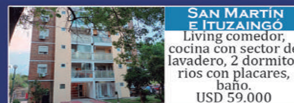
SAN MARTÍN E ITUZAINGÓ

Casa 1: Living 2 dorm, patio, cocina, espacio de comedor y fondo. Casa 2: Living cocina, 2 dormitorios y patio. USD 37.000