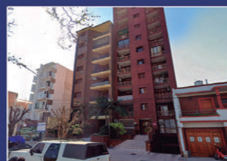
ANDRÉS PAZOS 367 FRENTE A PZA. DEL BOMBERO

Cocina con sector de lavadero, living comedor, 3 dormitorios con placares, baño. Listo para escriturar. USD 60.000