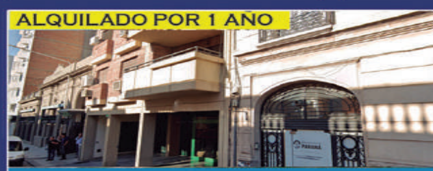
ALQUILADO POR 1 AÑO

Living comedor, cocina con sector de lavadero, 2 dormitorios con placares, baño, espacio de estacionamiento. USD 50.000