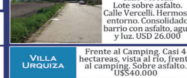
Z/ZANNI Y NEWBERY

Gran fracción de 12.500m2, por Capibá y ATE. Agua en la zona. Añosa arboleda con algarrobos. USD 20.000