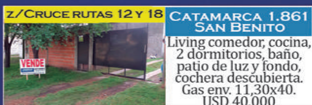
Z/CRUCE RUTAS 12 Y 18

Duplex. 1 dorm, Cocina comedor, antebañño, baño, patio. $290.000 + imp + exp