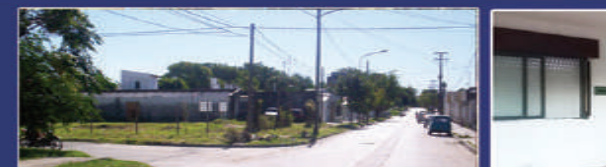
C. CALDERON Y MONTIEL

Living comedor, cocina con sector de lavadero, 2 dormitorios con placares, baño. USD 59.000