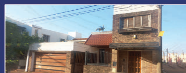
ROSARIO DEL TALA 441

Departamento en microcentro. Living, comedor diario, cocina, 3 dormitorios con placares, 2 baños, amplio balcón. Metros Totales 97,61. USD 180.000