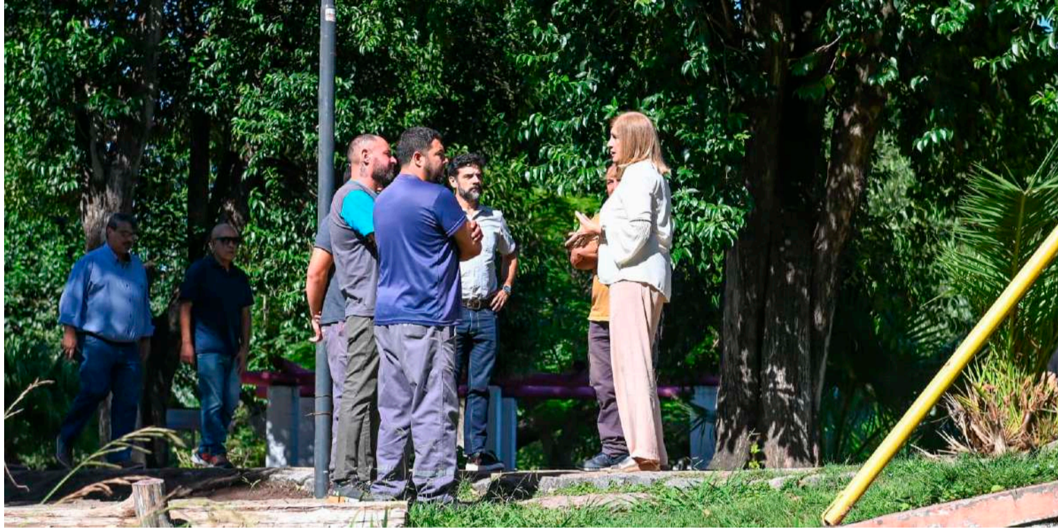
La intendenta visitó el lugar y dialogó con los trabajadores que llevan adelante las obras.

► ASEGURAN QUE LOS TRABAJOS DEMANDARÁN UN TIEMPO CONSIDERABLE DE EJECUCIÓN