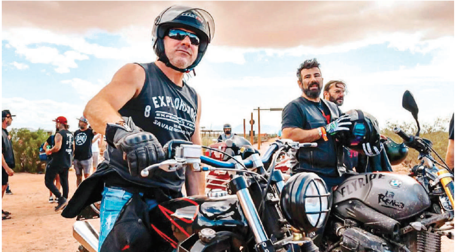
"La Renga: Totalmente poseídos", en los cines Círculo y Sunstar.

Sala 2 15.30 Kung Fu Panda 4, sábado y domingo 2D