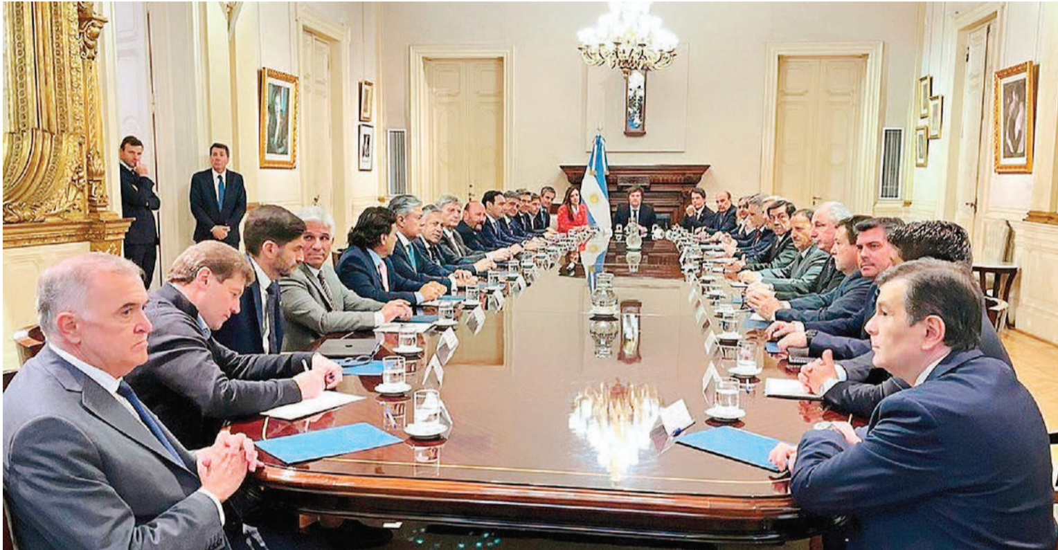
Los mandatarios provinciales y las autoridades del gobierno nacional se volverán a encontrar en la Casa Rosada.