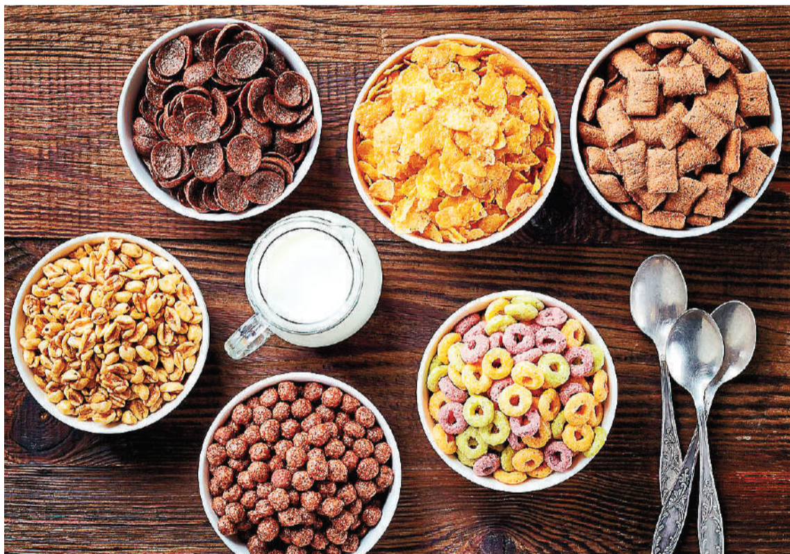
Se busca promover el consumo de cereales por sus amplios beneficios.