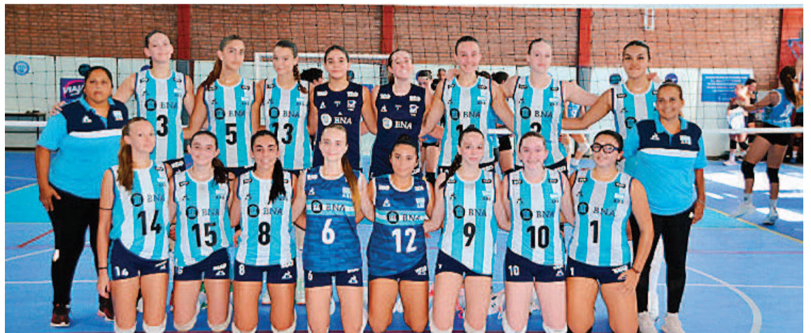
Los seleccionados nacionales, listos para ver acción en las citas ecuménicas que se aproximan.

En el masculino, la sede será Bulgaria y se disputará del 24 al 31 de agosto y los que lograron el pasaje a dicha competencia son: Bulgaria, Argentina, Bélgica, Brasil,