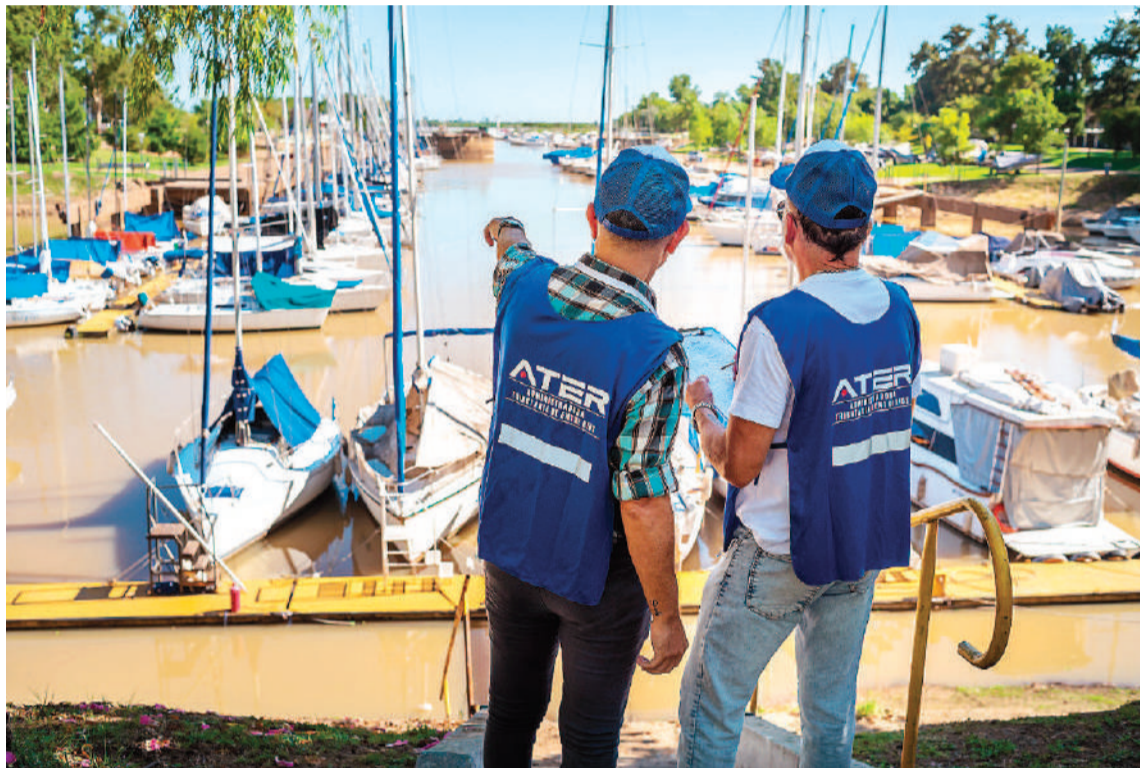
Se fiscalizaron cerca de 800 embarcaciones deportivas, de alto valor económico.

OBJETIVO. "La misión que nos encomendó el gobernador Rogelio Frigerio es transformar al régimen tributario en un sistema equitativo, justo y solidario. Por eso, con la misma determinación que estamos ofreciendo oportunidades para ponerse al día y reconociendo a los que pagan puntualmente, también avanzamos con operativos en el territorio para ampliar la