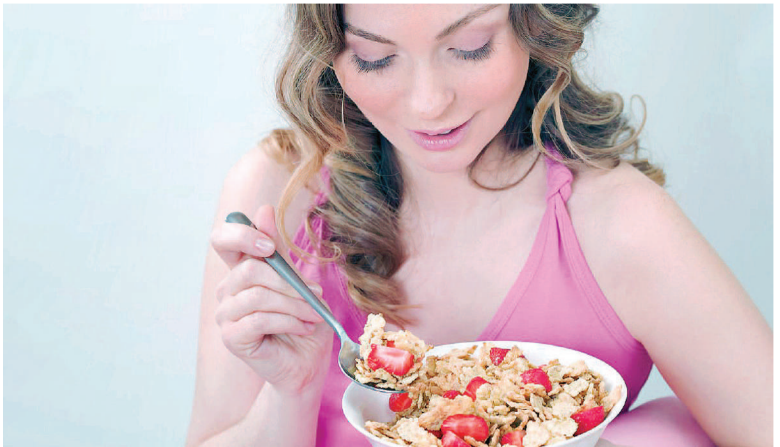
Un desayuno equilibrado combina salud, dieta, nutrición y la vitalidad.

“Esos cereales crujientes, que siguen crujientes después de mojar-