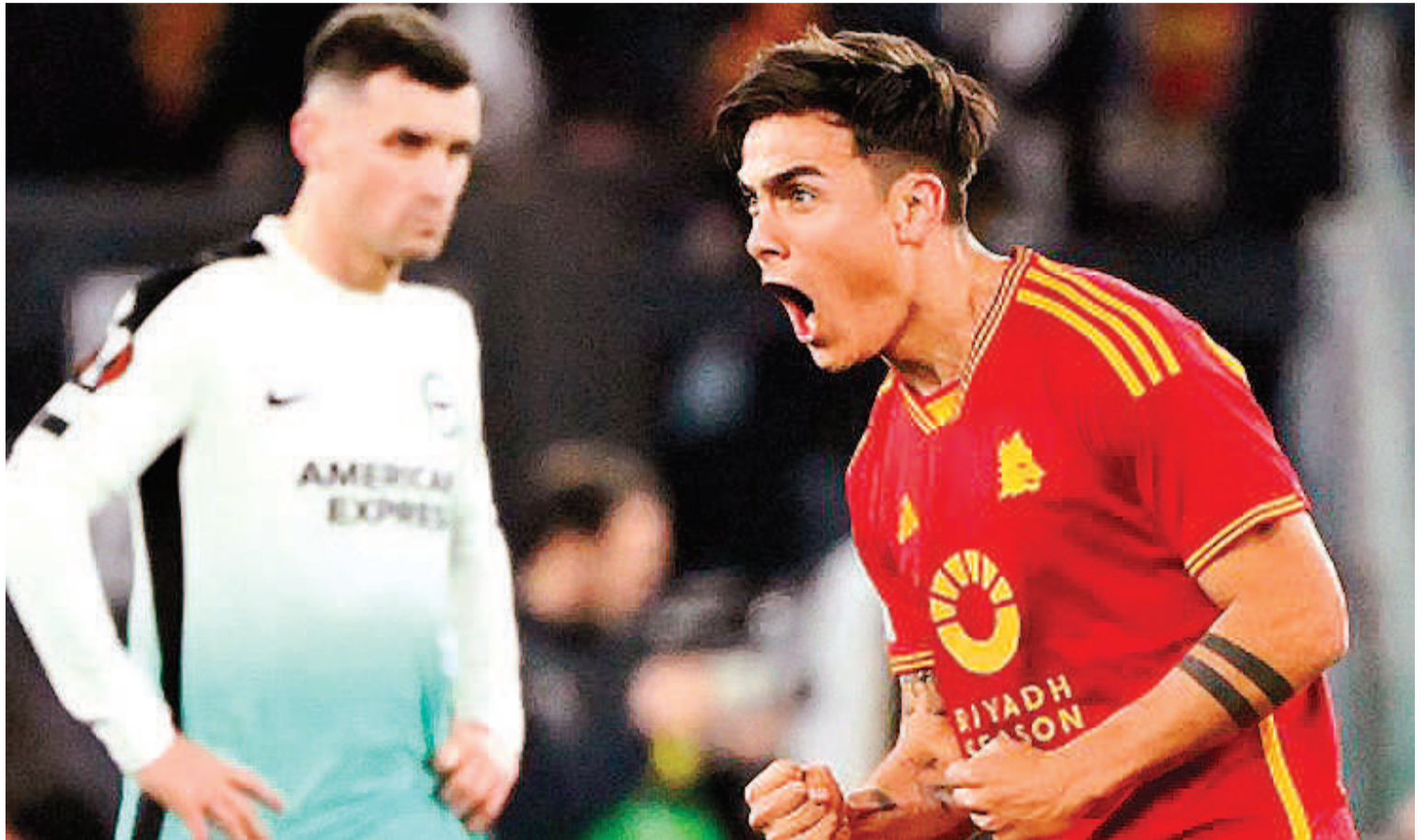
Paulo Dybala selló ayer otra gran actuación para la Roma.

Romelu Lukaku, Gianluca Mancini y Bryan Cristante completaron la paliza de la Loba sobre los británicos, que contaron con el ex Rosario Central entre los titulares, pero sin el 'Colo', quien no estuvo entre