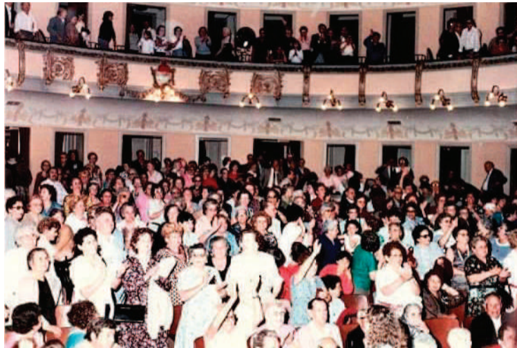
Sanción de la Ley de Jubilación de las Amas de Casa.