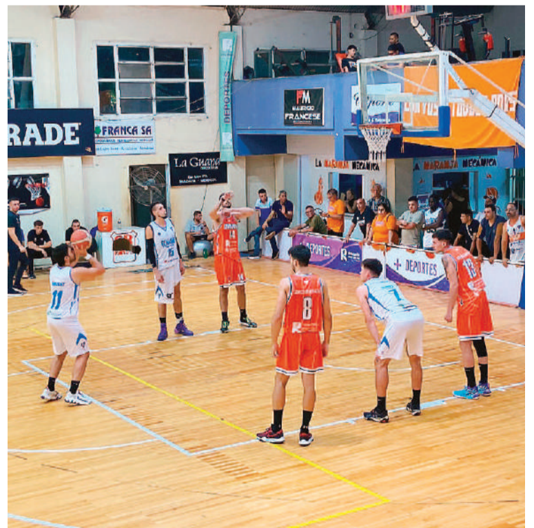
Echagüe continúa en caída libre, atravesando una campaña difícil.