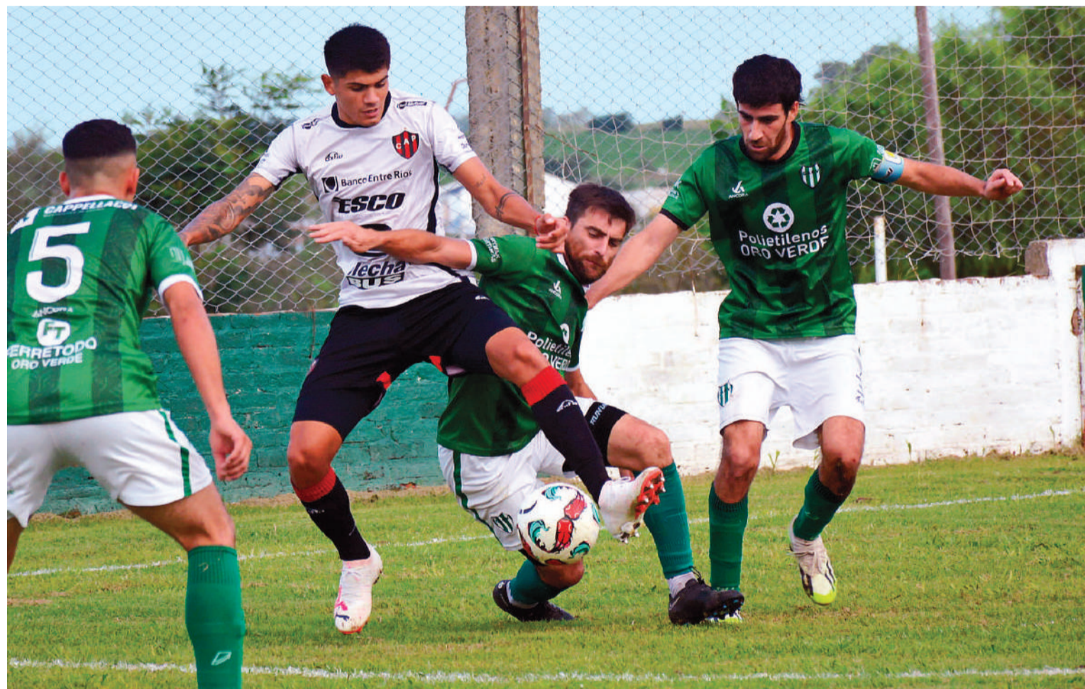
La vuelta entre Patronato y Oro Verde será el martes. El interesante desenlace tendrá lugar en el Grella a partir de las 17.30 horas.