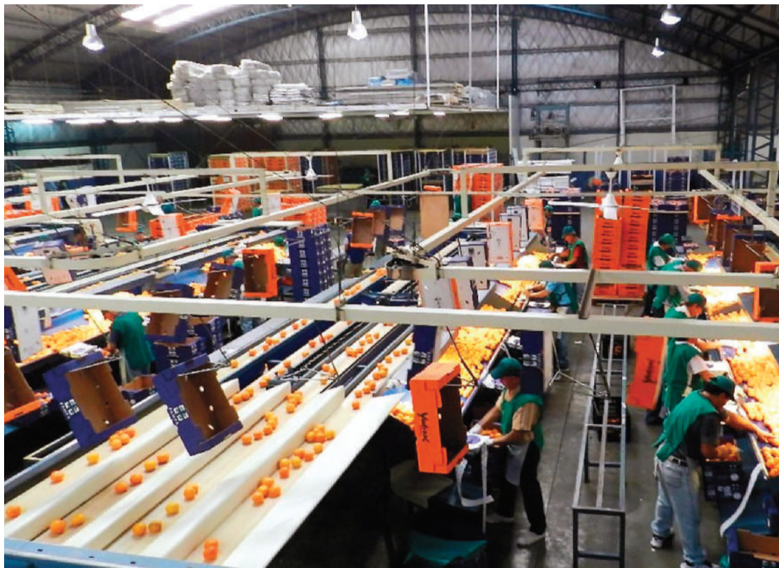
Abunda la preocupación en las empresas entrerrianas.

Luego señaló que en líneas generales los resultados a nivel nacional y provincial “son bastante similares”, aunque hay algunos “indicadores que se agravan un poco más”