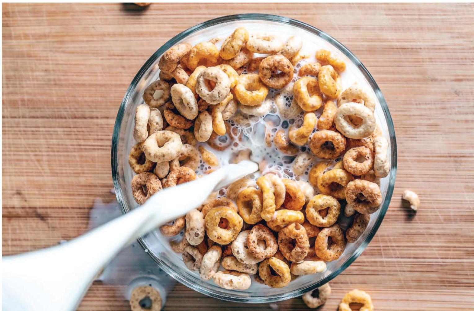
Los cereales satisfacen las necesidades alimentarias de los humanos en gran medida.

Los cereales comprenden a todos los granos provenientes de las plantas de la familia de las pomáceas, con un alto contenido de vitaminas, minerales e hidratos de carbono. Dentro de todas las opciones de cereales que existen en el mercado, los especialistas recomiendan elegir los que sean reducidos en azúcar, sin colorantes ni