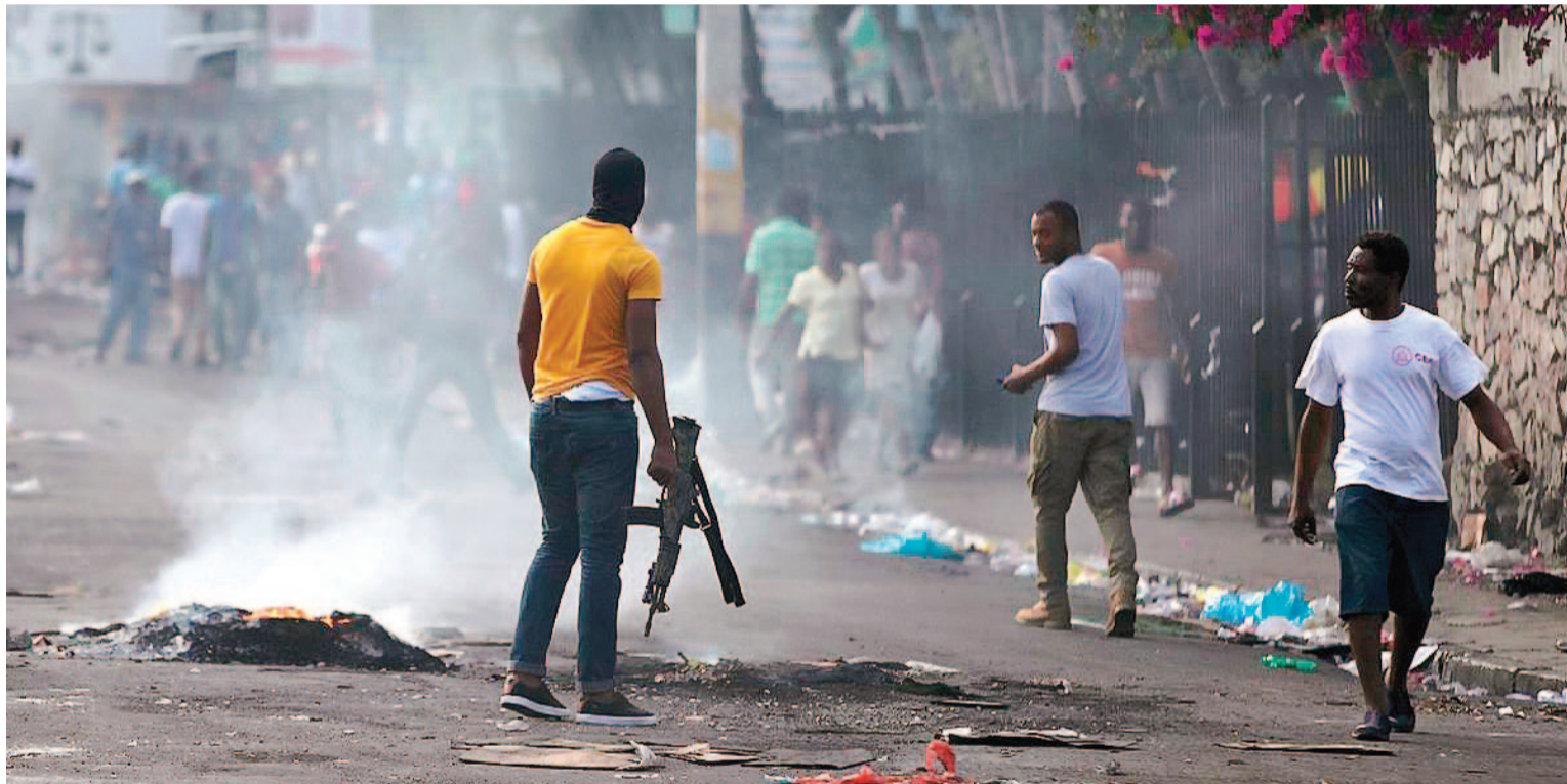
Crece la tensión en las calles de la capital del país centroamericano.

La capital del país centroamericano sufre una ola de violencia marcada por ataques altamente coordinados por parte de pandillas contra las fuerzas del orden y las instituciones estatales. En los últimos días, grupos armados quemaron comisarías de policía y liberaron a miles de reclusos de dos prisiones, en lo que un líder de una pandilla describió como un intento de derrocar al Gobierno del primer ministro, Ariel Henry.