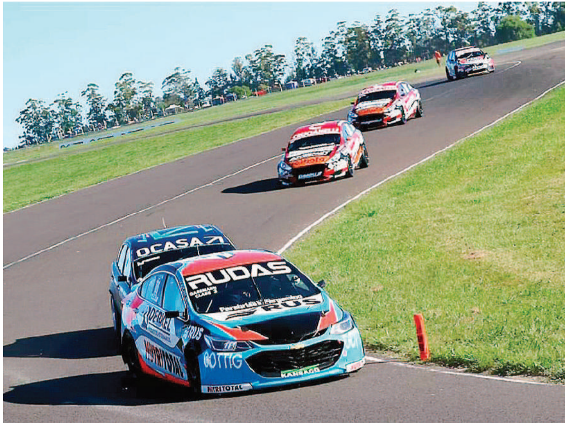
El TN prevé vivir un fin de semana de vasta acción en el autódromo Ciudad de Paraná.