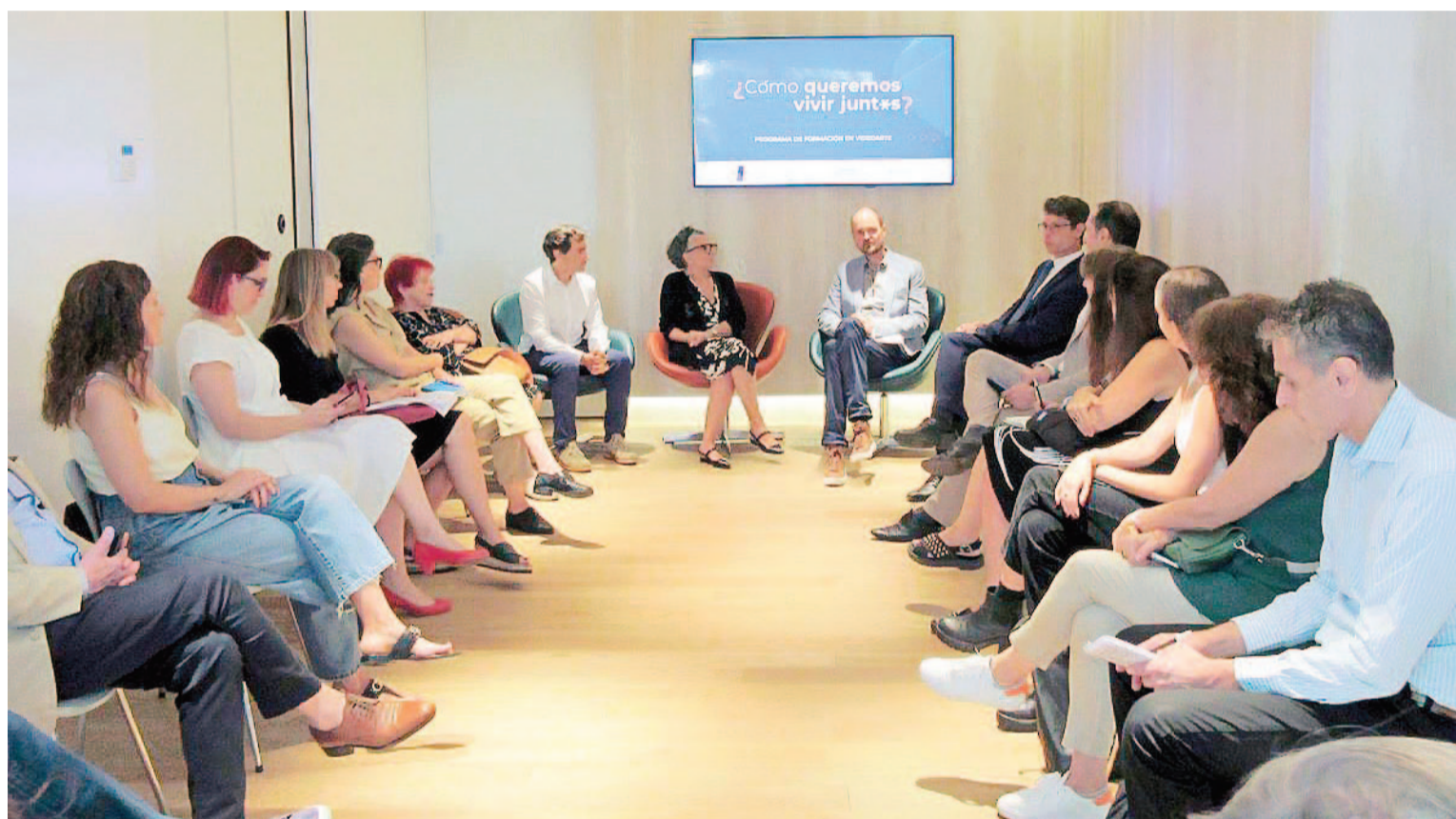
Los nombres de los seleccionados serán informados el 17 de abril de 2024, a través de la dirección de e-mail que registraron en su inscripción.

“¿Cómo queremos vivir juntos?” una iniciativa impulsada por el Goethe-Institut, la Alianza Francesa y Fundación Medifé, tiene como objetivo desarrollar obras de video inéditas, que a su vez, formarán parte de una exposición itinerante a partir de noviembre de este año.