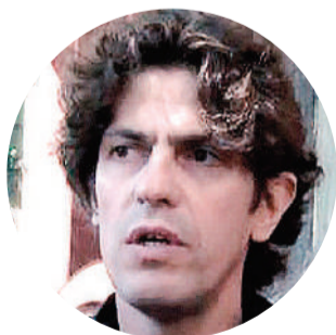
Martín Lousteau Senador nacional de la UCR

“Encerrado en Olivos y Twitter, el Presidente no ve o no le importa la realidad”