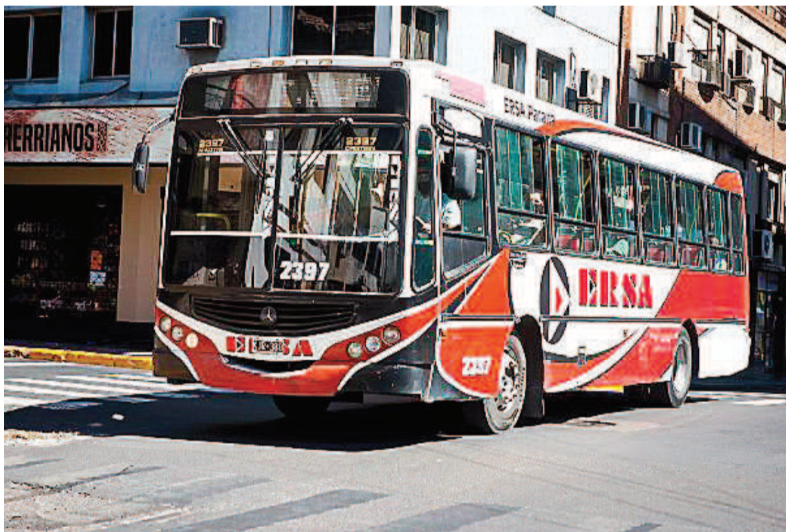
En la jornada de hoy aumenta el boleto en el Área Metropolitana. Mañana no habrá colectivos.

Con la implementación del nuevo cuadro tarifario por secciones, los usuarios de las líneas metropolitanas deben abonar, desde la cabecera hasta el comienzo del ejido municipal, la tarifa de $830; y dentro del ejido municipal, la tarifa de $680. Estas líneas no cobran tarifa