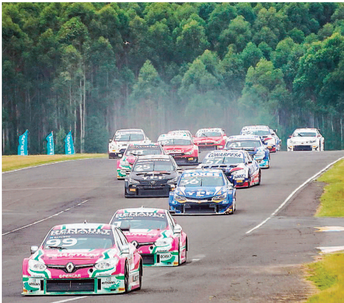
El retorno del TC 2000 a Concordia causó una positiva sensación y contó con un gran marco.

ban mal y cerró su retorno a la categoría con un abandono por un principio de incendio en el Toyota.