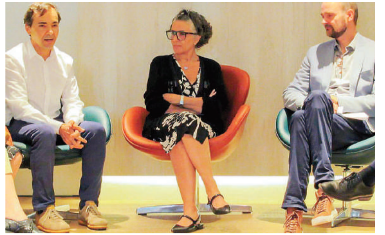
“¿Cómo queremos vivir juntxs?”, una iniciativa impulsada por el Goethe-Institut, la Alianza Francesa y Fundación Medifé, tiene como objetivo desarrollar obras de video inéditas.

La muestra colectiva será en noviembre en la sede de la Alianza Francesa de Buenos Aires.