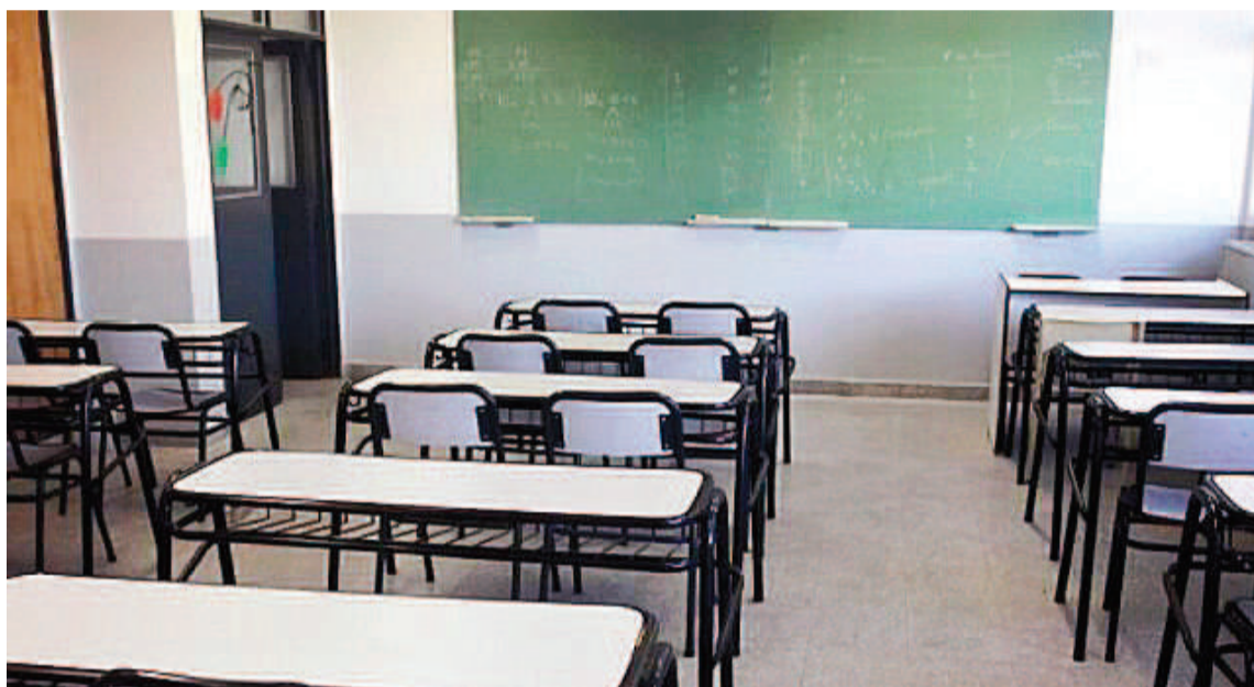
En la jornada de hoy habrá otro paro docente en Entre Ríos.

Además, puntualizó sobre la situación de los docentes de escuelas técnicas, agrotécnicas y de formación profesional, que dejaron de recibir los fondos provenientes