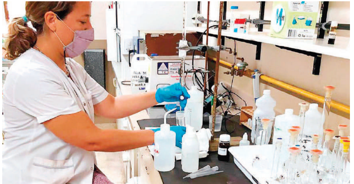
El Conicet publicó el listado de 300 Becas de Finalización de Doctorado.