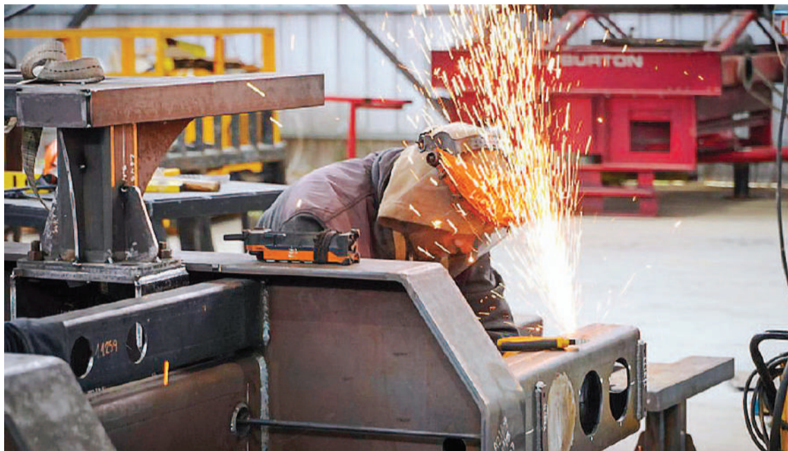
La negociación paritaria se complica, debido al alto escenario inflacionario.

ACEITEROS. Los trabajadores aceiteros acordaron un reajuste de 41%. Además, los operarios del sector percibirán un bono de $644.000 (se paga todos los años y se imputa como participación en las ganancias). El salario básico para la categoría inicial -peón- llegará a $992.161,89 desde enero. La paritaria 2023 había cerrado en 211,4%.