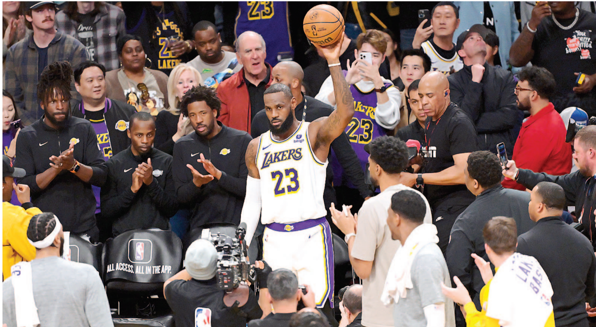
LeBron James se convirtió en el primer jugador en alcanzar 40.000 puntos en la NBA.

EL ALERO DE LOS LAKERS ALCANZÓ 40.000 PUNTOS EN LA NBA