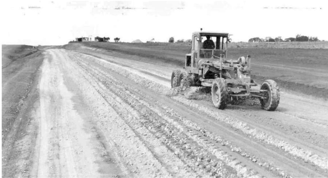
Construcción de la pista del aeropuerto, 1968.