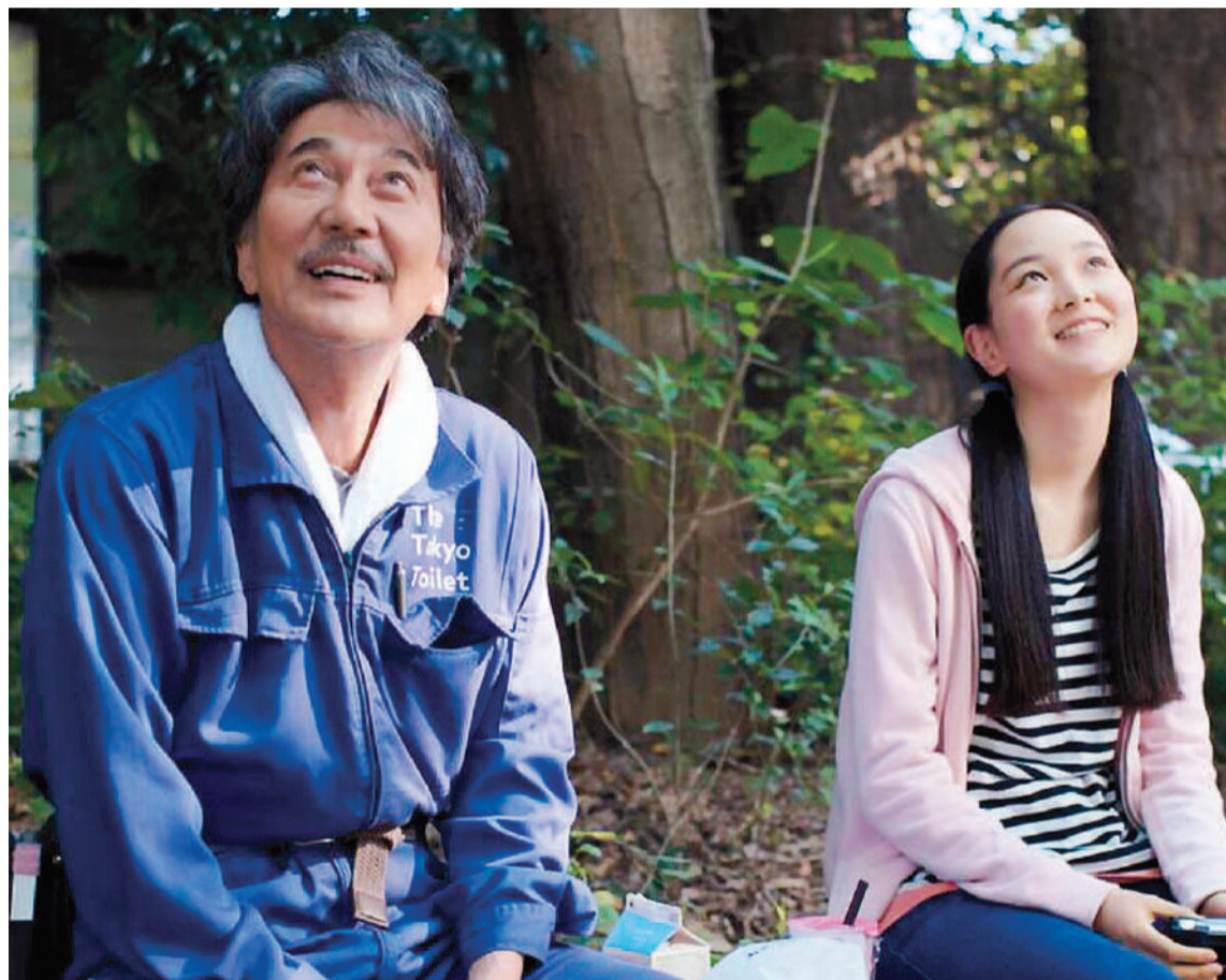
“Días perfectos”, diariamente en cine Círculo.

La Secretaría de Cultura de Entre Ríos, a través del Archivo General de la provincia, invita a la comunidad a una exposición de libros, dibujos, juguetes, foto-