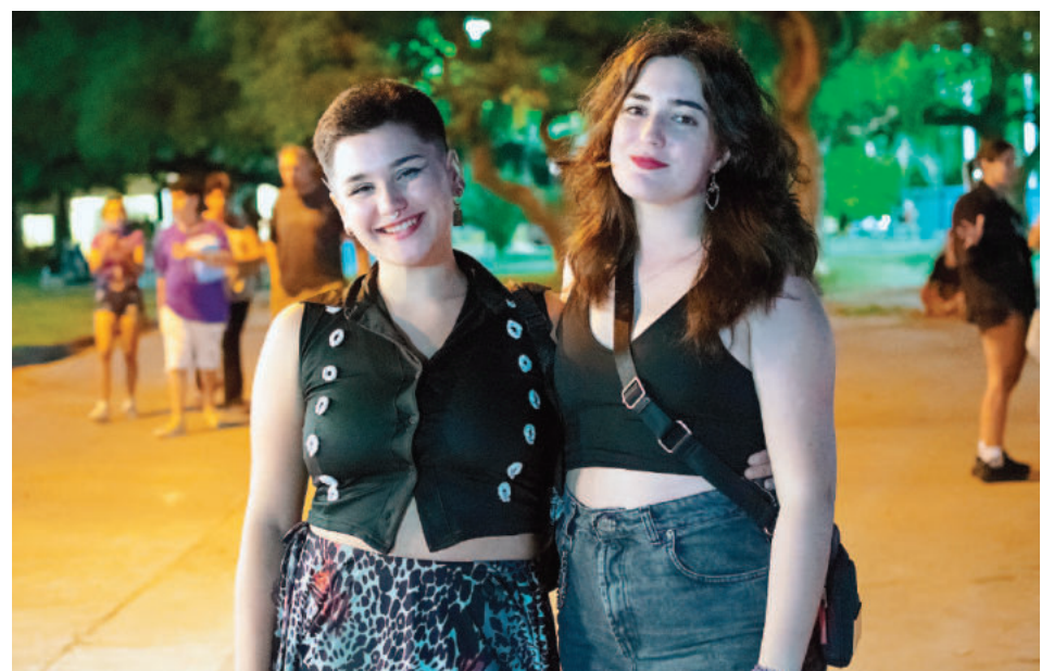
Mila y Fati destacaron el carácter libre y gratuito de la propuesta.