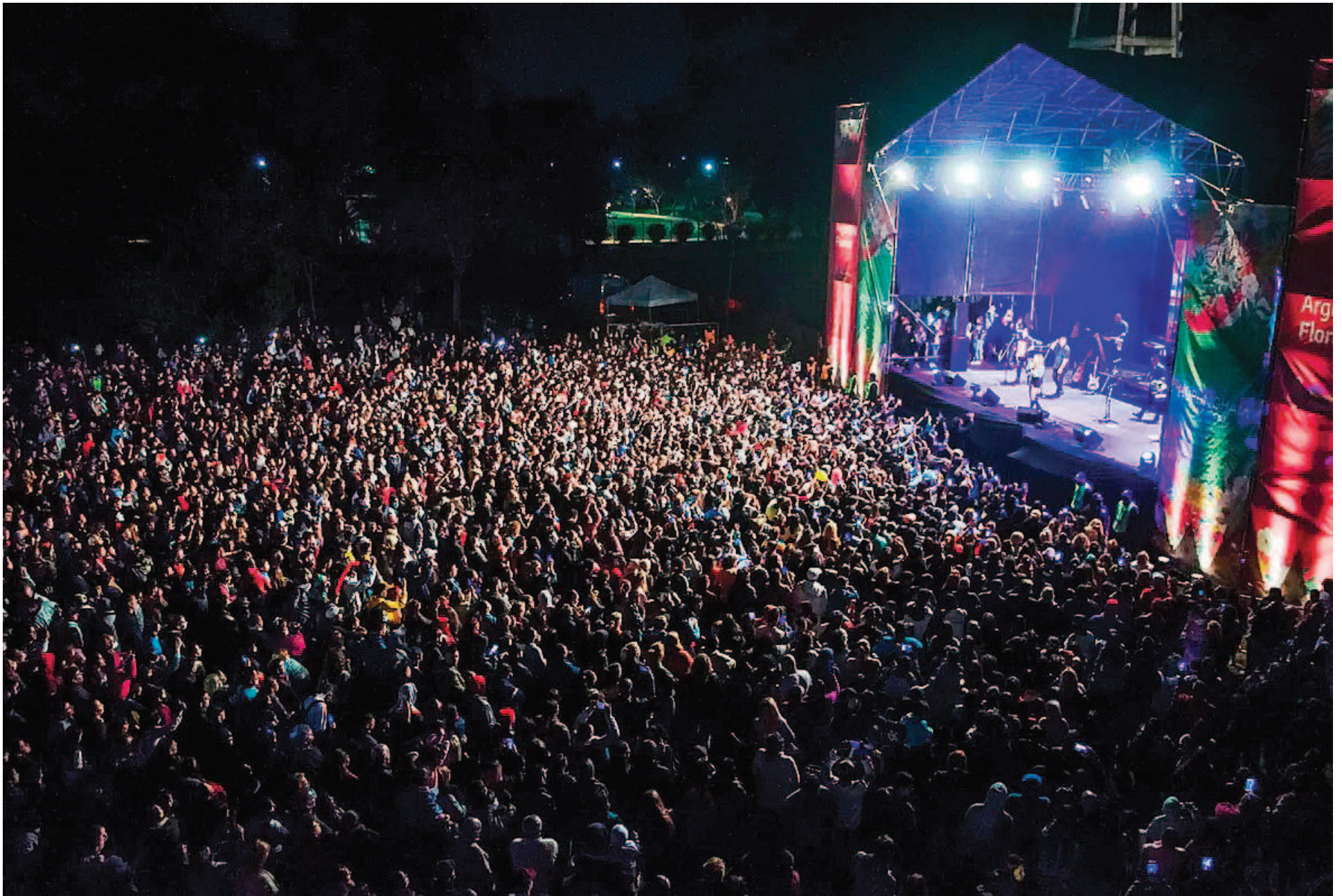
En el vínculo del artista con su público se esconde la raíz de su influencia.

en torno a los posicionamientos me recuerda mucho a cómo se gestionaban los escraches, es una dinámica que no discrimina ideologías. Nadie va a quedar conforme con lo que se diga o se deje de decir, porque no se trata en sí de lo que está en disputa, sino de uno, más aún, de lo que uno 'cree' que es uno. Ni el escrache ni la cancelación querían justicia y reparación, y acá ocurre igual. Los consumos culturales hoy se utilizan delicadamente para configurar una idea