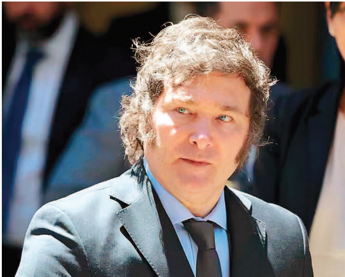
El presidente Milei suele usar la descalificación y el insulto en redes sociales o cuando es entrevistado.

Para que algo “valga” como insulto ha de ser dicho desde una po-