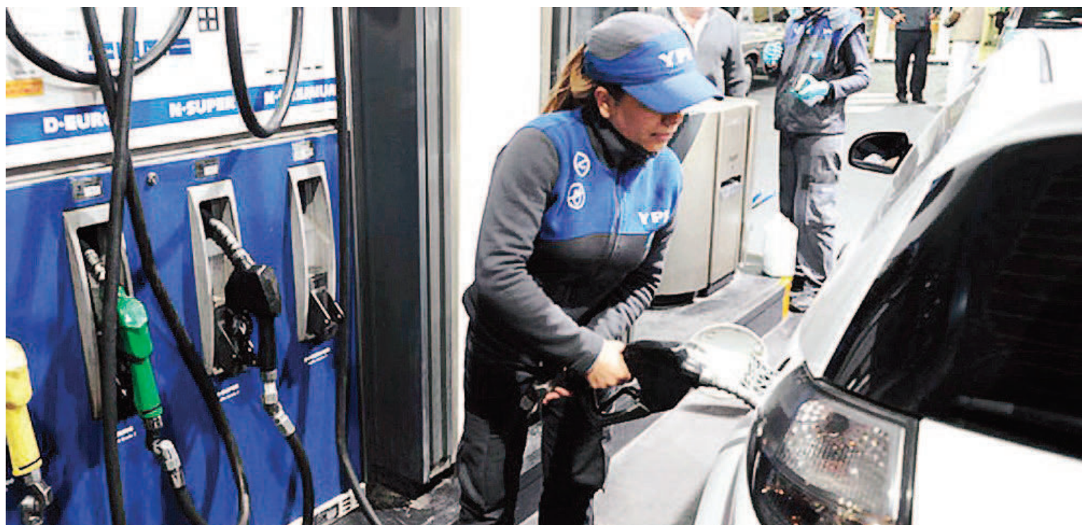
El aumento gradual del combustible vuelve a impactar en los bolsillos de las personas.

El incremento responde al impacto de la actualización impositiva dispuesta por el Gobierno y el incremento de los márgenes de rentabilidad dispuesto por las petroleras. Rige para los principales operadores YPF, Shell, Axion y Puma.