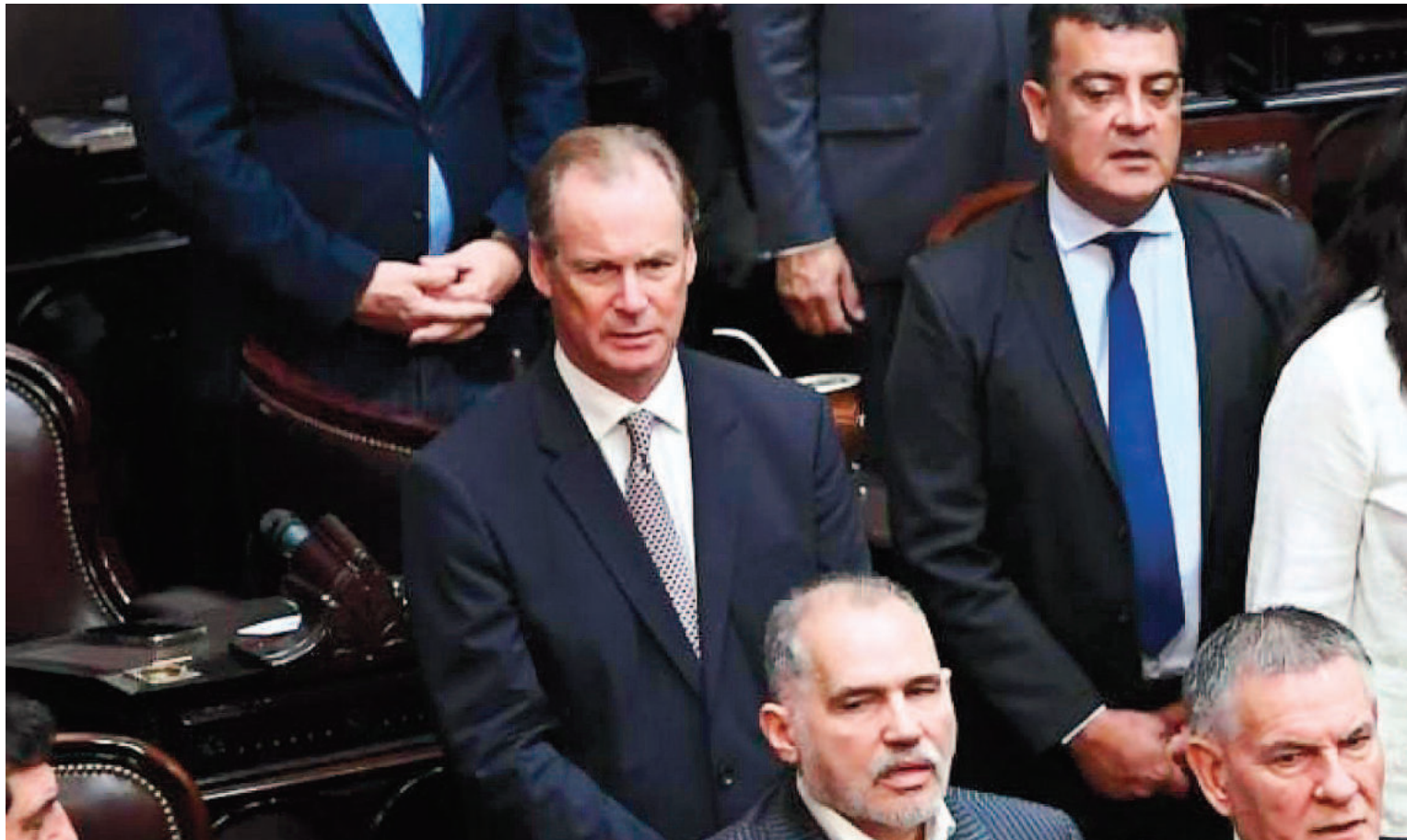
"Milei construyó un relato épico inconducente que no tiene anclaje en la realidad", afirmó el diputado nacional Gustavo Bordet.

Legisladores nacionales y provinciales, funcionarios y figuras políticas se expresaron sobre la convocatoria al Pacto de Mayo. Hubo mayoría de apoyos en el oficialismo y críticas desde la oposición.