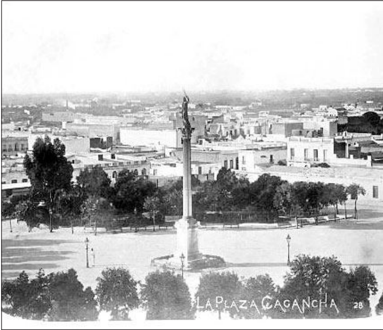
Plaza que conmemora la batalla de Cagancha, en Montevideo, hacia 1880.

cinco buques brasileños rendidos en Gualeguaychú