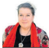
Griselda De Paoli Especial para EL DIARIO

El relato en clave autoreferencial es una forma de recordar aspectos de la vida de las personas en épocas pasadas. A la vez permite rescatar momentos significativos en las sucesivas etapas de una biografía, como por ejemplo los juegos de infancia, que permiten vislumbrar cómo se vivían aspectos de lo cotidiano por entonces en el espacio urbano.