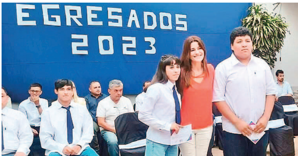
Terminar la secundaria: un paso pequeño, pero sumamente transformador.

Respecto a las causas de abandono existen motivos escolares y extraescolares. En relación a los primeros, el 28% abandona la escuela porque no le gusta o no la con-