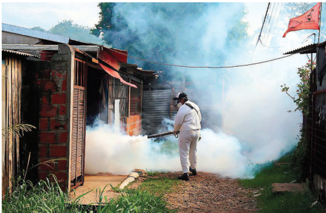
Se multiplican las medidas de prevención en todo el continente.

En cuanto a los casos en mujeres embarazadas, en las primeras seis semanas del año, estos aumentaron