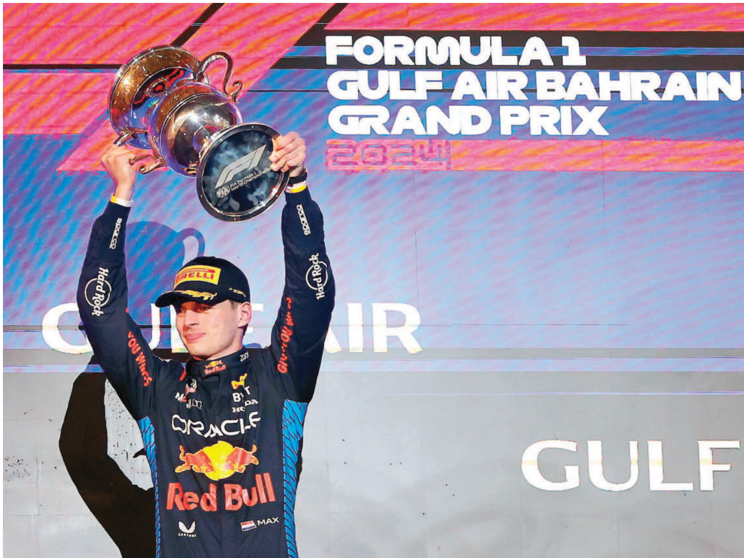
El neerlandés tuvo un gran estreno y vuelve a ser el gran candidato para la temporada entrante.

Verstappen se impuso con un tiempo de 1h31m44s742/1000 y con una cómoda ventaja de 22s457/1000 sobre su escolta, demostrando una vez más su poderío y anotándose, ya desde la primera fecha de la