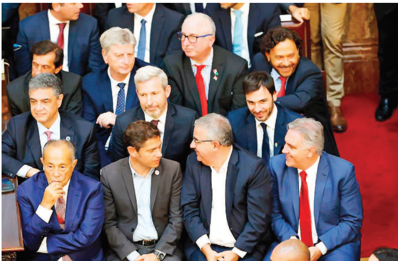
Frigerio, junto a otros gobernadores, en el Congreso Nacional, durante la Asamblea Legislativa.

“Cuento conmigo para impulsar el Acuerdo de Mayo. Estoy de acuerdo con todos y cada uno de los 10 puntos que planteó. Es lo que necesita la Argentina”, expresó en redes sociales el mandatario entrerriano.