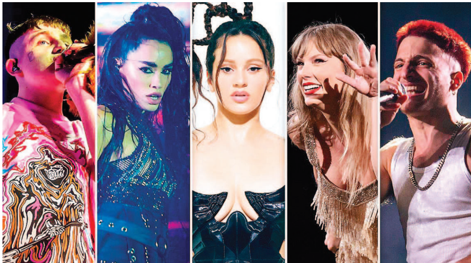
Suelen causar revuelo las opiniones de los artistas sobre política.

“Un artista popular puede y debe intervenir en la discusión pública. No hacerlo implica también un posicionamiento político”