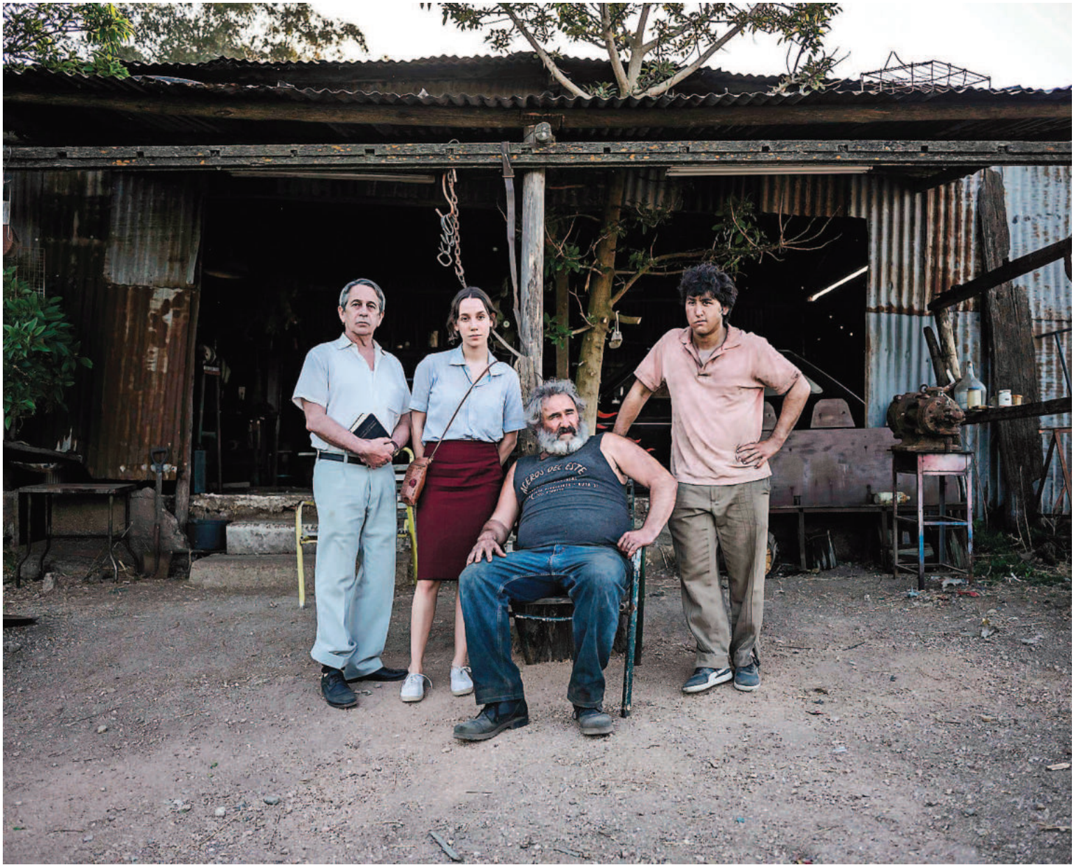
“Ver a los personajes de la novela encarnados en la pantalla fue muy emocionante”, reconoce la autora de El viento que arrasa.