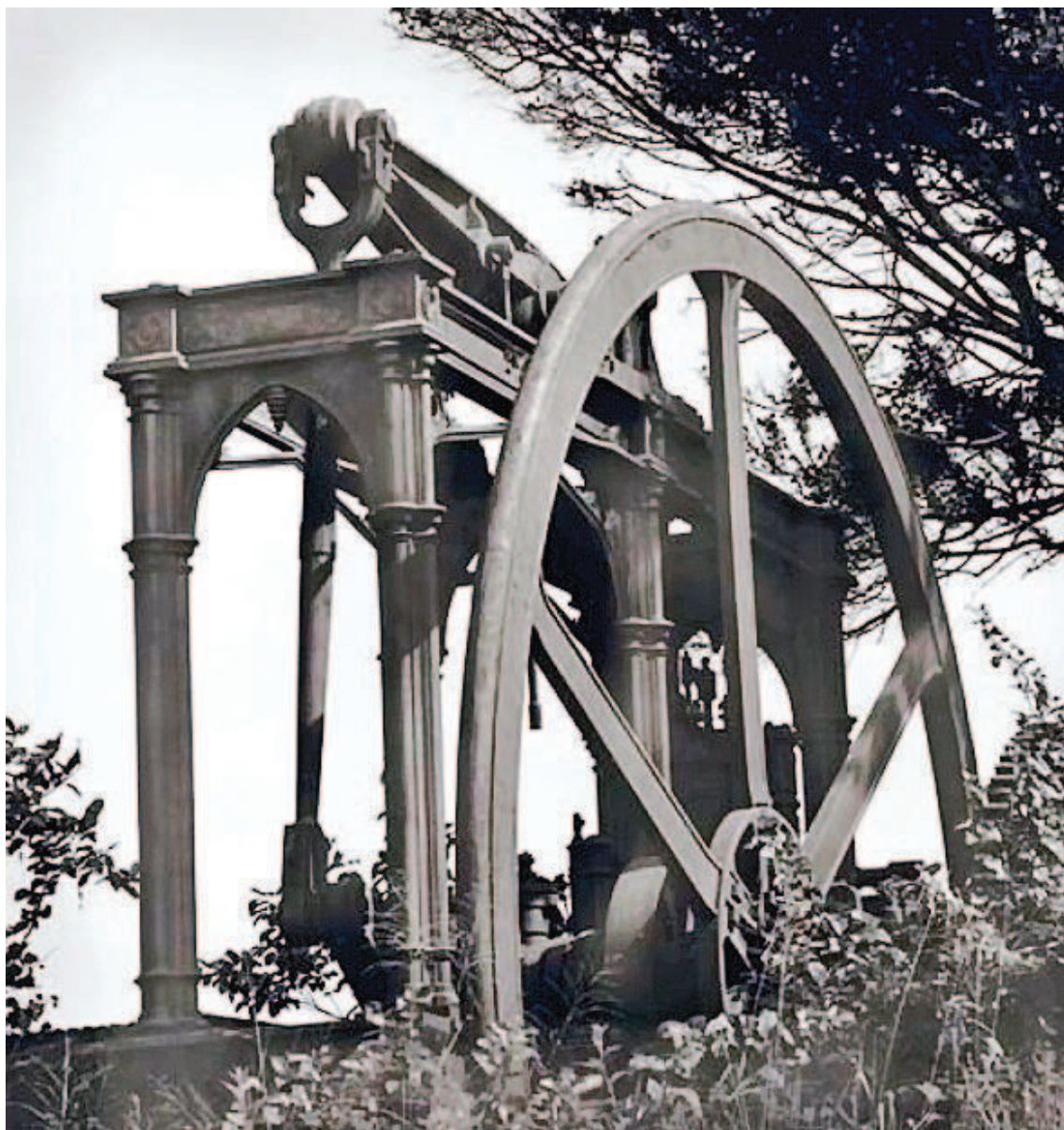
Parte de antigua maquinaria destinada a los ingenios azucareros tucumanos en los cuales se realizaba la extracción de azúcar a partir de la caña.

Tal vez esto explique por qué no se constituyó una sólida burguesía