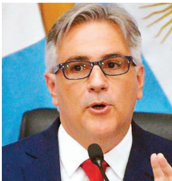
Llaryora y Zdero sumaron su adhesión a la convocatoria de Milei.

En ese marco, el mandatario agregó que Córdoba “tiene más de 20 años de superávit fiscal y como ya sabemos nuestra provincia des-