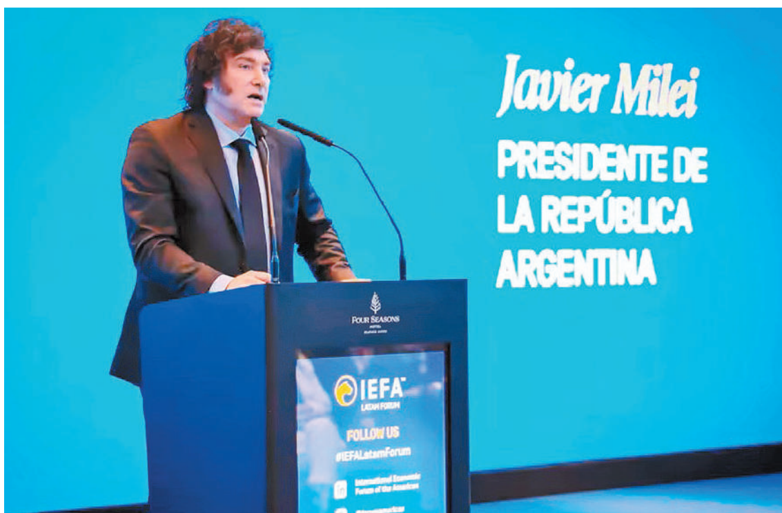
El presidente brindó una charla ante una multitud de personas vinculadas al sector económico.

Sobre esto, advirtió: "Eliminamos 200.000 programas sociales entregados de manera irregular y en ningún momento descuidamos la política social porque, en el medio, duplicamos la AUH, duplicamos la tarjeta alimentar, multiplicamos por tres la asistencia en el plan mil días, o sea, las mujeres embarazadas. No solo eso, sino que además cuadruplicamos la asistencia para útiles escolares y creamos un mecanismo para que las familias de