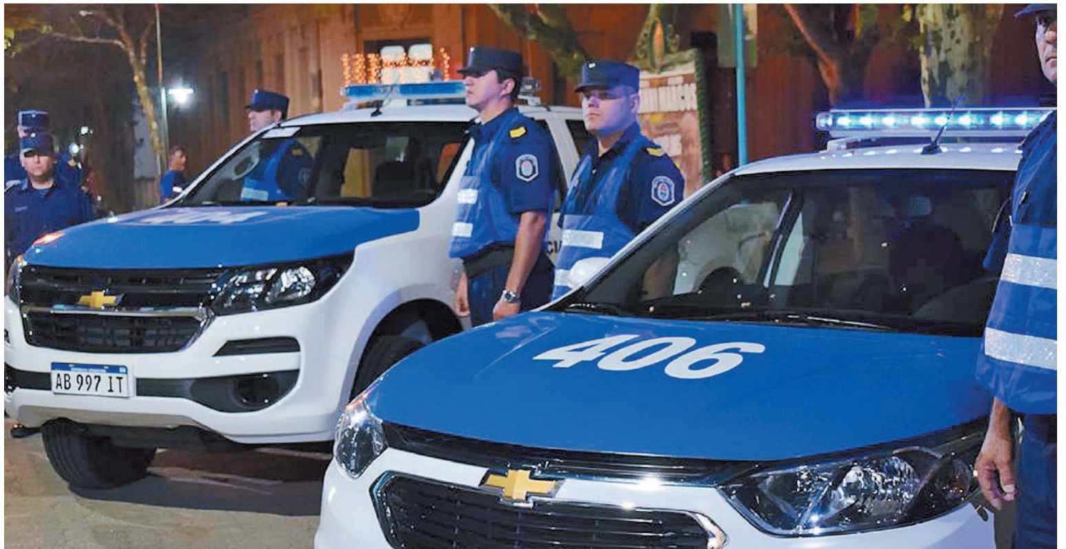
La policía intervino en el domicilio ubicado en la comuna de Villa Fontana, a 28 kilómetros de Paraná.

Se trata de 22 mil dólares y ocho millones de pesos. Los dueños de la casa denunciaron que se retiraron de la vivienda al mediodía del pasado domingo y al regresar, encontraron que los delincuentes habían ingresado por una ventana.