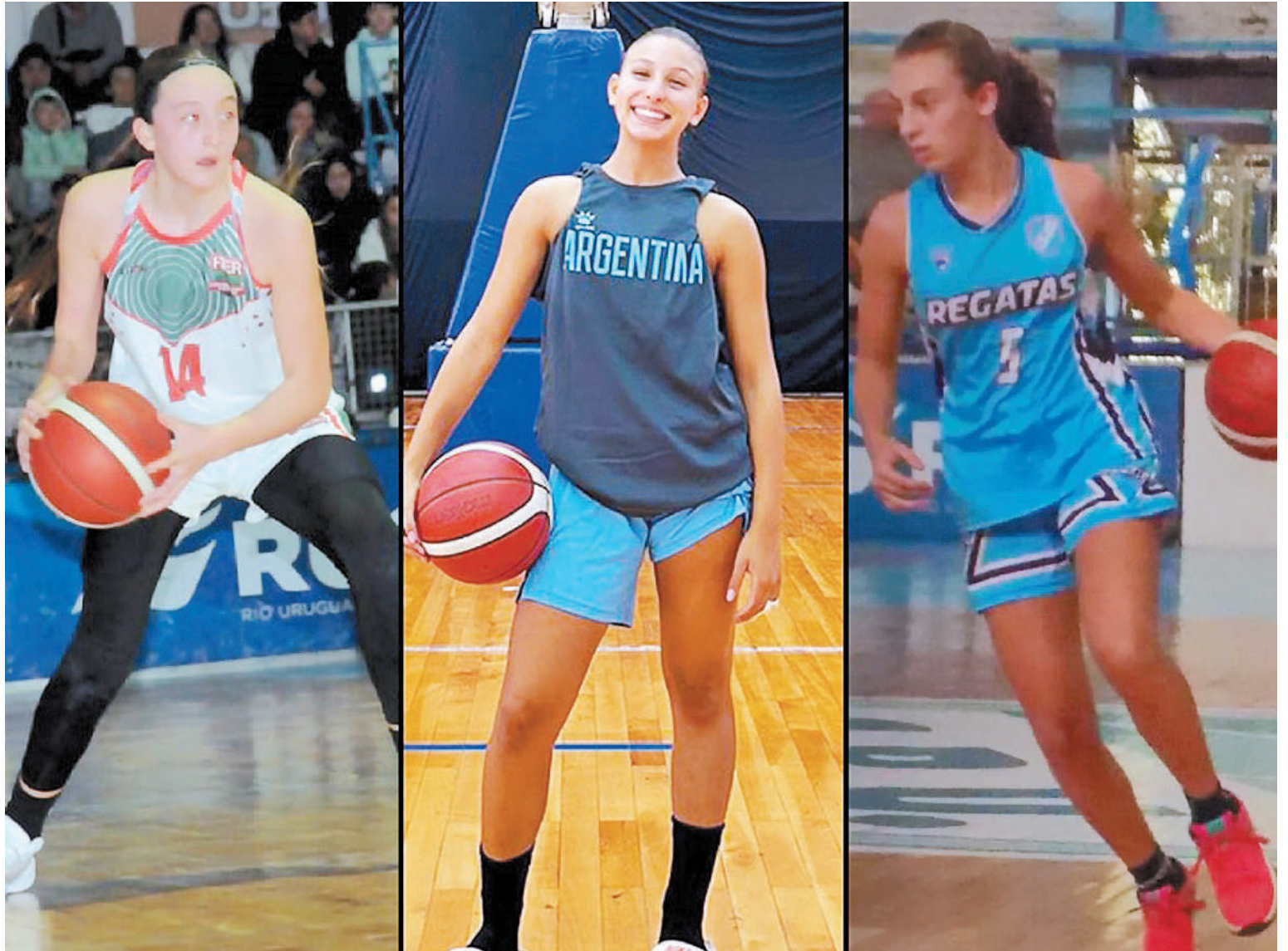
Las jugadoras de la provincia recibieron una merecida citación y ahora, van por una gran oportunidad.