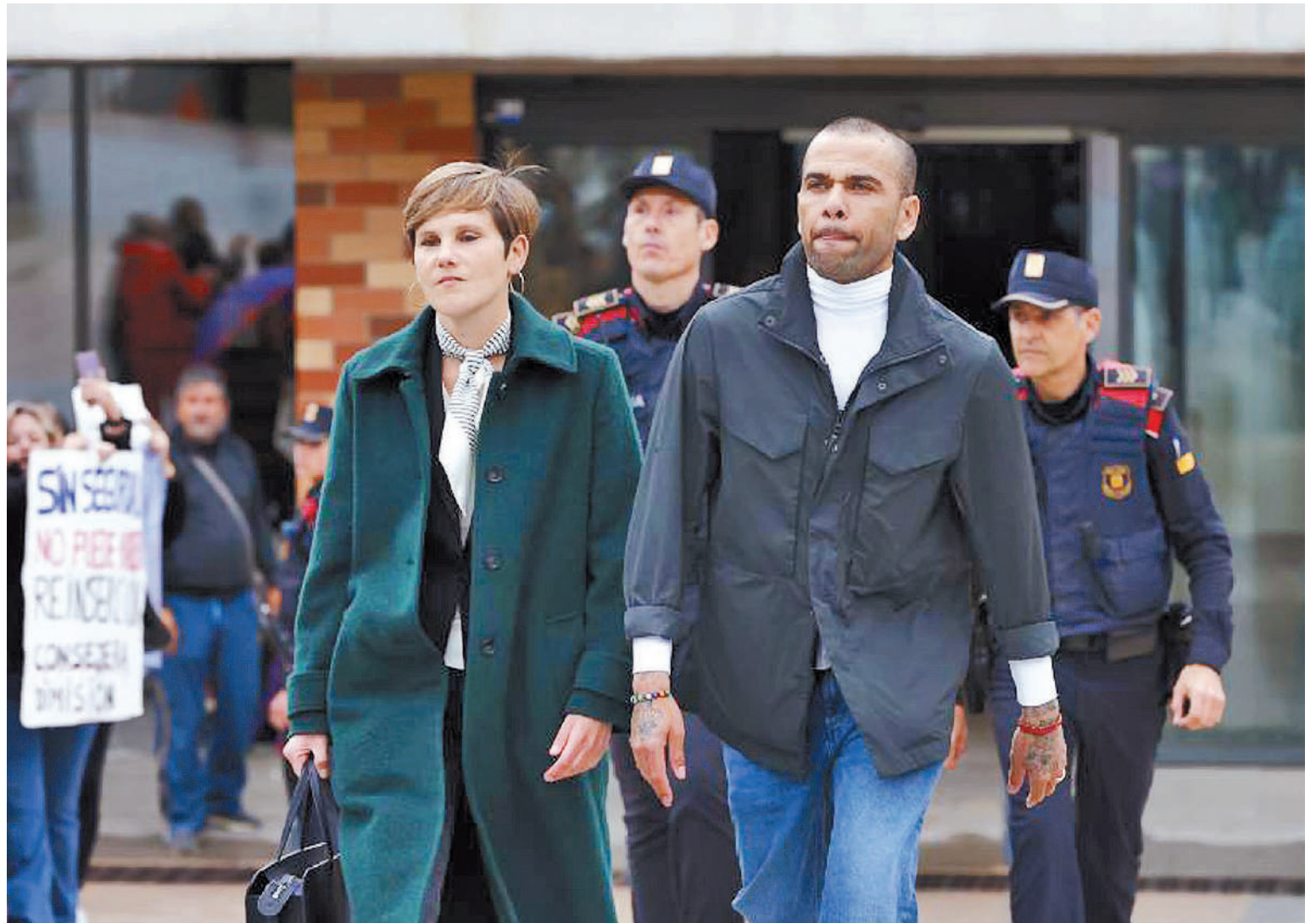
Después de 14 meses en prisión, Dani Alves recuperó su libertad pero de manera provisoria, tras pagar una millonario fianza.

SU GESTO ANTES DE SALIR DE PRISIÓN Y LA SORPRESA QUE SE ENCONTRÓ EN SU CASA