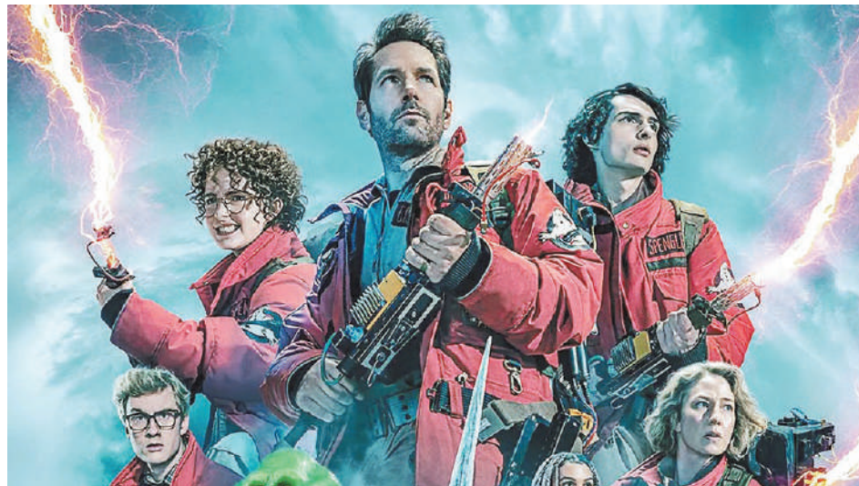
"Ghostbusters: Apocalipsis Fantasma", diariamente en cines Círculo y Sunstar.

Sala 1 15.10 - Ghostbusters: Apocalipsis Fantasma 17.20 - Duna 2 20.20 - El viento que arrasa 22.10 - Cabrini: La patrona de los inmigrantes (subt) Sala 2 15.30 - Kung Fu Panda 4 17.30 | 19.40 | 22.00 - Ghostbusters: