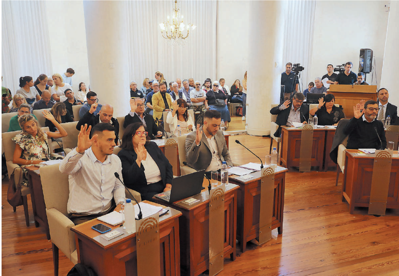
El Concejo local sesionó en la jornada de ayer.