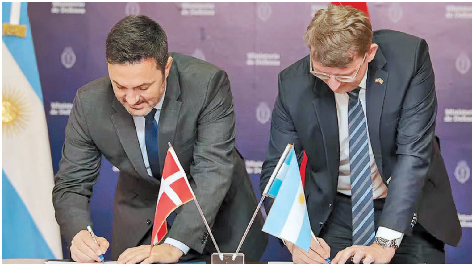
Luis Petri y Troels Lund Poulsen firman el contrato por la compra de los 24 aviones F16 para la Fuerza Aérea que serán equipados por Estados Unidos.

El ministro de Defensa, Luis Petri, y su colega danés, Troels Lund Poulsen, cerraron un acuerdo comercial avalado por la administración Biden que permitirá mejorar la capacidad bélica de la Fuerza Aérea.