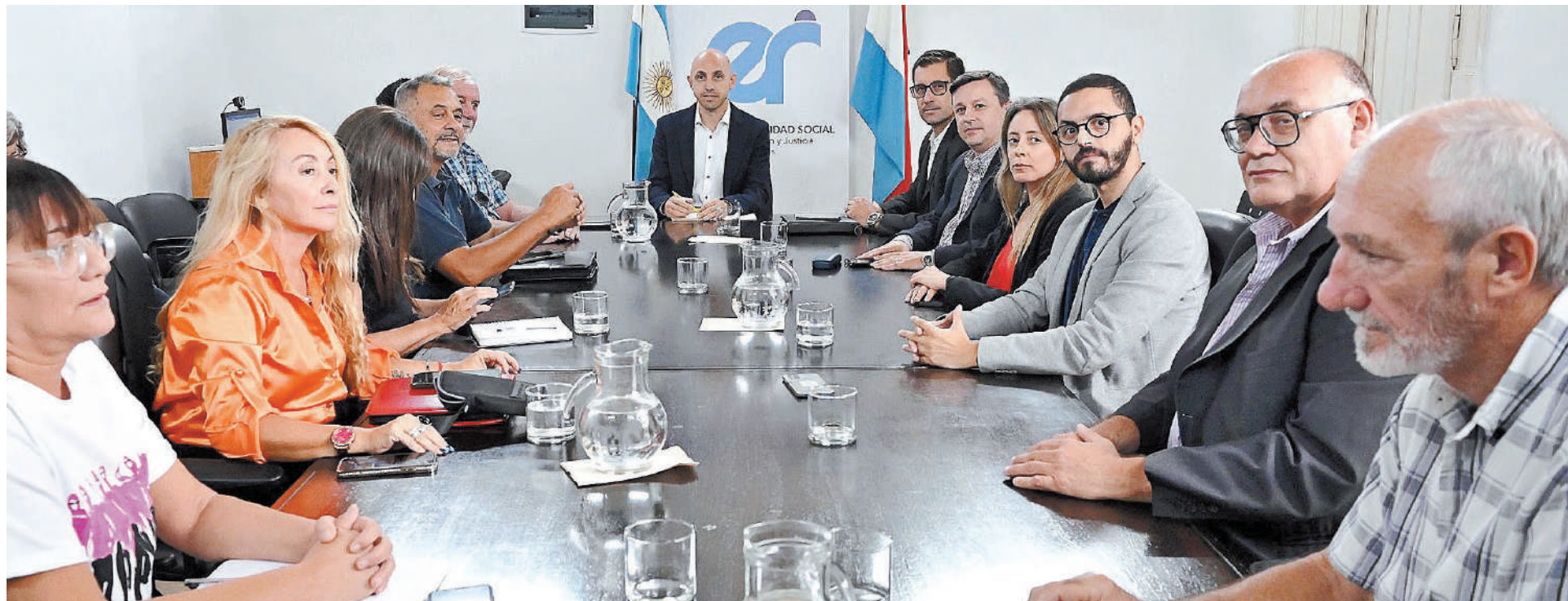
No hubo oferta salarial durante la reunión realizada ayer.