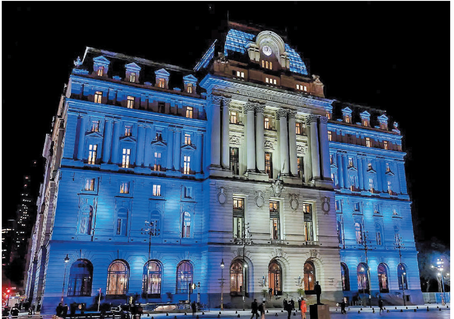
El CCK fue inaugurado en 2015

En 2017, la administración que encabezaba Mauricio Macri amagó con avanzar en ese sentido y se generó un enorme revuelo. En ese marco, el por entonces titular del Sistema Federal de Medios Públicos, Hernán Lombardi, tuvo que salir a aclarar que la iniciativa que buscaba rebautizar el edificio co-