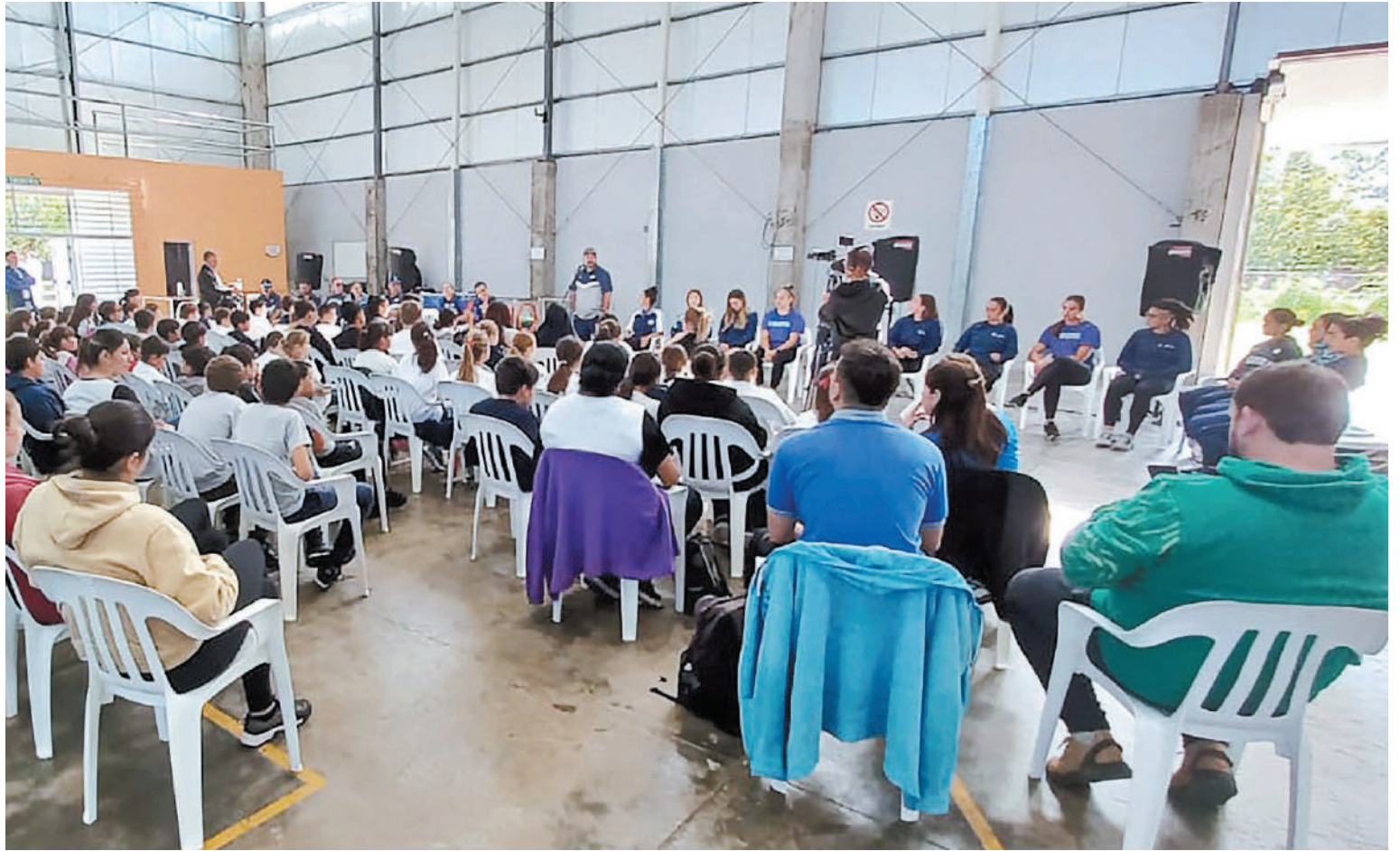
Jugadoras y estudiantes compartieron una gran experiencia en Seguí.

Una parte destacada de la visita fue el taller teórico-práctico llevado a cabo con las escuelas primarias y secundarias de Se-