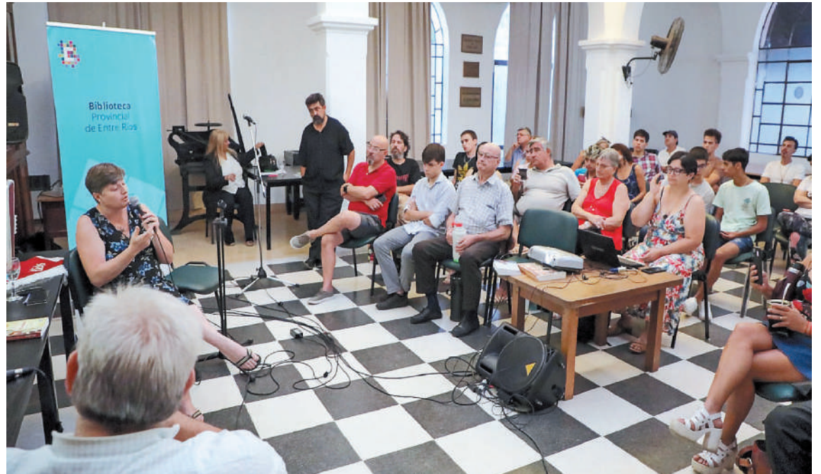
En la Biblioteca Provincial hoy a las 18, habrá un nuevo encuentro del ciclo Ellas Presentan.

En el encuentro de este miércoles, Guiratane presentará Alimento de Mis Sinos. Las páginas de es-