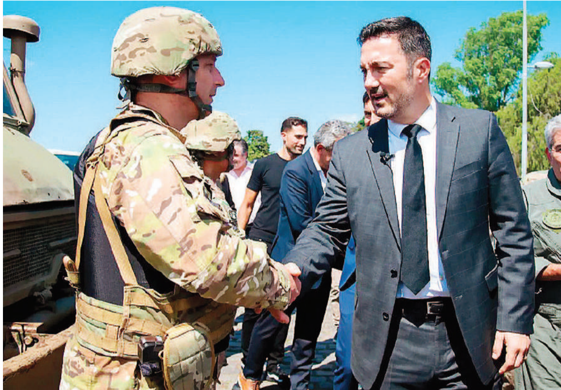
El ministro de Defensa es uno de los impulsores de la ley para que las Fuerzas Armadas tengan mayor intervención en las calles argentinas.

SEGURIDAD INTERIOR. Para el gobierno es necesario modificar esta ley que “se basaba en dos supuestos”, que “las FFAA dan apoyo y ayuda a las fuerzas policiales” y que pueden intervenir “cuando se declara el estado de sitio”. Por estas razones, la propuesta que presentarán para que debata el Congreso plantea la posibilidad de que las Fuerzas Armadas puedan participar en tareas de seguridad interior. “En patrullajes, control de personas, vehículos, instalaciones y aprehensión en flagrancia y que también puedan usar medios coercitivos, pero con las mismas normas que regulan a las fuerzas de seguridad. Sus acciones no van a