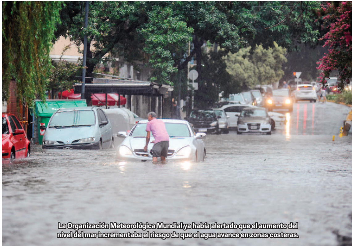
La Organización Meteorológica Mundial ya había alertado que el aumento del nivel del mar incrementaba el riesgo de que el agua avance en zonas costeras.

En particular, Barranquilla se encuentra en una posición vulnerable dado su entorno geográfico cercano a la desembocadura del río Magdalena, lo que facilita las constantes inundaciones en la zona. Por su parte, Maracaibo, Río