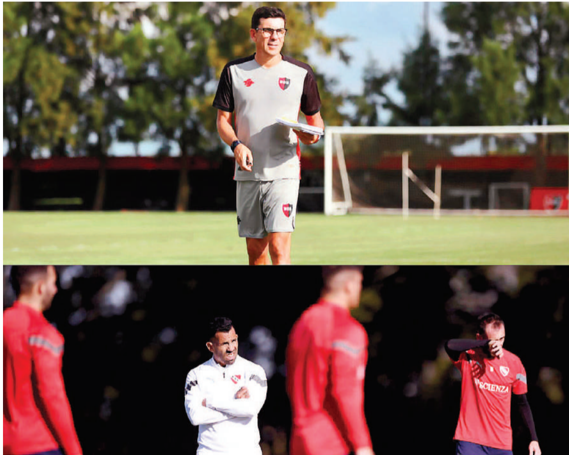
Ambos irán cautelosos con respecto al armado del once, porque si bien resta una semana para reanudar la Copa de la Liga, se vendrá una seguidilla de partidos clave para avanzar a playoffs.

El camino de Newell's Old Boys hacia los playoffs del torneo de Primera División tiene un paréntesis significativo. El equipo dirigido por Mauricio Larriera jugará los 32avos de final en la capital santafesina, tal como se dispuso en el caso de Ro-