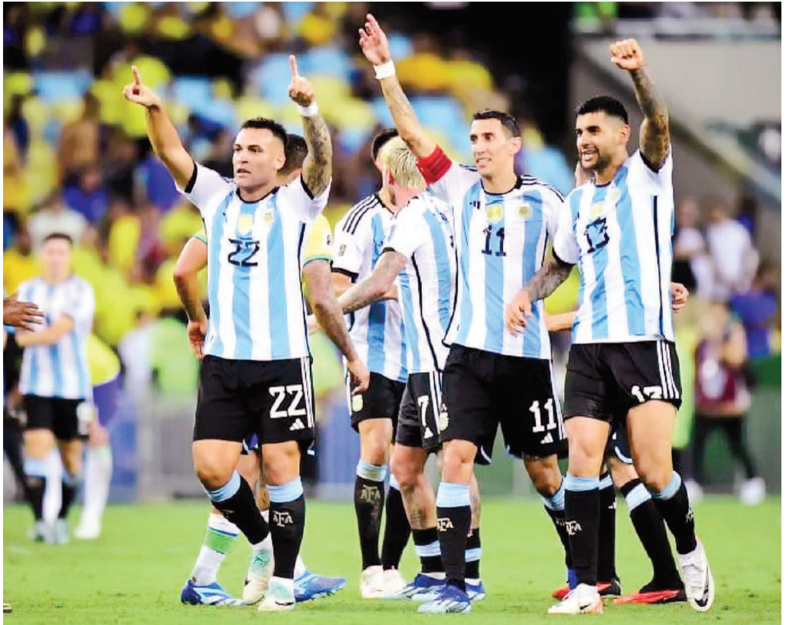
El triunfo de Argentina en el Maracanã y un recuerdo latente, en el corazón de un equipo que busca continuar haciendo historia a nivel mundial.

El anteúltimo encuentro de El Salvador fue un partido amistoso en febrero ante Costa Rica, en el que perdió por 2-0. Asimismo, este miércoles se midió con Bonaire y, luego del compromiso contra la Selección, enfrentará el 26 de marzo a Honduras. Se trata de un rival de escasa jerarquía cuyas únicas participaciones en Copas del Mundo fueron en México 1970 y España 1982: perdió los seis cotejos que disputó.