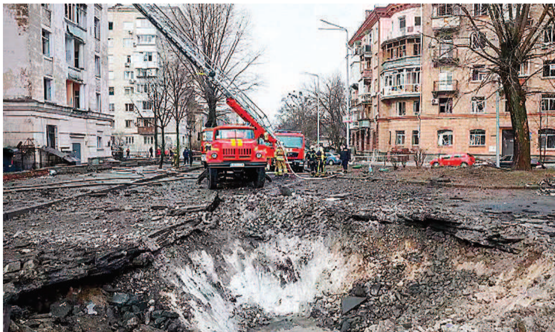
Los restos de los misiles cayeron en la ciudad y dejaron cráteres en las calles.

Los sistemas de defensa lograron derribar todas las amenazas -dos misiles balísticos y 29 de crucero que, a pesar de ser lanzados desde distintos puntos, llegaron en el mismo momento al cielo de Kiev- por lo que no se informó de muertes. Sí hubo, sin embargo, más de 25.000 personas que huyeron de sus hogares en busca de refugio en las estaciones de subte y 13 heridos. Entre ellos, precisó el alcalde Vitali Klitschko, se encuentran una niña de 11 años y un hombre de 38 que fueron hospitalizados, y otros ocho con heridas leves.