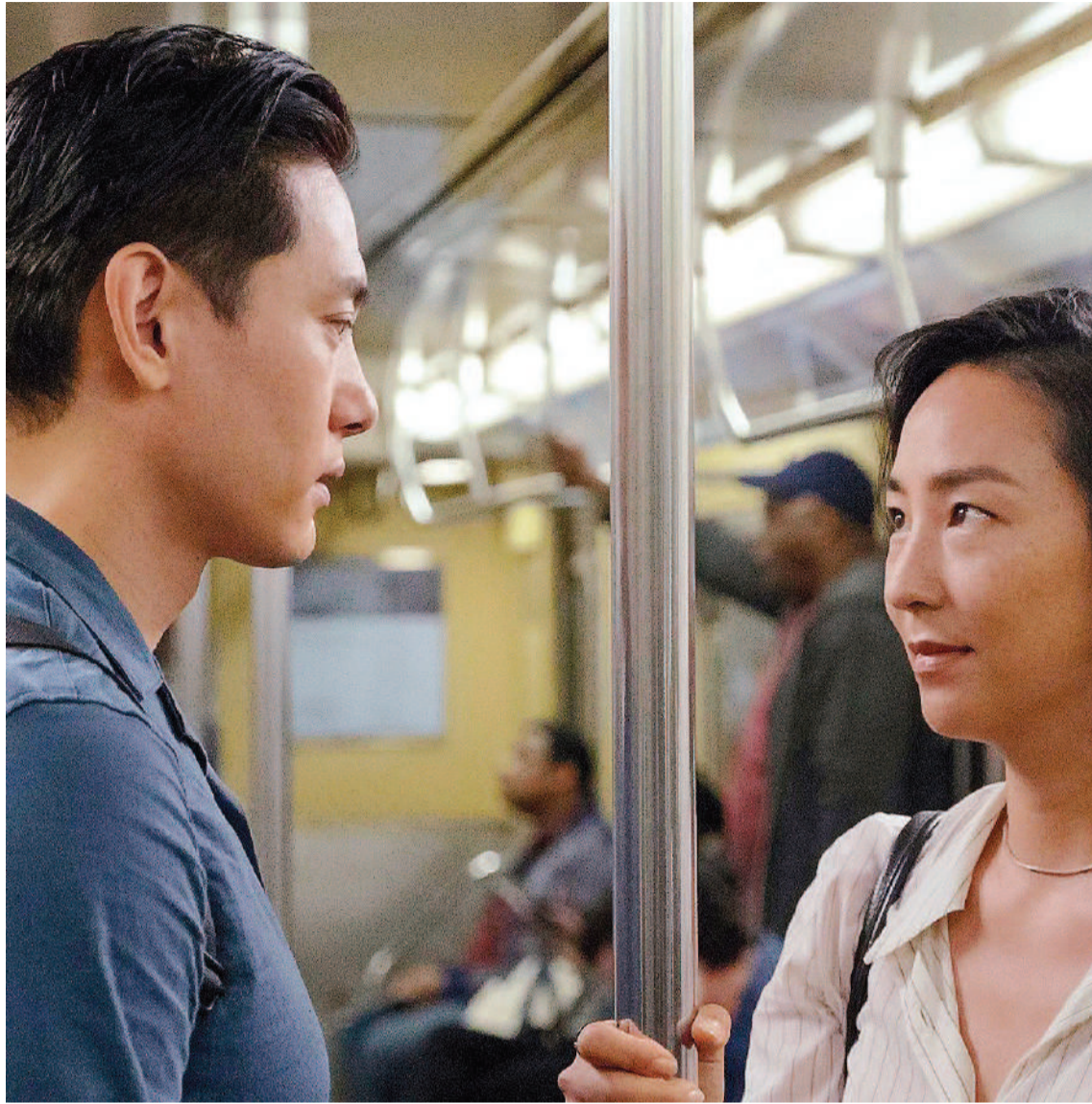
"Vidas pasadas", diariamente en cine Círculo.

Sala 1 15.00 (sab y dom) | 17.00 | 19.00