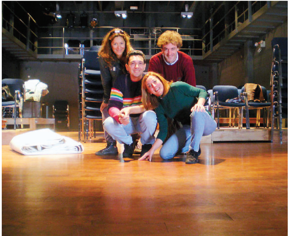
La recordada bailarina, docente e investigadora que hoy será objeto de homenaje (centro) junto a un grupo de colegas que la acompañaron en su tarea.

Actualmente funciona en calle La Paz 619 gracias a la existencia de un inmueble que donó la familia Kuttel destinándose el mismo a ser sede del organismo que se propone propiciar la divulgación de todas las artes en general, lo cual incluye todo tipo de danzas, teatro, manifestaciones plásticas, artes escénicas y cualquier discipli-