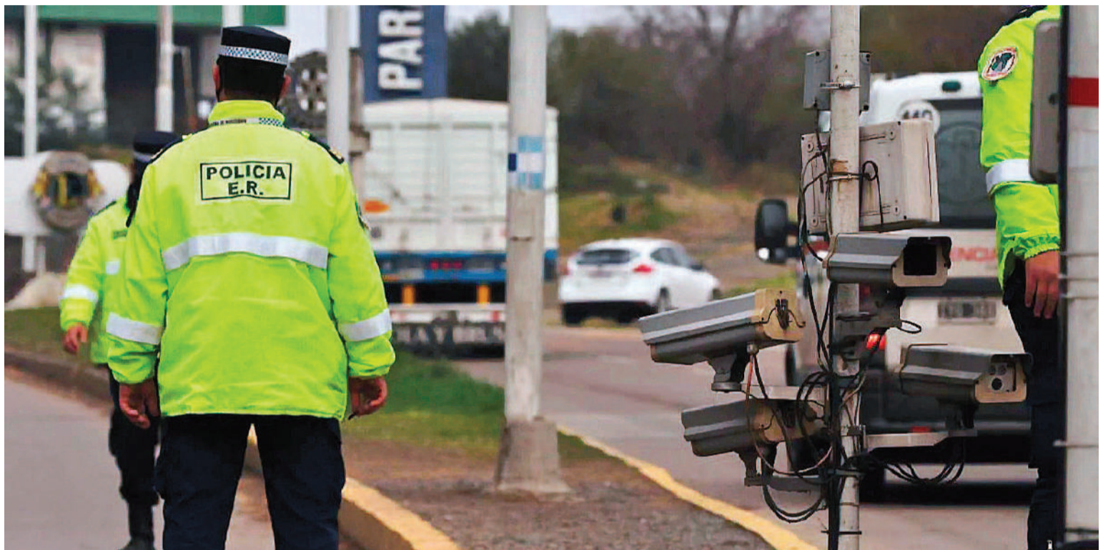
Eficaz control de la policía entrerriana en un control rutinario.

La “Banda de los Rompevidrios”, integrada por tres tucumanos, cruzó el Túnel Subfluvial el miércoles por la mañana, en una camioneta Volkswagen Amarok y al detenerse en el puesto caminero, donde se realizaba un control rutinario, los uniformados notaron que los hombres estaban muy nerviosos y se dispararon las sospechas mientras cambiaron su versión sobre su ingreso al territorio entrerriano.