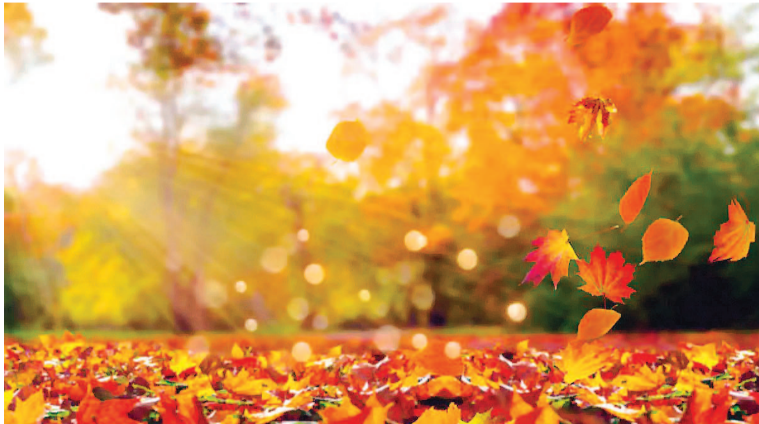
El otoño se caracteriza por temperaturas más bajas y la caída de las hojas de los árboles.

Generalmente, esta estación representa una transición hacia el invierno con temperaturas más bajas. Qué pronosticó el Servicio Meteorológico Nacional.