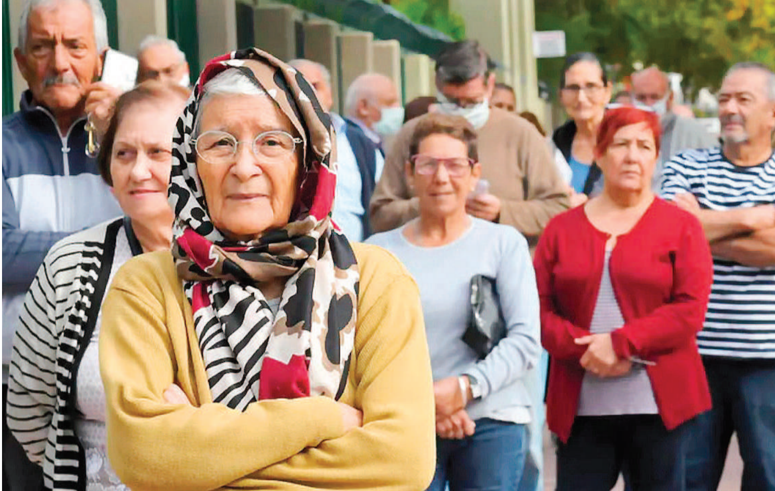
Los jubilados con haber mínimo comenzarán a cobrar el 10 de abril, mientras que aquellos que superan este momento lo harán a partir del 24.