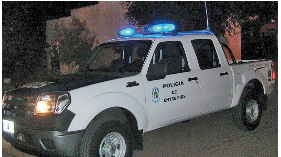
El peón fue encontrado en una zona rural y rápidamente intervino la policía.