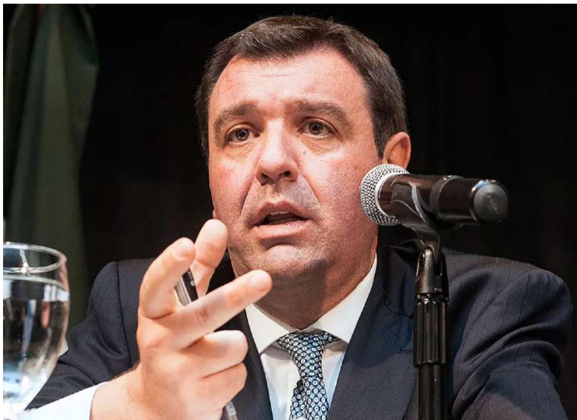
Ariel Lijo fue propuesto por Milei para asumir el cargo en el máximo tribunal.

El comunicado oficial, difundido a las 13:40, la Oficina del Presidente oficializó la propuesta y aseguró: "Los cambios que la Argentina necesita para volver a los princi-