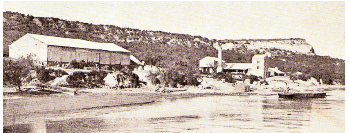
Lugar señalado como de la muerte de Juan de Garay (revista Caras y Caretas, 16 de junio de 1900).