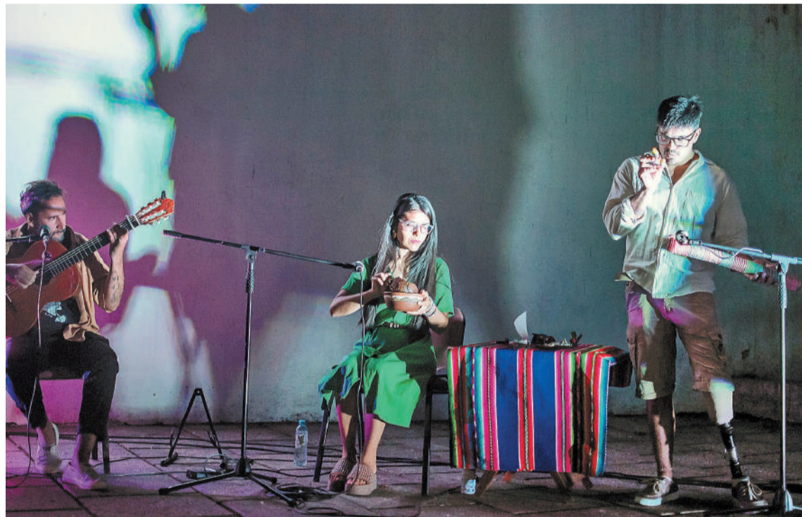
El grupo Evocación Litoral propone generar conciencia sobre la importancia del agua y otros recursos naturales a partir del arte.

El agua, subrayan “es el común denominador de todo lo que está vivo, y a su vez, las aguas expresan la sensibilidad de lo que éste sistema depredador nos está provocan-