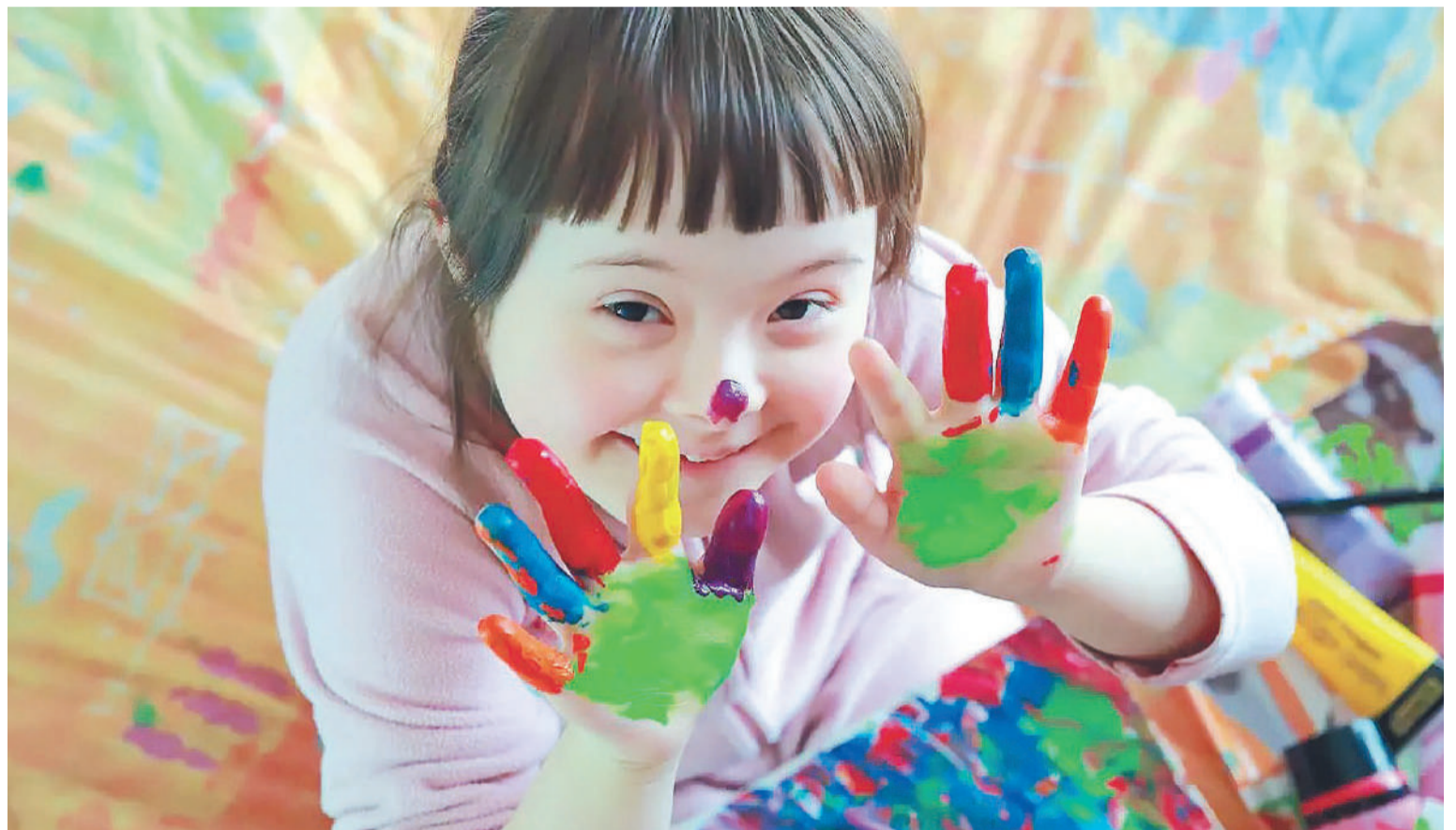
El 21 de marzo se conmemora el día Mundial del Síndrome de Down, para generar conciencia sobre la condición y la inclusión social.

Las personas con esta condición sufren de discriminación a diario, proveniente de la falta de entendimiento y comprensión. Francisco