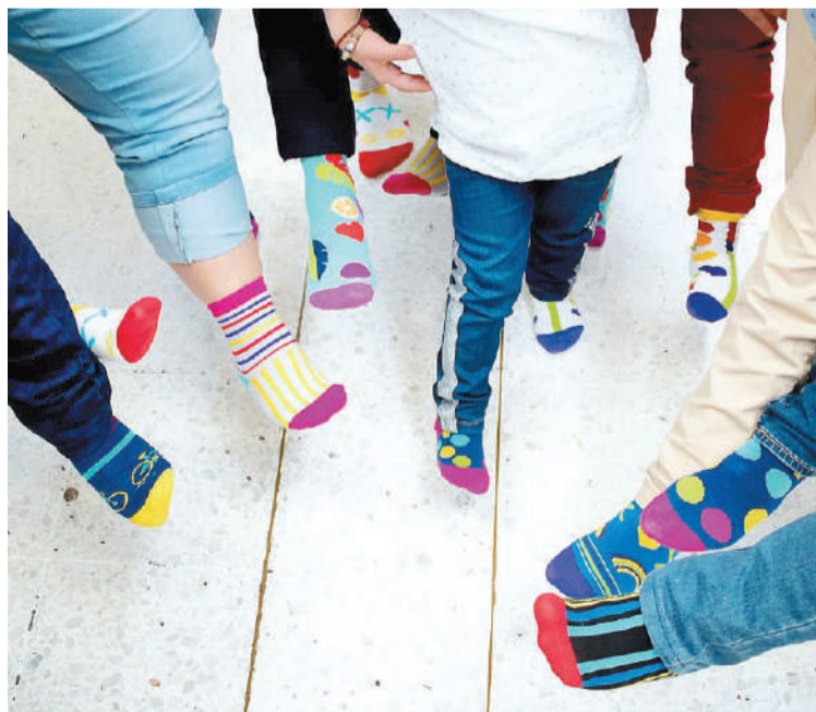
La propuesta de utilizar dos medias de distinto color el 21 de marzo fue realizada por una niña con síndrome de Down en el 2018.

También se iluminarán con el verde característico que representa