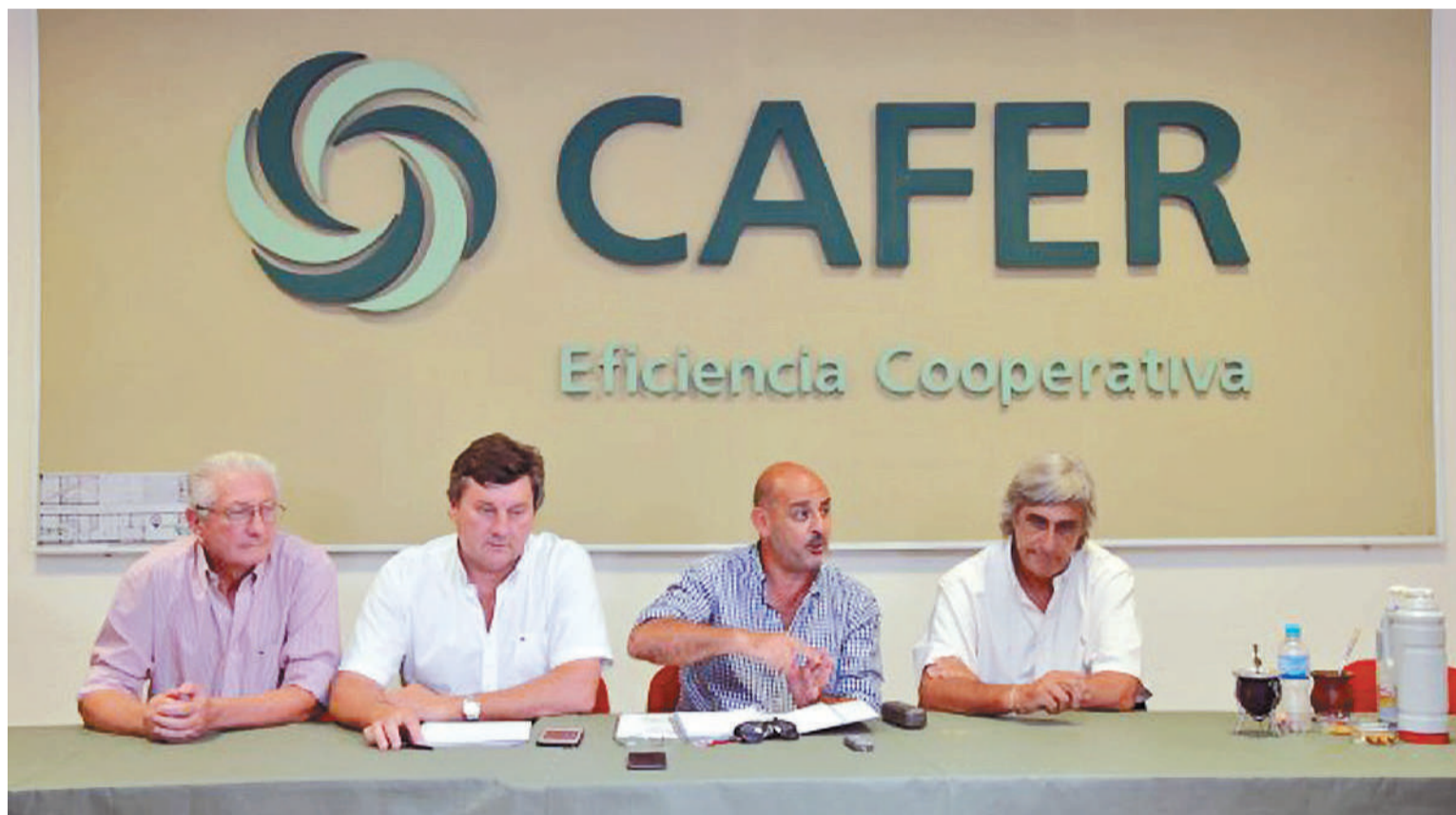
Las entidades nucleadas en la Mesa de Enlace de Entre Ríos manifestaron su descontento ante una posible suba tributaria.

EMERGENCIAS. En esa línea, los productores entrerrianos nucleados en la Mesa de Enlace sostuvieron que vienen “de hacer frente a tres emergencias agropecuarias consecutivas con pérdidas parciales o to-