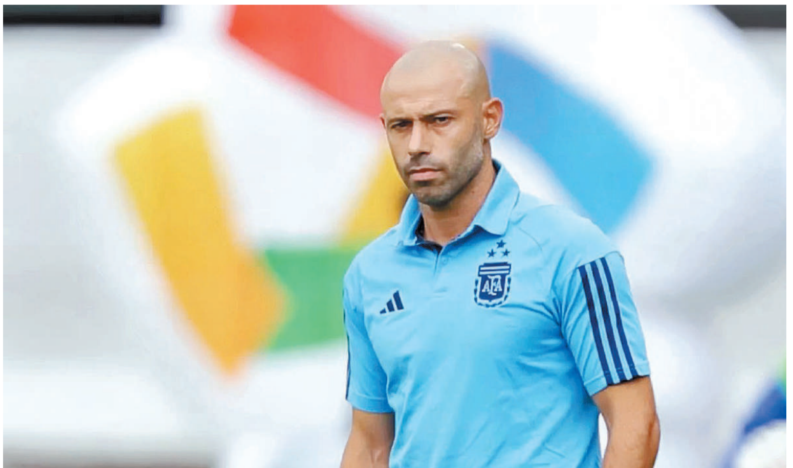
El seleccionado argentino Sub23, conducido por Javier Mascherano, ya conoce quienes serán sus tres rivales en la fase de grupos de los Juegos Olímpicos de París 2024.

El equipo de Javier Mascherano enfrentará a Marruecos, al tercer mejor asiático y a Ucrania, por el Grupo B de la competencia. La ceremonia se realizó ayer en el Saint-Denis, Francia. El debut será el 24 de junio ante el combinado africano en Saint Étienne.