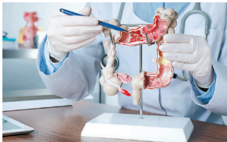
Los fuertes dolores abdominales son un signo de la presencia de la enfermedad.

-Realiza ejercicios casi todos los días de la semana: Intenta hacer, al menos, 30 minutos de ejercicio casi todos los días. Si has estado inactivo, comienza lentamente e incrementa el ritmo de manera gradual hasta alcanzar 30 minutos. Además, consulta con tu médico antes de comenzar un programa de ejercicios.