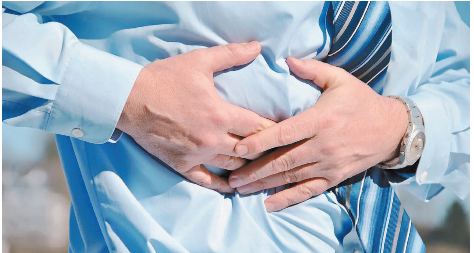
El cáncer de colon suele manifestarse después de los 50 años, aunque hay muchos casos precoces.

Según la Clínica Mayo, uno de los primeros síntomas que pueden manifestarse son los cambios en los hábitos intestinales. Esto puede incluir diarrea persistente, estreñi-