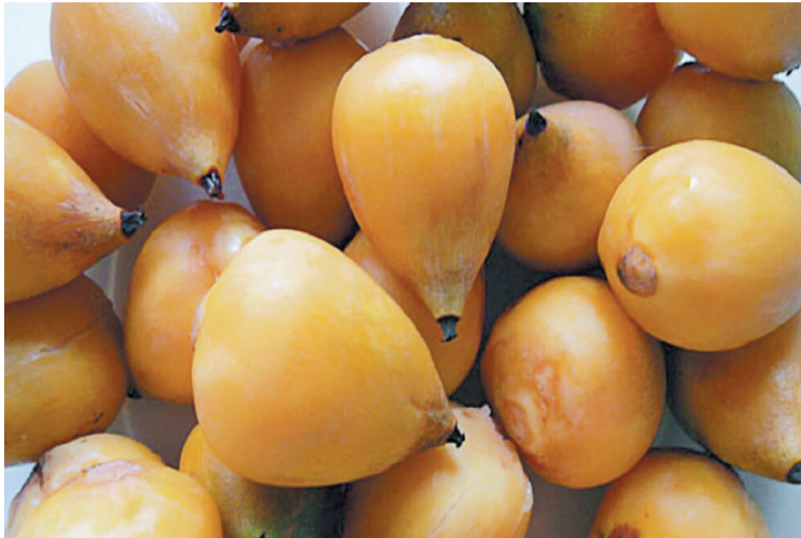
El fruto de la palmera butia yatay que hay en nuestra región es de sabor ácido-dulce e intenso.

sidad Nacional de Entre Ríos y en el plan Ciencia y Tecnología contra el Hambre, se está trabajando en pos de generar alimentos e ingredientes que impulsen la vinculación del sector científico-tecnológico con las localidades de la costa del río Uruguay.