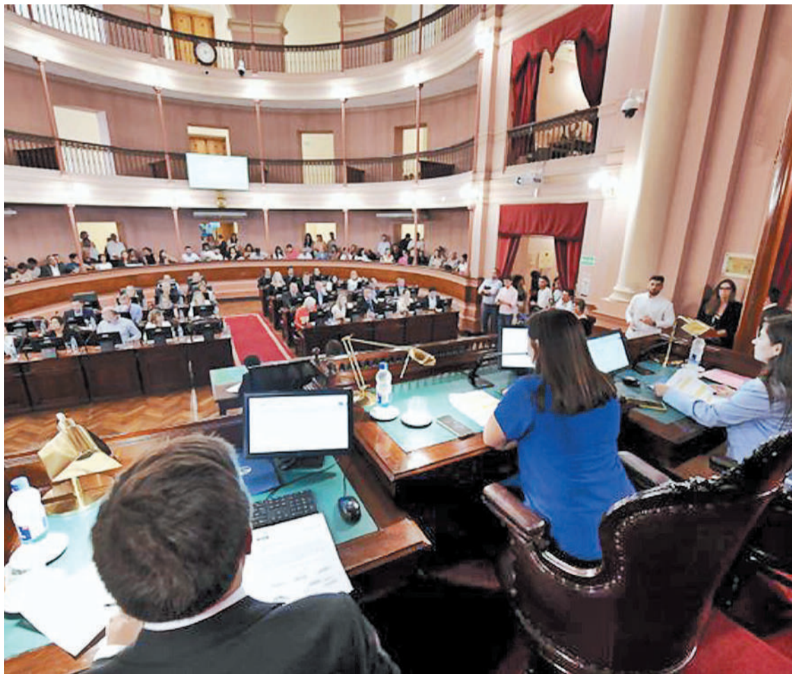
Diputados trataría hoy el proyecto de emergencia en obras públicas.