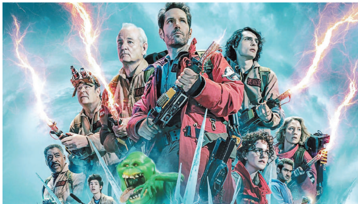
Apocalipsis Fantasma, estreno en Cine Círculo y Sunstar.

Desde hoy se expondrá la muestra gráfica La Mitad del Mundo en el Museo Provincial Hogar Escuela Eva Perón en el horario de 9 a 13. Se podrá visitar hasta el 15 de abril. La invitación es al público en general y especialmente a instituciones educativas. La muestra busca rescatar el aporte de mujeres que marcaron hitos en el desarrollo de la ciencia y fueron pioneras en la lucha por la igualdad y la inclusión de la mujer en el ámbito científico en Argentina y el mundo.