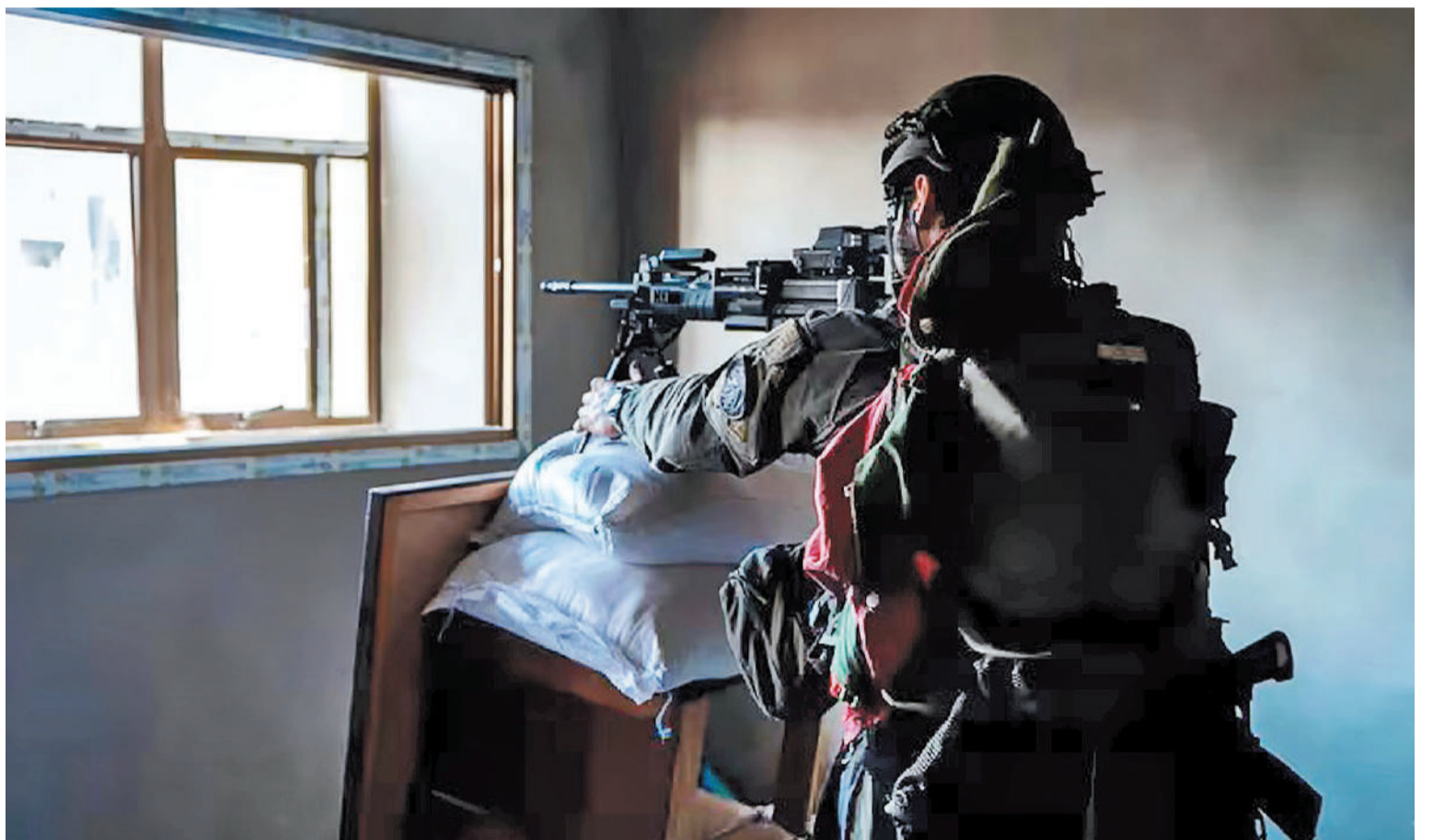
Gran despliegue militar del ejército israelí para hacerle frente a la organización Hamas en un punto estratégico de Gaza.

nuevos ataques el martes en el centro de Gaza, en el norte en Jabalia, donde las tropas dirigieron un avión “para atacar y eliminar” a seis terroristas, según un comunicado.