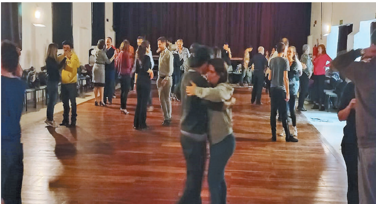
El miércoles a las 21, en La Vieja Usina, práctica de tango.