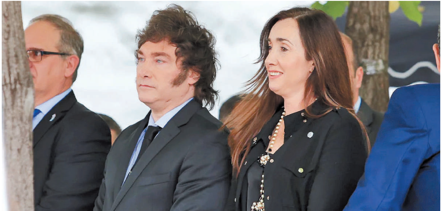
Milei junto a Villarruel fueron dos de los protagonistas más sobresalientes del acto.

DETALLES. El acto estuvo citado a las 14:30 y comenzó con especial puntualidad. Hubo campanadas de la Iglesia del lugar seguido de un minuto de silencio. A las 14:45 sonó la sirena para recordar el momento exacto en que se perpetró el ataque terrorista en el verano de 1992. La conmemoración se desarrolló en la plaza ubicada en la esquina de Arroyo y Suipacha, epicentro del atentado. A las 14:10, una larga hilera de vehículos negros, con patente oficial, arribaron al lugar. El Presidente bajó de su auto escoltado por Karina Milei, su hermana y la secretaria general de la Presidencia. Un grupo con decenas de personas de la seguridad presidencial rodearon en todo momento al je-