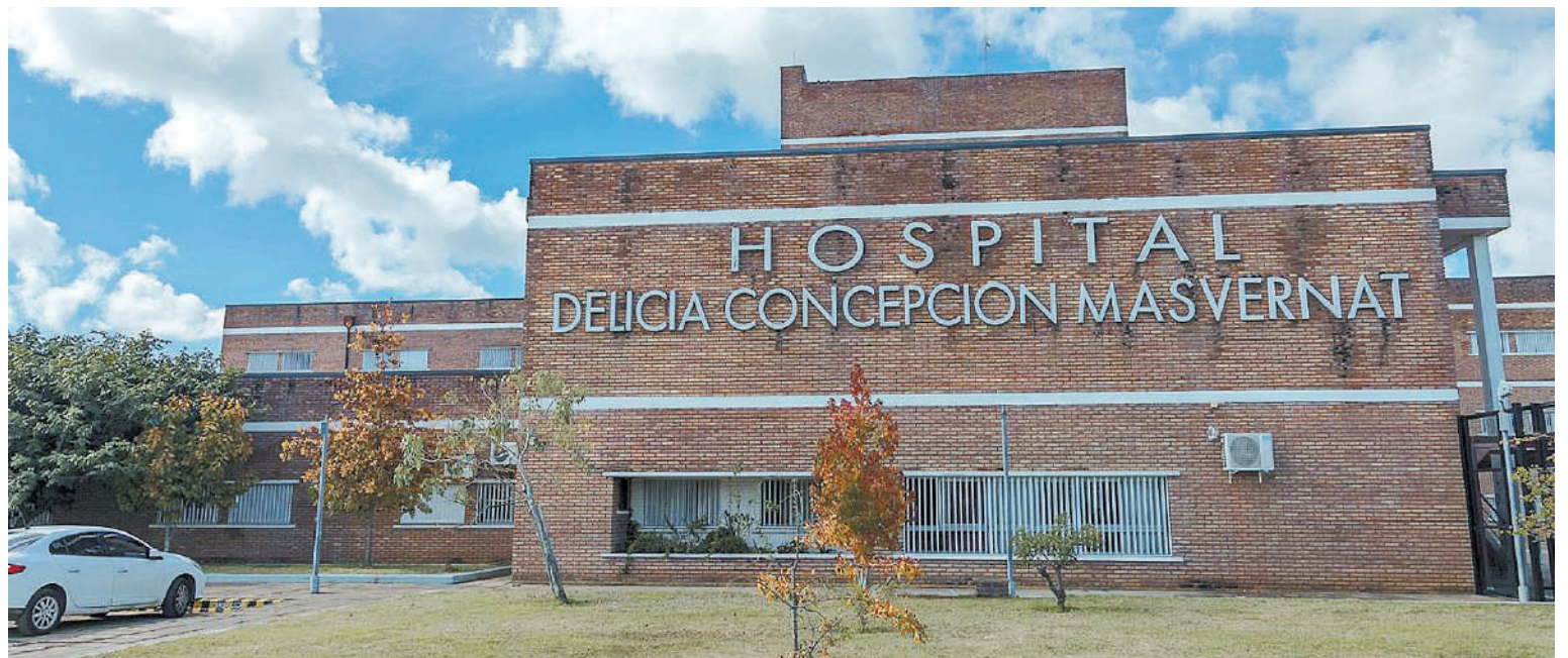
El paciente con dengue falleció en el hospital Masvernati, de Concordia.

Cabe señalar que en la última semana se registraron 2.163 nuevos casos de dengue, según informó el Ministerio de Salud de Entre Ríos. En el monitor disponible en: https://www.entrierios.gov.ar/msalud/monitorcovid-19/index.html , se refleja que en el período comprendido entre el 1 de agosto de 2023 y el 17 de marzo de 2024, la provincia registra un total acumulado de 5.292 casos. En los últimos siete días, los departamentos que evidenciaron una mayor can-