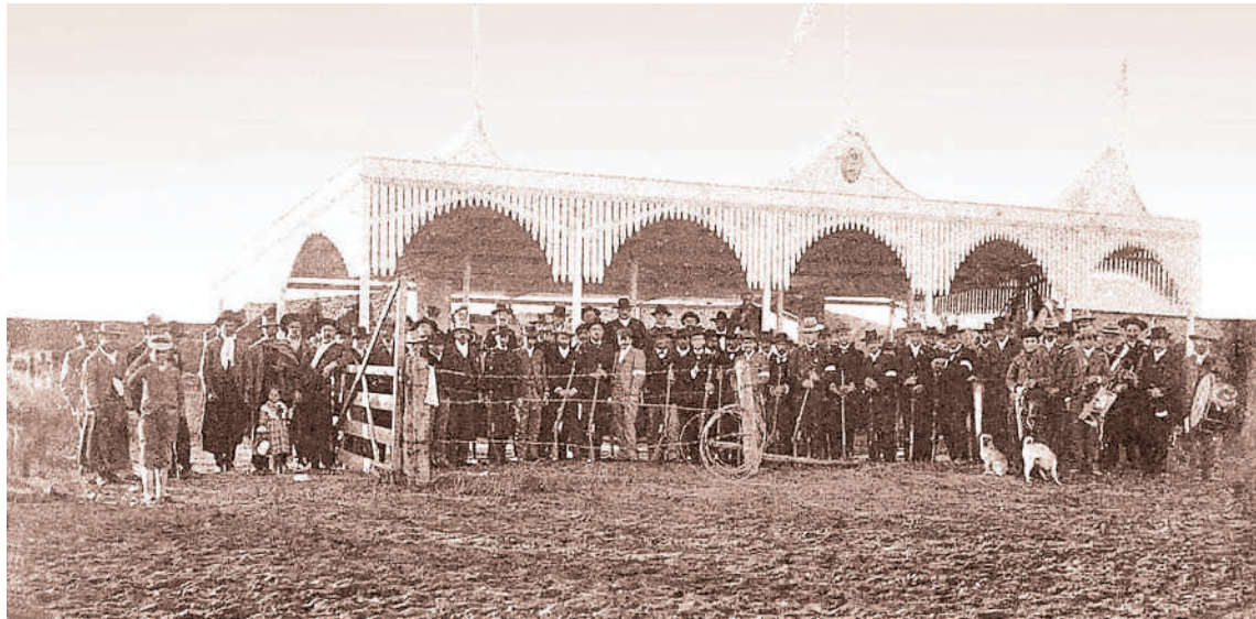
Tiro Federal Argentino en la Colonia San José (Región Litoral).