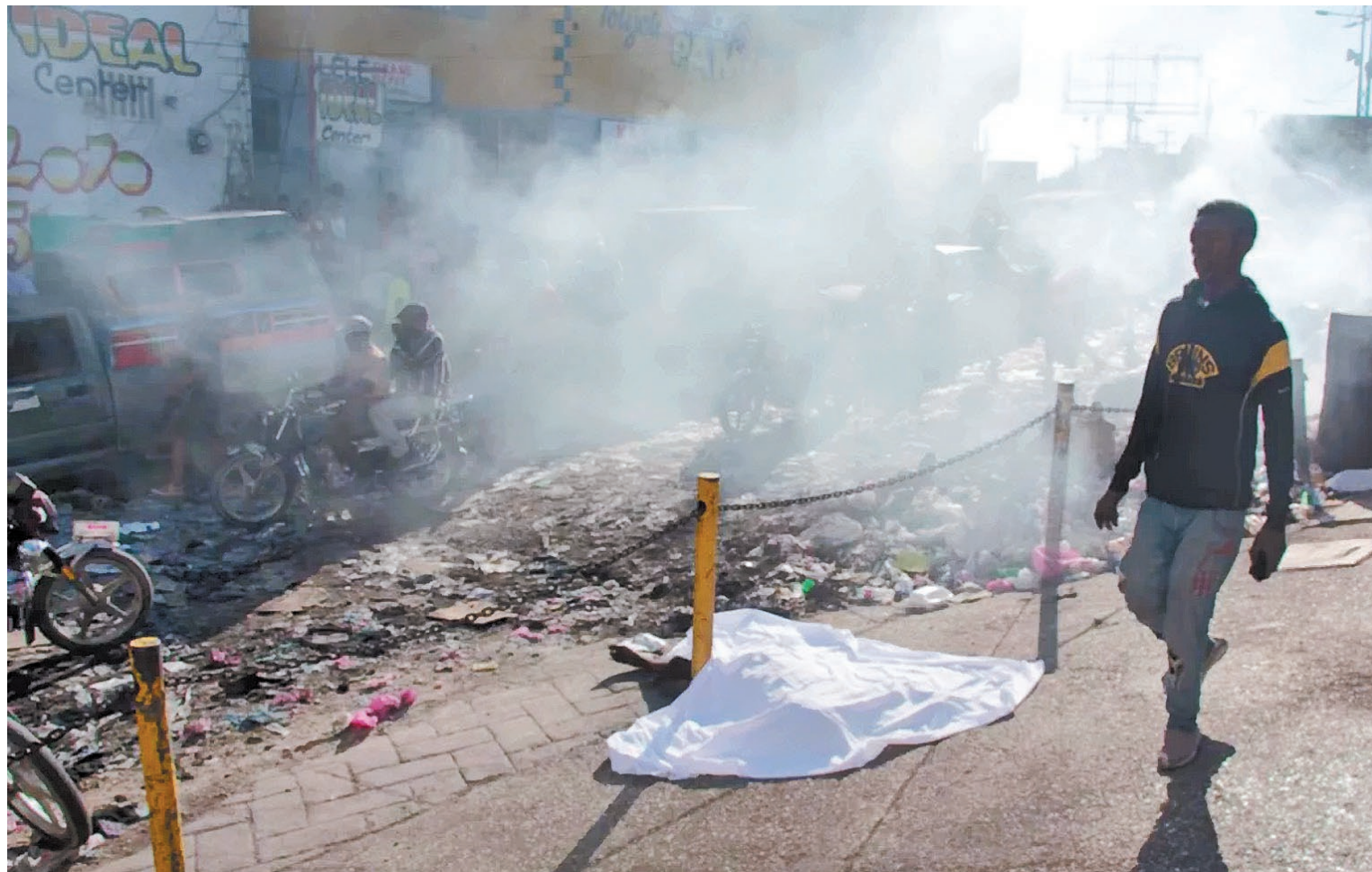
Más de una decena de cuerpos fueron encontrados en diferentes puntos de zonas residenciales de la capital de Haití