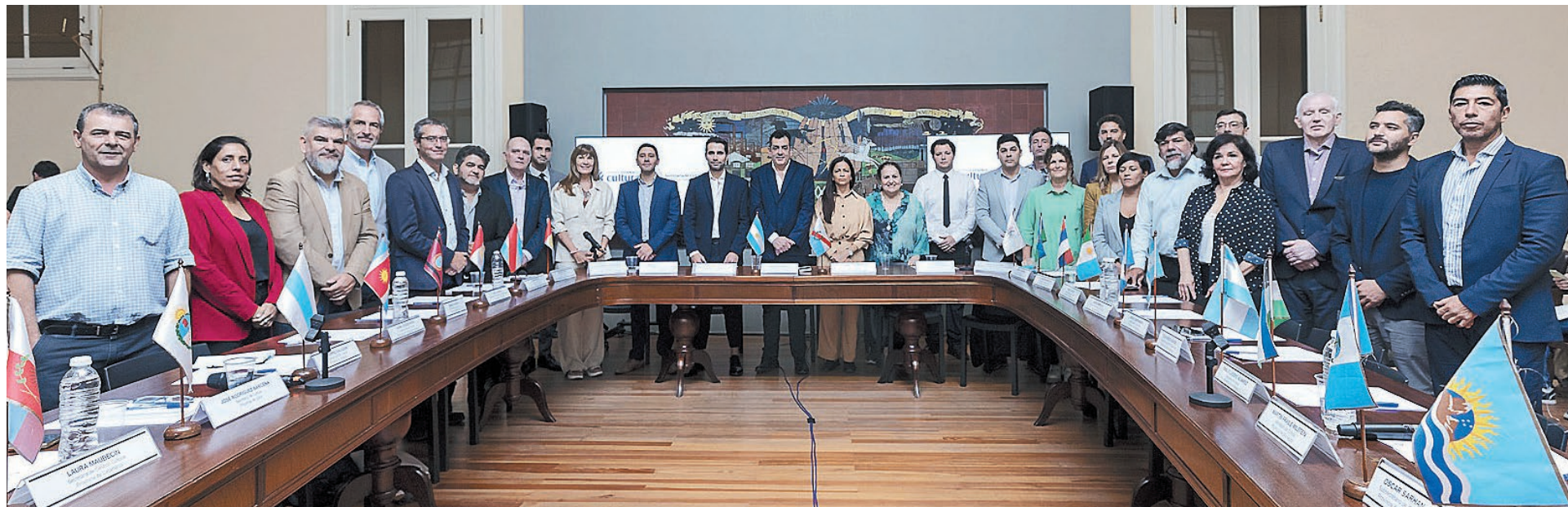
El encuentro reunió en el Centro Cultural Kirchner contó con la participación de los secretarios de Cultura de las provincias y del titular del área a nivel nacional.