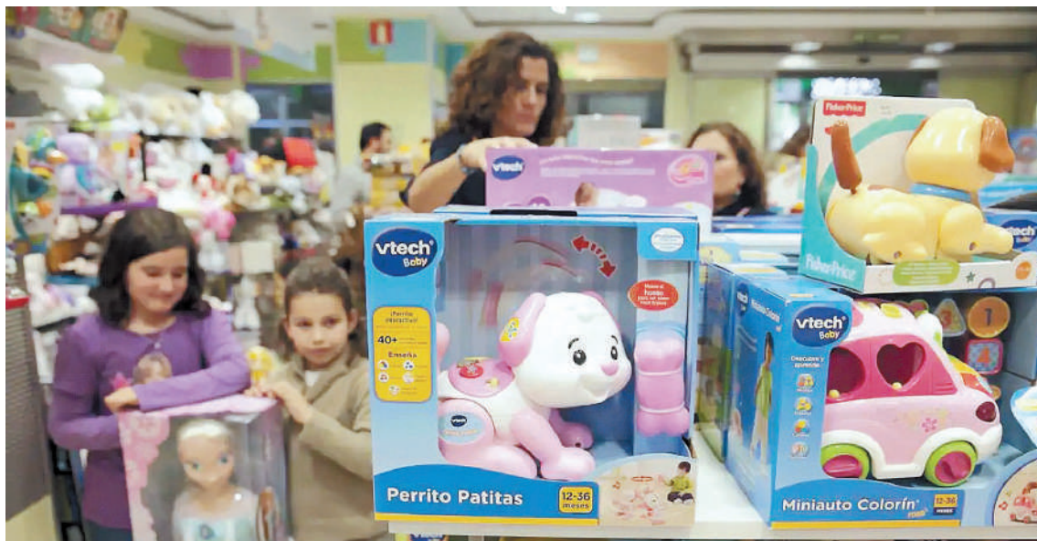
Los juguetes inteligentes tienen acceso a internet y eso puede ser un riesgo para los niños.

Uno de los riesgos identificados fue la capacidad de los atacantes para realizar videollamadas a estos juguetes inteligentes. El siste-