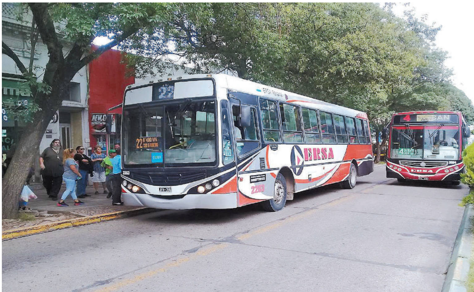
No habrá medida de fuerza de los choferes de colectivos en el Área Metropolitana.

porte público, por lo que se dispusieron acciones de intimación y fiscalización para que la empresa se responsabilice del conflicto laboral y salarial que los atañe”.