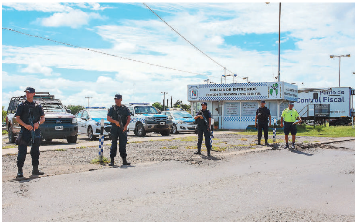
Las Fuerzas Federales y Fiscalía unifican las tareas para llevar adelante los operativos.

El ministro de Seguridad y Justicia, Néstor Roncaglia, dialogó con autoridades municipales, provinciales, de las Fuerzas Federales y Fiscalía para prevenir delitos de narcotráfico en esa ciudad y garantizar mayor seguridad para la ciudadanía.