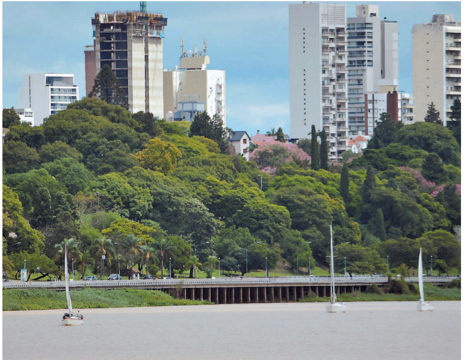
La costanera paranaense se engalanó al recibir durante el mediodía dominical a los veleros cabinados provenientes de Villa Urquiza.

Veleros paranaenses y santafesinos comenzaron este fin de semana el Campeonato de Regatas-Crucero impulsado por el Club Náutico Paraná, con la prueba que fue desde Villa Urquiza a la capital entrerriana.