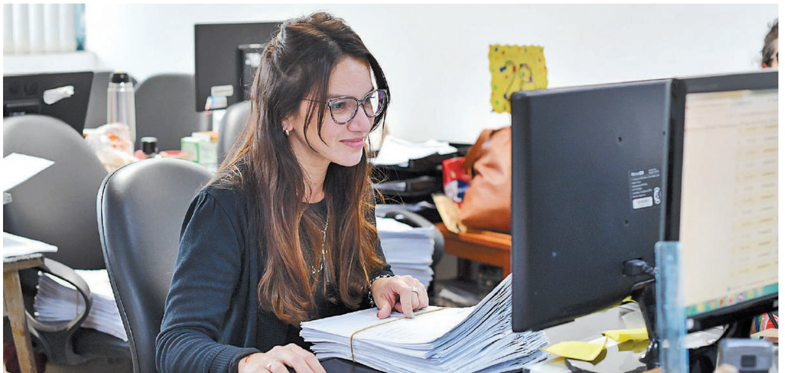
Con la vigencia de la nueva resolución, su aplicación se vuelve obligatoria en todos los sumarios, buscando optimizar la economía procesal.