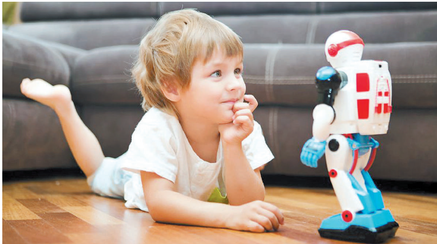
Un robot de juguete tenía diferentes vulnerabilidades que permitían que los ciberdelincuentes usaran sus cámaras y lo controlaran.