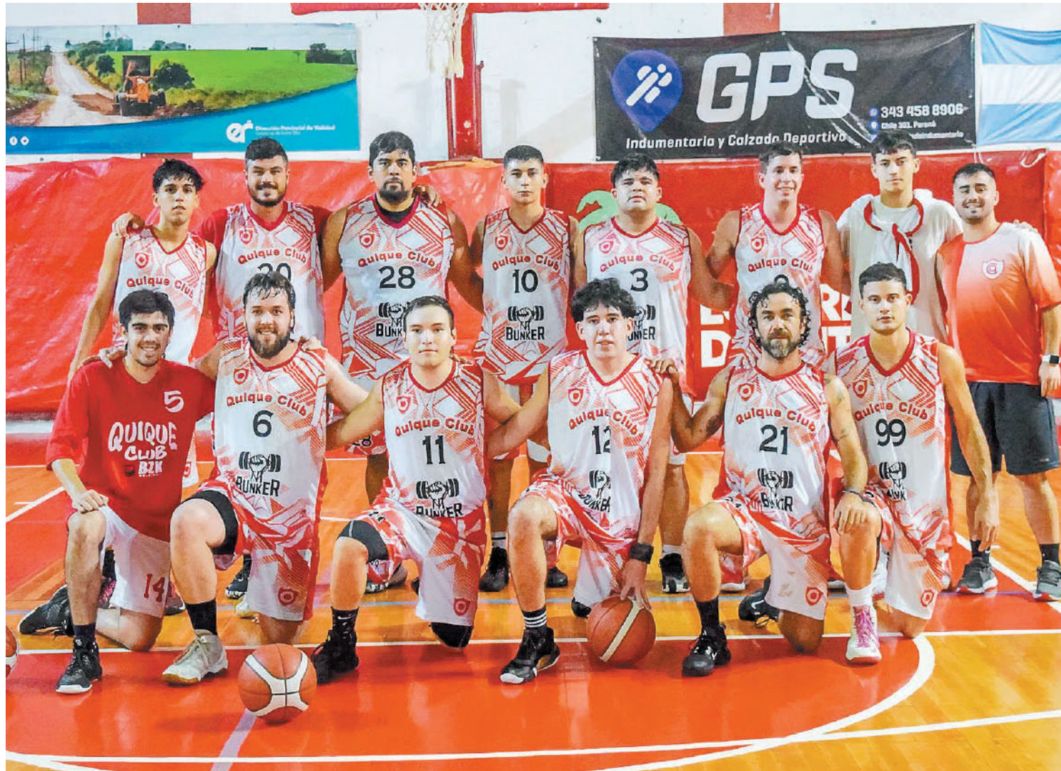
El flamante equipo C del Quique Club, tuvo un estreno victorioso en el Torneo Apertura "Néstor Meglio" de la APB.