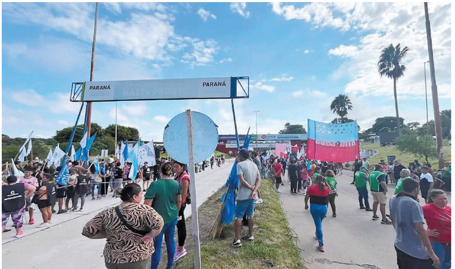
La capital entrerriana también fue parte del "Piquetazo nacional". Un gran número de manifestantes se concentraron sobre el acceso al Túnel Subfluvial.

críticos a las medidas del Gobierno en materia social, especialmente después de la decisión de la ministra de Capital Humano, Sandra Pettovello, de partir en dos programas el Potenciar Trabajo, estructura central a la que se destinaron miles de millones de pesos en los últimos años, a beneficiarios, pe-