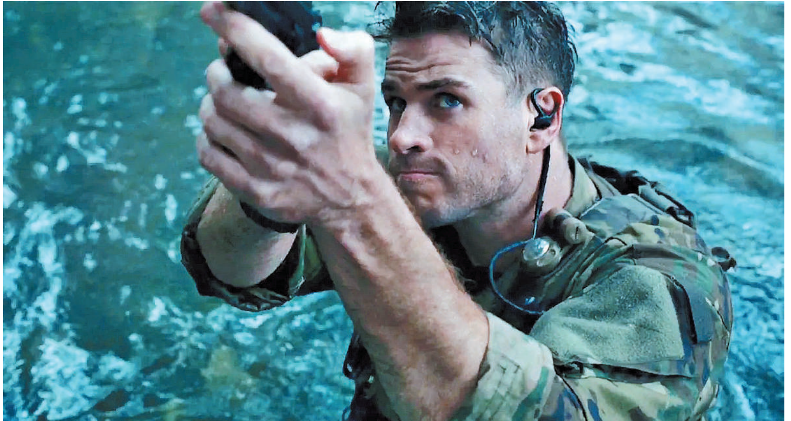
"Rescate imposible", diariamente en los cines Círculo y Sunstar.