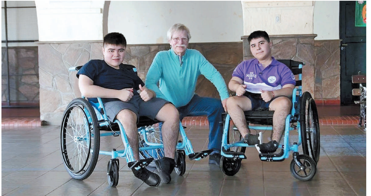
#CONCIENCIAVIRAL: La campaña en Tik Tok de la ONG CILSA y la agencia VML junto a Todo Versus

Cabe destacar que la ley N° 24314, reafirma que todas las personas con