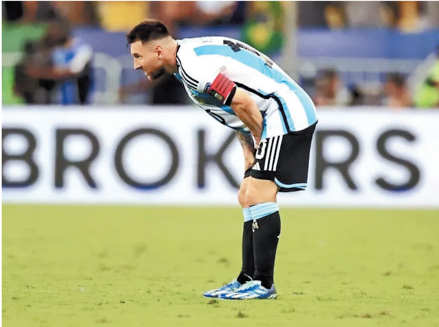
El astro rosarino no será de la partida en la nómina nacional en los amistosos por Estados Unidos.

puertas para que pueda incorporarse de igual manera y estar cerca de sus compañeros, como sucede con Lisandro Martínez, quien viajó a tierras norteamericanas lesionado y consciente de que no va a poder sumar minutos en esta doble jornada, todo indica que Messi se quedará en Miami para seguir recuperándose de la lesión.