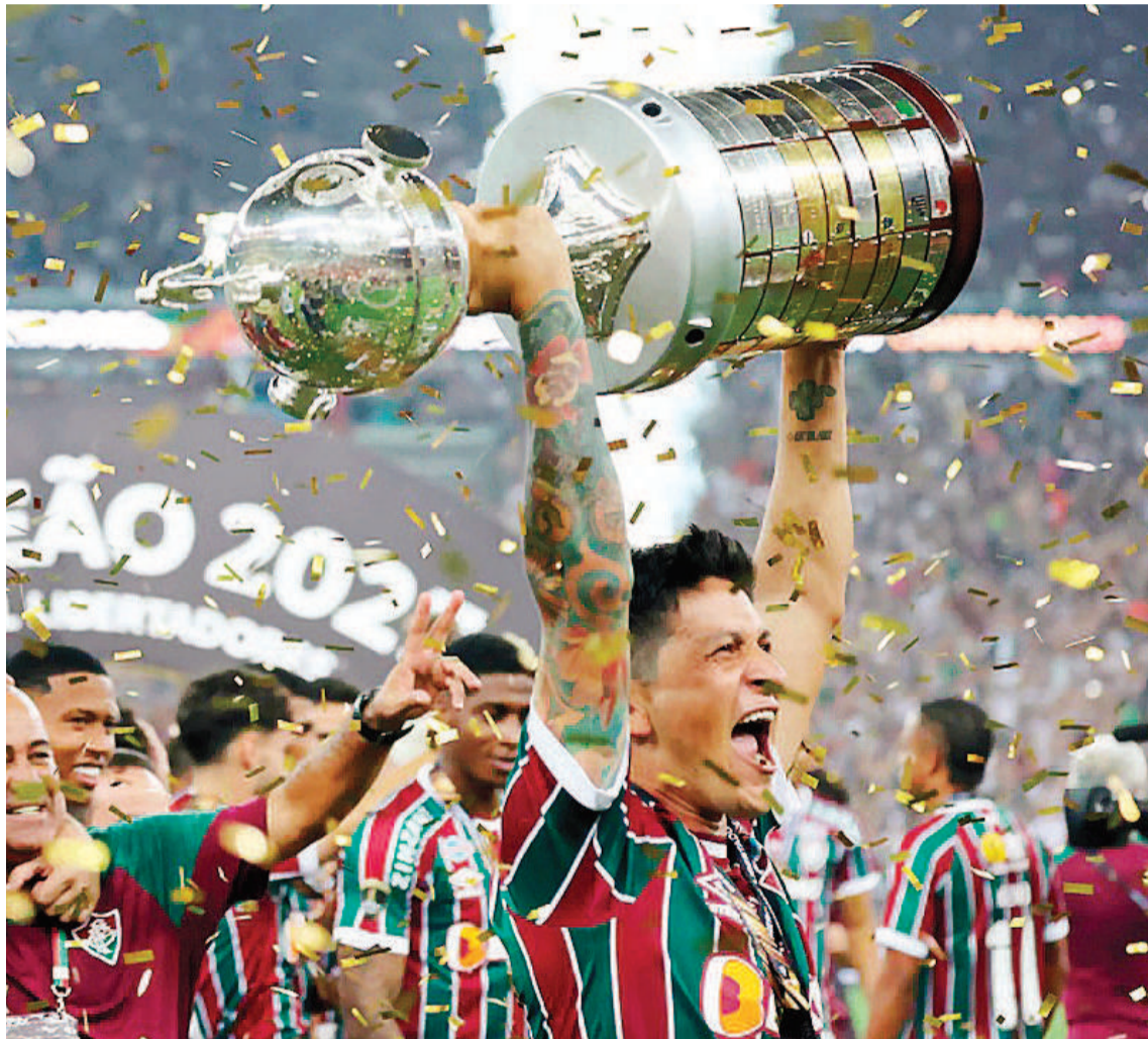
Fluminense de Brasil es el campeón defensor del título en la Copa Libertadores de América. El elenco de Río de Janeiro venció a Boca Junior en la final.

Bombo 2: Atlético Mineiro (BRA) - Ind. del Valle (ECU) - Libertad (PAR) - Cerro Porteño (PAR) - Estu-