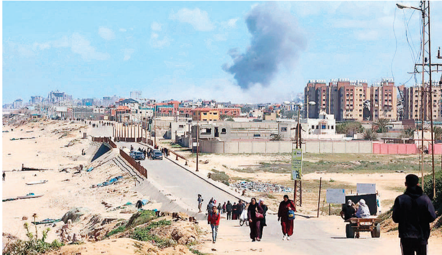
El humo se eleva tras un ataque israelí mientras los palestinos huyen del norte de Gaza.