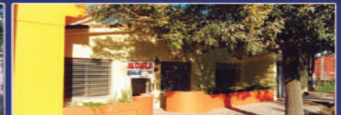
SAN BENITO GUIDO MARIZZA

Casa. 2 dorm, living, coc-comedor, patio, gas natural. Precio proximamente.