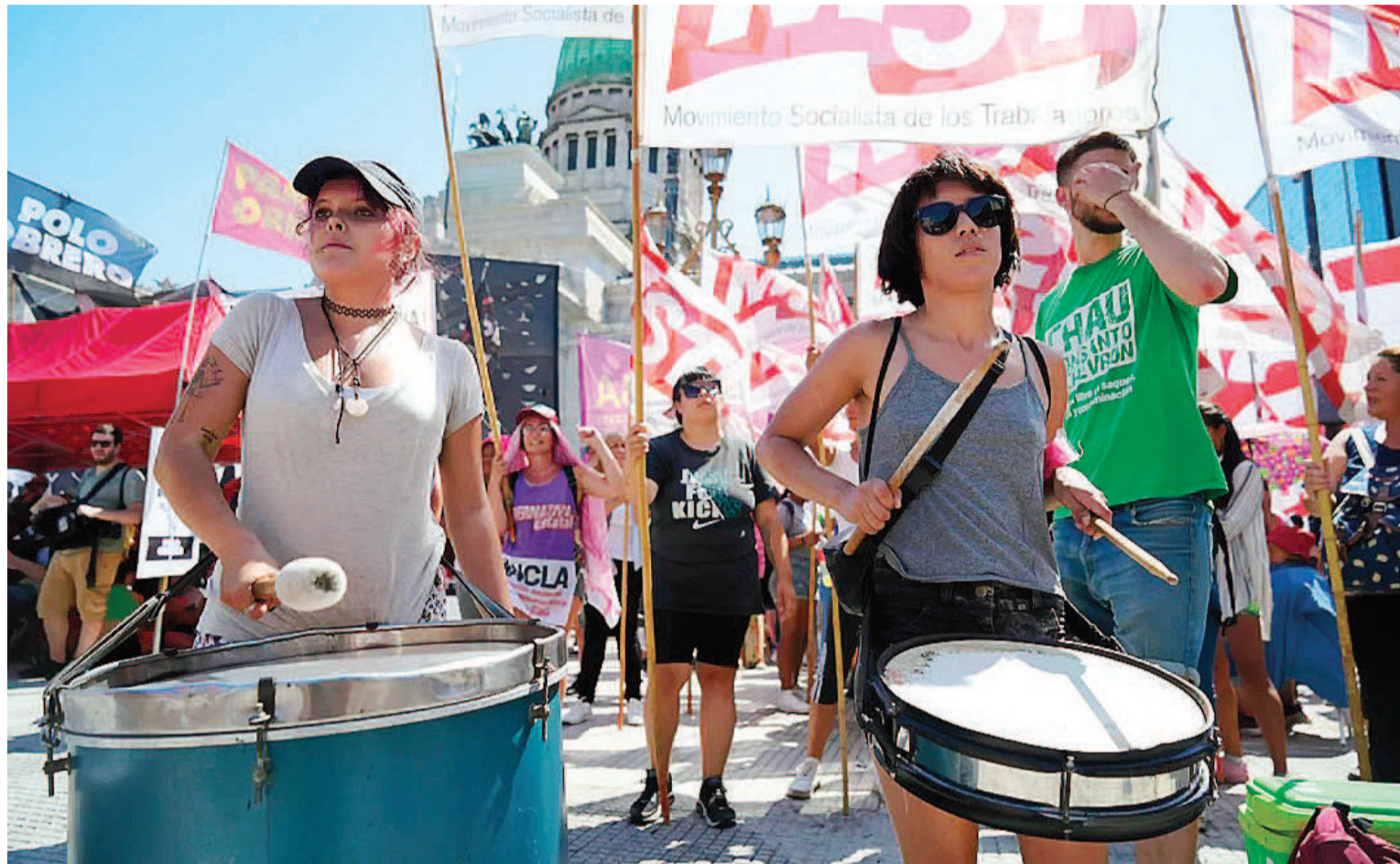
"El hambre es el límite", es la principal consigna de los piqueteros.

► SE HARÁN 500 CORTES EN TODO EL TERRITORIO NACIONAL