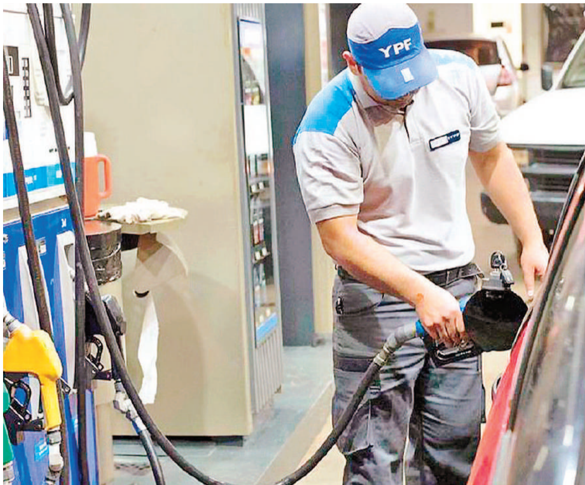
Lo que más preocupó en febrero fueron las subas de costos, especialmente en servicios y combustibles.

ANÁLISIS SECTORIAL. Cinco de los seis sectores manufactureros del segmento pyme relevados tu-