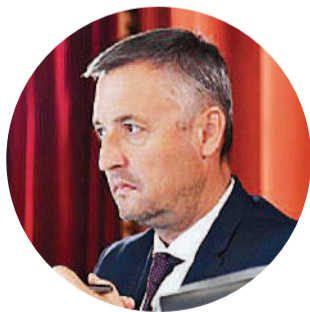
Gustavo Hein, presidente de la Cámara de Diputados de Entre Ríos

“La sociedad ya no tolera las viejas prácticas de la política”