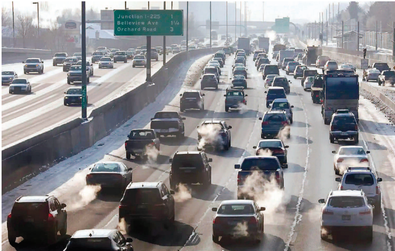
En algunas ciudades de Europa, ya existen las zonas de baja emisión, donde se aplican restricciones de tráfico para vehículos altamente contaminantes.