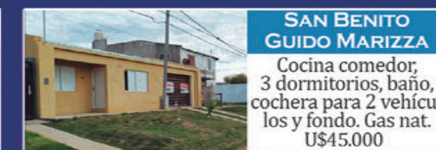
SAN BENITO GUIDO MARIZZA

Casa 1: Living 2 dorm, patio, cocina, espacio de comedor y fondo. Casa 2: Living cocina, 2 dor- mitorios y patio. USD 37.000