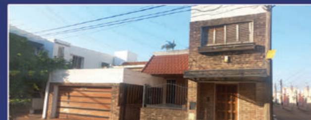
ROSARIO DEL TALA 441

Casa sobre Nogoyá de 3 dormitorios, living comedor, cocina comedor, cochera, galpón, de- pósitos, 2 patios. Sobre calle Zuviría: ingreso por pasillo, 2 galpones y fondo. Sup total 621 m2. USD 95.000