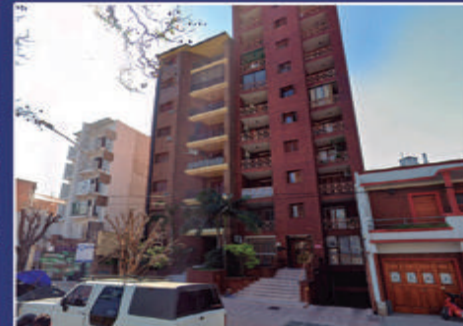
ANDRÉS PAZOS 367 FRENTE A PZA. DEL BOMBERO

Cocina con sector de lavadero, living comedor, 3 dormitorios con placares, baño. Listo para escriturar. USD 60.000