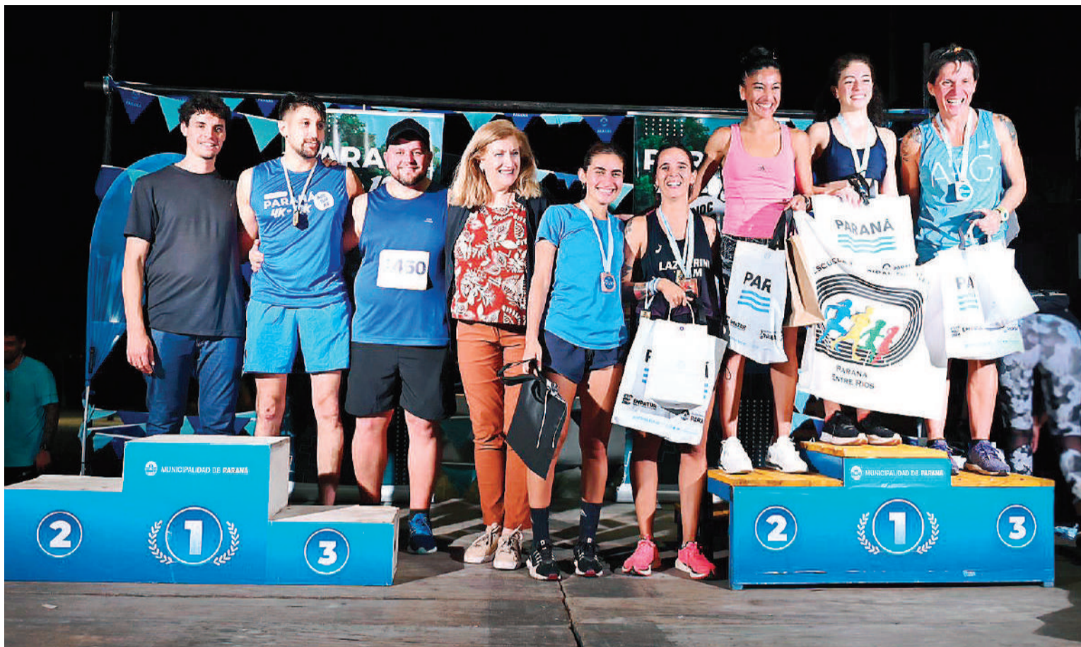
La Maratón Nocturna de la ciudad, volvió a convocar a una multitud que abogó por el deporte y la vida sana.