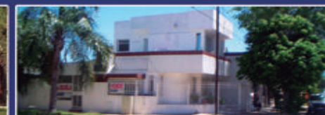
RAMIREZ Y ANDRES PAZOS

2 locales en alquiler, frente vidriado, rejas, puerta de vidrio y baño. 5x6. $ 150.000 c/u