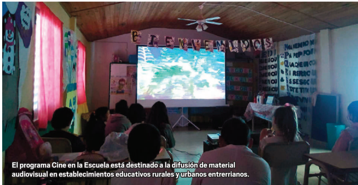
El programa Cine en la Escuela está destinado a la difusión de material audiovisual en establecimientos educativos rurales y urbanos entrerrianos.