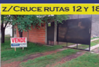
Z/CRUCE RUTAS 12 Y 18

San Benito. Casa de 2 dormitorios. Precio proximamente.