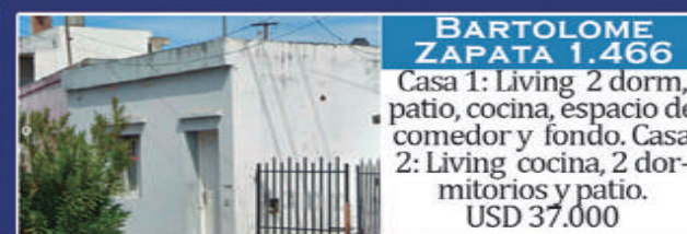
BARTOLOME ZAPATA 1.466

Living comedor, cocina, 2 dormitorios, baño, patio de luz y fondo, cochera descubierta. Gas env. 11,30x40. USD 40.000