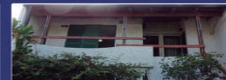
3 DE FEBRERO Y DON BOSCO

1 ambiente con sector de cocina y baño. $60.000