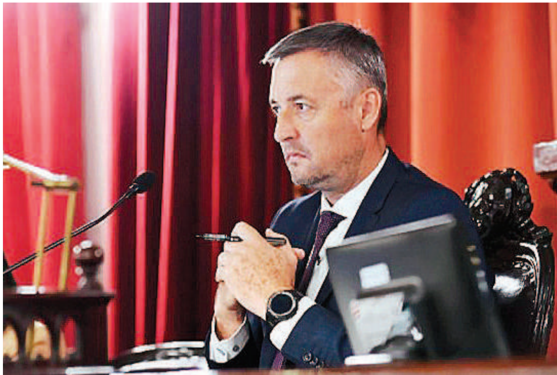
Hein: “La sociedad ya no tolera las viejas prácticas de la política, signadas por la difamación y la mentira”.

Allí señala el legislador que “quiero expresarles a los entrerrianos -a los que me debo como funcionario público- que siento el sinsabor de quien ha sido acusado falsamente, con una denun-