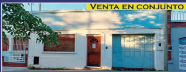
VENTA EN CONJUNTO

10,70x30. Total 321 Aprox. Entorno conformado. Está a 2 cuadras de Ruta 18. USD 6.000