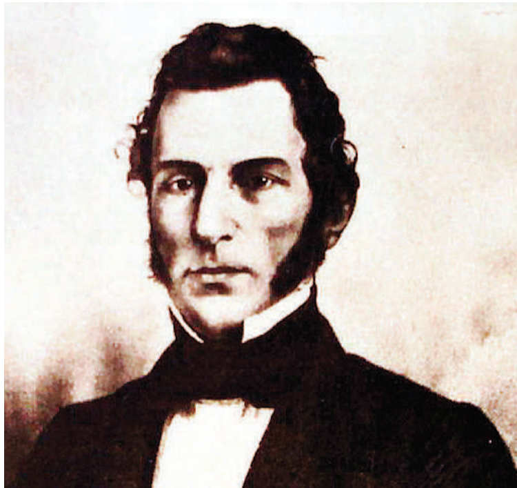
Valentín Alsina acusado de atentar contra Urquiza.

Estos atentados comenzaron en 1853. Cuando subterráneamente se trabajaba para hacer fracasar el sitio impuesto a la ciudad de Buenos Aires, se "trataba de quitar del medio al direc-