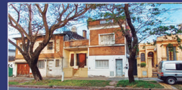
SAN JUAN 540

San Juan z/Colon. Excelente ubicación. Casa interna. 2 dormito- rios, cocina, comedor, patio de aire y luz. $180.000 + tasas