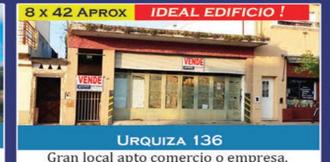
8 x 42 APROX IDEAL EDIFICIO !

Lote 10x30 en esquina, sobre asfalto, cimientos. Agua y Luz en la zona. USD 13.000