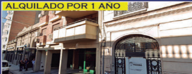
9 DE JULIO 61

Zona Alameda de la Federación. Duplex. 1 dormitorio, cocina comedor, antebañ, baño, patio. $290.000 + impuestos + expensas