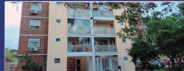
SAN MARTÍN Y PELLEGRINI 1

Departamento en microcentro. Living, comedor diario, cocina, 3 dormito- rios con placares, 2 baños, amplio balcón. Metros Totales 97,61. USD 180.000