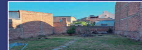
BROWN ZONA SOLER

Cocina comedor, 3 dormitorios, baño, cochera para 2 vehícu- los y fondo. Gas nat. $45.000