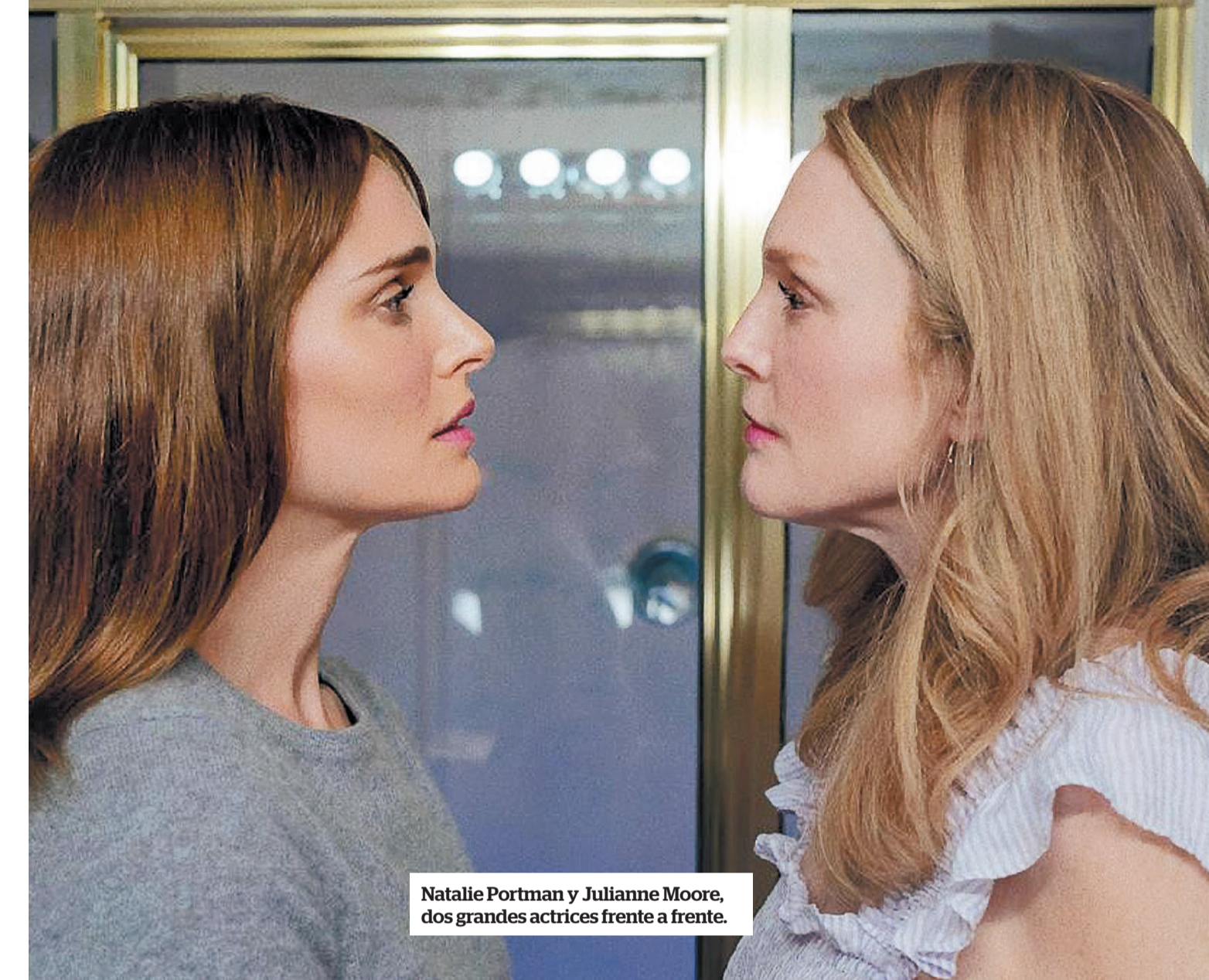
Natalie Portman y Julianne Moore, dos grandes actrices frente a frente.

"Todas las vidas, todas las familias, son el resultado de elecciones, e indagar en ellas, retomar ciertos temas, es un