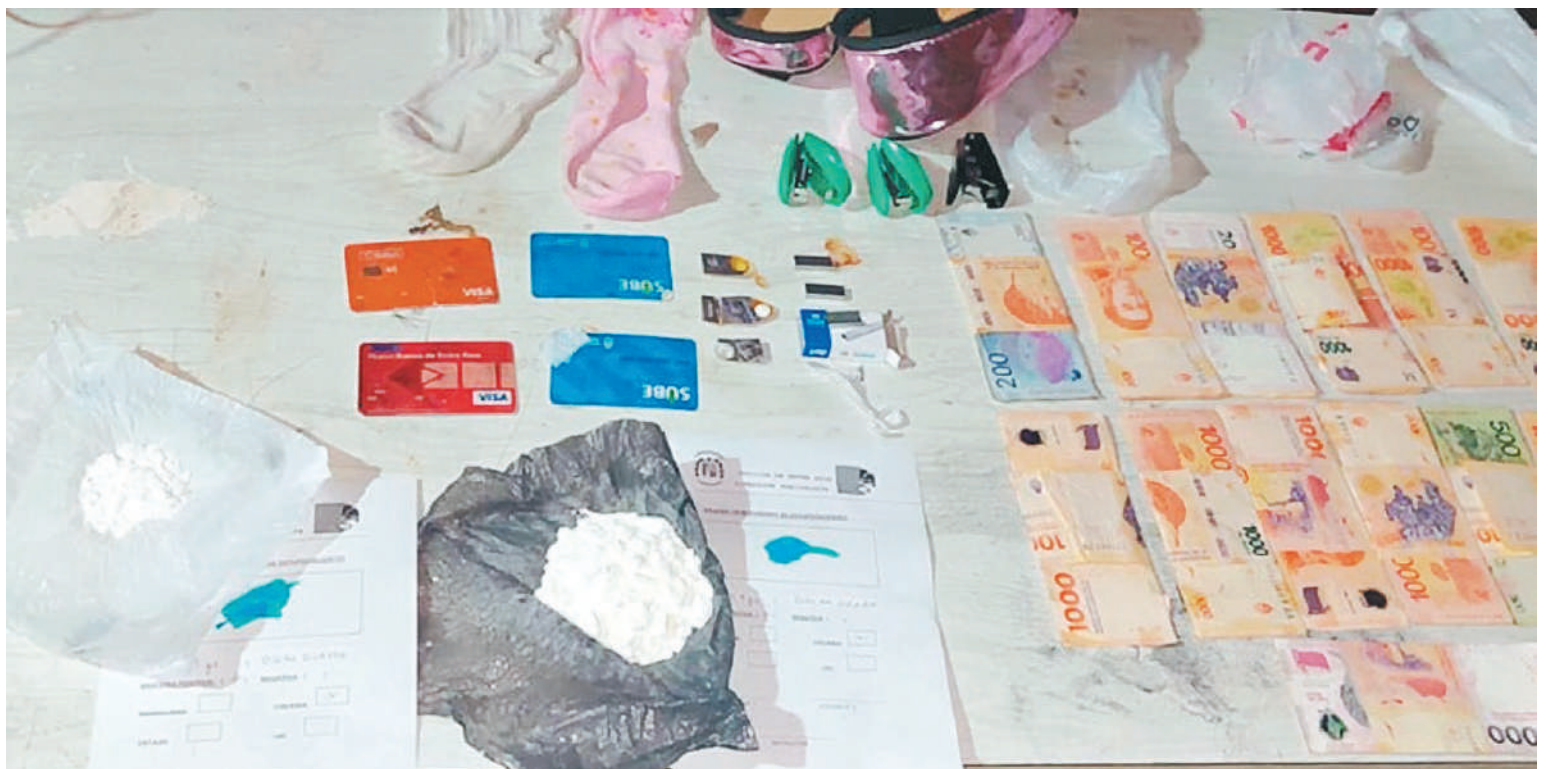
Los elementos secuestrados luego del procedimiento policial.

La justicia ordenó la implicancia de los moradores de la casa allanada. Quedaron detenidas dos personas: una mujer de 38 años y un jo-