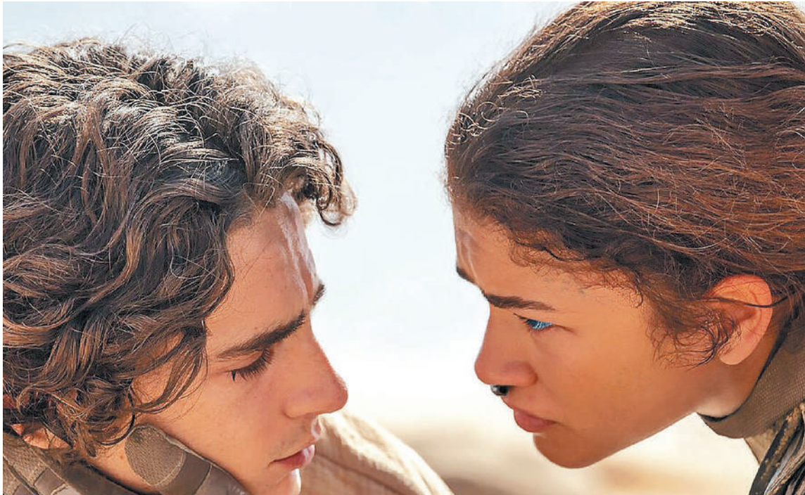
"Duna", parte dos, se estrena hoy en cine Círculo.

Concierto Orquesta Sinfónica Este sábado a las 20:30, en el Centro Cultural y de Convenciones La Vieja Usina, concierto de la Orquesta Sinfónica de Entre Ríos. Gregoria Matorras 861, entrada: libre y gratuita.