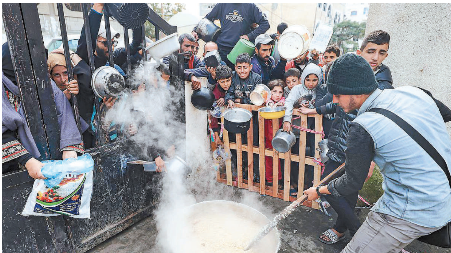
La crisis humanitaria en Gaza se agrava con el paso de los días.

En medio de nuevos ataques, donde el Ejército israelí volvió a bombardear la sureña ciudad de Khan Yunis, organismos humanitarios y para la alimentación alertaron sobre un panorama terrible, ya que los 2,3 millones de habitantes enfrentan niveles críticos de inseguridad alimentaria.