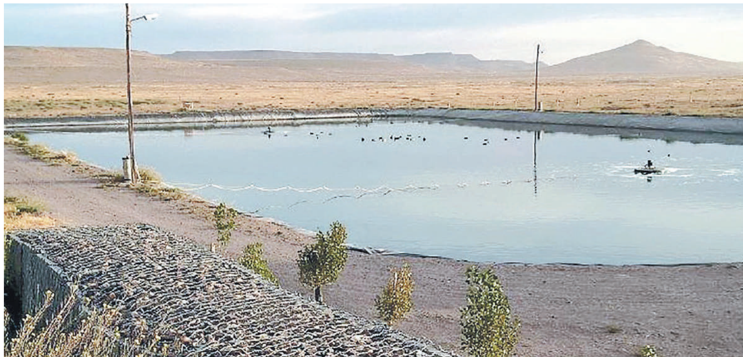
Reutilizan agua cloacal tratada para riego de árboles y cultivos forrajeros.