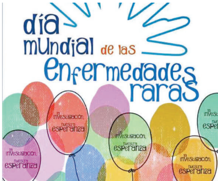
Se conmemora el Día de las enfermedades raras.

DÍA DE LAS ENFERMEDADES RARAS. Destinado a crear conciencia sobre dolencias que afectan a una porción muy reducida de la población, como el síndrome de muerte súbita inexplicable, la polineuritis aguda idiopática o la esclerodermia.