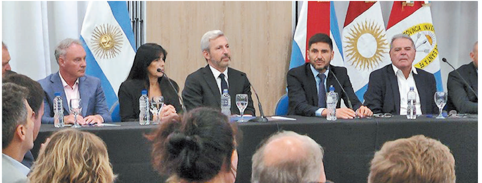
“La política tiene que centrarse otra vez en la gente”, afirmó el mandatario entrerriano.