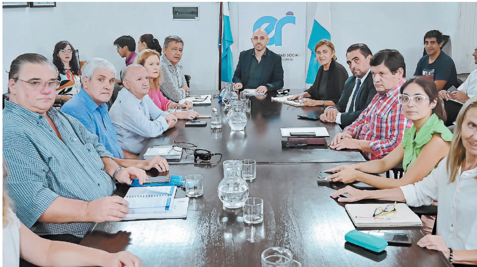
Tras el encuentro de ayer, la reunión paritaria pasó a un cuarto intermedio sin fecha prevista.