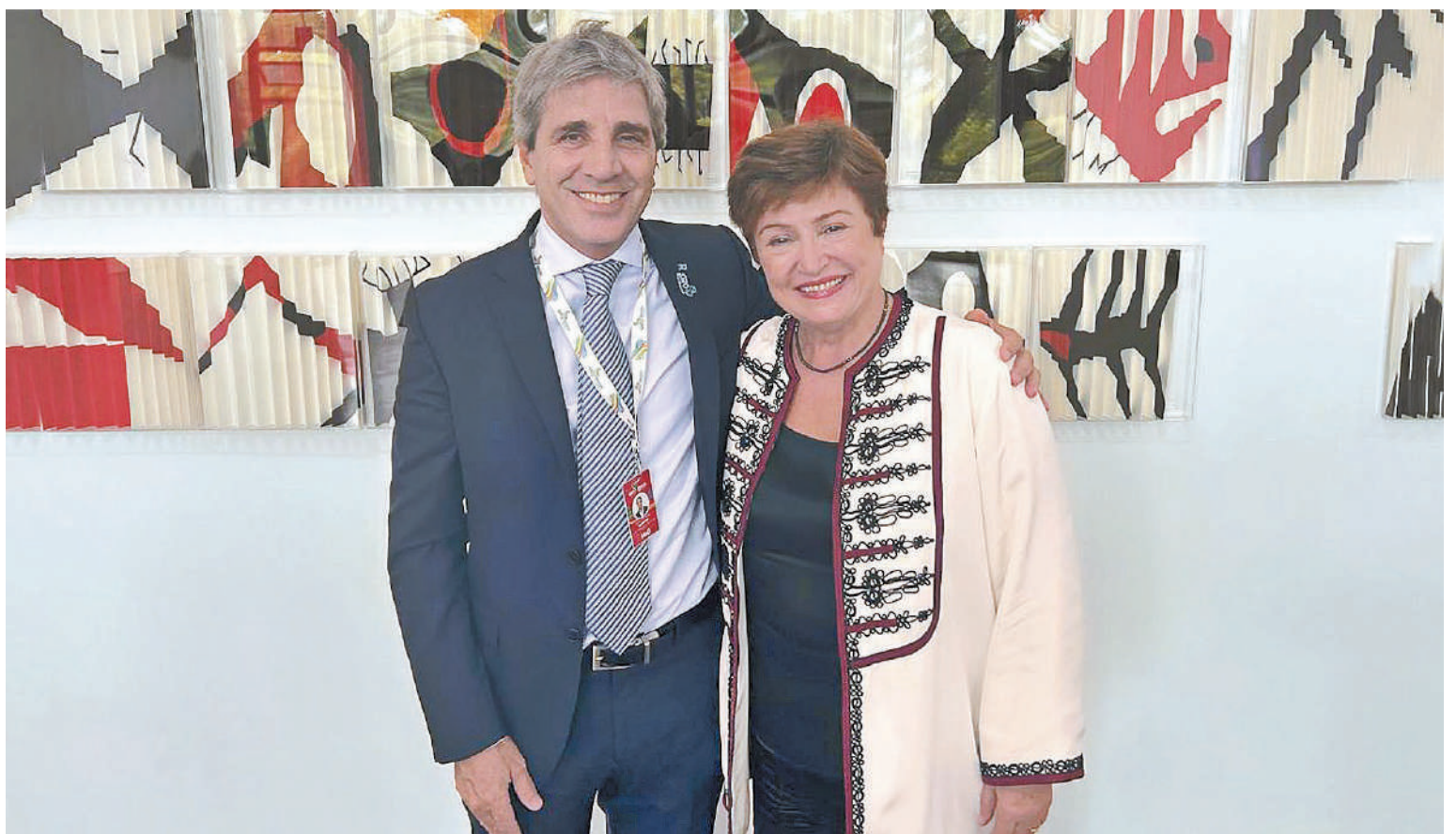
El ministro de Economía, Luis Caputo, junto a la directora del Fondo Monetario Internacional (FMI), Cristalina Georgieva.

El encuentro entre el ministro de Economía y la directora gerente del FMI se produjo a menos de una semana de la visita a Buenos Aires de la primera subdirectora gerente del Fondo Monetario Internacional, Gita Gopinath.