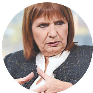
Patricia Bullrich, ministra de Seguridad

“En Chubut no vive nadie, viven nada más que un millón de guanacos”