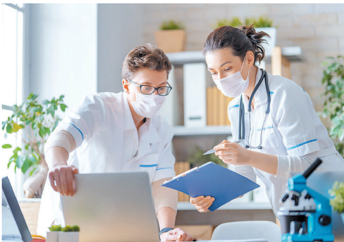
En Argentina, más de tres millones de individuos se ven afectados por alguna enfermedad poco frecuente.

Un ejemplo de estas enfermedades es la mielofibrosis, una enfermedad poco frecuente de la médula ósea, caracterizada en etapas iniciales por la producción descontrolada de glóbulos rojos, glóbulos blancos y plaquetas. Con el tiempo el ambiente medular se va reemplazando por tejido fibroso impidiendo el correcto funcionamiento de las células madre productoras de las células de la sangre y así pudiendo producir anemia, predisposición a infecciones y sangrados. Los pacientes afectados, en general son personas mayores de 50 años. Actual-