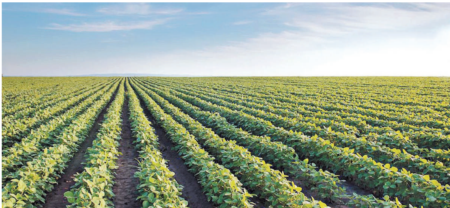
Con este escenario, la rentabilidad esperada para los productores de soja se redujo respecto al momento de la siembra.

Por menores precios y ajustes en la producción, el valor de cosecha de los principales granos de exportación sería menor a lo esperado al inicio de la campaña. En el caso de la soja de primera y el maíz tardío, con los precios y rendimientos actuales, la rentabilidad sería negativa.