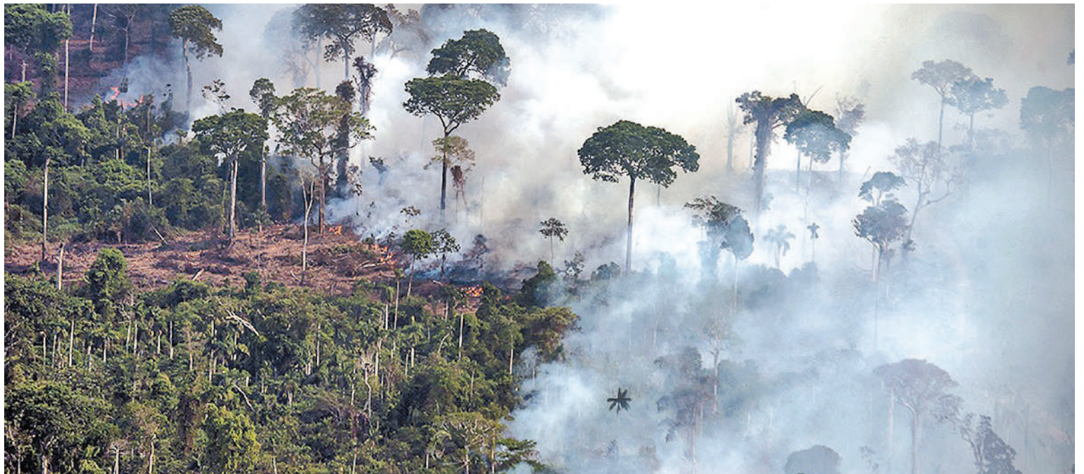
Los investigadores de Copernicus explicaron que América del Sur viene experimentando un período de sequía prolongada.

El servicio de monitoreo europeo Copernicus señaló en un informe que las emisiones estimadas de Brasil y Venezuela fueron respectivamente de 4,1 y 5,2 megatoneladas de carbono, mientras que en Bolivia la cantidad fue de 0,3 megatoneladas.