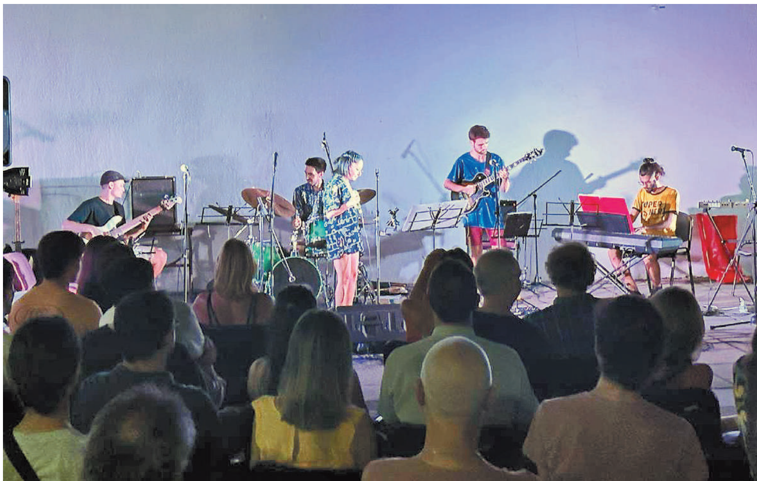
Este jueves a las 20.30, en el Museo de Bellas Artes, última noche del ciclo de Jazz.