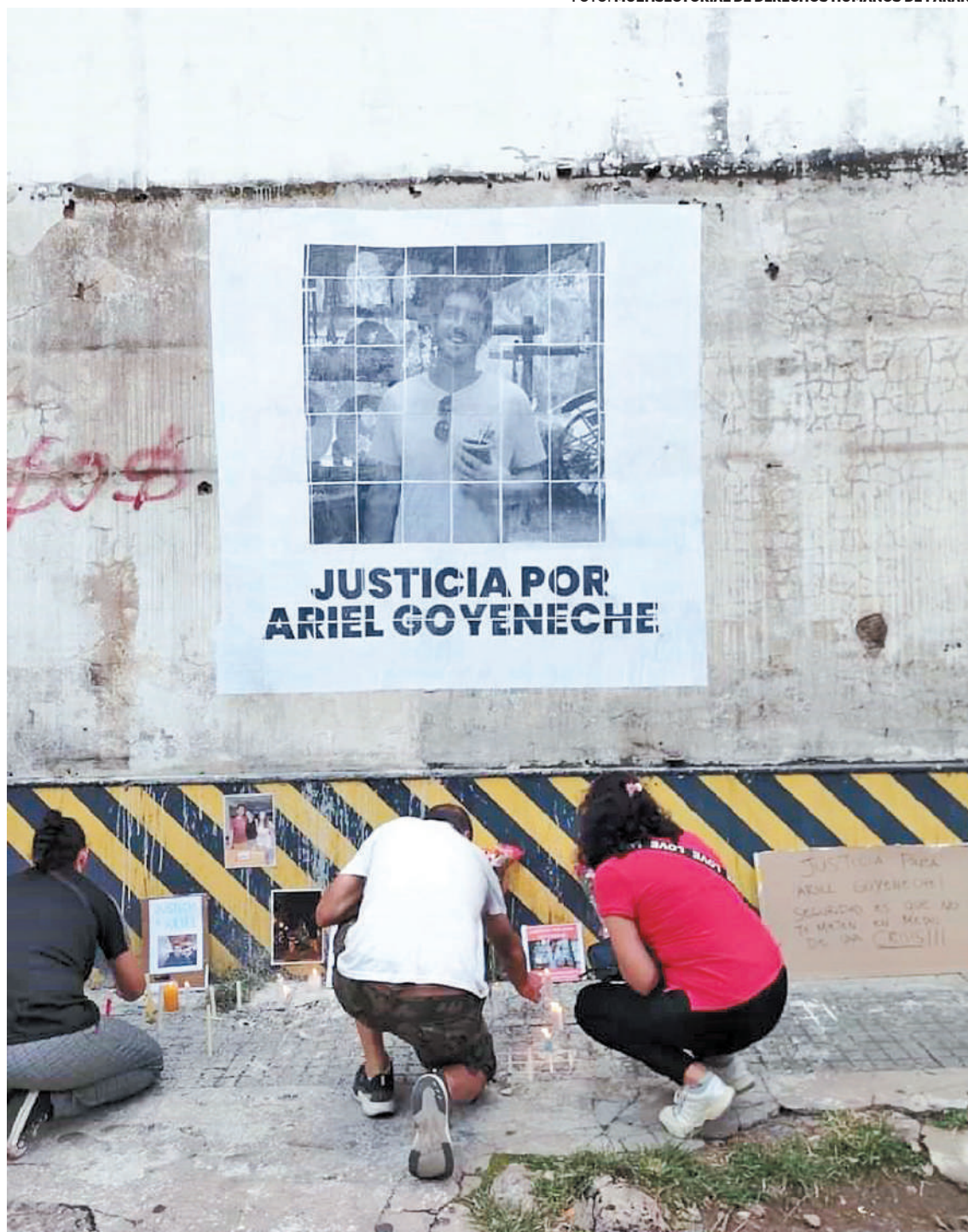
La dudosa muerte del joven se produjo el 12 de febrero y buscan respuestas.