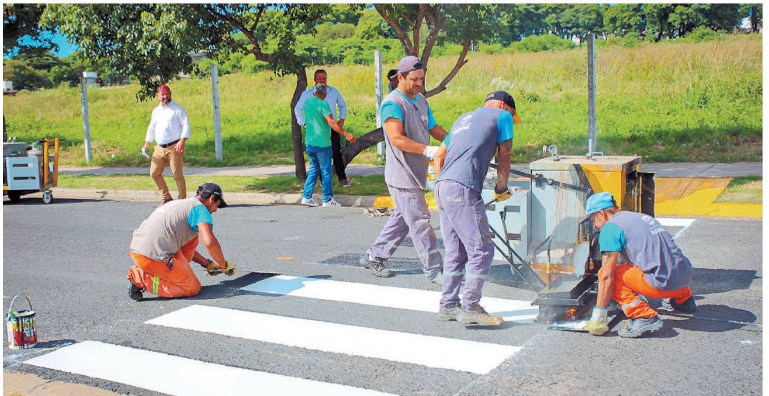
Los trabajadores recibirán el incremento en base al salario del mes de enero.

“Del 15 % al básico, no sólo lo rechazamos de plano por insuficiente, sino que instamos al Municipio a aumentar dicho porcentaje a la expresión máxima que pueda otorgar con base al último sueldo percibido; entendiendo que en la actual situación de crisis inflacionaria y estrepitosa caída del poder de compra de nuestro salario el aumento debe estar por encima del 25% para todos los trabajadores activos y pasivos, como así también debe reflejarse en igual proporción en el monto fijo que perciben los monotributistas –trabajadores pre-