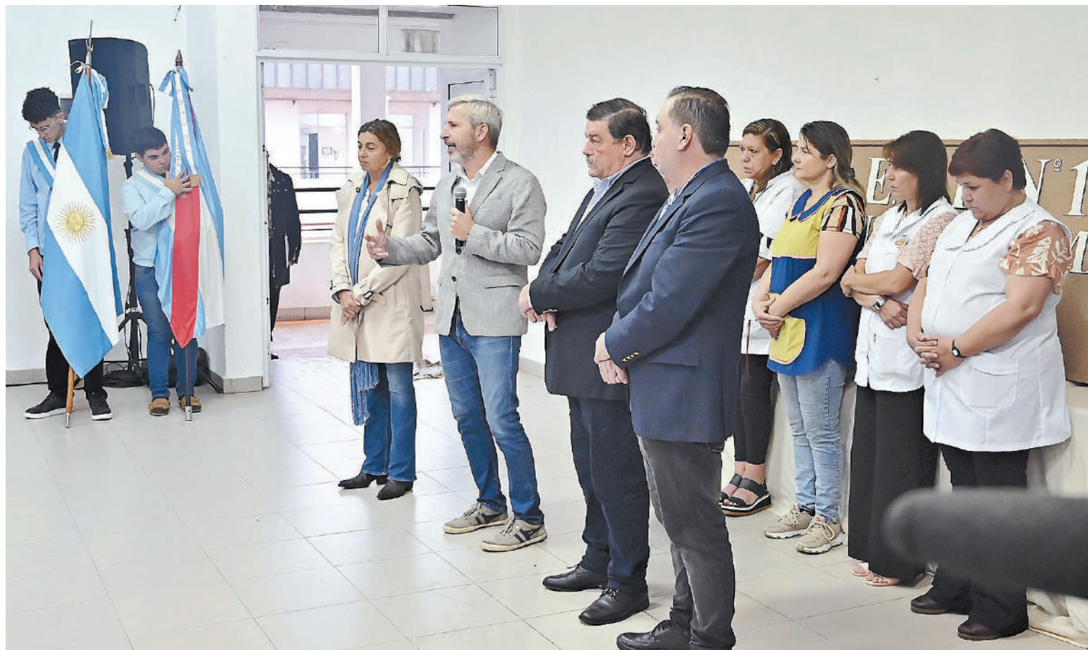
El gobernador dio inicio al ciclo lectivo en la escuela técnica de Villa Paranacito.

“Sé de las dificultades de la comunidad educativa, que a los docentes el sueldo no alcanza, que les cuesta llegar a la escuela y que muchas veces sienten que no están acompañados por el poder político de la provincia o del país. Igual están acá, poniendo el hombro, dando el ejemplo”, remarcó.