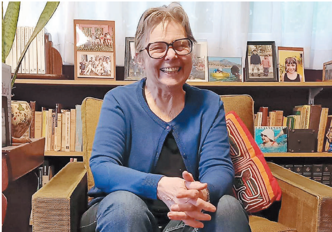
Editora, traductora, ensayista y autora de una obra emblemática en el campo literario argentino, Graciela Montes retoma una colección que impulsó en los 80 llamada Entender y participar.

La reedición de una de sus obras clásicas "¿Qué es esto de la democracia?", que buscó en los 80 generar conversaciones sobre la vida política y la formación de ciudadanía con los más chicos, pone nuevamente en vigencia el trabajo de una referente de la literatura para el mundo infantil.