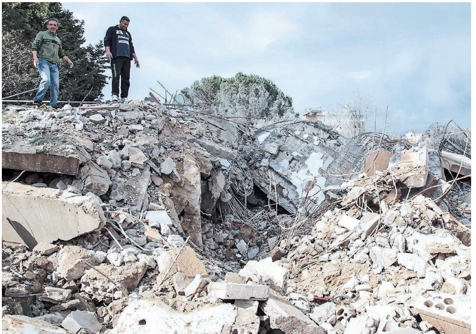
Ciudades completamente destruidas y millones de personas a la deriva en medio de la incertidumbre por la continuidad de la guerra.

La ofensiva "no sólo sería aterradora para más de un millón de civiles palestinos refugiados allí, sino que marcaría la sentencia de muerte para nuestros programas de ayuda", advirtió el secretario general de la ONU.