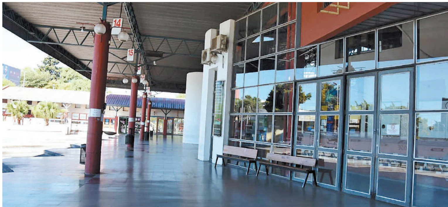
Ha mermado mucho el movimiento en la Terminal de Paraná.