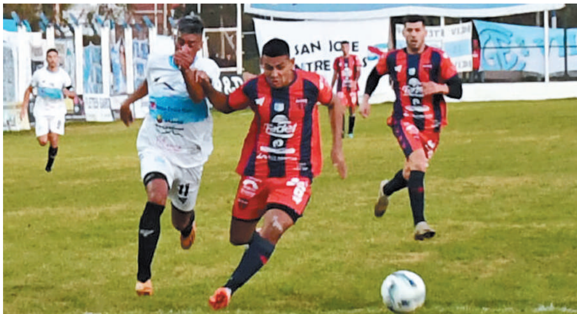
Los equipos entrerrianos Defensores de Pronunciamiento y Gimnasia y Esgrima de Concepción del Uruguay serán los dos representantes de la provincia en el certamen del Consejo Federal.

Con el ascenso de Camioneros de 9 de Abril, tras vencer a Altos Hornos Zapla, de Jujuy, la máxima categorías de ascenso del Consejo Federal ya cuenta con todos los casilleros completos. Este miércoles hay reunión en AFA para definir temas inherentes a la competición.