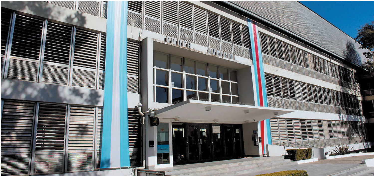
La condena fue otorgada en el Tribunal de Juicio y Apelaciones de Paraná.