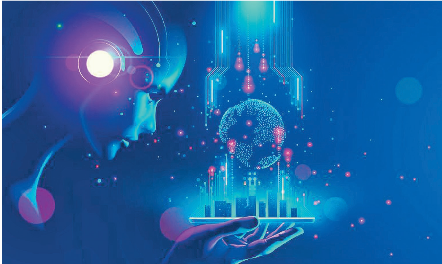
Inteligencia artificial y ciberseguridad, ejes para la investigación en los próximos años.