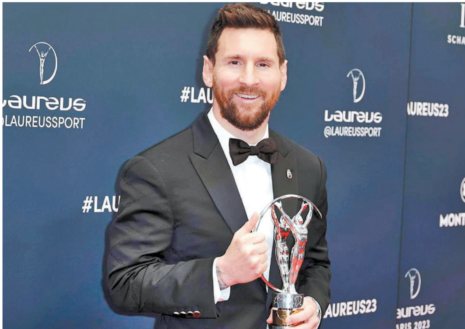
Tal como lo hizo el año pasado, Lionel Messi es uno de los máximos candidatos a recibir esta temporada el premio Laureus.