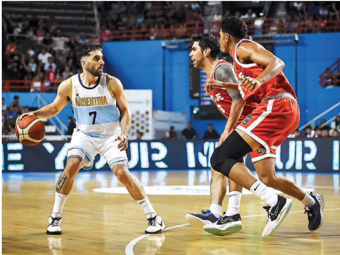
El cordobés Campazzo, como siempre, vital en el seleccionado nacional.

El capitán Facundo Campazzo (Real Madrid) cumplió una destacada labor también y finalizó con 15 unidades (3-5 en dobles, 3-8 en triples), 8 asistencias, 3 rebotes y 2