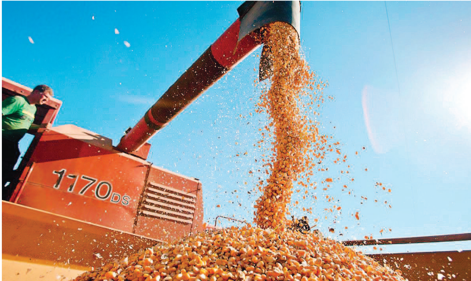
La Bolsa de Cereales de Rosario proyectó que la demanda a nivel país aumente aproximadamente en un 39% este año.