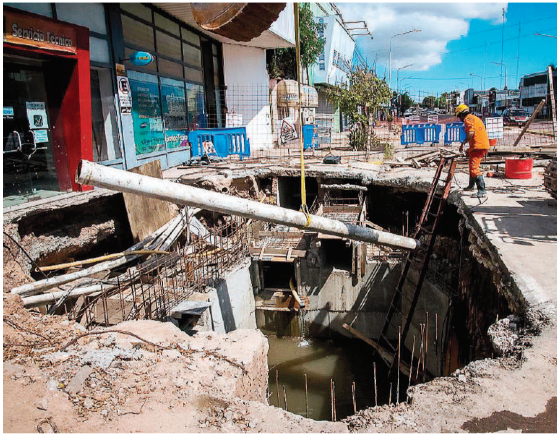
El colapso de una cámara de desagües pluviales se dio el pasado 8 de diciembre. Tras dos meses y medio de obras en el socavón, ayer se habilitó el tránsito en avenida Almafuerite.

“Hoy estamos rehabilitando el tránsito sobre la Avenida Almafuerite, en lo que es mano de ingreso a la ciudad, es decir, se movieron todos los materiales que había sobre la calzada ya que los trabajos sobre esa parte concluyeron. Mientras que, en la mano de salida, tenemos algunas restricciones debido a que allí se produjo el socavón, donde hay un carril de salida habilitado, y tenemos parte de la calza-