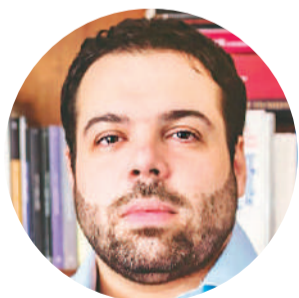
Manuel Troncoso , ministro de Gobierno y Trabajo de Entre Ríos

“El paro docente se da en contra del Gobierno nacional, por críticas al recorte del FONID y de Conectividad”