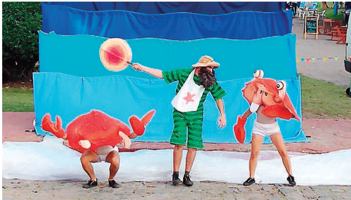
El festival ofrecerá este fin de semana actividades para toda la familia. En teatro, podrá verse al grupo santafesino La gorda azul, que presentará su obra Tiburón XXL.

y colectivo, desde Compañía Teatral trabajamos en esta nueva edición con la Biblioteca Popular Caminantes", contaron los organizadores. Las funciones serán en la plaza Alemania (frente a la biblioteca Popular Caminantes), en el barrio Los Gobernadores.