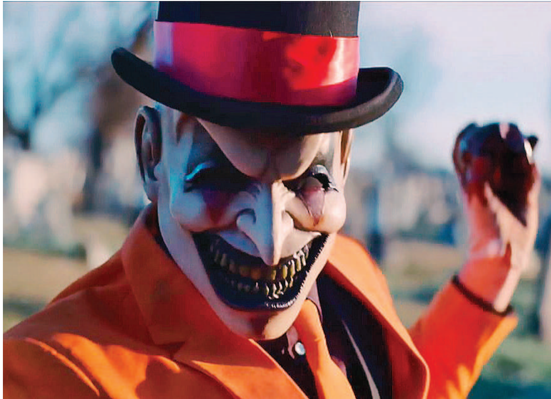
"El bufón", diariamente en los cines Círculo, Sunstar y Las Tipas.

El domingo, a las 21, en Limbo Pub (Güemes y Liniers). Entrada libre y gratuita.