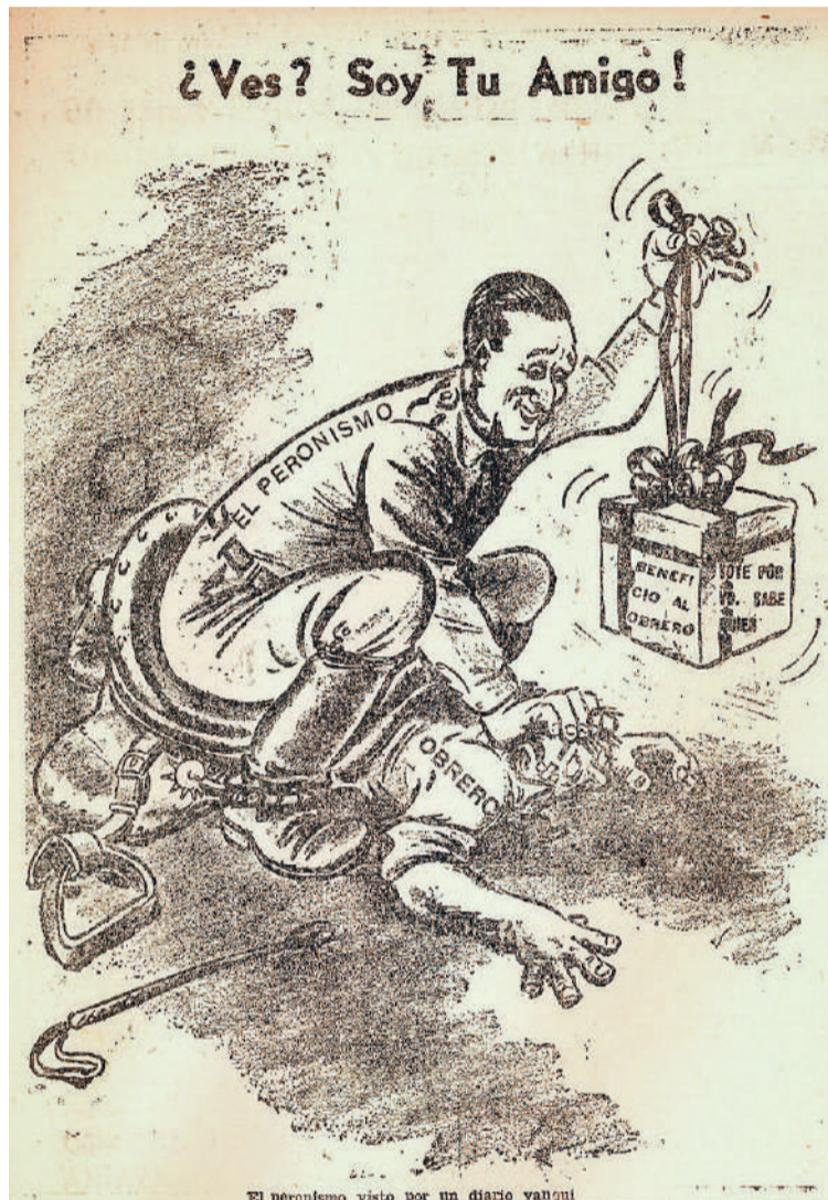
El entonces opositor "El Diario" de Paraná refleja aspectos de los comicios de 1946. En uno de ellas reproduce una caricatura de un medio norteamericano.