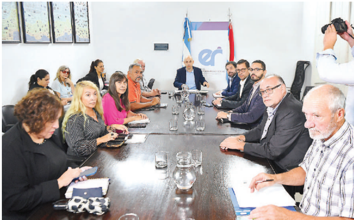
A la espera de un acuerdo con los docentes el próximo martes, la Provincia y gremios estatales acordaron ayer un incremento del 18% sobre la base de enero y un 50% en los contratos de obra en marzo.

Además, se acordó un incremento del salario mínimo provincial a 393.000 pesos, con lo cual, producto de la negociación, se postergó para abordar en futuras discusiones paritarias el aumento de las asignaciones familiares.