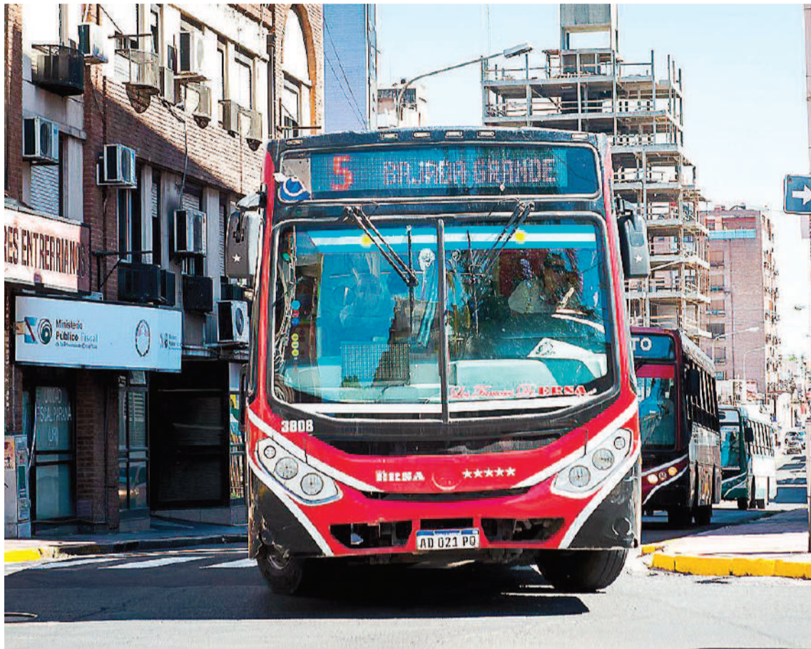
Las provincias y el Gobierno nacional siguen discutiendo sobre los subsidios que quitó Milei para el transporte en el país y que afecta fuertemente al interior.

QUITA DEL FONID. “Queremos solucionarle la vida a los vecinos, que el ajuste no lo paguen solamente quienes tienen la necesidad de usar el transporte público de pasajeros”, dijo el ministro que adelantó que en caso de no obtener respuesta administrativa de Nación, la provincia recurrirá a la Justicia