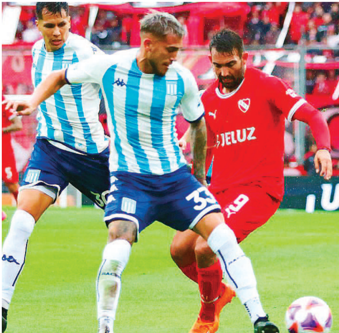
Independiente de buen momento en cuanto a la sumatoria de puntos, recibirá desde las 17 a Racing Club en el clásico de Avellaneda.

Es real que en este contexto, Carlos Tevez les brindó una identidad a sus dirigidos, que venían en las últimas