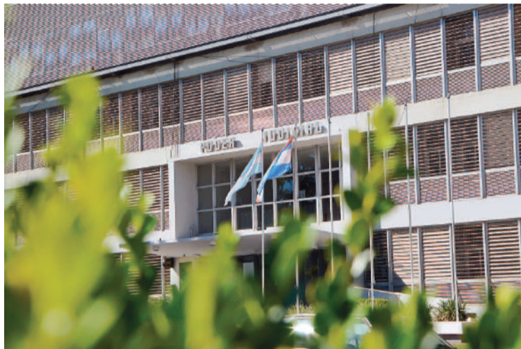
La resolución fue confirmada por el Superior Tribunal de Justicia de Entre Ríos.

De tal modo, sin entrar a expedirse acerca de la legitimidad o no del Decreto N° 268 impugnado, Mizawak concluyó que el interesado tenía a su disposición otros carriles judiciales idóneos y eficaces para la protección de los derechos que adujo conculcados.