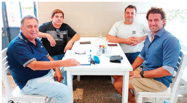
Directivos continúan en la organización de un gran evento a darse en los próximos días en Paraná.