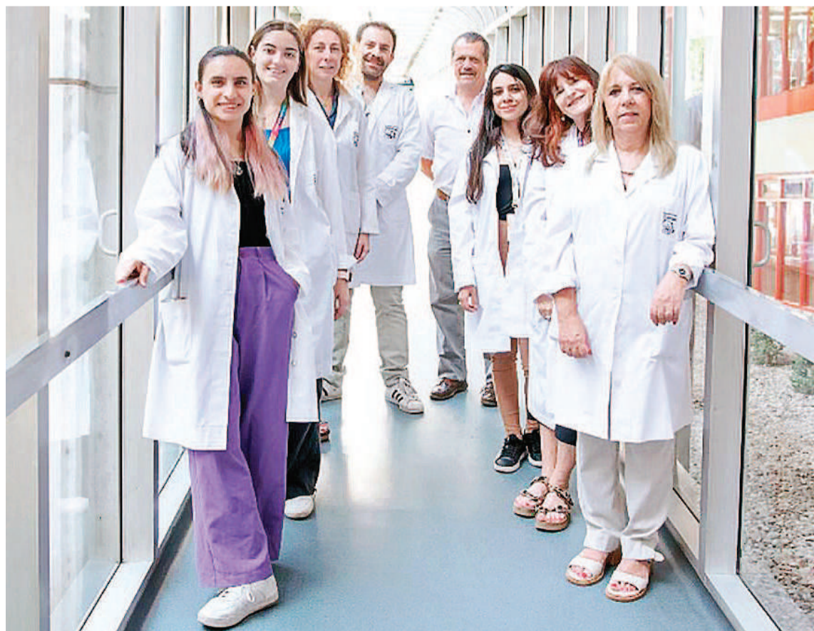
Los profesionales señalan que la enfermedad se puede eliminar cuando se detecta en forma temprana.

"Es fundamental desarrollar nuevas estrategias terapéuticas que sean más eficaces y menos tóxicas para tratar los casos de enfermedad diseminada, que son la mayoría de los niños diagnosticados con retinoblastoma en el mundo y los que fallecen por esta enfermedad", concluyeron.