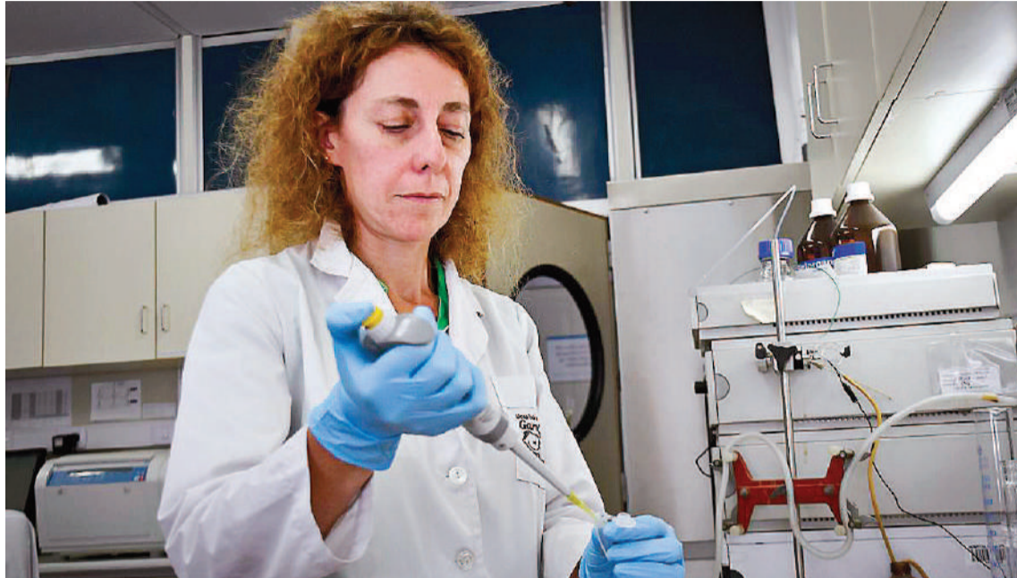
Especialistas del Conicet y el Hospital Garrahan desarrollaron un modelo preclínico que permitirá diseñar tratamientos innovadores que pueden curar a pacientes con retinoblastoma.

"Las investigaciones nos permitieron desarrollar nuevas vías de ad-