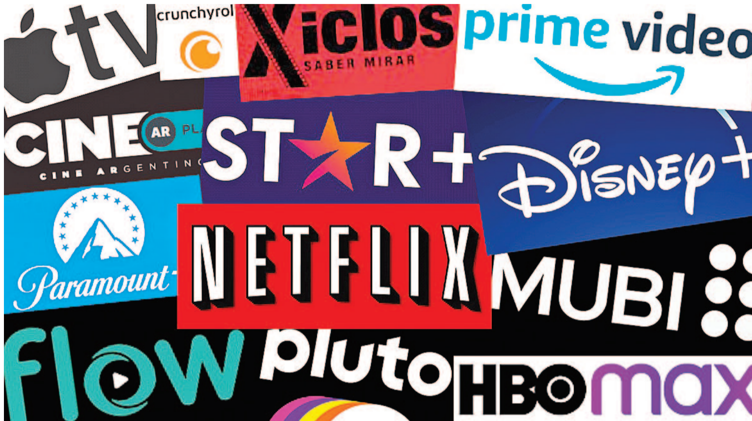
La oferta cada vez más y específica de las plataformas enfrenta épocas de cambios y fusiones.