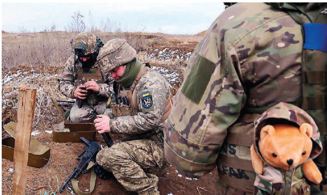
La guerra en Ucrania cumple este sábado su segundo aniversario, con un "estancamiento" en casi todos los sectores del frente.

mir que en el mar Negro hizo retroceder a la poderosa flota rusa y de haber despejado una vía crucial para la exportación de cereales ucranianos, claves para la seguridad alimentaria del mundo.