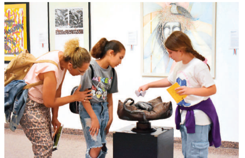
Los museos de Paraná, una propuesta interesante para visitar en familia.

Museo Histórico Martiniano Lequizamón abre sus puertas de mar-