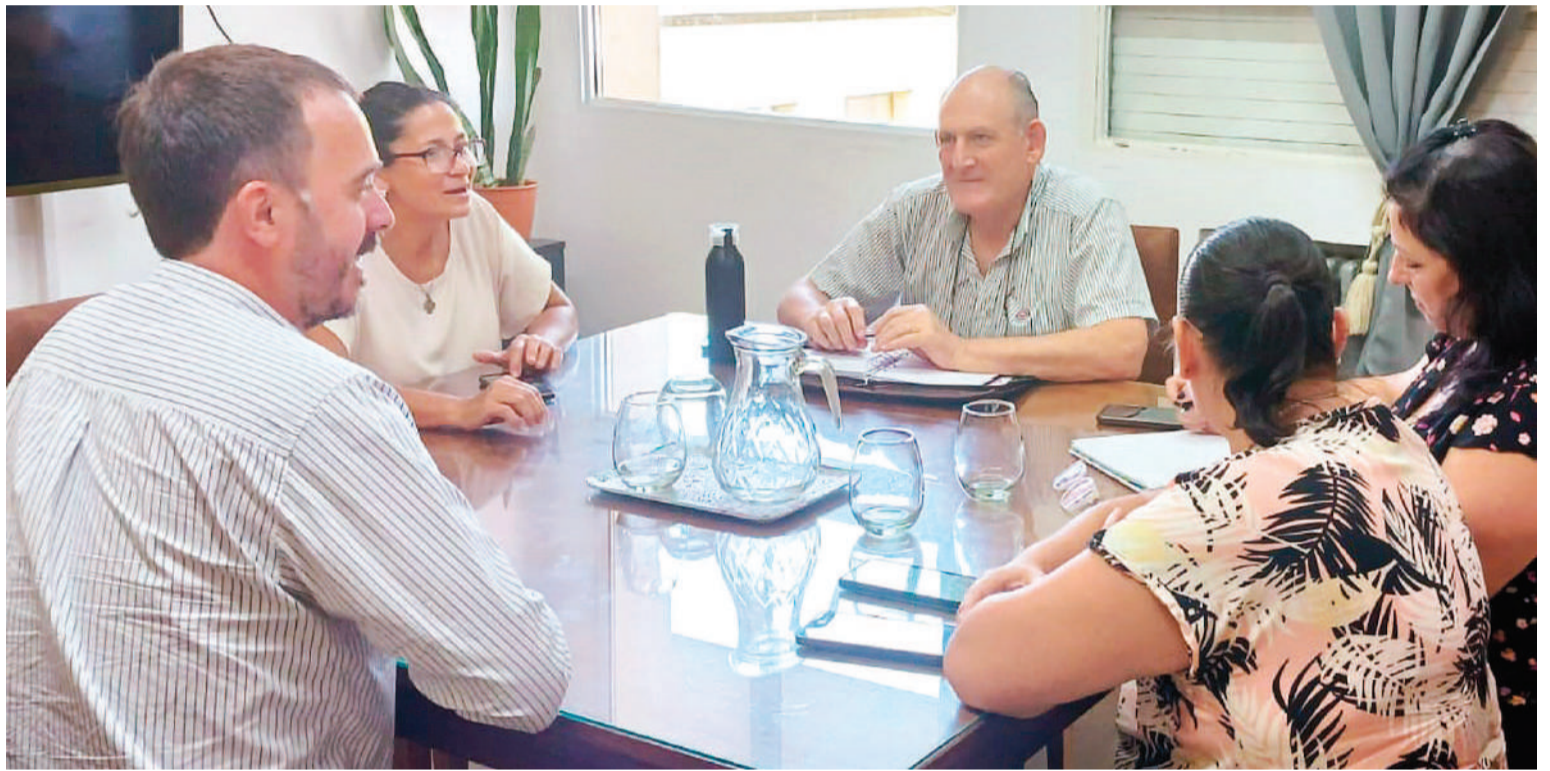
Las autoridades acordaron trabajar en conjunto en el acompañamiento y asistencia a personas bajo la intervención del Patronato de Liberados.

“Esta reunión marca un hito en la colaboración entre el Patronato y la