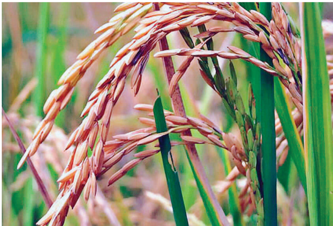
Estiman que el 35% del cultivo de arroz está en una condición muy buena.

En la provincia, la superficie destinada al cultivo de arroz abarca una extensión aproximada de 63.000 hectáreas para el ciclo agrícola 2023/24. Además, el sorgo entrerriano ostenta un 95% entre condición buena y muy buena; mientras que el maíz tardío y de segunda alcanzó el 81% en el mismo nivel.