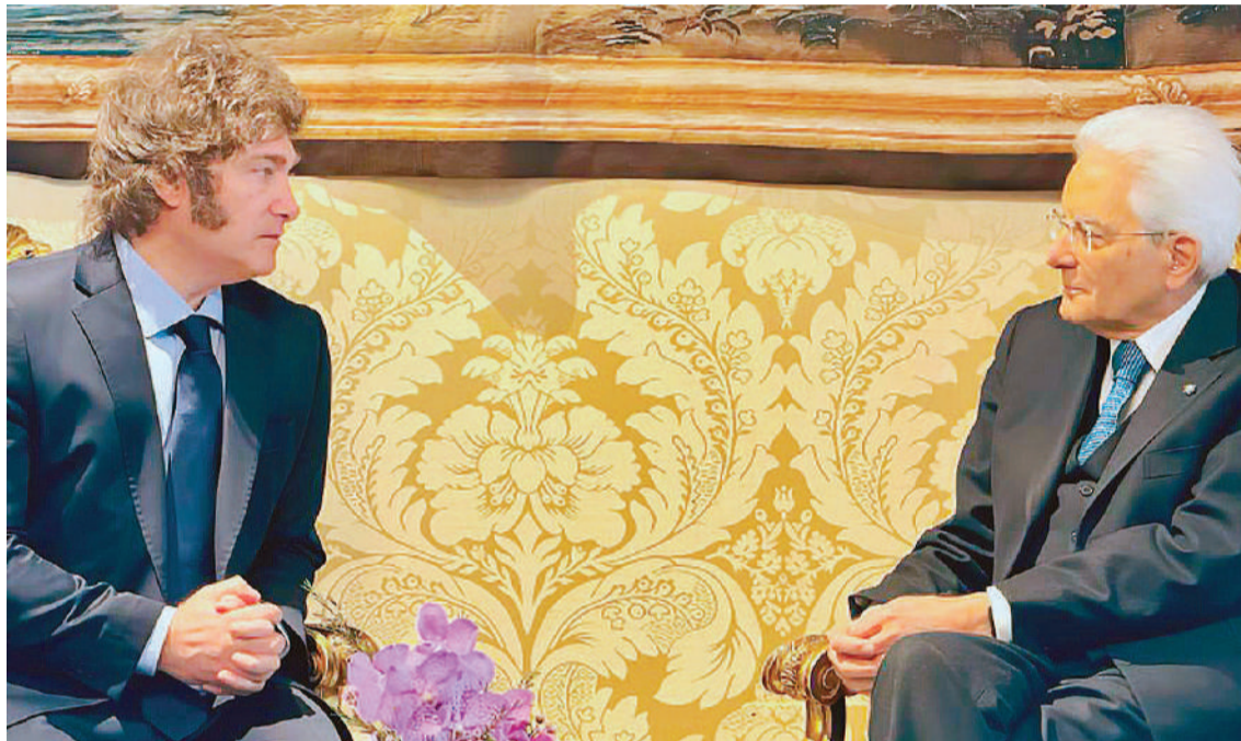
Milei y Mattarella coincidieron en fortalecer el vínculo bilateral entre países para dar confianza a los inversionistas.

rante cerca de una hora en el Palacio Chigi, sede del Ejecutivo, donde fue recibido por la premier y juntos escucharon a la banda militar