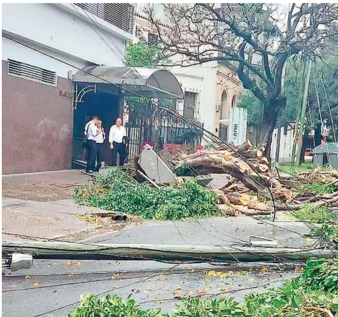
El añejo árbol ubicado en la vereda de la sala velatoria SASFER, sobre calle Urquiza, fue uno de los que cayó con el temporal por lo que también tiró cables y un poste de electricidad.

Además, en la zona de calle Río Negro al 130, casi Avenida Almafuerte, se registró otro incidente importante debido a los fuertes vien-