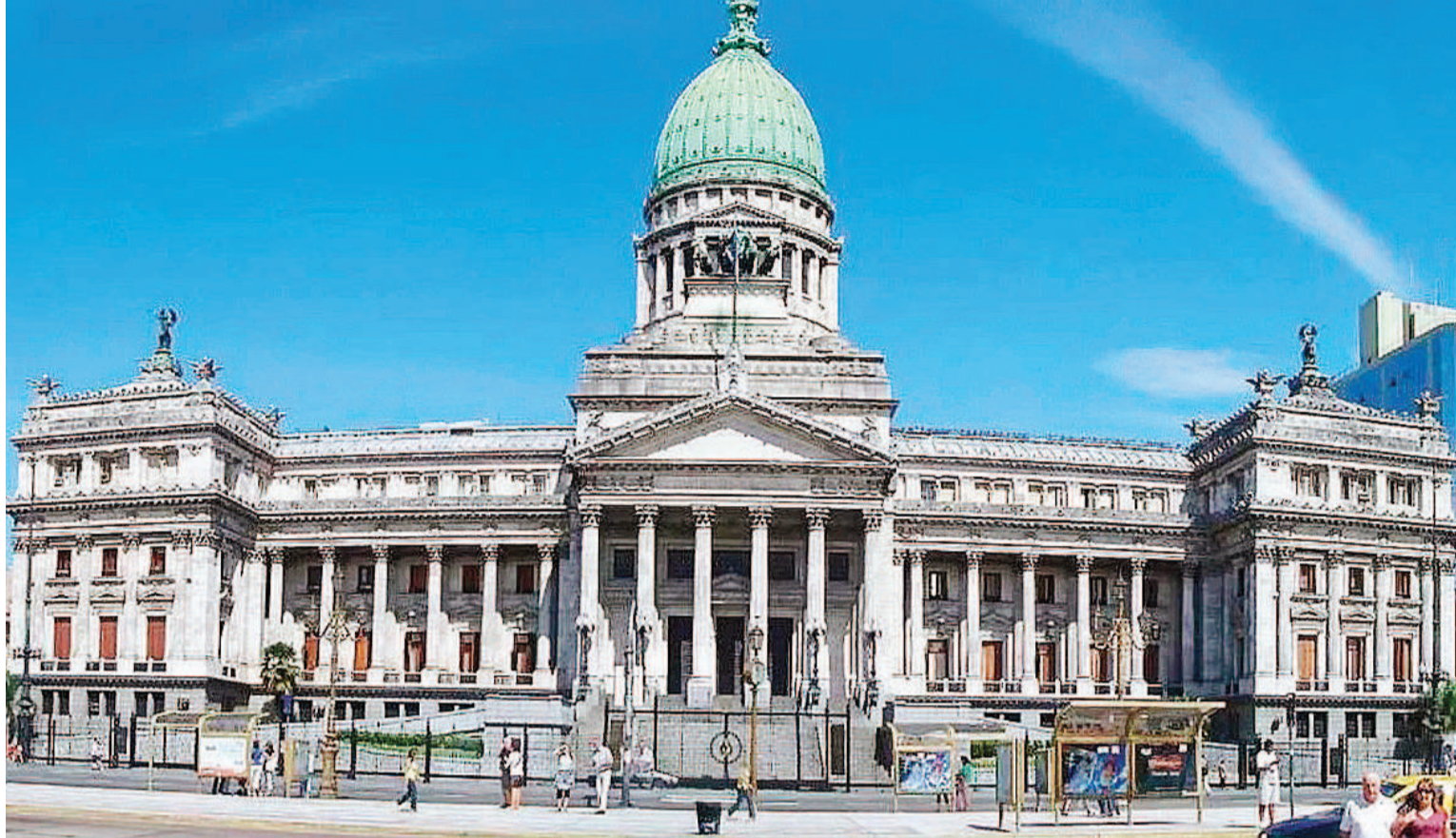
El oficialismo, con la mirada puesta en los pasos a seguir en el Congreso. Se evalúan posibilidades para la ley Bases, mientras se espera la sesión por el DNU.