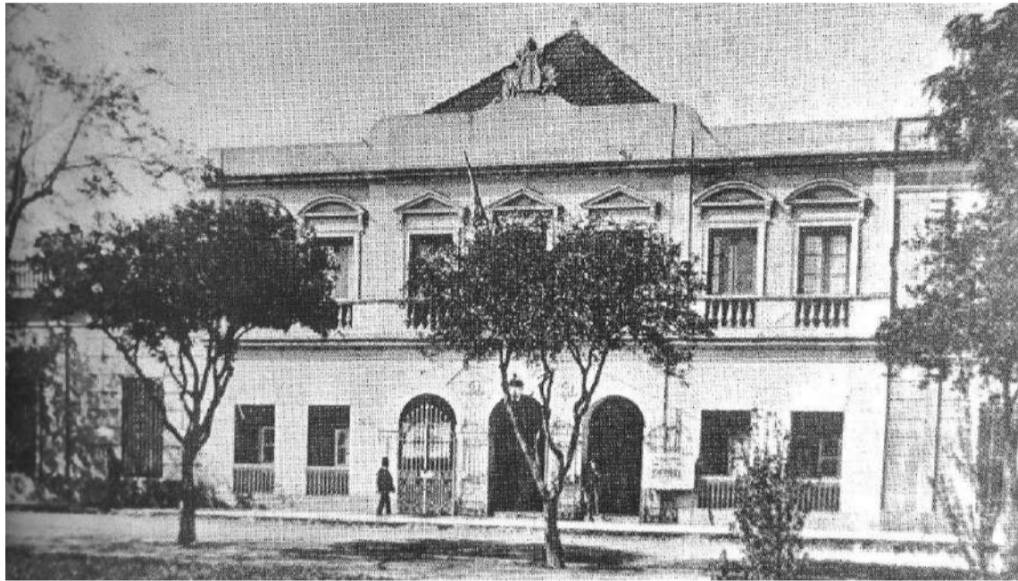
Teatro Primero de Mayo C. del Uruguay (1866).