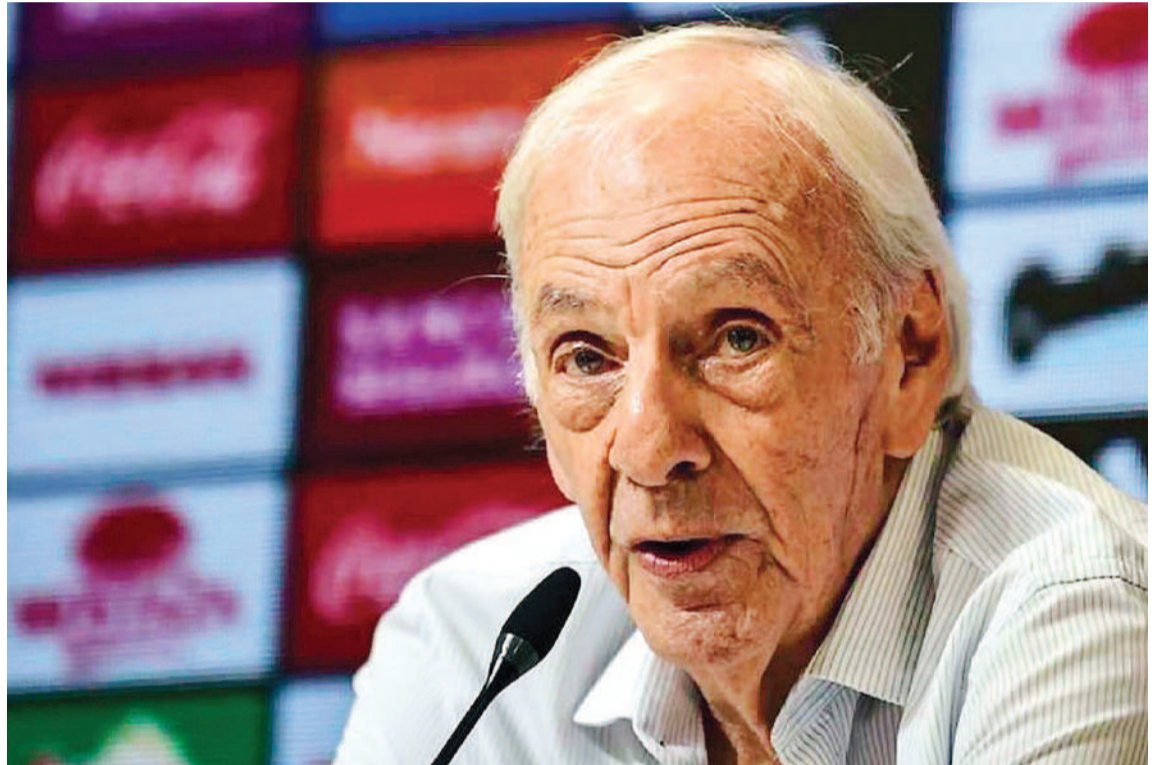
César Luis Menotti, palabra autorizada en el fútbol argentino.

Del mismo modo, Menotti sostuvo que “(Lionel) Scaloni está bien donde está”, aunque resaltó que “no hace falta convencer a nadie para que se quede en la Selección”, expresó sobre el DT campeón mun-