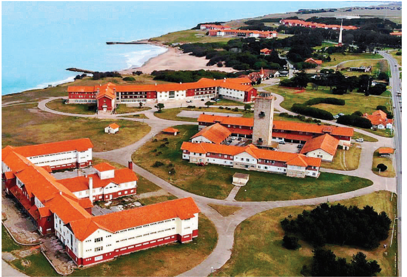
Turismo social en el complejo de Chapadmalal.

—Hemos trabajado fuertemente para garantizar, pero priorizando los mercados, porque a veces se va a muchas ferias y hay que ser