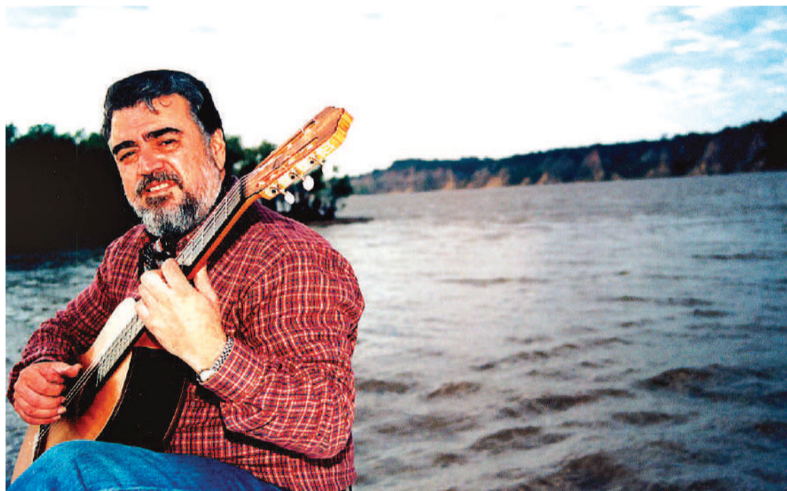
La iniciativa del sello Shagrada Medra avanza en rescatar, valorizar y divulgar la obra del recordado compositor y guitarrista Miguel "Zurdo" Martínez, pilar del Canto paranaense.

Shagrada Medra, presentará mañana, la Discografía Reunida de Miguel 'Zurdo' Martínez". Se trata de la primera parte de un minucioso trabajo de rescate y edición realizado por el sello discográfico local. El lanzamiento con la obra del recordado guitarrista y compositor paranaense será este miércoles a las 22 por el Canal de YouTube de Shagrada Medra Digital en el marco del ciclo La Hora Azul.