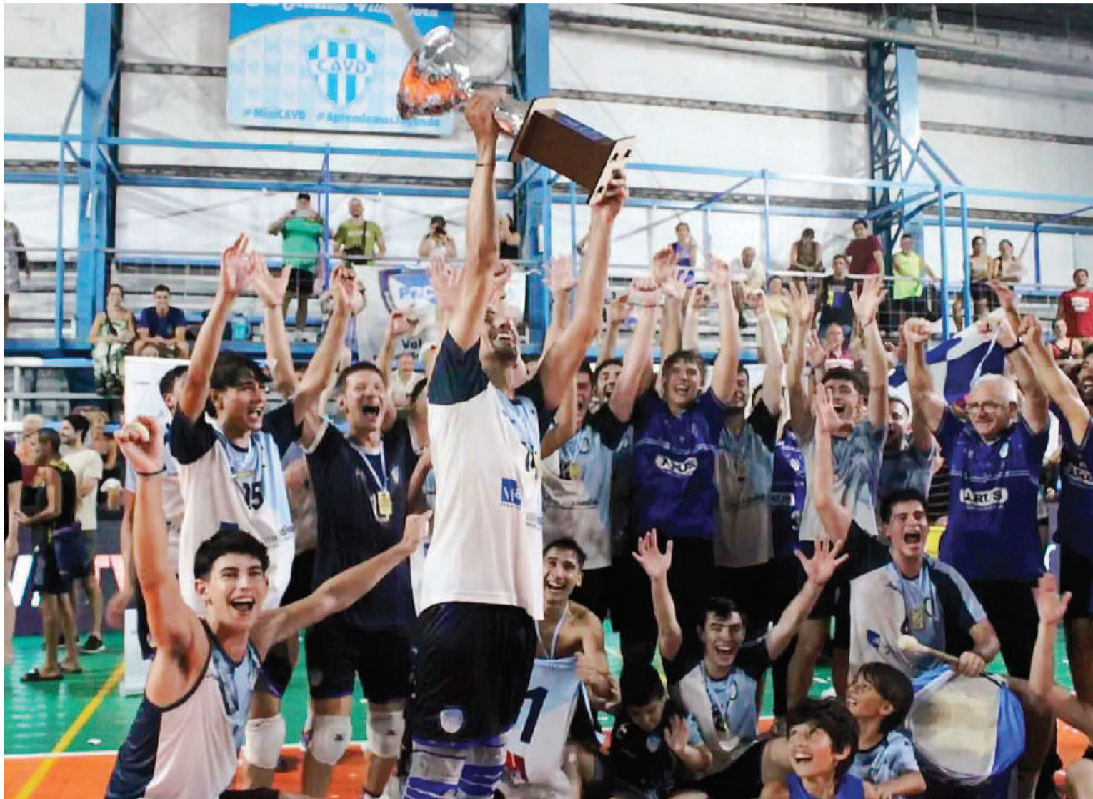
El Paraná Rowing Club celebró a lo grande la coronación en la Liga Federal de Vóley, concretada el fin de semana en Santa Fe.