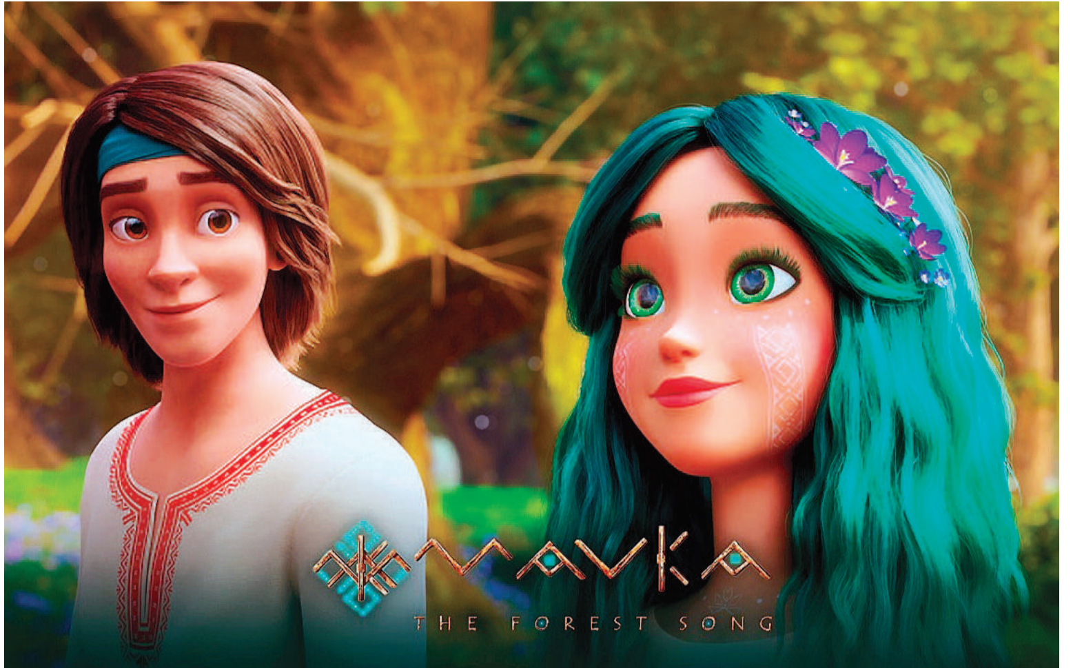
"Mavka, guardiana del bosque", diariamente en el cine Círculo.