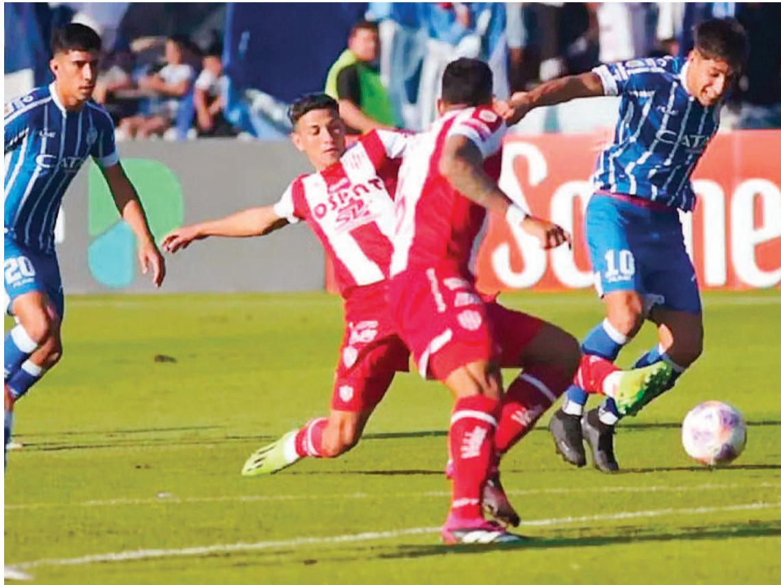
¿Podrá el Tatengue parar al Tomba ? El equipo mendocino acumula puntaje ideal en lo que va de la copa y es uno de los líderes de la zona B.

Independiente, que marcha quinto con siete puntos, recibirá a Rosario Central, el campeón vigente, por el otro juego de la Zona A. El partido se jugará desde las 21.30 en el estadio Libertadores de Amé-