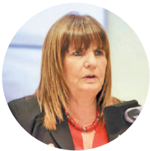
Patricia Bullrich, sobre la posible formación de una coalición política.

“No podemos darnos el lujo de que otra vez el cambio se frustre”