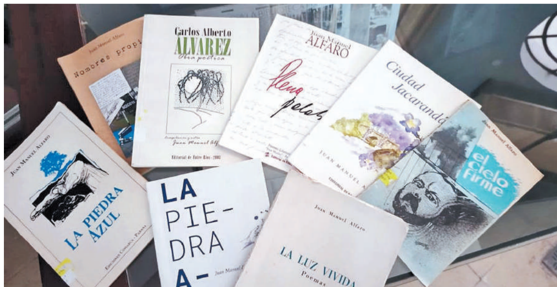
La Biblioteca Provincial invita a leer obras del escritor entrerriano Juan Manuel Alfaro, recientemente fallecido.

De martes a viernes de 9 a 12; y de 17 a 20; sábados de 17 a 20; y feriados de 9 a 12. Museo de Ciencias Naturales y Antropológicas Antonio Serrano: abierto de martes a viernes de 10 a 13; y de 17 a 20; sábados y feriados de 10 a 13. Museo Histórico Martiniano Leguizamón abre sus puertas de martes a viernes de 8 a 12; sábados y feriados de 9 a 12 y de 17 a 20. Museo y Mercado de Artesanías Carlos Asiain atiende de lunes a viernes de 9 a 12. Museo Hogar Escuela Eva Perón abre sus salas martes y jueves de 8 a 12.