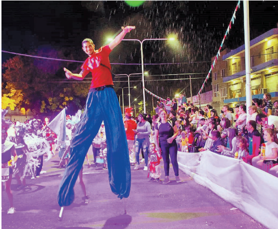
Hoy comienzan los carnavales en la plaza Mujeres Entrerrianas, sobre calle Maciá.

En el Anfiteatro Linares Cardozo, el 19 de febrero a las 21, Cine bajo