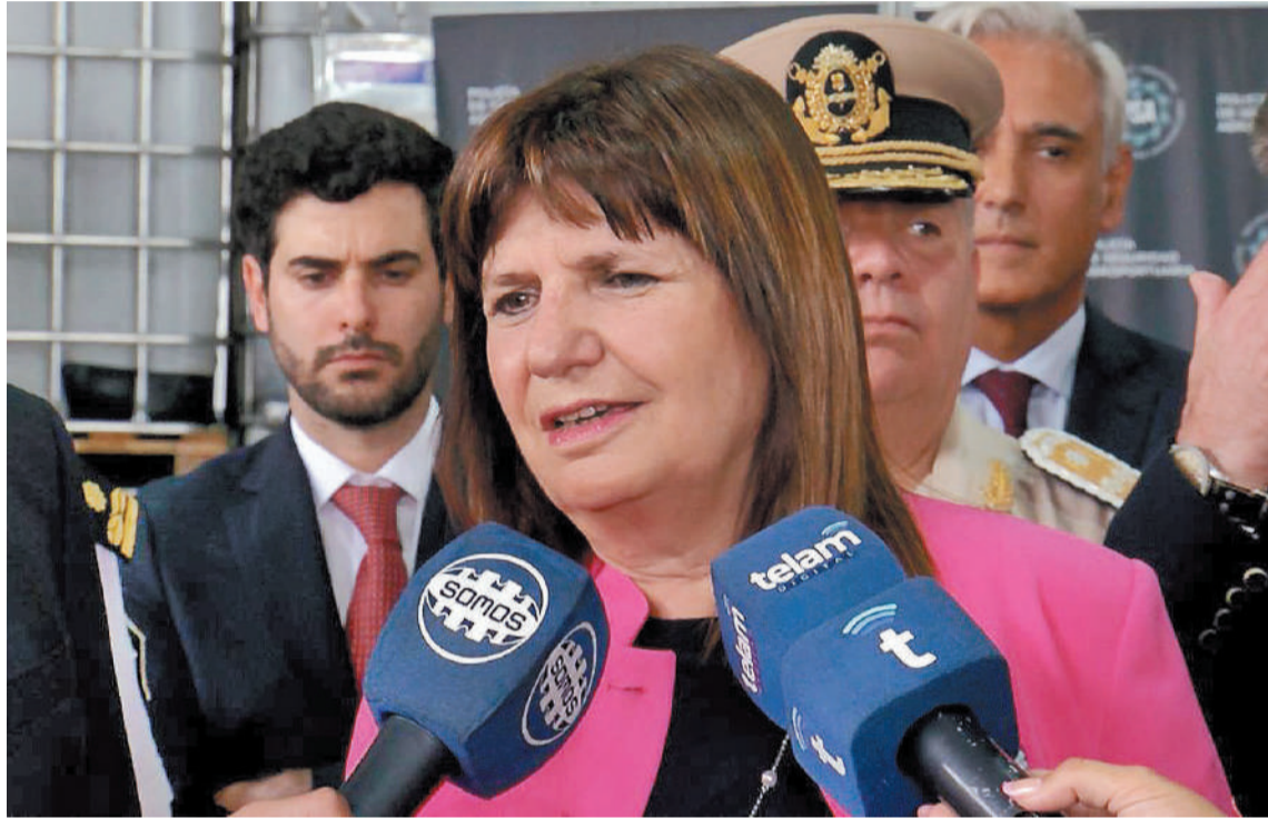
La ministra de Seguridad, Patricia Bullrich, sostuvo que “se viene un nuevo rediseño político”.

La ministra de Seguridad y expresidenta del PRO sostuvo, sin embargo, que no quería apurar dicha unión. “No podemos darnos el lujo de que otra vez el cambio se frustre”, argumentó. Pidió alinear a todos los que estén a favor del gobierno.