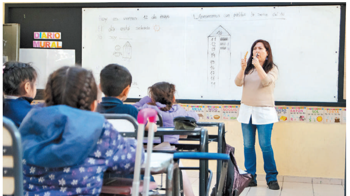
Para pagar los sueldos de enero, varias provincias cubrieron ese monto con fondos propios.

El FONID, que se pagaba junto con el ítem "conectividad" (creado en 2021, durante la pandemia), re-