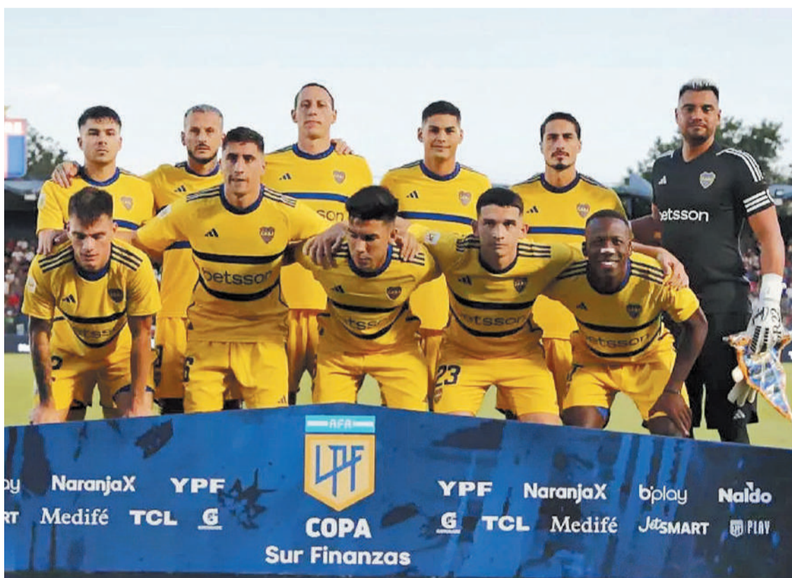
La vuelta a la Bombonera recién se produce en esta fecha para el Xeneize , ya que la fecha dos fue local en el Nuevo Gasómetro, por cuestiones de sembrado del césped en su cancha.