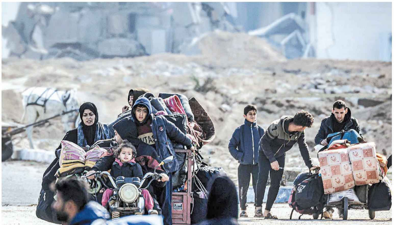
Según el Ministerio de Salud gazatí, hay 27.947 muertos en la Franja de Gaza, siendo en su mayoría mujeres, niños y adolescentes.

porque la ayuda llegue al territorio palestino, y señaló que el presidente de Egipto, Abdel Fatah al Sisi, inicialmente "no quería abrir la puerta para permitir el ingreso de la asistencia humanitaria".