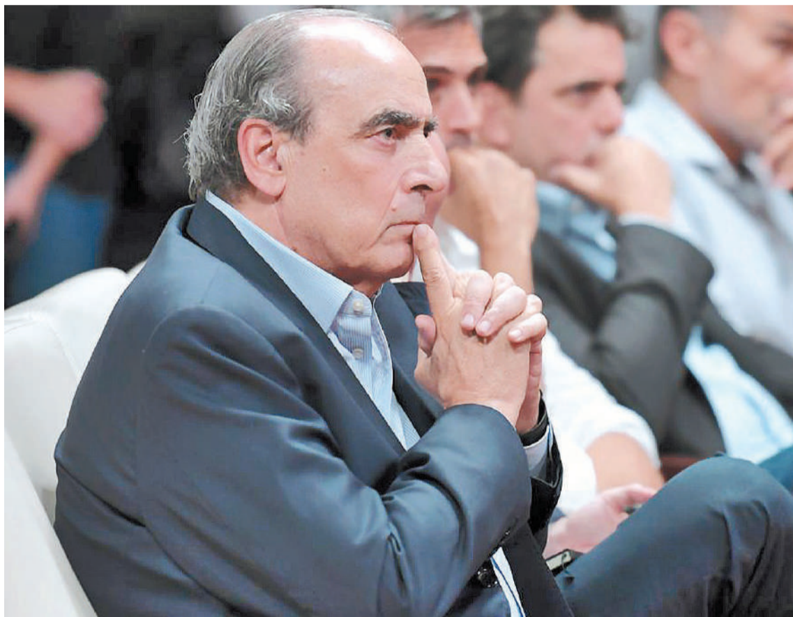
El ministro del Interior salió a aclarar tras la polémica que generó la medida que tomó el Gobierno nacional.

“El Covid pasó pero el fondo se mantuvo como siempre pasa en Argentina. Lo que hace el Gobierno es decir que, si este pacto fiscal está vigente, este fondo desaparece, no existe. No hay ya un fondo Covid”, señaló Francos.