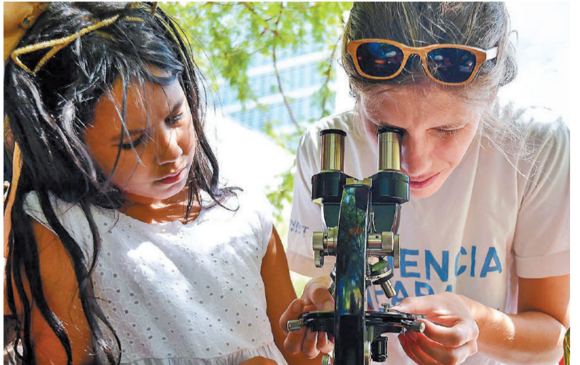
Entre 6 y 7 de cada 10 ingresantes a carreras vinculadas a la salud, ciencias sociales y educación, son mujeres. Mientras que 7 de cada 10 que ingresan a carreras de Computación, Ciencias de Datos, Matemática o Física en Exactas de la UBA, son hombres.

Las carreras vinculadas a la salud, las ciencias sociales y la educación aparecen como una prolongación de los roles de cuidado, maternales y domésticos, lo que no ha variado demasiado con las épocas. Del mismo modo, buena parte de las orientaciones científicas y tec-