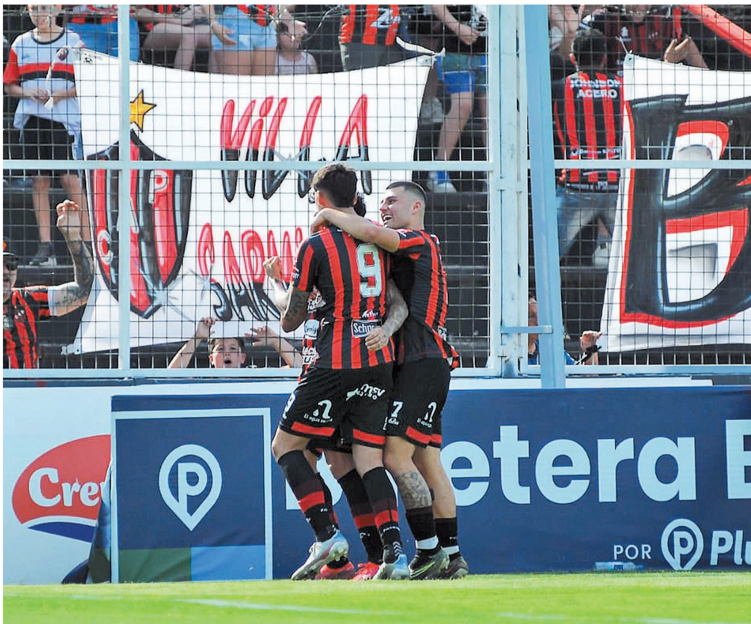
118 días después, Patronato vuelve a reencontrarse con su gente en su estadio. El último partido de la Primera Nacional 2023 fue en el Grella y terminó en empate ante Agropecuario.