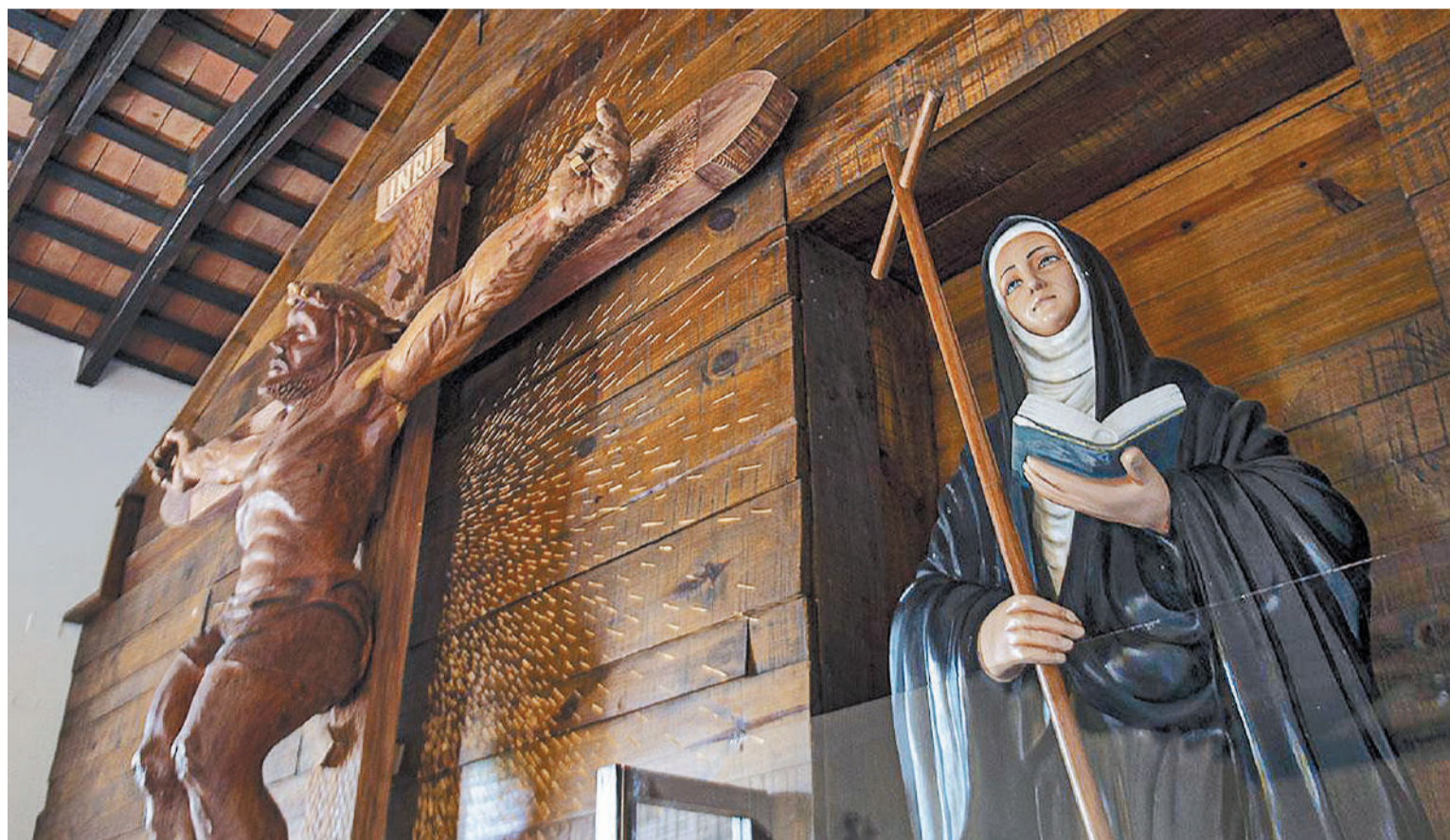
Mama Antula se convertirá en santa el domingo en una ceremonia presidida por el papa Francisco, a la que asistirá el presidente Javier Milei.