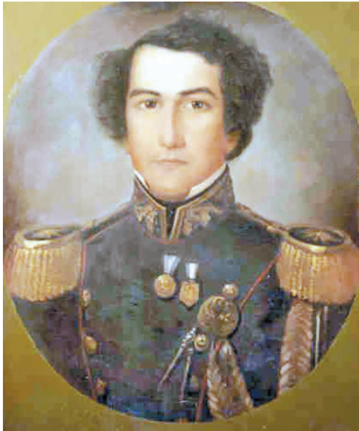
Lucio Mansilla, gobernador de Entre Ríos.

El Congreso Entrerriano reelige en el cargo al gobernador Lucio Mansilla, pero éste renuncia en un documento donde consigna los siguientes conceptos: "Una triste experiencia nos enseña que todos los hombres tenemos una inclinación cuasi irresistible a conservar eternamente el mando, una vez que hemos sido elevados o nos hemos elevado nosotros mismos a él; y también la experiencia nos ha hecho ver que esto no es compatible con la li-