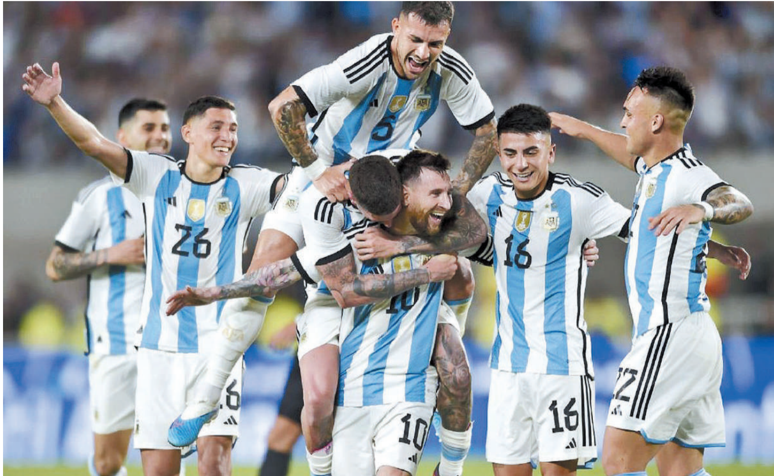
La Selección Argentina buscará llegar del mejor modo a la Copa América, siendo el rival a vencer de todo el continente.

LA AFA QUIERE JUGAR, AUNQUE EL PERIPLO SE COMPLIQUE