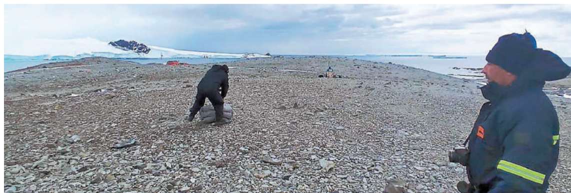
Técnicos del Instituto Geográfico Nacional viajaron a la Antártida y con un vehículo aéreo no tripulado (dron) realizan relevamientos aerofotogramétricos.

Cartografía de la Antártida.