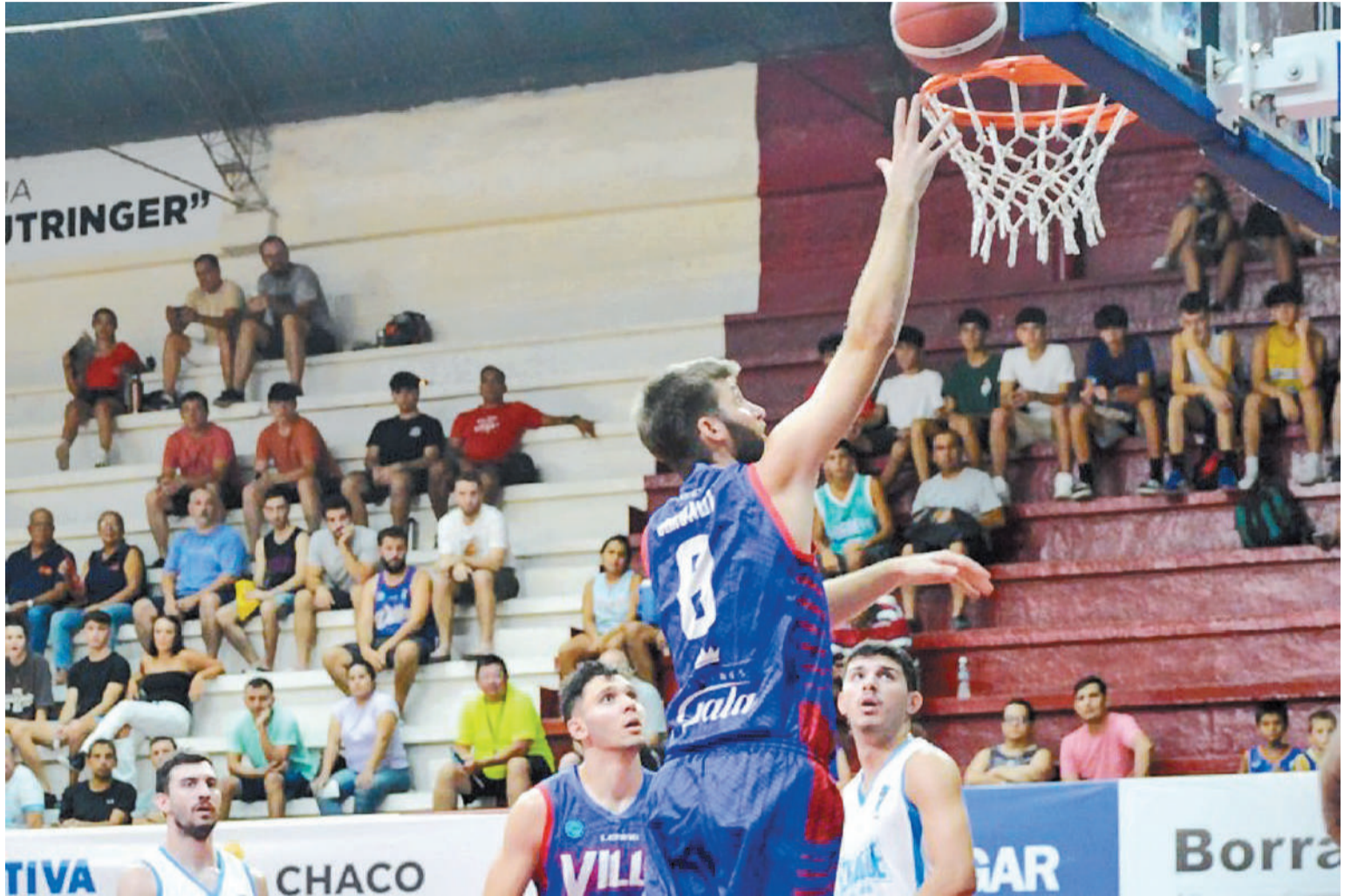
Echagüe no pudo en la noche de este miércoles ante Villa San Martín y buscará en pocos días, su recuperación en Córdoba ante Barrio Parque.

En los segundos diez continuaron los desaciertos en general; pero el Negro estuvo cinco minutos sin convertir que le hicieron daño. Para