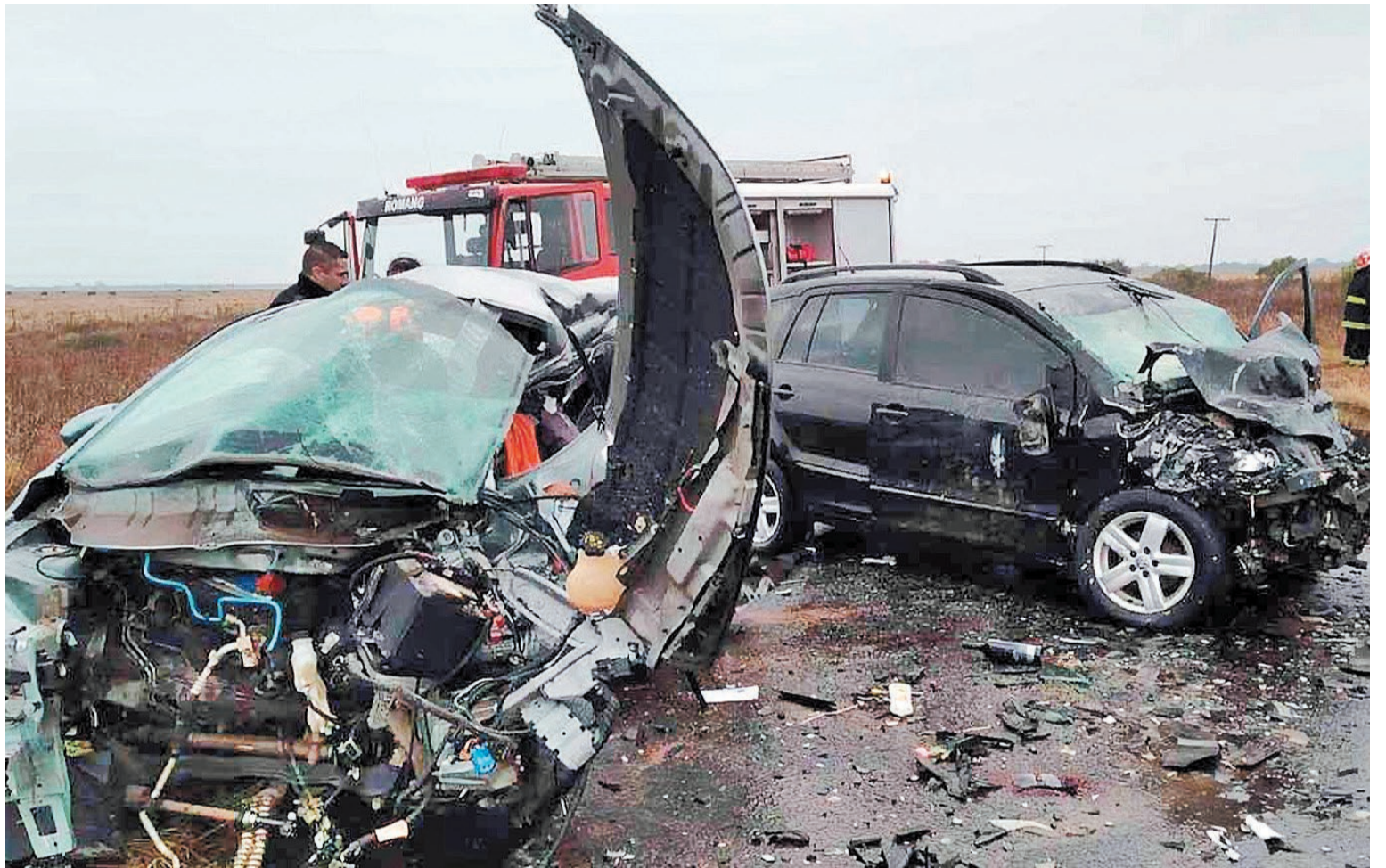
Para evitar accidentes hay que conocer y acatar las normas de tránsito.

2. Alerta y atento: al conducir se debe estar siempre alerta y atento