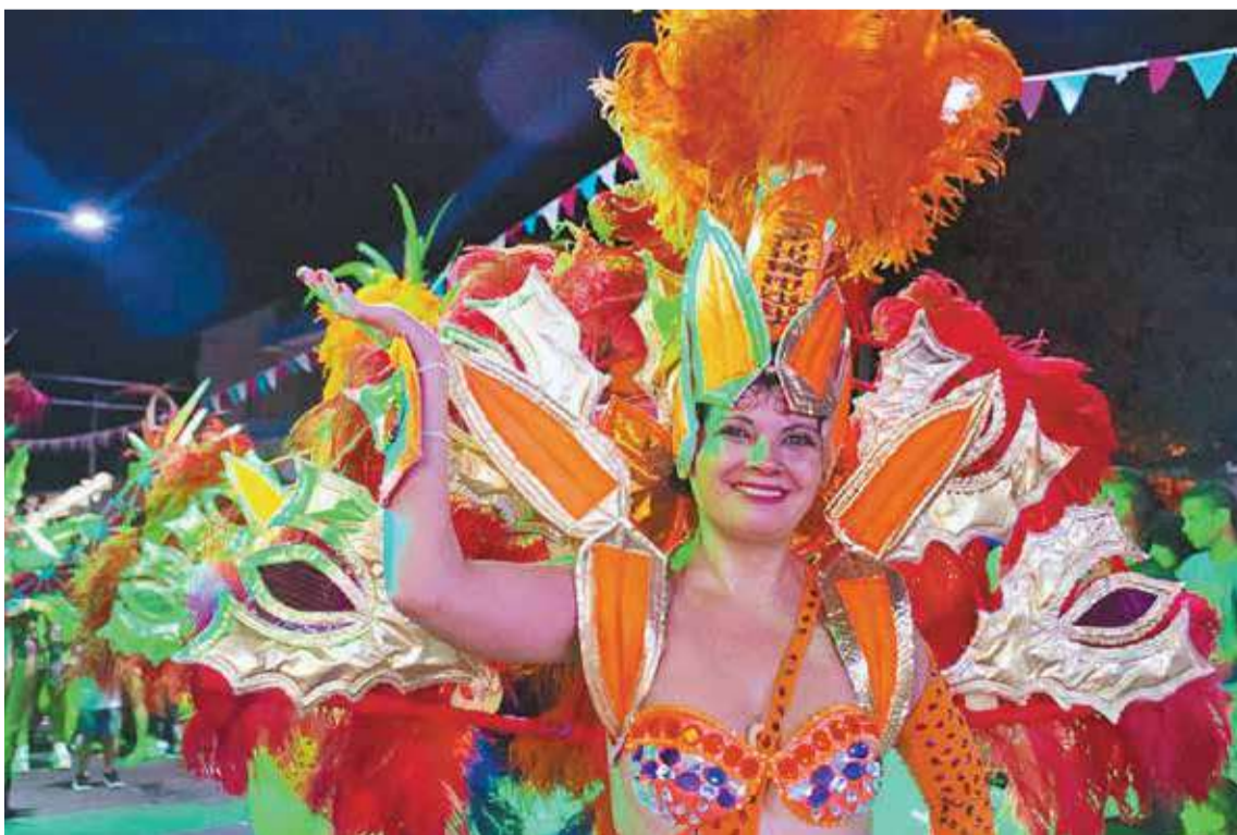
El sábado comienzan los carnavales en la plaza Mujeres Entrerrianas, sobre calle Maciá.

El 10, 11, 12 y 13 de febrero nueva edición de los tradicionales carnavales paranaenses con desfile de comparsas y batucadas, en calle Maciá.