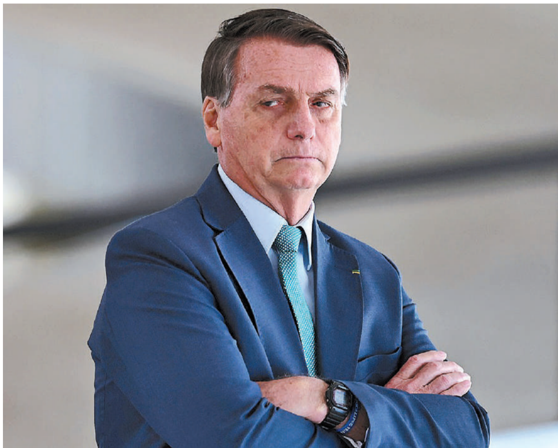
El 8 de enero de 2023 los bolsonaristas avanzaron sobre los edificios gubernamentales en Brasilia. Ahora, el ex presidente de Brasil, investigado por aquel hecho, no podrá salir del país.

arrepentido, para mejorar su situación personal.