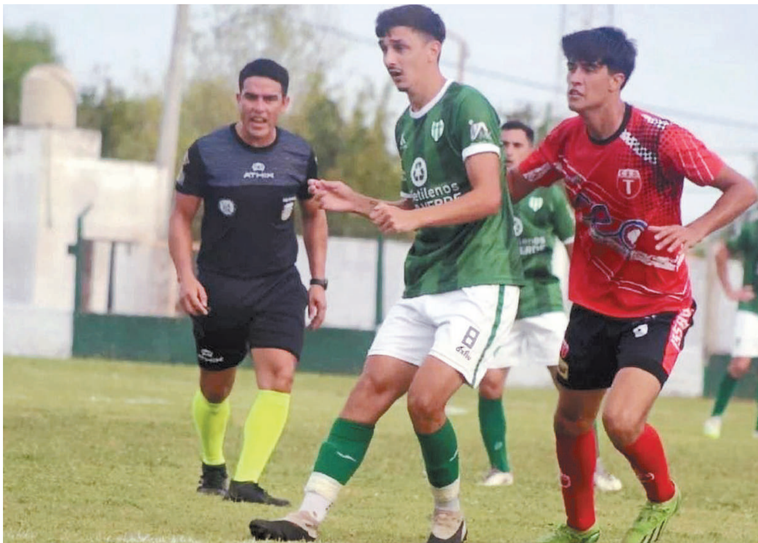
Oro Verde viene de empatar en dos ante Deportivo Tabossi, y es el escolta de Patronato en la zona cuatro, a tres puntos de diferencia.

A partir de hoy se empezará a desarrollar lo que será la segunda parte de la fase de grupos para los equipos que compiten en la Copa Entre Ríos de Fútbol. Respecto a los de Paraná y alrededores, abrirán hoy el telón Oro Verde ante Cultural de Crespo. Asimismo, en la rama femenina quedó definida la vuelta de la final, que dirimirá el campeón entre Unión de Crespo o Santa María de Oro.