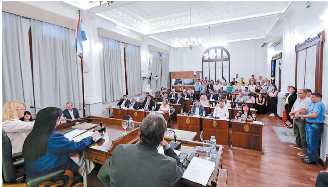
La emergencia educativa tiene como fin poner a todas las escuelas en condiciones edilicias óptimas e implementar un Plan de Alfabetización para el nivel inicial, primario y secundario de la provincia.

cia pública en materia educativa en Entre Ríos.