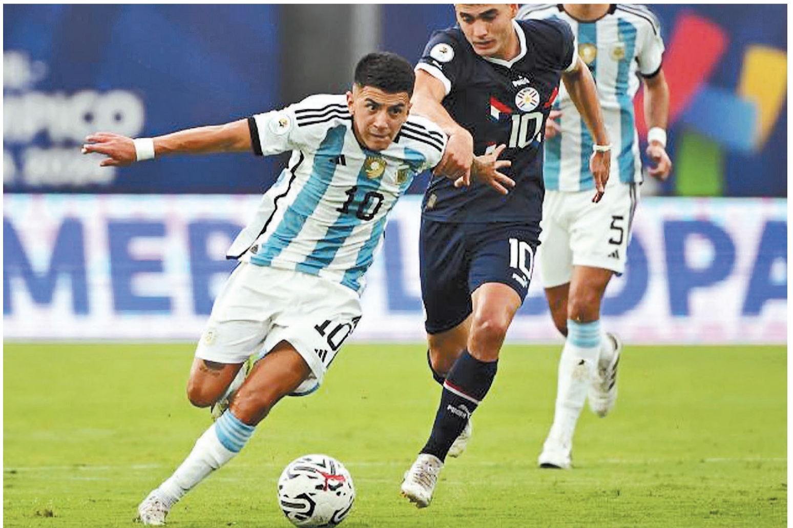
Argentina pagó caro sus propios yerros y el domingo se jugará su último boleto con el anhelo de llegar a París 2024.

La selección Sub 23 de Argentina empató 3-3 ante su similar de Paraguay, por la segunda fecha del cuadrangular final del Preolímpico que se juega en Venezuela. Así, los dirigidos por Javier Mascherano quedaron obligados a vencer el domingo a Brasil para acceder a la cita olímpica de París.