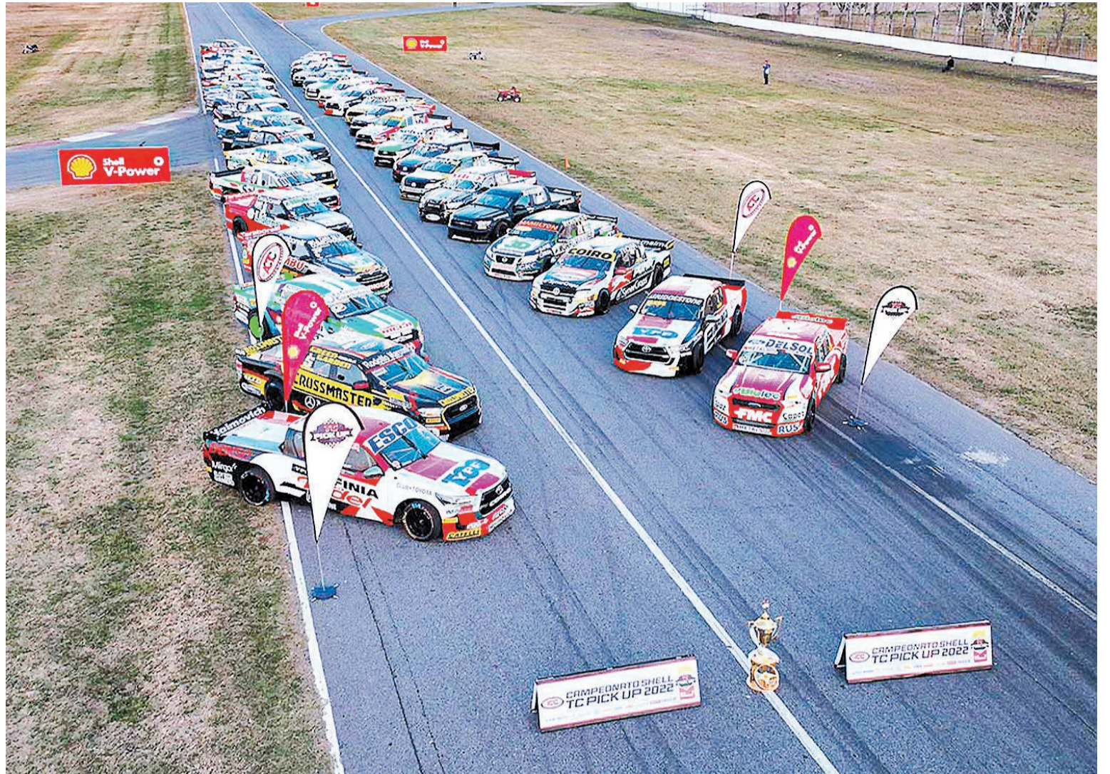
Con 25 inscriptos comenzará este fin de semana, la séptima temporada del TC Pick Up.