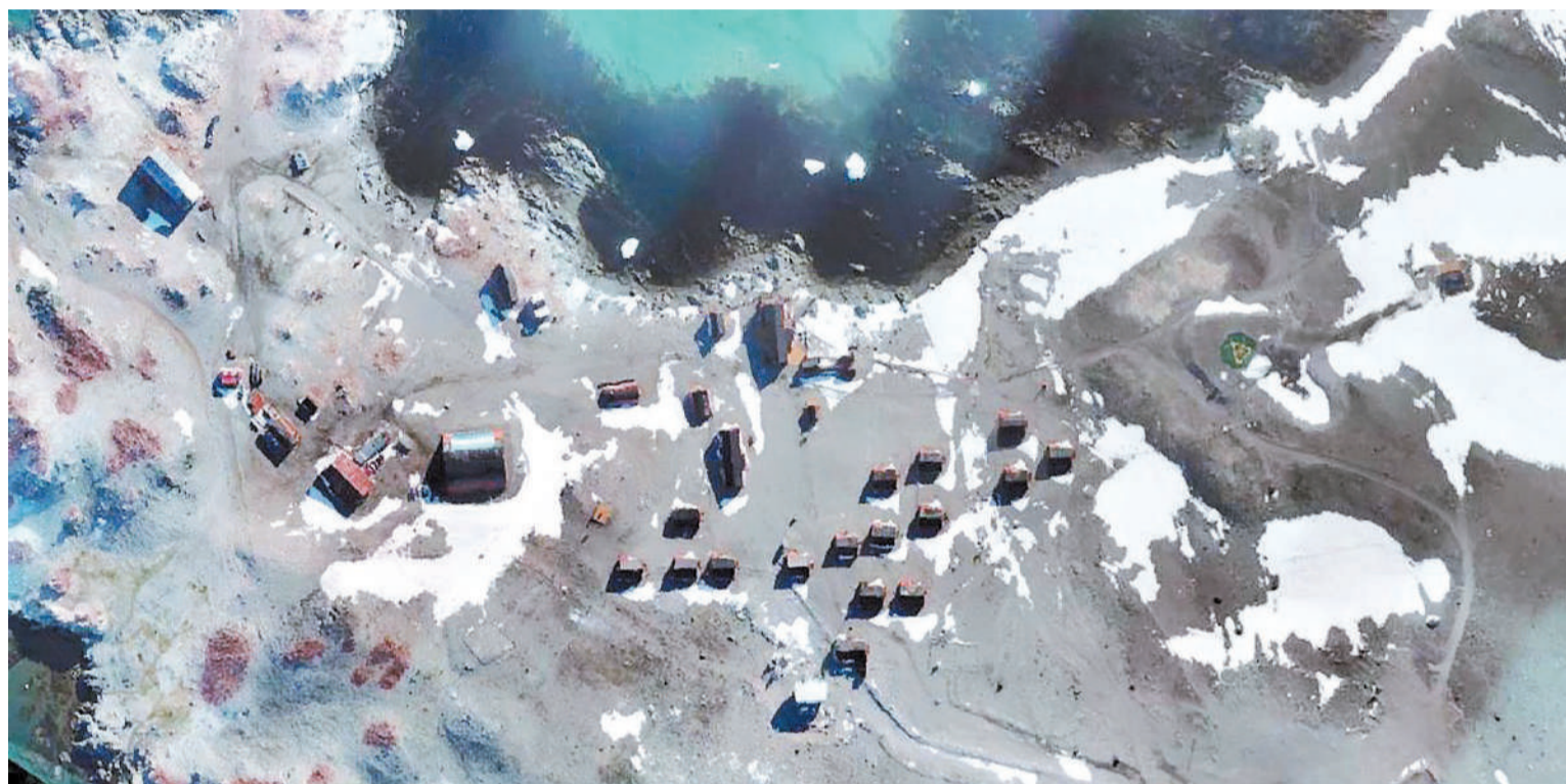
La tarea permitirá comenzar un proyecto de actualización cartográfica de las bases argentinas en el continente blanco.

DETALLES. El responsable de este servicio, conformado por 39 militares con formación técnica que pertenecen a la Dirección General de Investigación y Desarrollo del Ejército Argentino, es el teniente coronel