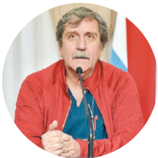
Guillermo Grieve, ministro de Salud de la provincia.

“Cada entrerriano debe tener la mejor medicina para prevenir las enfermedades”