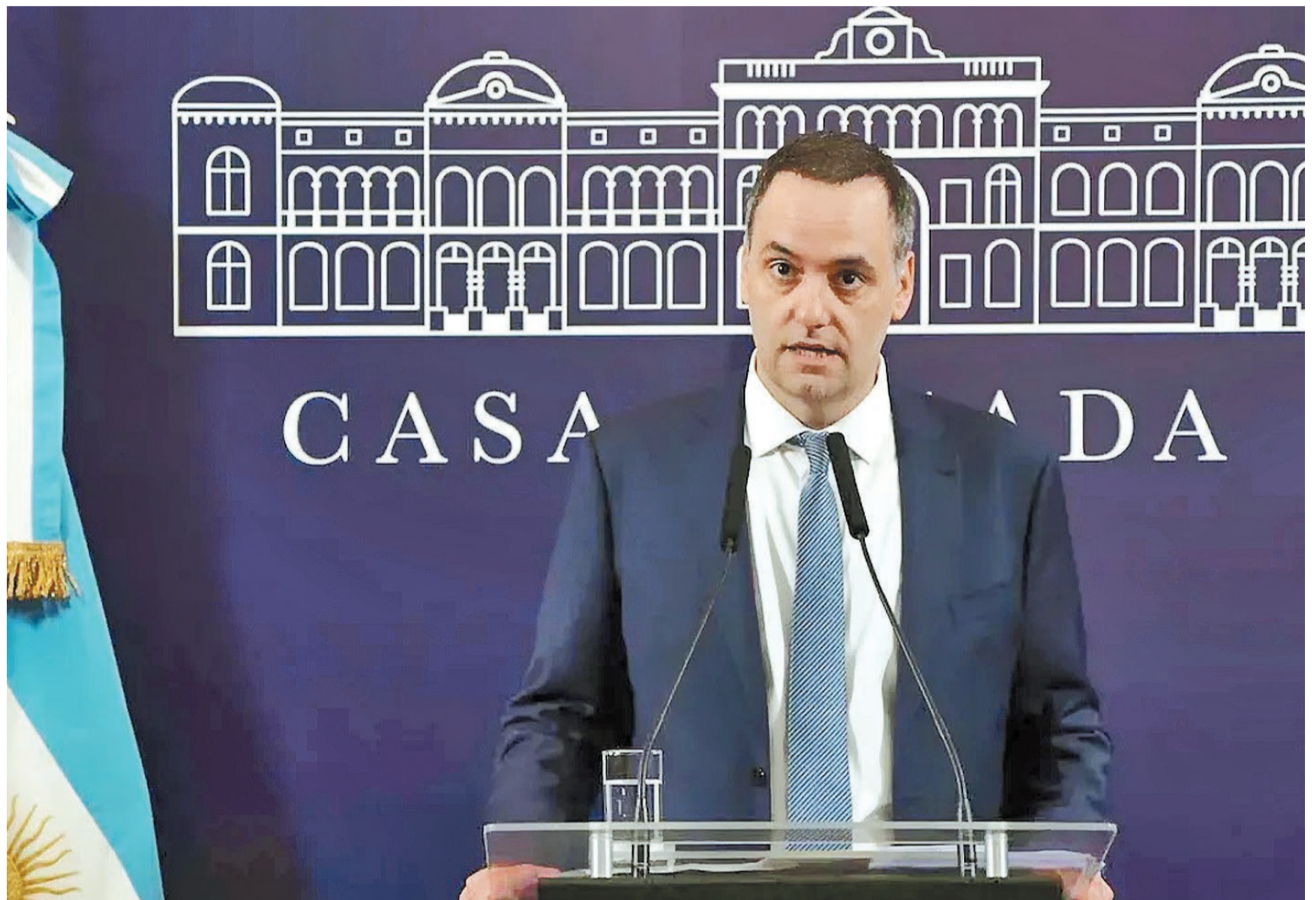
La aclaración fue hecha por el vocero presidencial.