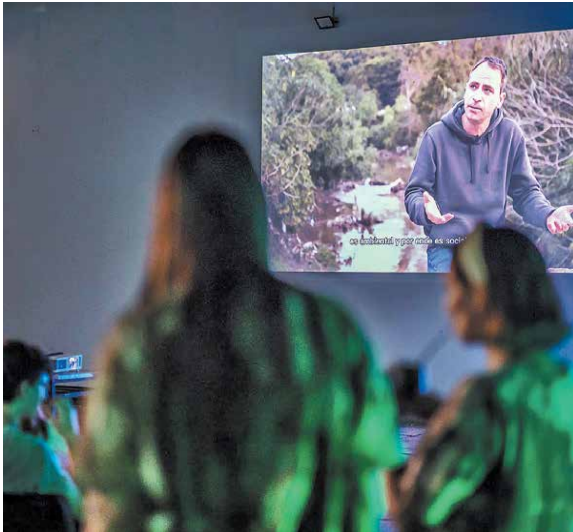
Hoy desde las 20.30 en el patio del Museo de Bellas Artes, habrá EcoCinema y se proyectará "Mavka" (La guardiana del bosque).

Hoy a las 20.30, en el patio del Museo Provincial de Bellas Artes "Dr. Pedro E. Martínez", ubicado en calle Buenos Aires 355, es la