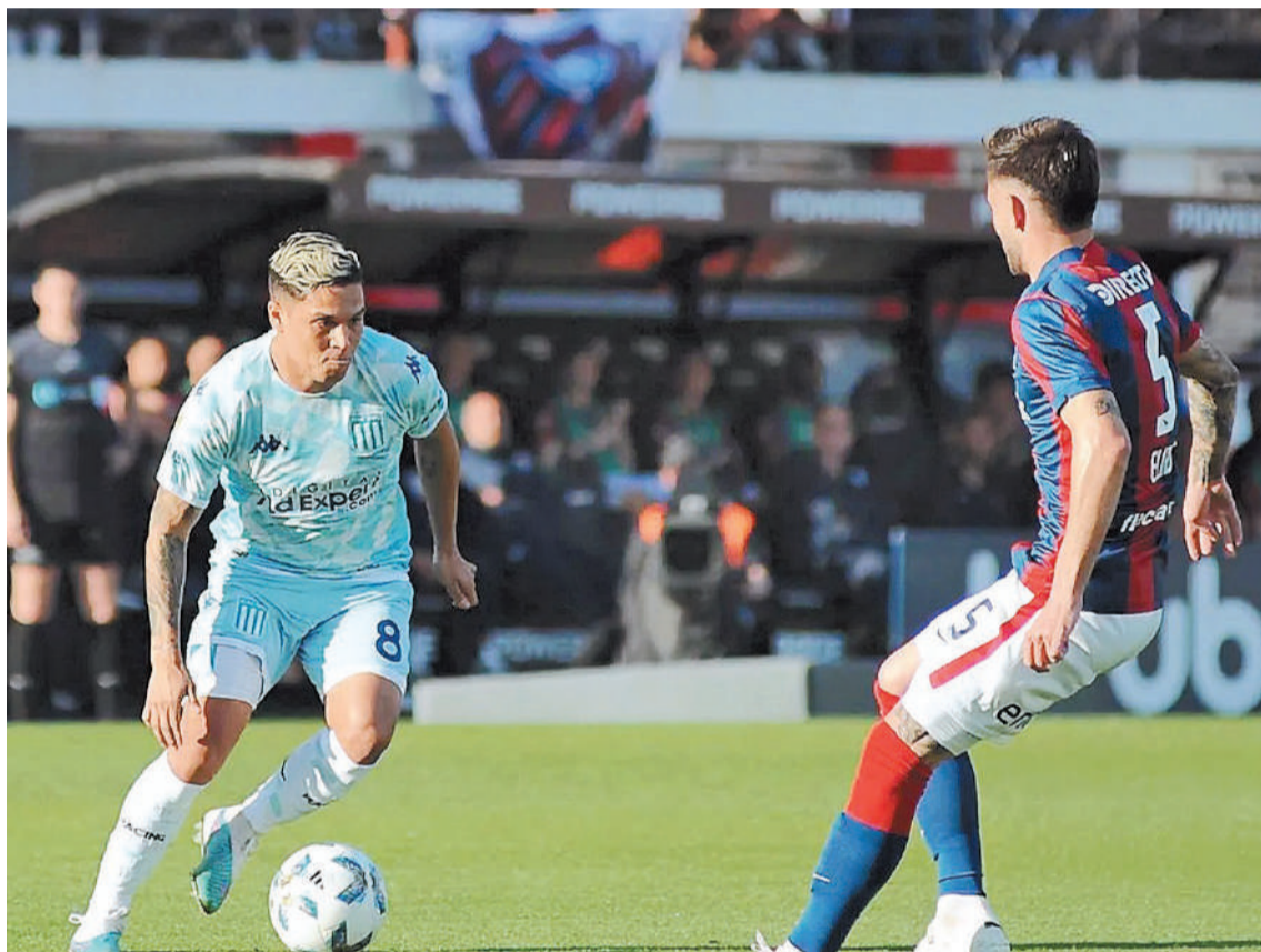
Los de Avellaneda marchan en la sexta colocación, pero los de Boedo han tenido un arranque complicado y la hinchada hizo llegar su malestar, tras la cosecha de solo dos puntos.

Racing recibe a San Lorenzo de Almagro, en un clásico con urgencias por el inicio irregular en la Copa de la Liga Profesional de Fútbol, en la continuidad de la cuarta fecha de la zona B. Además, por la misma zona Newell's arriesgará su condición de líder ante Unión, en Santa Fe.