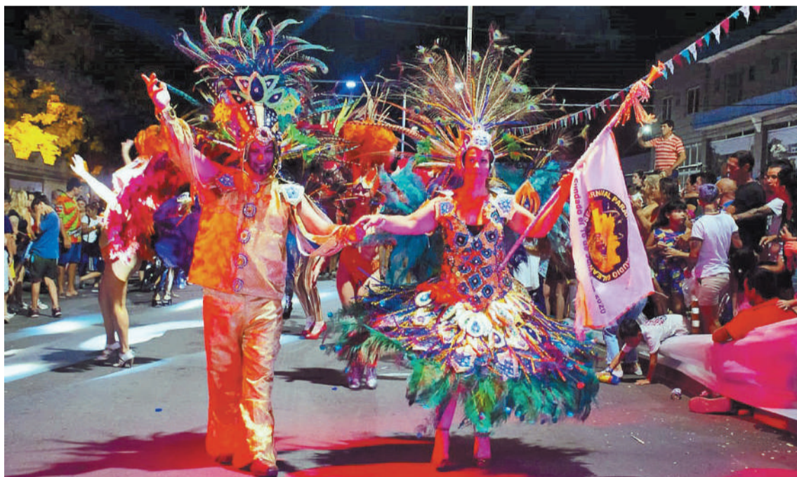
Organizado en el circuito de Calle Maciá, el carnaval propone –a través de las comparsas locales– diversión, color, fantasía a ritmo de batucada, en un ambiente familiar.