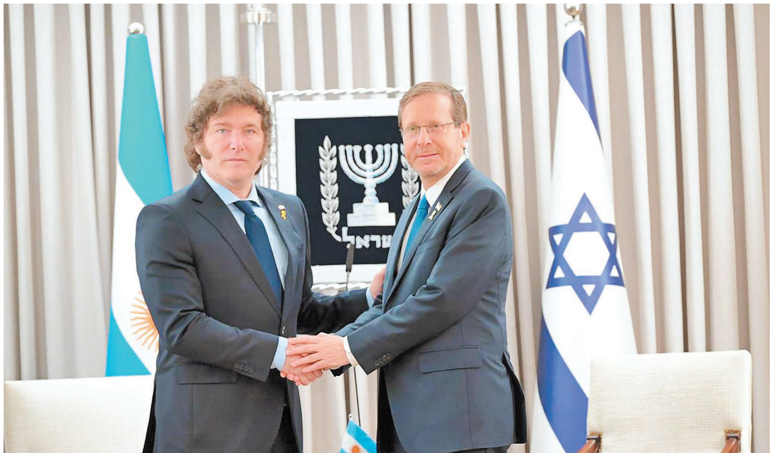
Desde Israel, donde inició su gira, Milei dijo que "la casta se puso en contra del cambio que los argentinos votamos en las urnas; van a tener que explicarle a la sociedad por qué", en referencia al regreso de la ley ómnibus a comisiones.

El diputado nacional de Unión por la Patria (UxP) Leandro Santoro dijo que el retorno de la ley Bases a comisión es una "derrota política del gobierno y papelón histórico! La Ley vuelve a comisión!", sostuvo el legislador opositor en su cuenta de X. Santoro añadió que "nunca se vio algo así. Se mintieron entre ellos y se cae todo".