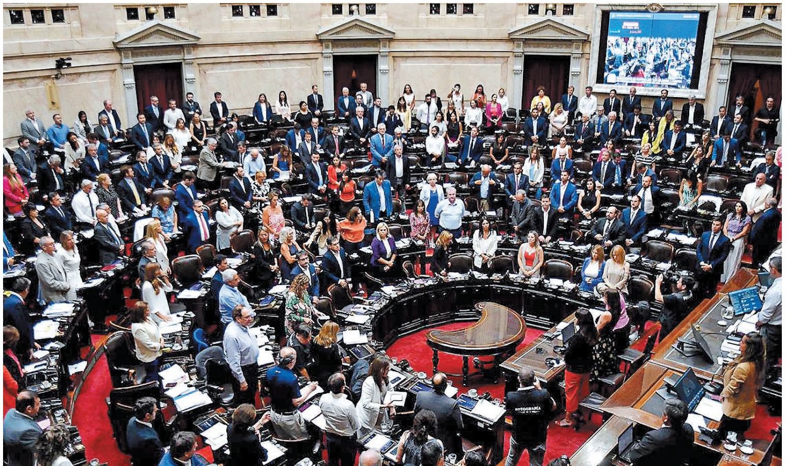
Tras aprobar el proyecto en general el viernes y los primeros seis artículos ayer, por falta de acuerdo entre diputados oficialistas y opositores dialoguistas, la ley Bases vuelve a comisiones y deja atrás sus avances.

car Zago, tras lo cual el presidente del cuerpo, Martín Menem, subió a su estrado y comunicó la decisión de levantar la sesión. Previamente tuvo lugar un intercambio entre funcionarios del gobierno nacional y legisladores de la oposición. Los representantes del Ejecutivo dejaron claro a quiénes apuntan por el paso fallido del proyecto hacia su aprobación: los gobernadores de las provincias cuyos legisladores debían acompañar con su voto la ley.