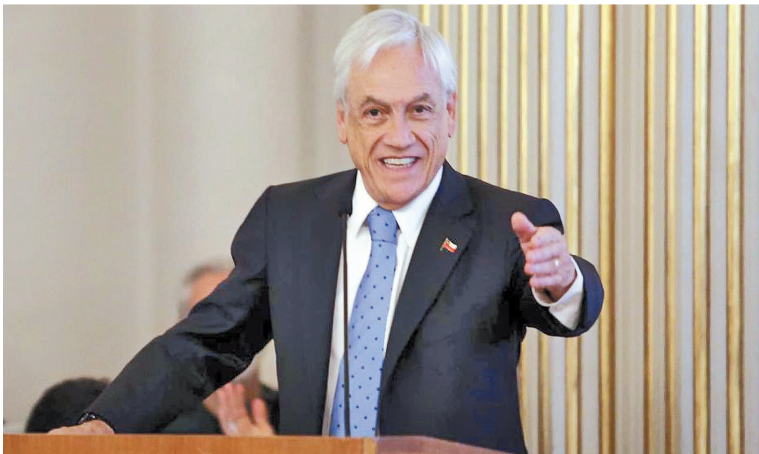
El ex presidente chileno murió a los 74 años de edad.

Ingeniero comercial con mención en Economía por la Universidad Católica de Chile y con un