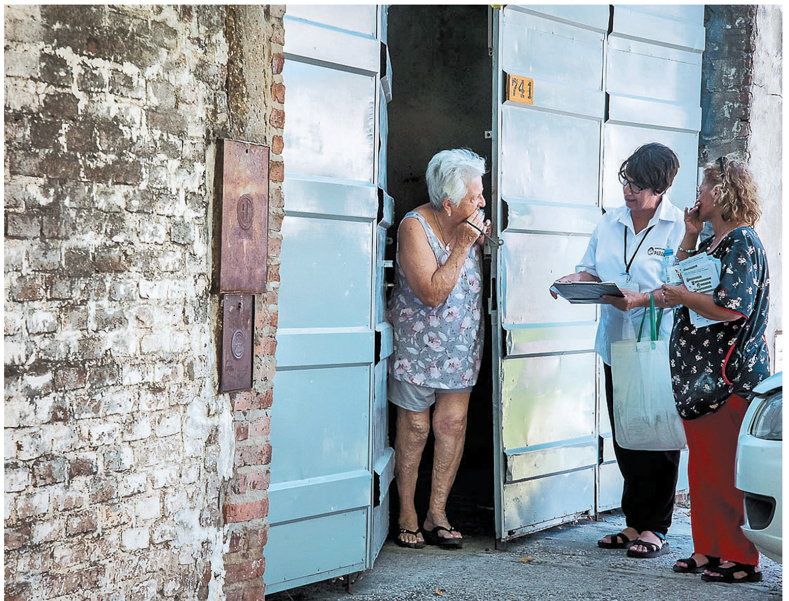
Los operativos se desarrollan en conjunto entre trabajadores municipales y de la provincia.

Ayer los operativos conjuntos del Municipio y Provincia tuvieron lugar en calle Confederación Argentina y Zapata y en sectores de barrio La Floresta. Mañana se hará la descacharrización en ambos sitios, donde se detectaron casos sospechosos.