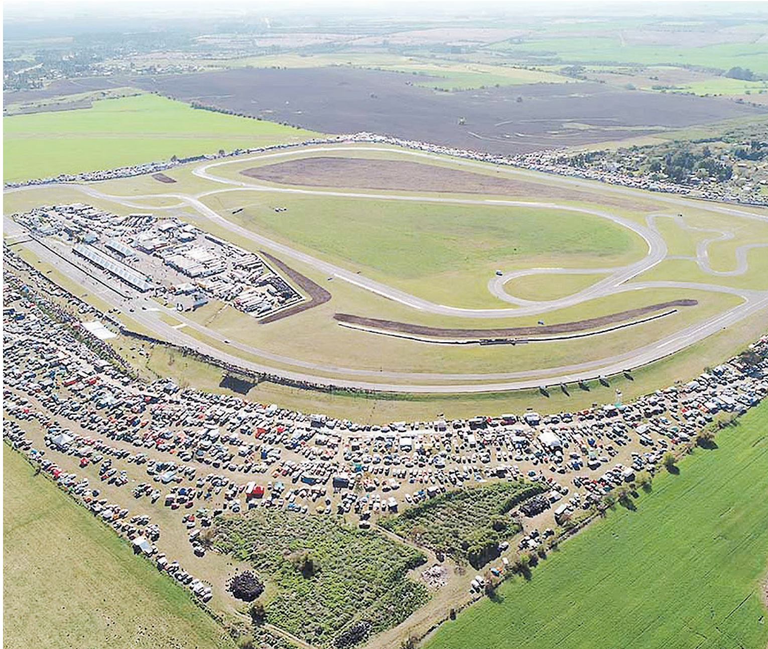
El autódromo del Club de Volantes Entrerrianos, es uno de los de mayor convocatoria del país y la llegada del TC le daría a la ciudad un impulso de nivel.