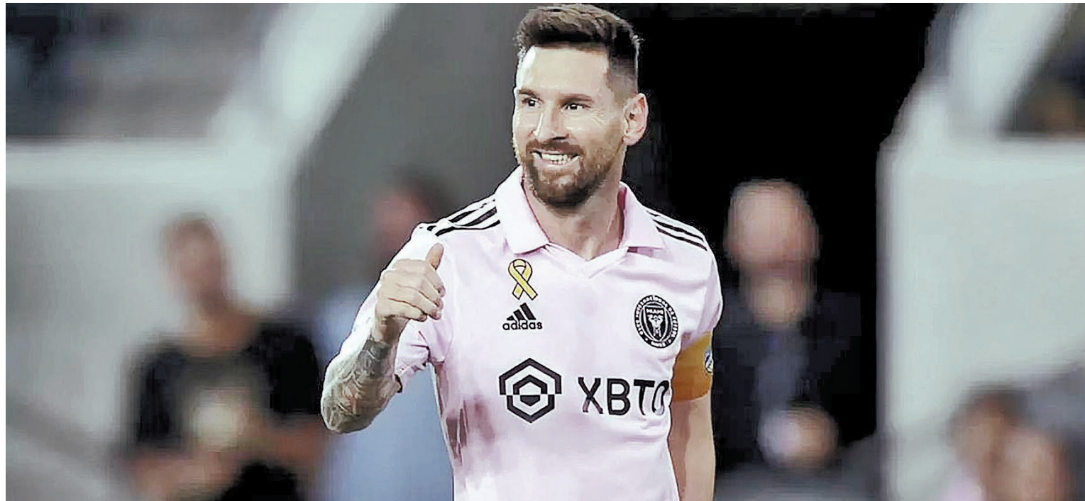
El astro rosarino aún es una incógnita en el cierre de la gira del Inter de Miami por Japón.