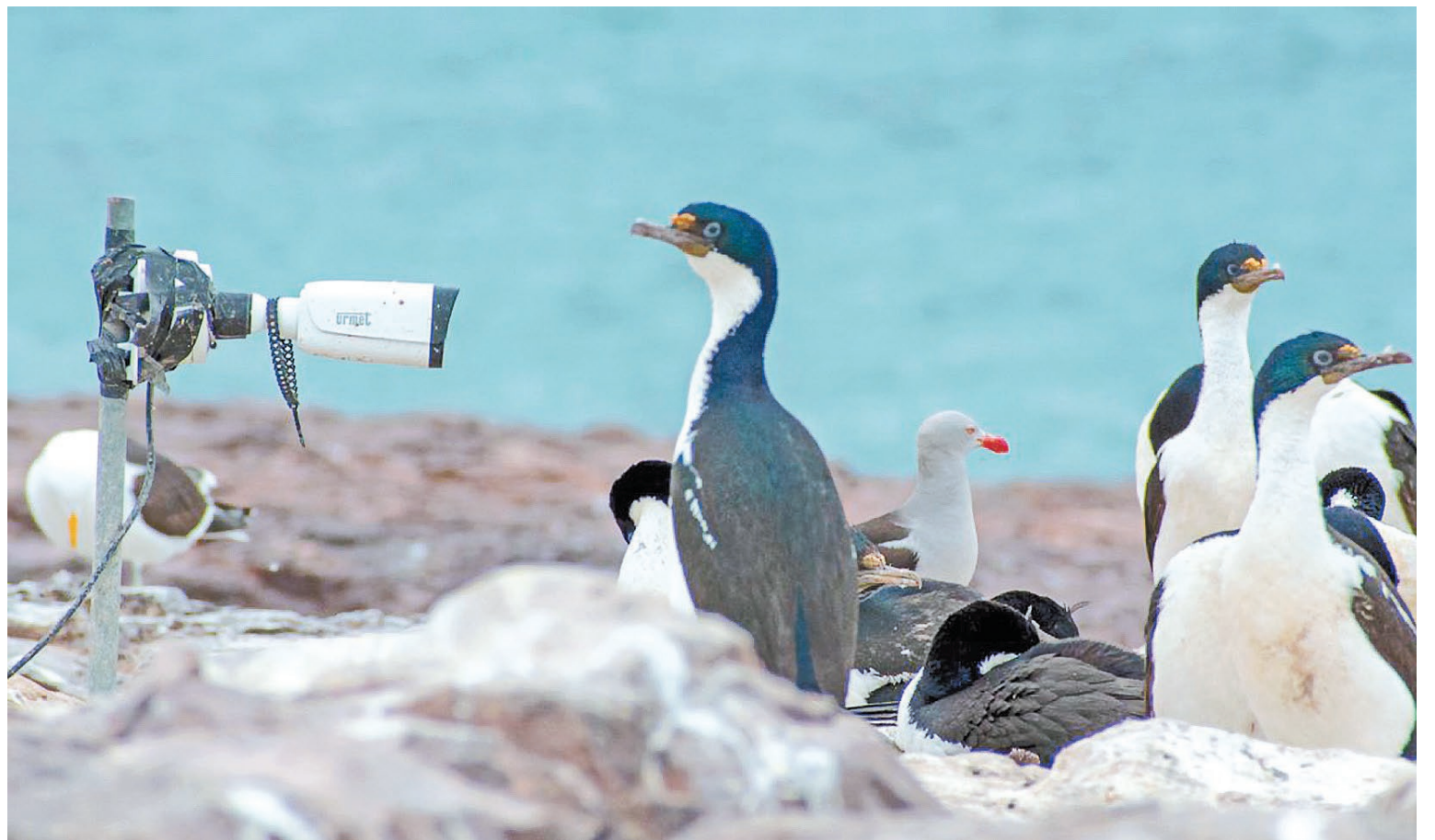
Las cámaras monitorean su "performance" reproductiva, la tasa de crecimiento de los pichones y la frecuencia de alimentación.

Si bien las tres especies de aves que forman parte del monitoreo cuentan con un estado de conser-