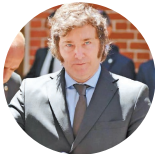
Javier Milei, Presidente de Argentina.

“Vamos a continuar con nuestro programa con o sin el apoyo de la dirigencia política que destruyó nuestro país”