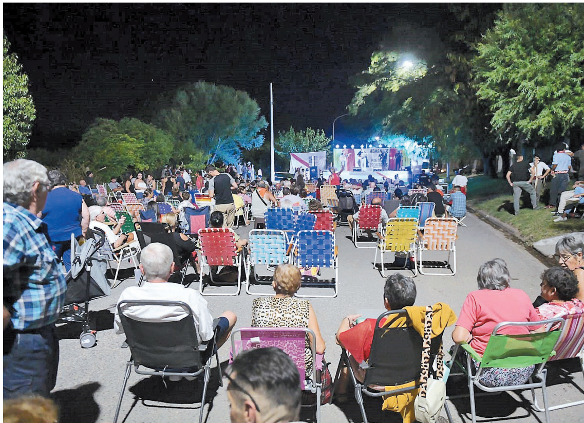
El festival es una iniciativa netamente barrial que es organizada y sostenida por vecinos del Barrio Las Rosas.

BRILLO ESPECIAL. La palabra hecha versos posee un brillo especial. De allí el valor de rescatar esta manera de comunicar. Es conocida la afirmación del poeta alemán Fried-