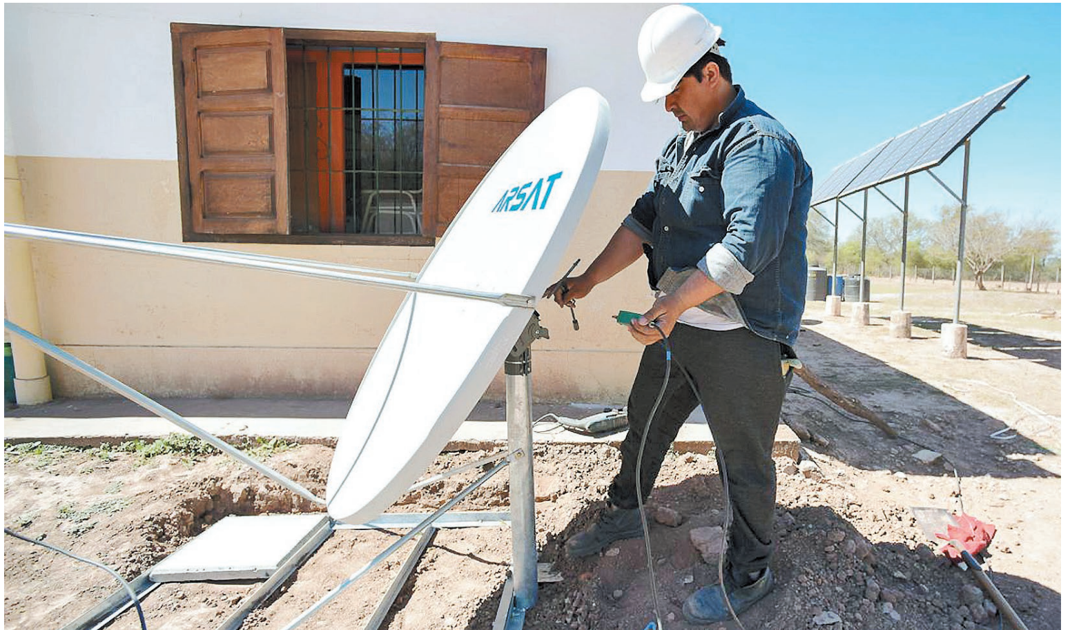
En los últimos años hubo un gran desarrollo de la tecnología en diferentes puntos del país y es imprescindible conocer las herramientas que ofrece.

ción personal que se publica en internet y estar alerta a correos electrónicos y mensajes sospechosos que buscan robar información personal.