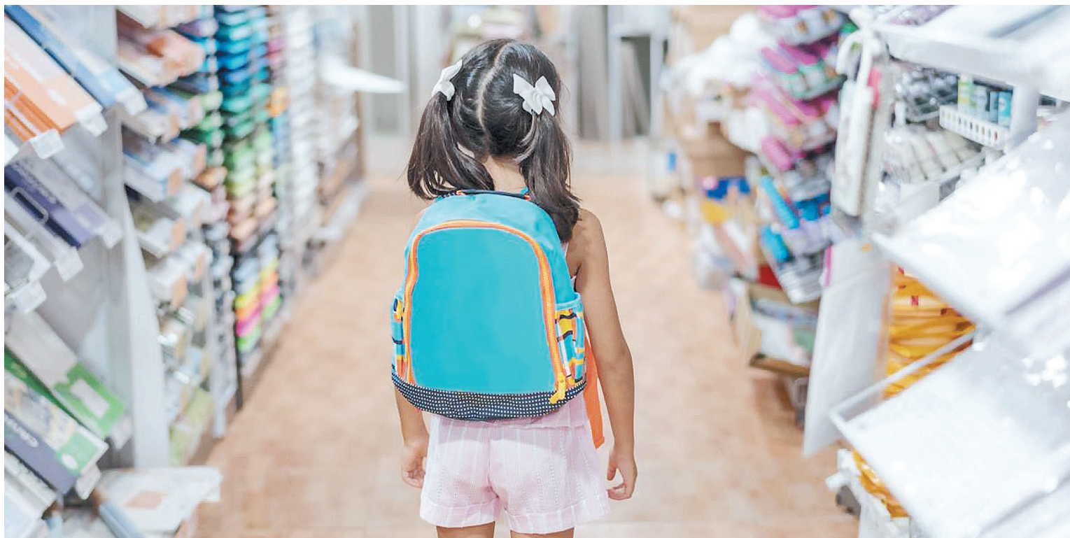
El cálculo fue realizado por la Cámara Argentina de Papelerías, Librerías y Afines.

El cálculo de la Cámara Argentina de Papelerías, Librerías y Afines se complementa con la actitud de muchos padres de adelantar las compras, obteniendo ahorros significativos que llegan hasta un 45%, según indicaron desde una cadena.