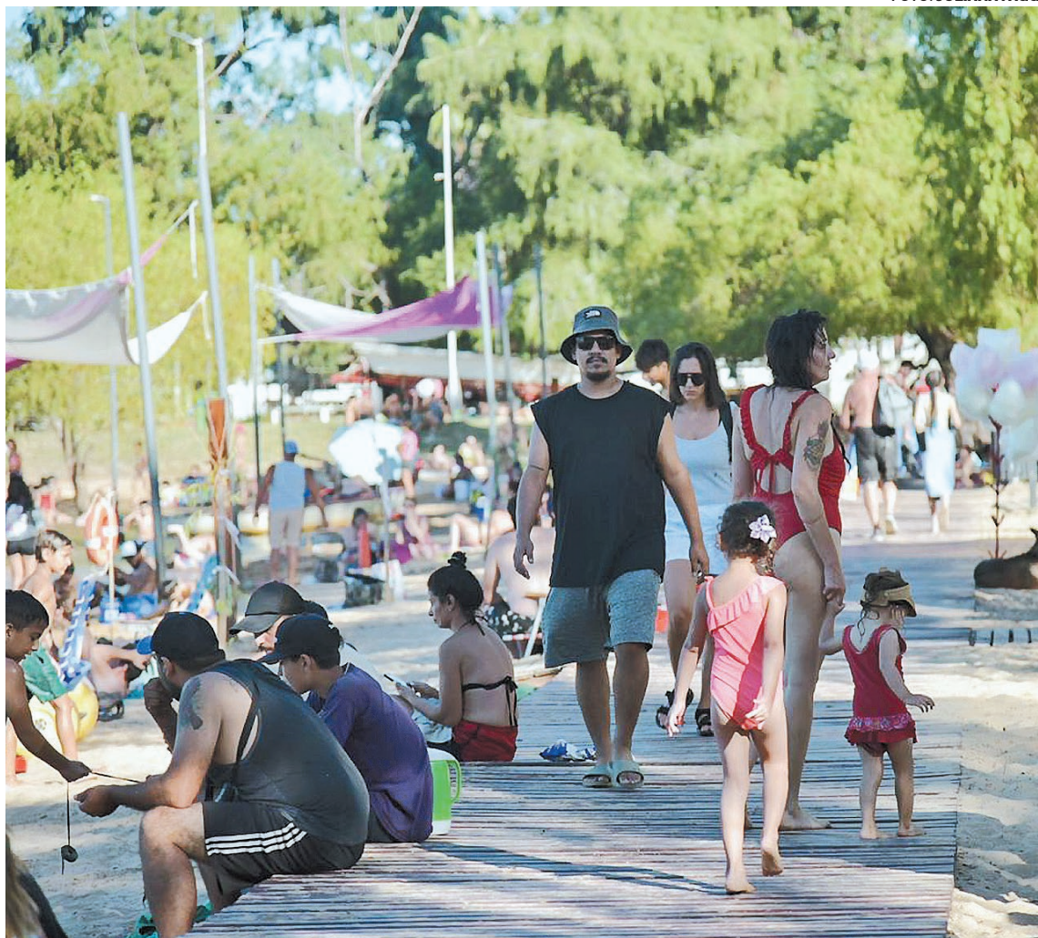
El Gobierno intenta incrementar el turismo con el programa.

te) tienen un denominador que es la calidad de vida, el bienestar, un abordaje moderno”, subrayó.