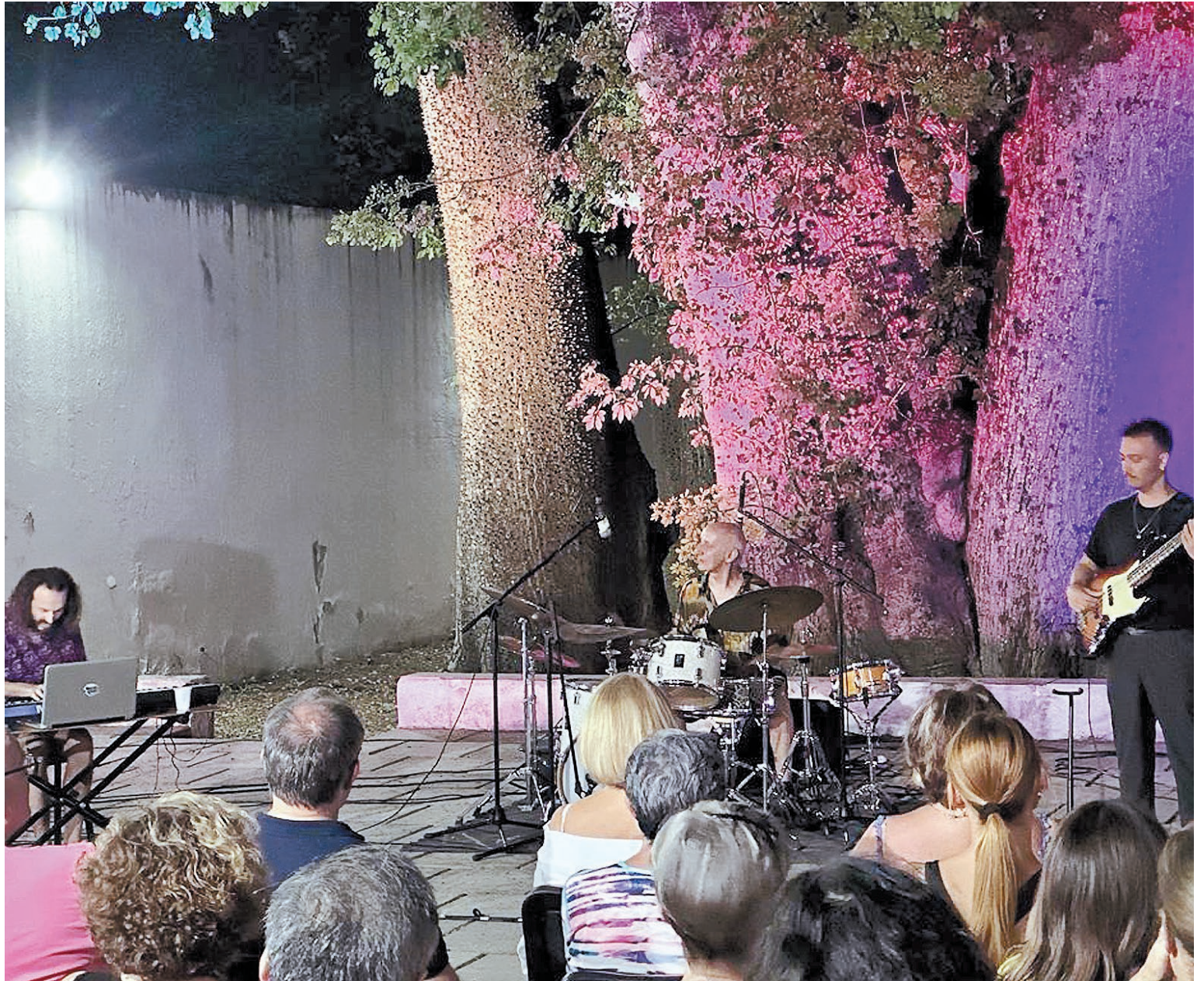
Mañana a las 20.30, en el patio del Museo de Bellas Artes, se presentará el grupo The Jo-Se Projects.

Patos 3D: 18.20 Patos: 14.15 | 16.00 Jack en la caja maldita 3: 22.30 Argylle: agente secreto: 19.00 Chicas malas: 16.40 | 20.15 Pobres criatura (subt): 21.40 Con todos menos contigo: 20.20 El niño y la garza (subt): 14.20 | 18.00