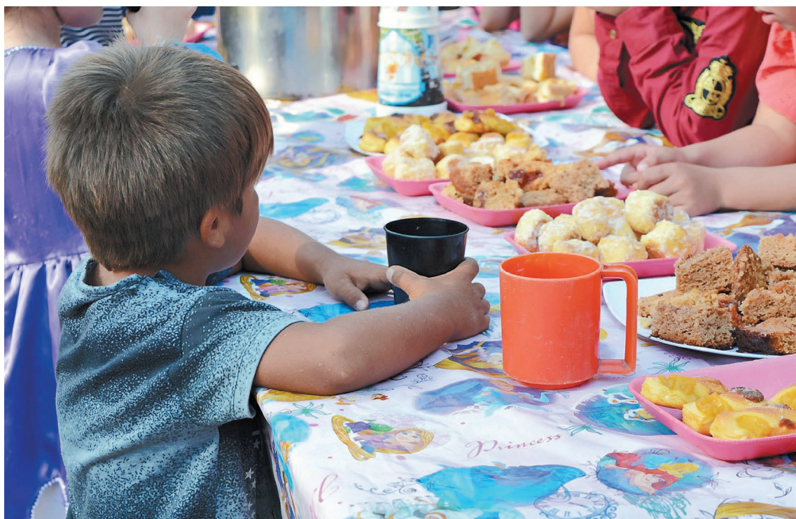
La Conferencia Episcopal Argentina advirtió que “cientos de miles de familias” en el país tienen problemas para “alimentarse bien”, y afirmó que “la comida no puede ser una variable de ajuste”.

A través de un documento titulado “El pedido del pan de cada día es un clamor de justicia”, la entidad presidida por Oscar Ojea destacó la importancia de atender a los comedores comunitarios, entre otras instituciones. “Una mamá puede privarse de tomar un colectivo y camina para ahorrar, pero de ninguna manera puede no darle de comer a sus hijos”, destacaron.