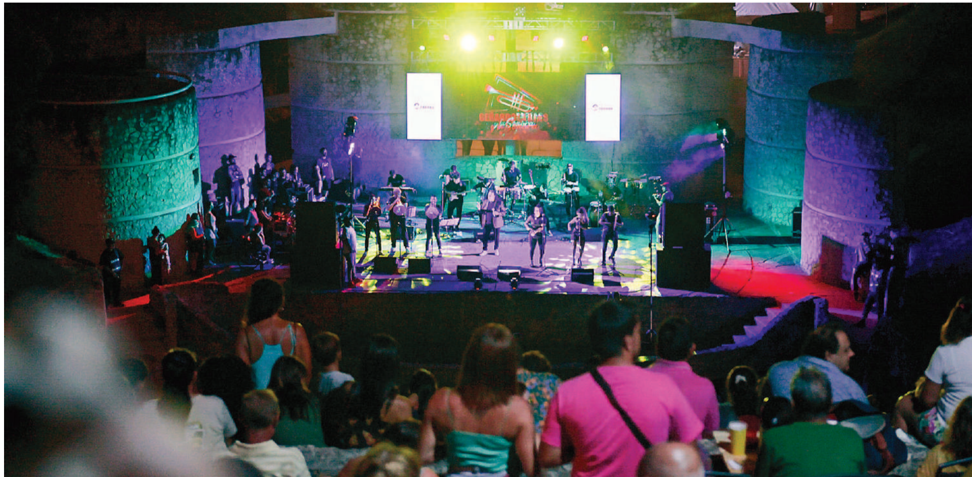
El evento convocó a una gran cantidad de personas durante tres fines de semana consecutivos.

► SE DESARROLLÓ DURANTE TRES SÁBADOS CONSECUTIVOS