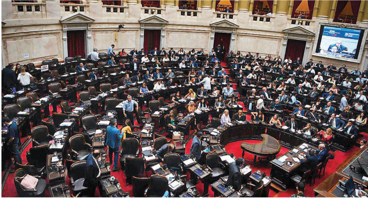
Mañana desde las 14, los Diputados volverán a tratar la ley Bases. Luego de su aprobación en general, ahora deberán debatir artículo por artículo.