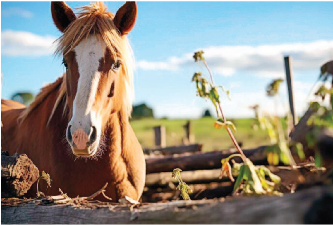
Cinco personas residentes de la provincia atravesaron la Encefalitis Equina del Oeste, una enfermedad transmitida por mosquitos infectados. Se registró una víctima fatal, que tenía problemas de salud de base.

Redacción coordinacion@eldiario.com.ar EL DIARIO