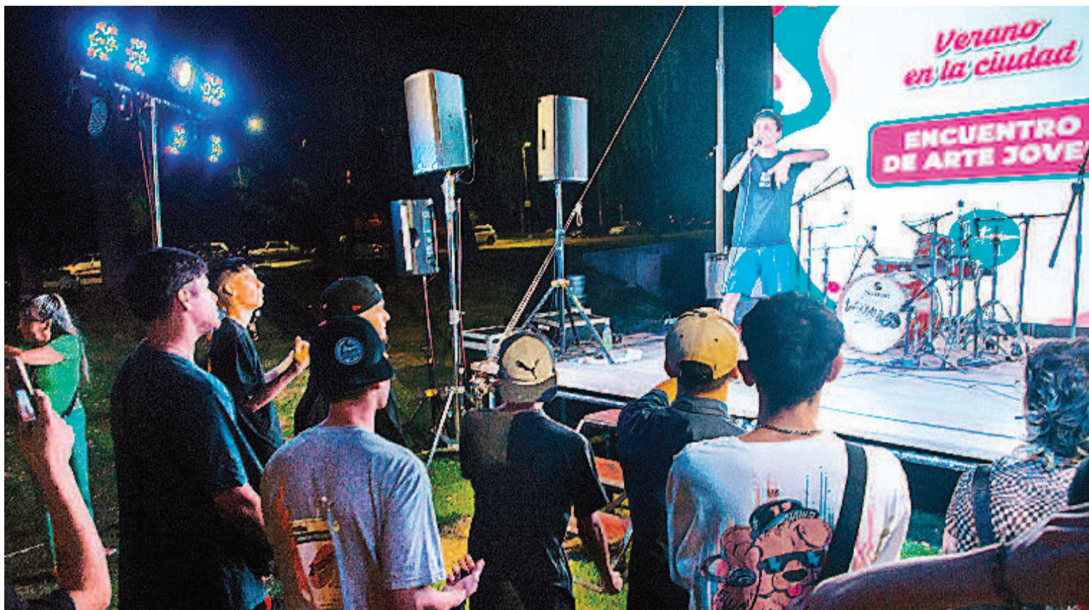
El viernes se desarrollará un nuevo encuentro de "Arte joven", organizado por la Municipalidad de Paraná.

En el Anfiteatro Héctor Santángelo, el domingo 8 y 19 de febrero a las 21, Cine bajo las estrellas. Acceso libre y gratuito.