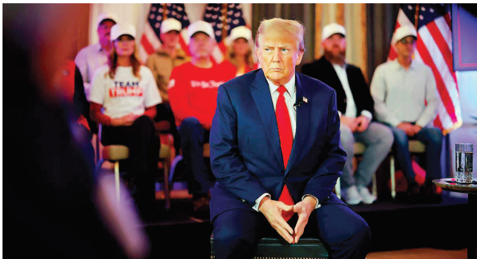
Trump continúa envuelto en problemas judiciales en su carrera por retomar el poder en Estados Unidos.

En diciembre, la Corte Suprema de Colorado hizo lugar a un pedido de republicanos de excluir al expresidente de la primaria estatal por sus esfuerzos para desconocer su derrota electoral de 2020 contra Joe Biden, que terminó en un ataque de sus seguidores al Congreso. Esta semana, la Corte Suprema de los Estados Unidos analizará ese fallo.