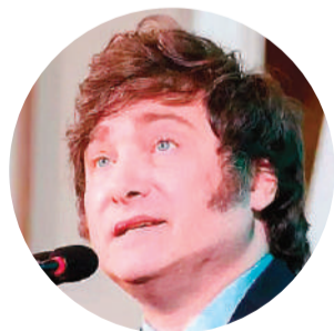
Javier Milei, presidente de la Nación

“Lo estamos logrando; evitamos la híper, la inflación empezó a bajar”