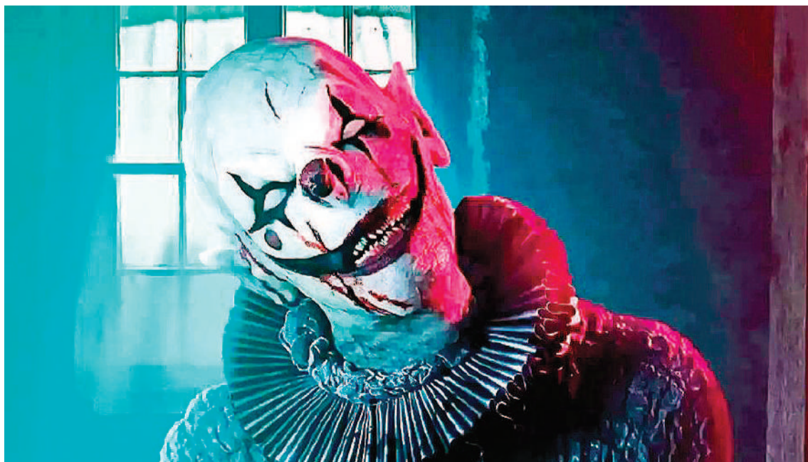
Jack en la caja maldita 3 se puede ver en los cines Círculo, Sunstar y Las Tipas.

El 10, 11, 12 y 13 de febrero nueva edición de los tradicionales carnavales paranaenses con desfile de comparsas y batucadas, en calle Maciá.