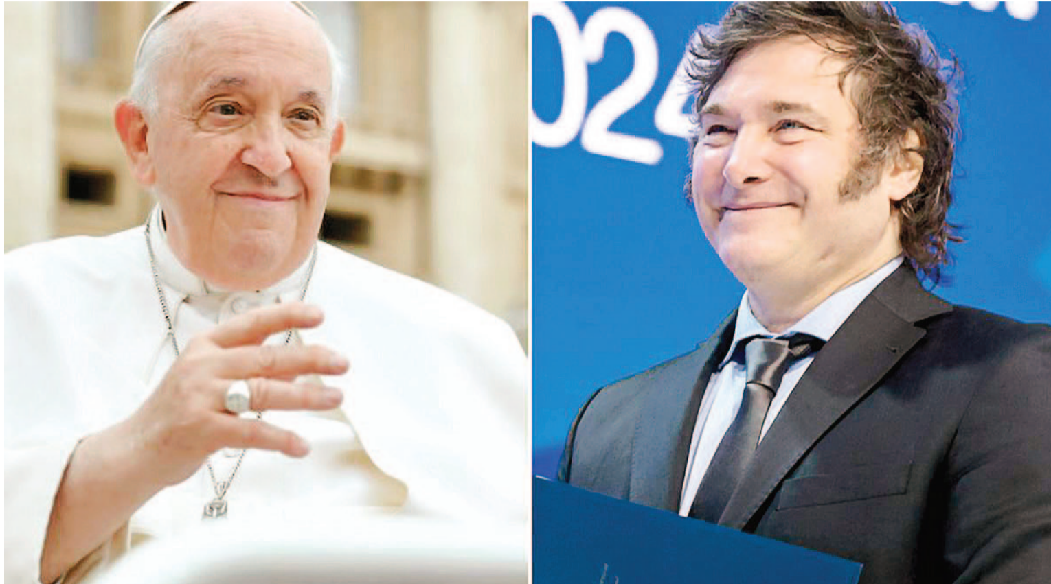
El Presidente Milei comienza hoy una gira que incluirá reuniones con los primeros ministros de Israel e Italia. El viaje concluirá con el Papa Francisco en el Vaticano.