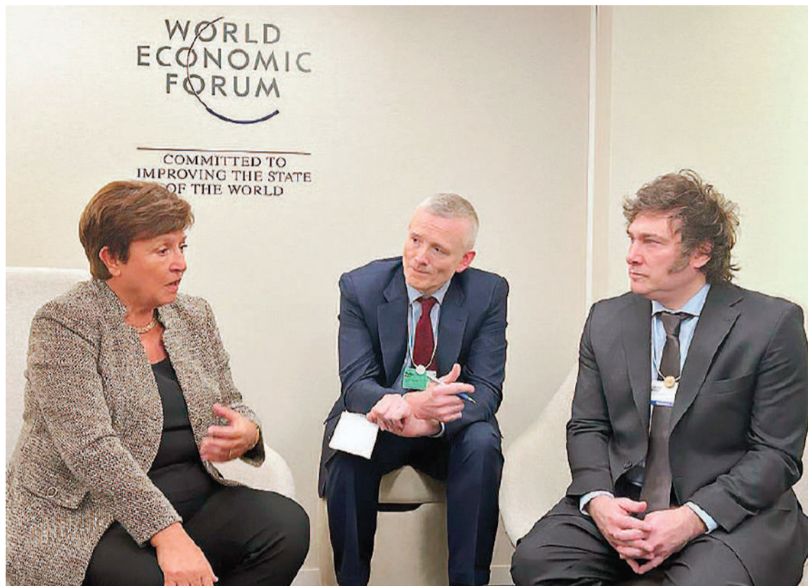
La titular del FMI, Kristalina Georgieva, elogió a Milei. “Vimos un buen equipo económico, un presidente muy pragmático, no confinado ideológicamente, sino buscando formas en las que el país pueda salir de esta dificultad”, dijo.

Sin embargo, el Fondo señaló los desafíos que deberá afrontar la