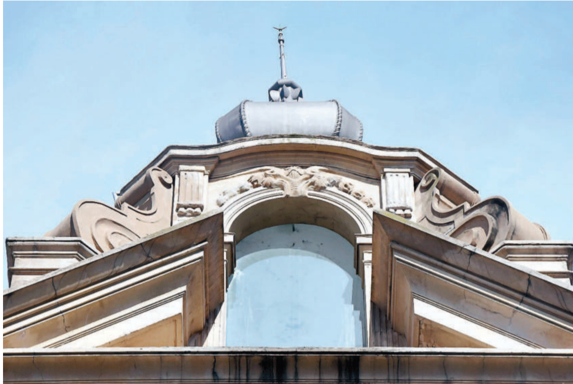
En la fachada de edificios emblemáticos de Paraná, como la actual sede de la UCA, queda el registro del aporte de inmigrantes yugoslavos que trabajaron en la construcción.

REAPRENDIZAJES. Desde la perspectiva planteada por la investigadora cubana, cabe reconocer el aporte de inmigrantes de distintos orígenes que han tenido inje-