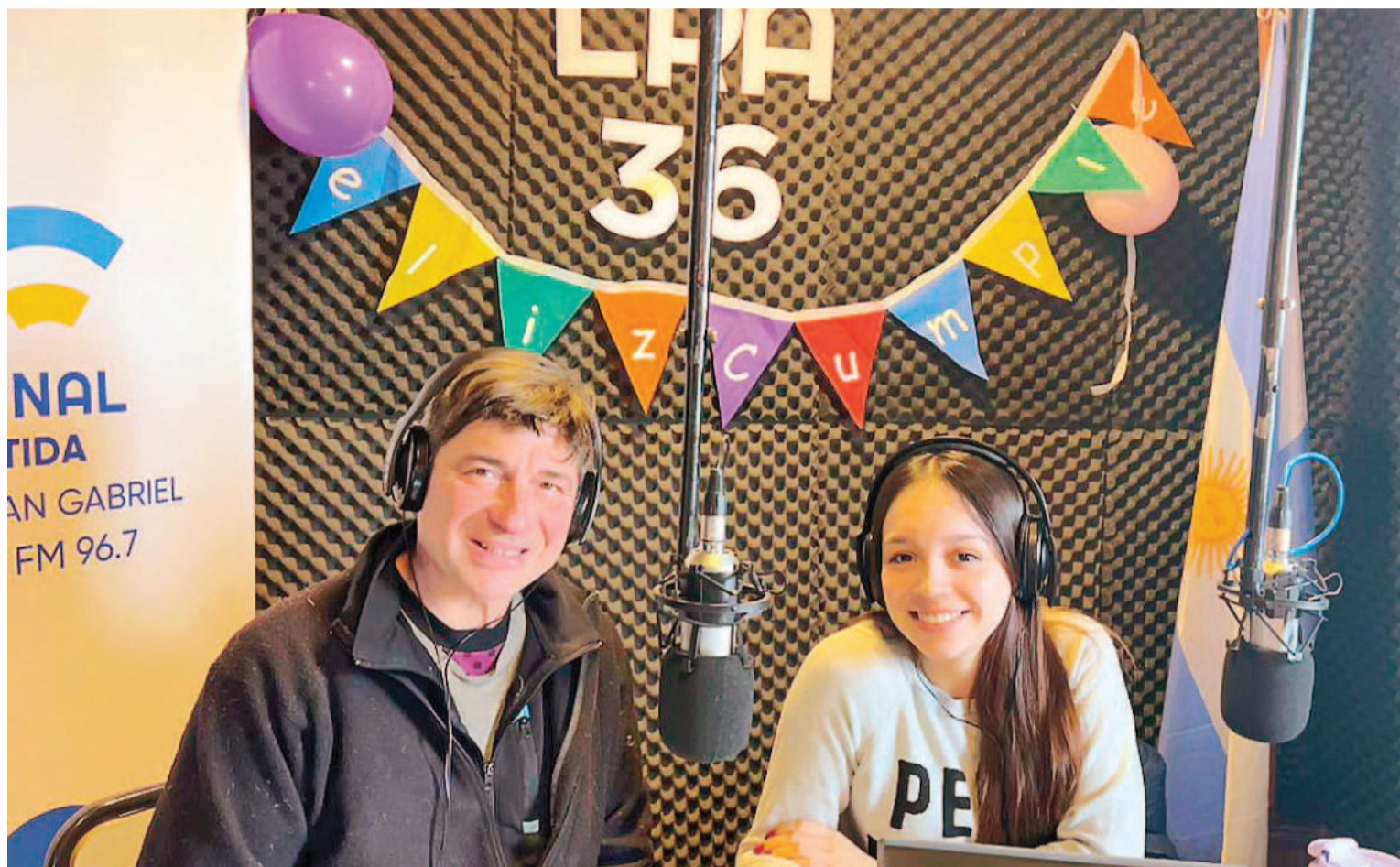
En la inhóspita Antártida se abre paso la vieja y querida radio.

La audiencia de LRA 36 "Arcángel San Gabriel", la única radio de la Antártida que transmite desde la base argentina Esperanza, está conformada en gran parte por radioaficionados de distintas localidades del país y del mundo, como Alaska y Japón, que "buscan el deslumbramiento de contactarse con estaciones lejanas, difíciles y exóticas".