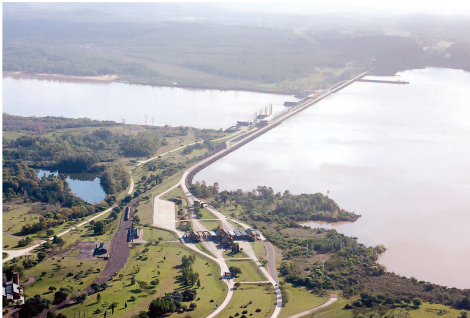
El proyecto de desarrollo de Salto Grande sigue pendiente de realización.