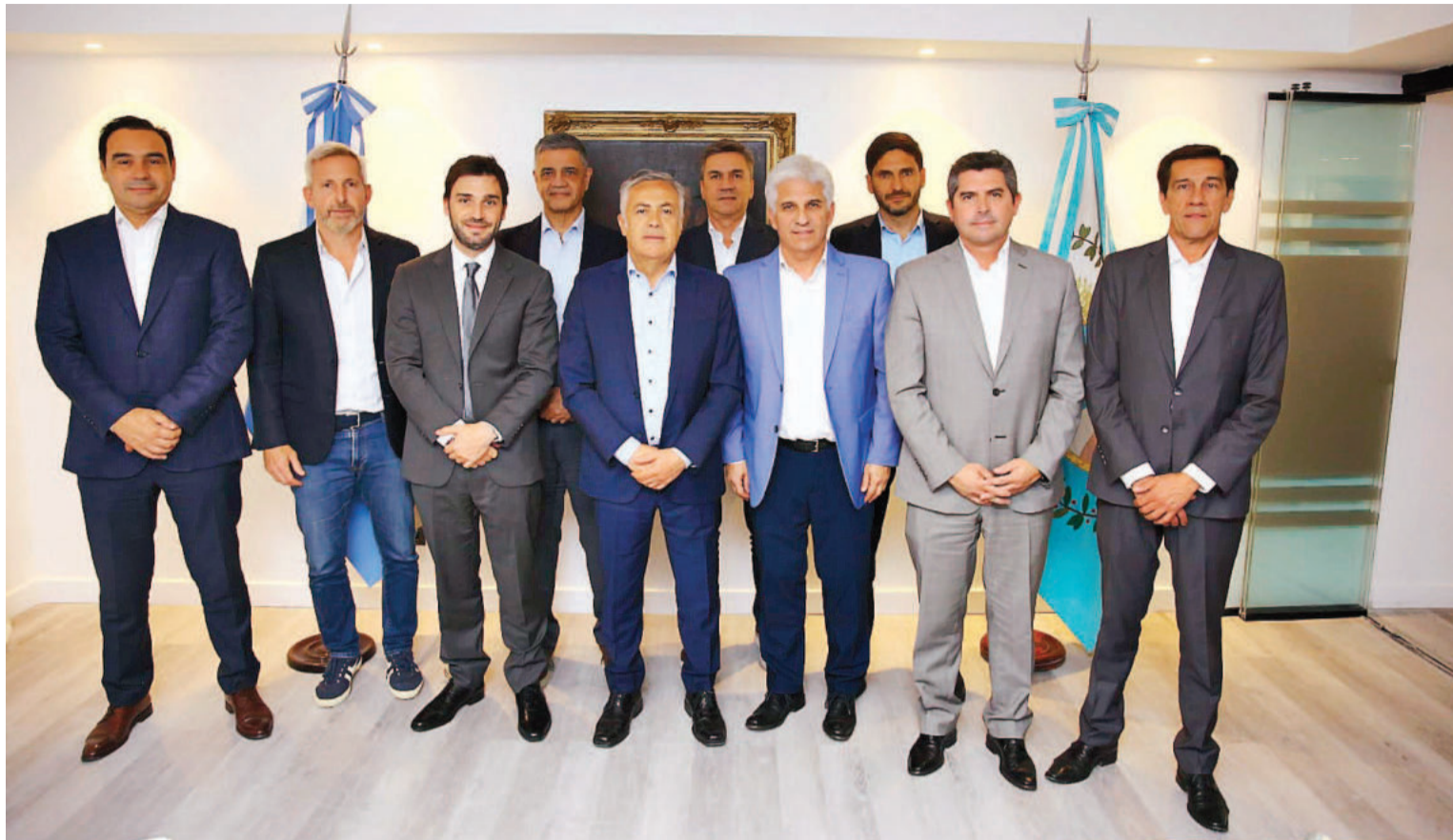
Los nueve gobernadores de JxC, entre ellos Rogelio Frigerio, y el Jefe de Gobierno de la Ciudad de Buenos Aires, se afianzan en unidad como la principal oposición.