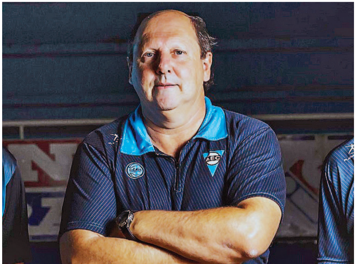
“Los resultados de la gira van a ser importantes a la hora de generar una imagen hacia afuera y hacia adentro también de cómo está funcionando el plantel”, afirmó Bonell.