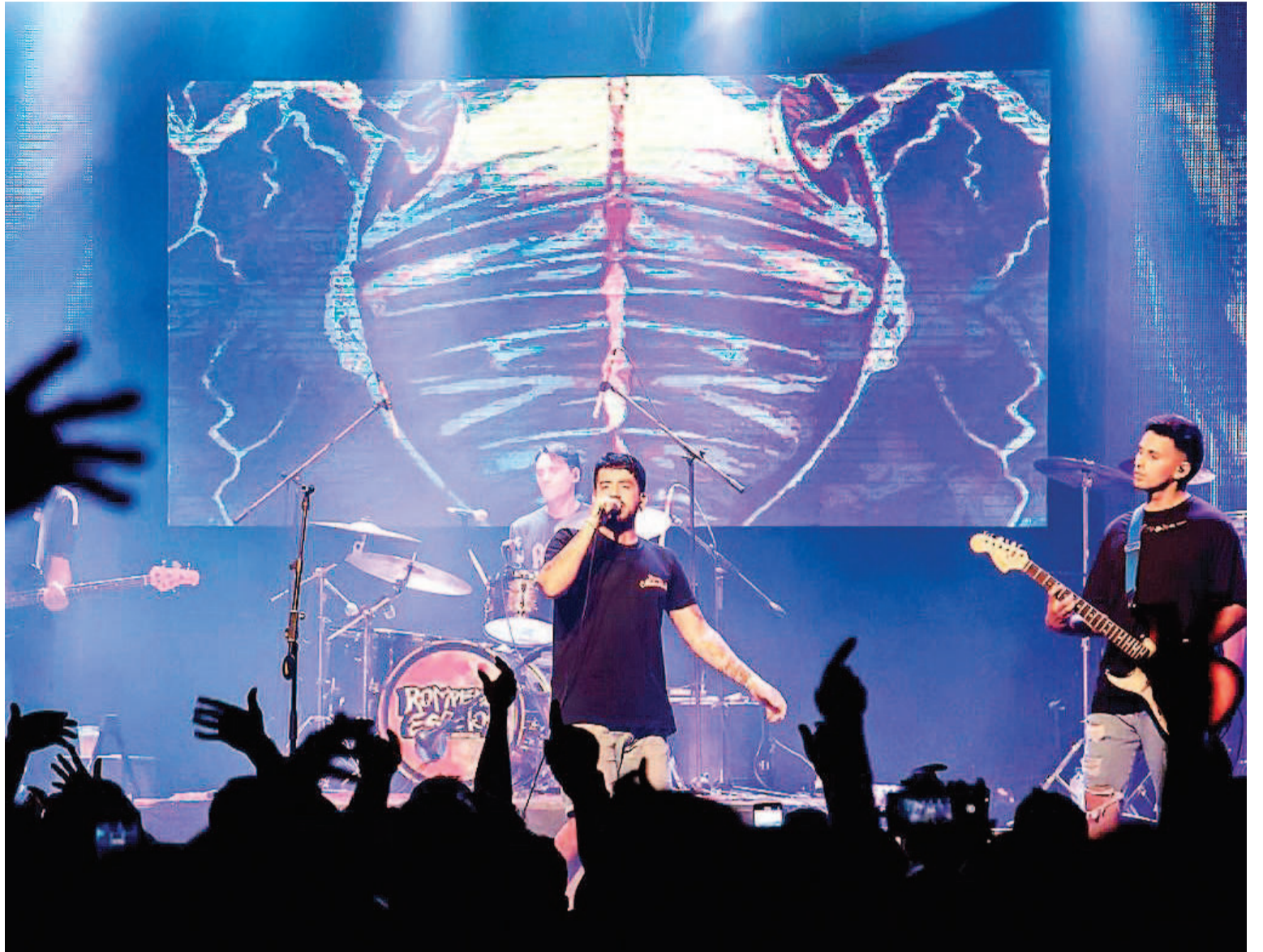
Rompiendo espejos se presentará en Paraná.

17.00 - Wish 2D (cast) (estreno) 19.15 - Wish 2D (cast) 21.30 - El juego de la Muerte 2D (cast) (estreno)