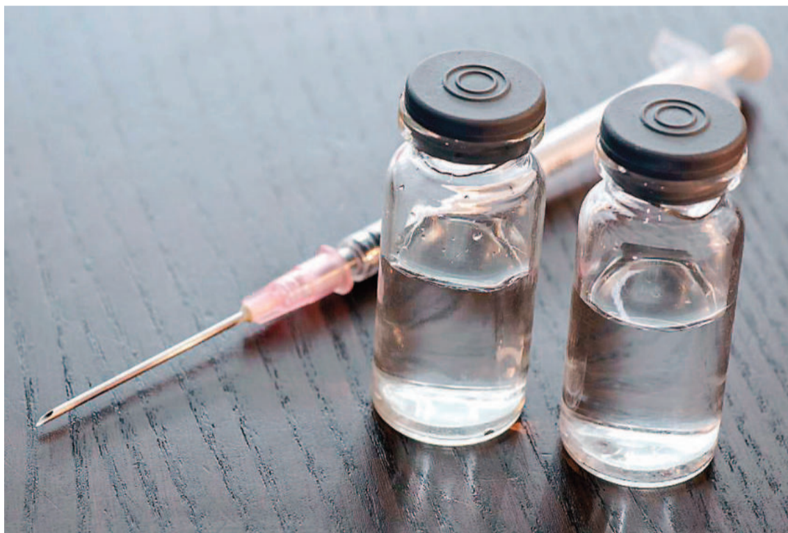
Medio millón de muertes en todo el mundo se atribuyen anualmente al consumo de drogas.

Y luego requieren más potencia en ese vademécum que está hoy en la calle y así aparecen otros depresores del sistema nervioso central como los opioides. Siempre pen-