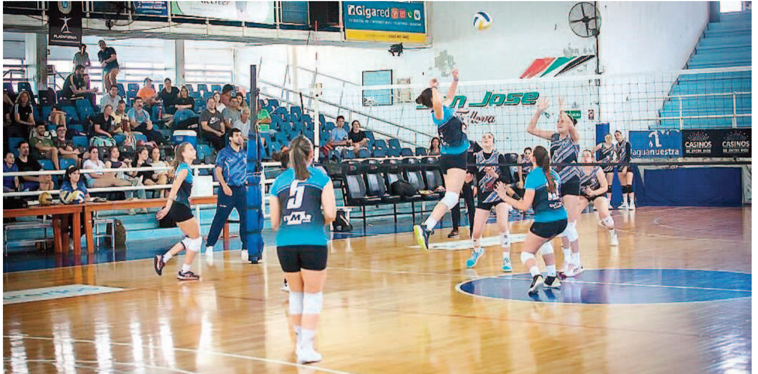
El vóley de Echagüe atravesó una gran temporada y ahora pretende redoblar esfuerzos para continuar yendo por más.

Con la categoría Sub 18 también se ganó el campeonato APV, el subcampeonato en la provincia y el subcampeonato en la LSV. También jugó Liga Nacional quedando en instancias de octavos de final y cerrando un gran torneo. Por su par-