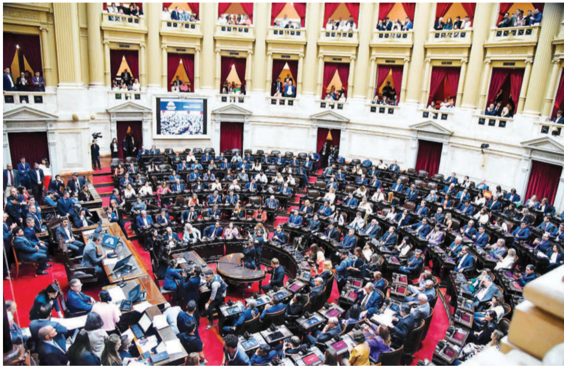
El Gobierno mantiene las esperanzas de alcanzar los votos que le permitan avanzar legislativamente con su plan de desregulación de la economía.

Sin embargo, el Gobierno mantiene las esperanzas de alcanzar los votos que le permitan avanzar legislativamente y, para ello, tiende puentes con dirigentes y legisladores que puedan sumar voluntades para la aprobación de las iniciativas que impulsa el Ejecutivo, aunque eso signifique tener que "abrir" el paquete de la denominada "Ley Ómnibus".