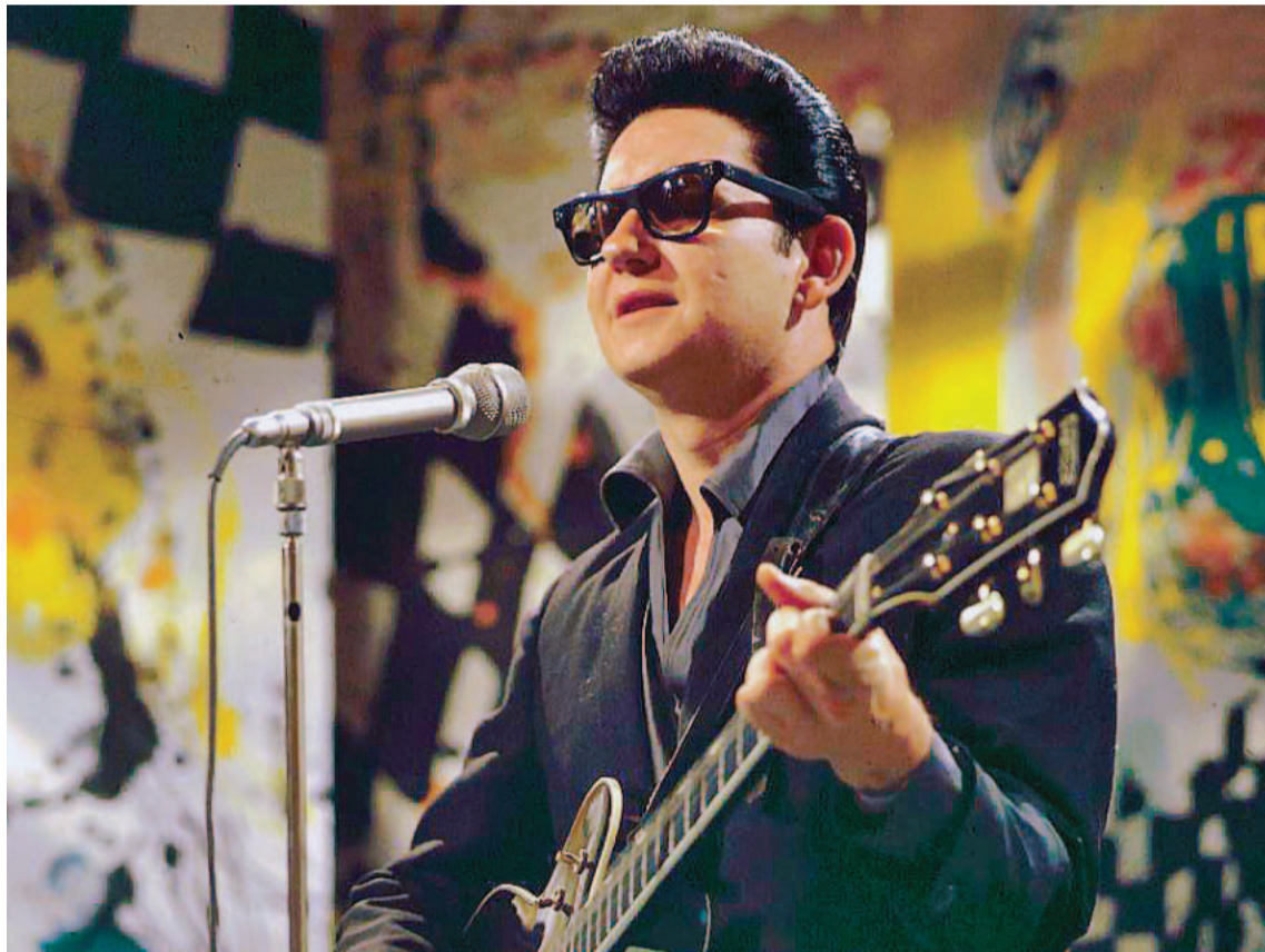
Tocar con las manos los cielos y los infiernos, el destino de Orbison.

LARGO CAMINO. Desde temprana edad, Roy Kelton Orbison mostró un interés innato por la música y aprendió a tocar la guitarra, el piano y la armónica. Su carrera comenzó a despegar en la década del