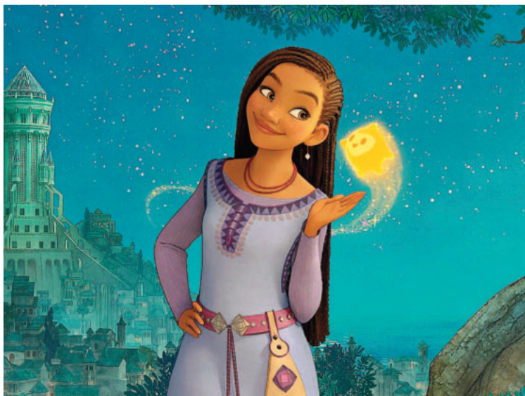
Wish, diariamente en Cine Círculo.

El 10, 11, 12 y 13 de febrero nueva edición de los tradicionales carnavales paranaenses con desfile de comparsas y batucadas, en calle Maciá.