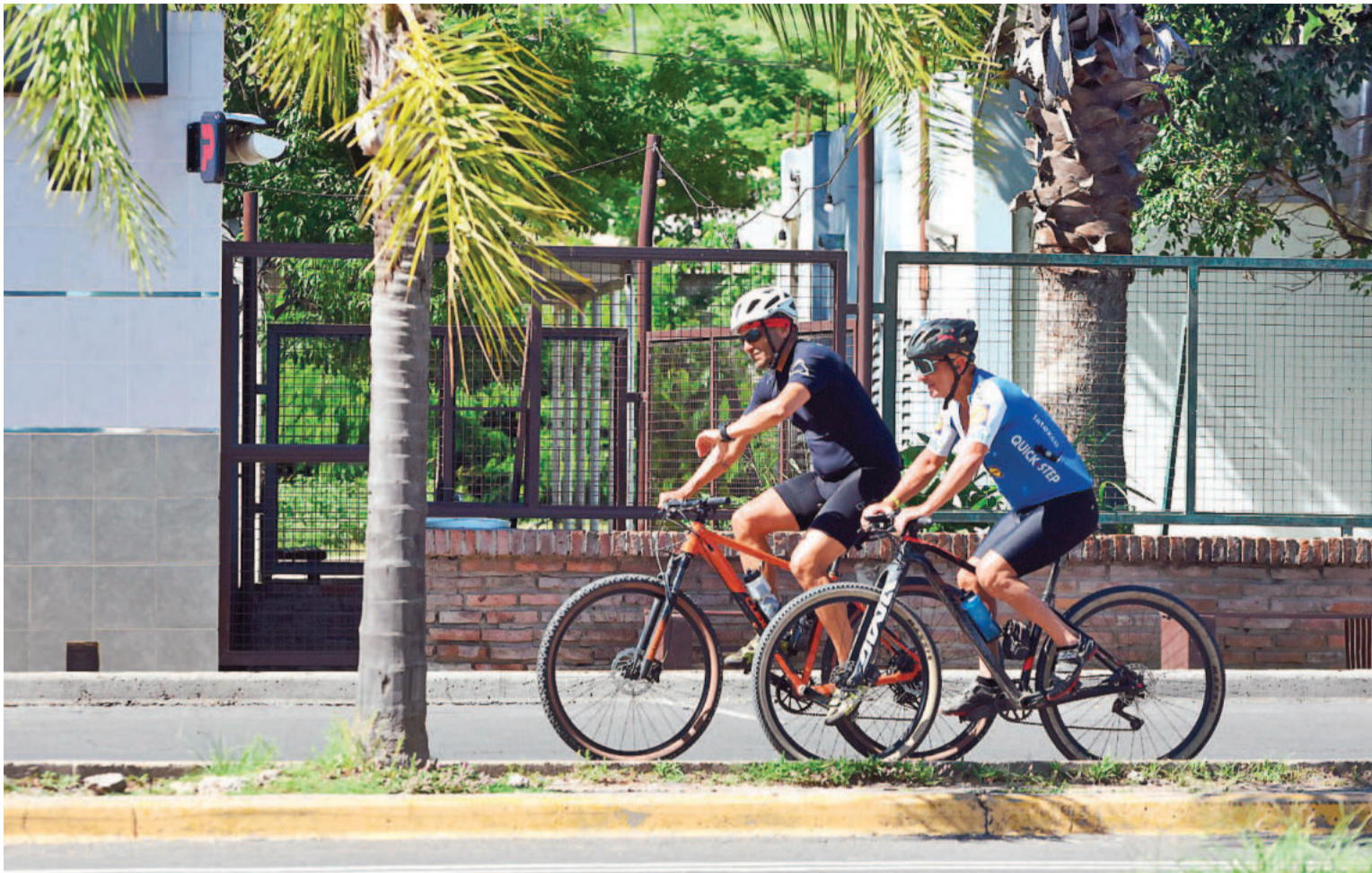
La actividad física sostenida, la buena alimentación y los cuidados médicos son fundamentales para prevenir los infartos.

ción alta, son modificables y prevenibles. Los especialistas le apuntan al tabaquismo, al colesterol elevado, a la hipertensión, a la diabetes y a la obesidad.