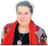
Griselda De Paoli Especial para EL DIARIO

El espacio urbano, con su conjunto de edificaciones, se presenta como complejo y fuertemente representativo de tendencias sociales e históricas. La globalización, con frecuencia trastoca el rol de ámbitos emblemáticos y, con una dinámica ligada al consumo, los transforma en sitios de circulación y oferta económica, que responden a pautas trasplantadas desde otros contextos y realidades, pensando la ciudad como un shopping gigante.