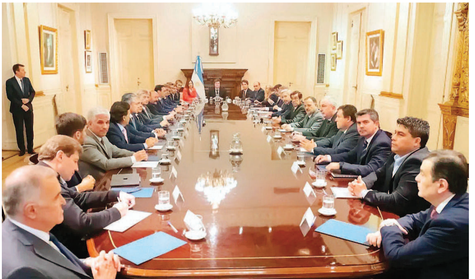
En diciembre, Milei se reunió con los gobernadores.

ANÁLISIS. Verónica Sosa, de Economía & Ética, pronosticó para 2024 una caída del Producto Bruto Interno (PBI) “del 2,5% al 2,7%” que impactará en las transferencias directas, aunque esa baja se