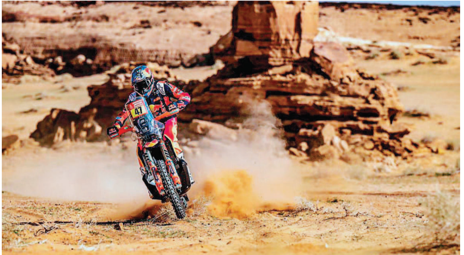
El salteño Kevin Benavides, bicampeón del Rally Dakar, terminó la Etapa 1 con un saldo positivo.