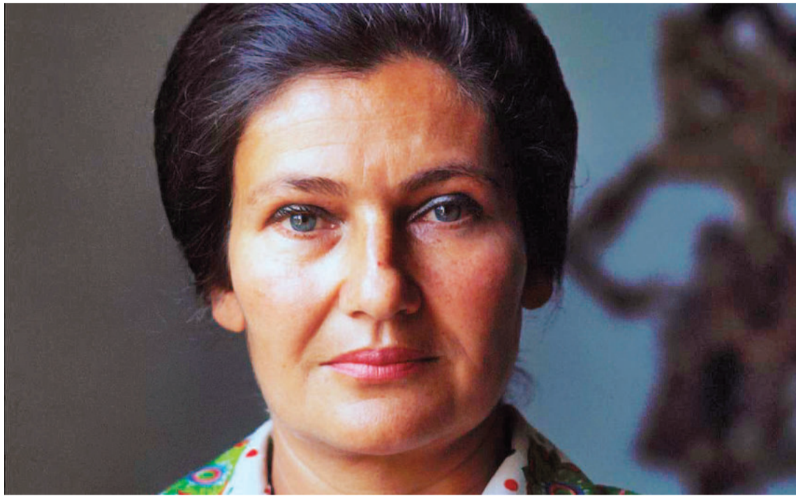
Veil, figura clave en el reconocimiento institucional de los derechos de las mujeres.

En ese Instituto Simone conoció a Antoine Veil, quien sería su esposo y de quien tomaría el apellido con el que luego sería cono-