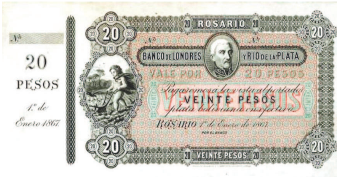
Billete emitido por la Sucursal Rosario del Banco de Londres y Río de la Plata, que maniobró para debilitar al banco de Santa Fe y generó una crisis que casi concluye con el bombardeo de Rosario.

El 5 de enero de 1878, una novedad agitaba las aguas de la política nacional: Ricardo López Jordán era derivado, engrillado, a la ciudad de Rosario, bajo responsabilidad de Servando Bayo. Escaparía de prisión -donde se hallaba luego del fracaso de la revuelta que había encabezado en 1876- un año más tarde. La huída complicó a Bayo, quien más allá de este traspie supo, por otro lado, defender la soberanía e intereses del país frente a la voracidad de la banca británica.