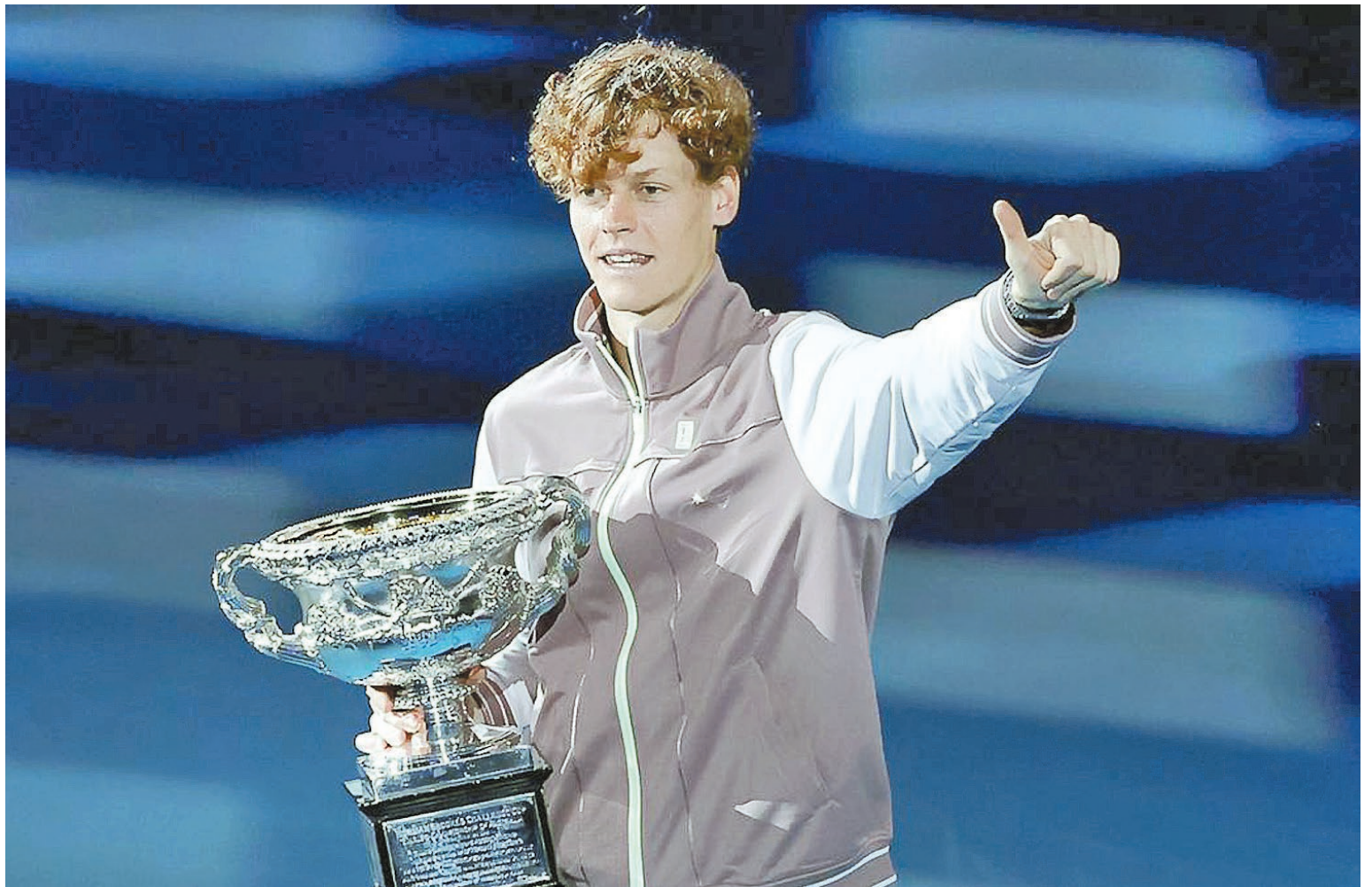
El italiano Sinner logró ayer un valioso triunfo para continuar escalando en su ascendente carrera.

todavía soy algo joven, pero se lo agradezco a todos", declaró el jugador de la localidad de San Cándido, después de protagonizar la mejor actuación de su carrera.