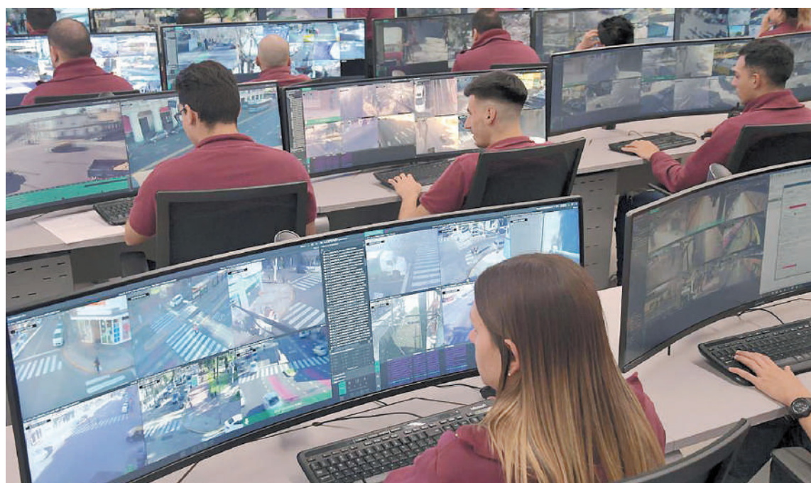
A través de sistemas como el registro de la tarjeta SUBE o el reconocimiento facial con cámaras se pueden generar “falsos positivos”, alertaron los especialistas.