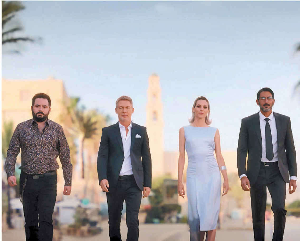
“Jaque Mate”, diariamente en Cine Círculo, Sunstar y Las Tipas.

Wish: 17.50 Patos 3D: 14:15 | 16:10 Aguas Siniestras: 20:20 Patos 2D: 14:00 | 16:00 Pobres criaturas (subt): 22:30 Masha y el oso, el doble de diversión: 14:30 | 16:10 Con todos menos contigo: 18:10 | 22:20 El niño y la garza (subt): 20:00 Jaque mate: 18:00 | 20:20 | 22:20