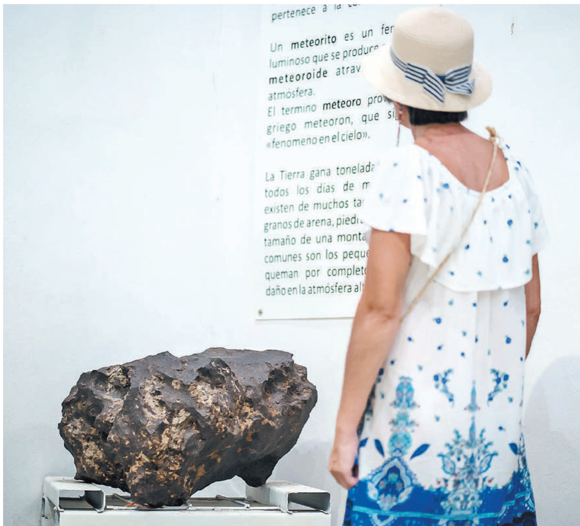
El Museo de Ciencias Naturales y Antropológicas de Paraná resguarda y custodia desde 2007, dos grandes meteoritos que habían sido extraídos ilegalmente de Campo del Cielo, Chaco.

En el marco del procedimiento, se confirmó que se trataba de dos meteoritos y se solicitó la intervención del área de Minería de la