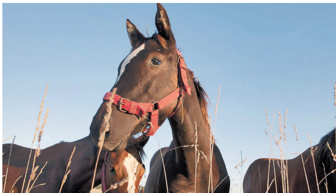
Las últimas detecciones de la enfermedad en la provincia se habían producido en 1983.

Uno de ellos, resultó fatal, dado que tenía complicaciones de base en