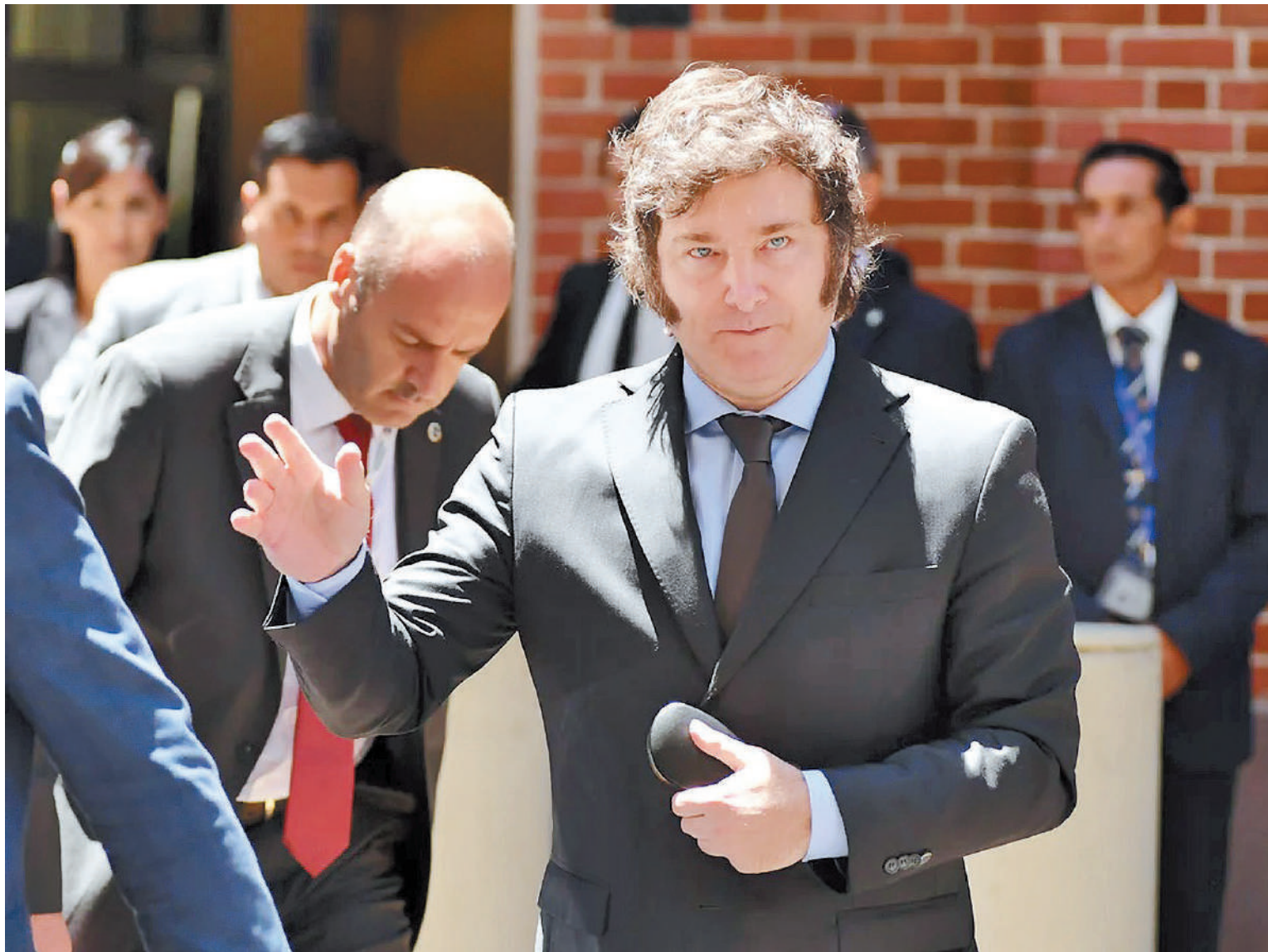
Milei: “No hay plan B para hacer las cosas bien. Hacés las cosas bien o las hacés bien”.

ahorro. Si ese ahorro no tiene una contrapartida de inversión, aparece la caída de la actividad económica, la caída del empleo y la caída de los salarios reales”.