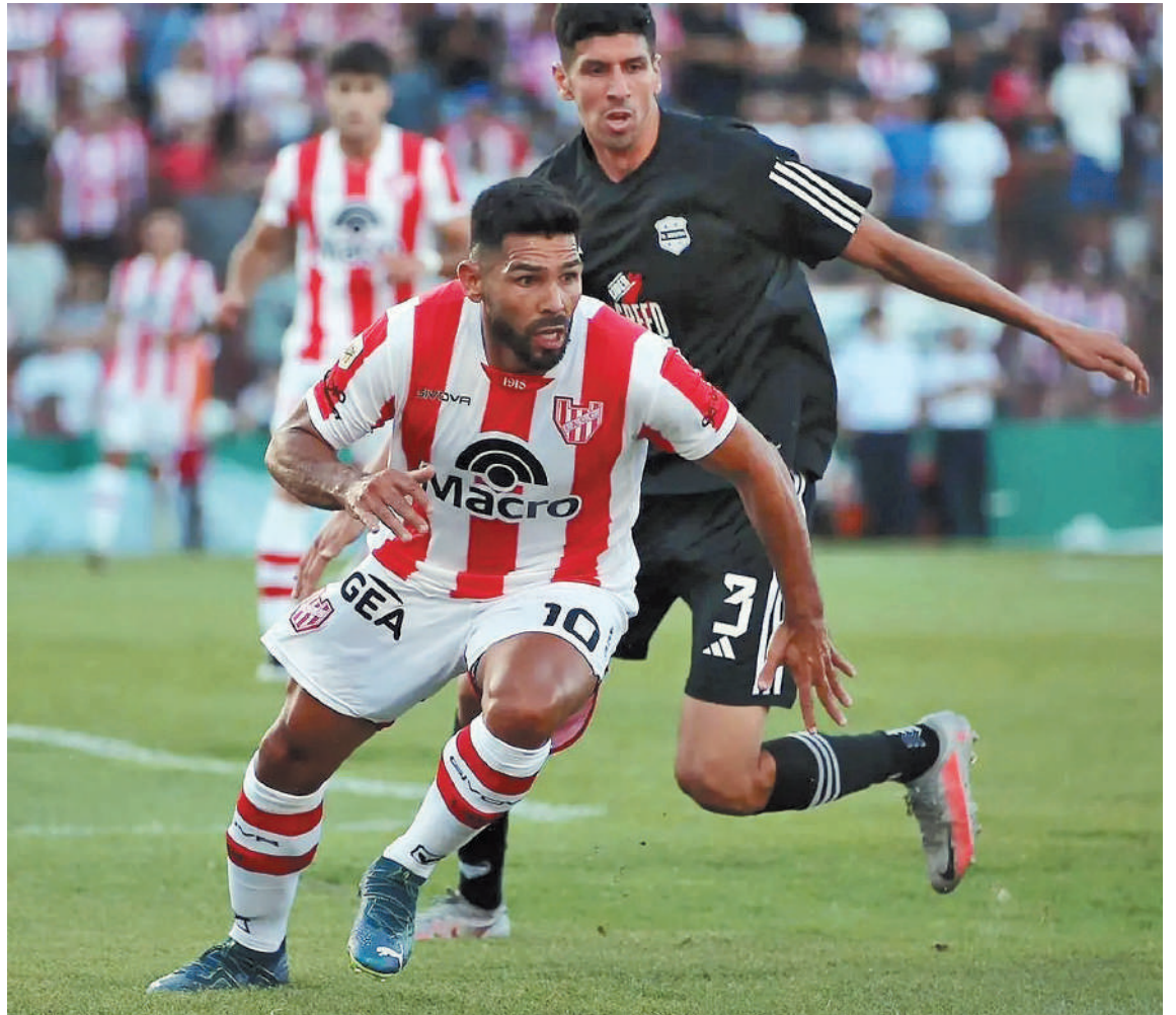
Instituto, bajo las órdenes de Diego Dabove, recibe desde las 21 a Atlético Tucumán, en un duelo de elencos que igualaron en el debut.

En la máxima categoría, Instituto y Atlético Tucumán se midieron en cinco ocasiones, con dos triunfos por lado, y un empate que se produjo en el último enfrentamiento entre ambos, en la LPF 2023, encuentro que finalizó 1 a 1. Los goleadores esa tarde fueron Gabriel Graciani para la "Gloria" y el propio Coronel en Atlético.