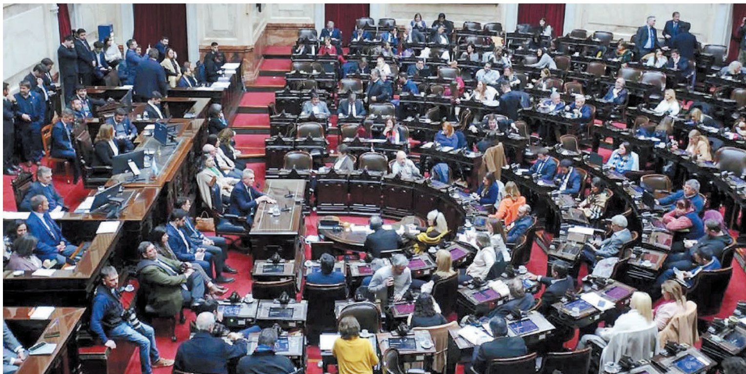
Menem procura alcanzar hoy un acuerdo con los bloques del Pro, la UCR, Hacemos e Innovación Federal.

Por ese motivo, el presidente de la Cámara de Diputados, Martín Menem, procurará alcanzar este lunes un acuerdo con los bloques del Pro, la UCR, Hacemos Coalición Federal e Innovación Federal, luego del anuncio del ministro de Economía, Luis Caputo, de retirar del proyecto el paquete fiscal.