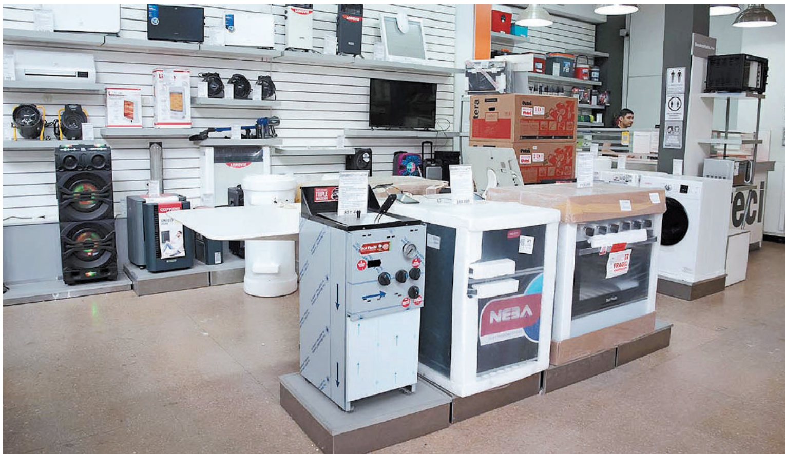
El Gobierno difundió la lista productos incluidos en el programa Cuota Simple.

- Anteojos recetados y lentes de contacto, adquiridos en ópticas, cuyo precio final no sea superior a $97.000.