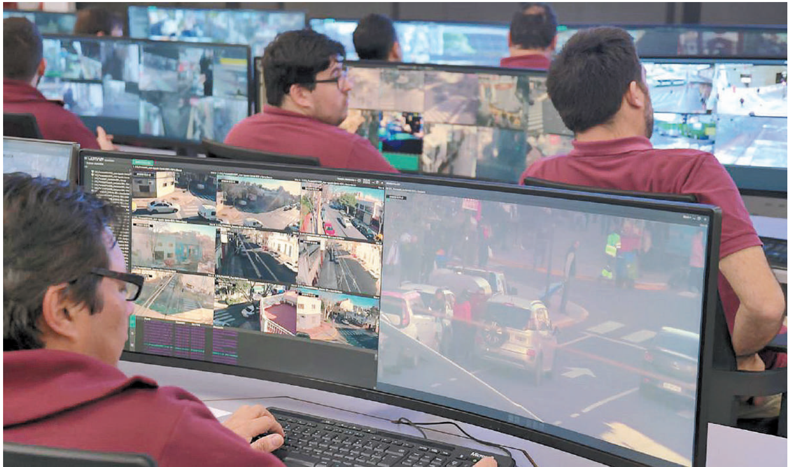
En la Ciudad de Buenos Aires se implementó el Sistema de Reconocimiento Facial de Prófugos en 2019, pero lo declararon inconstitucional.

ALGUNAS EXPERIENCIAS. En la Ciudad de Buenos Aires se implementó el Sistema de Reconocimiento Facial de Prófugos (SRFP) en 2019, pero a partir de una acción de amparo de ODIA, el juez