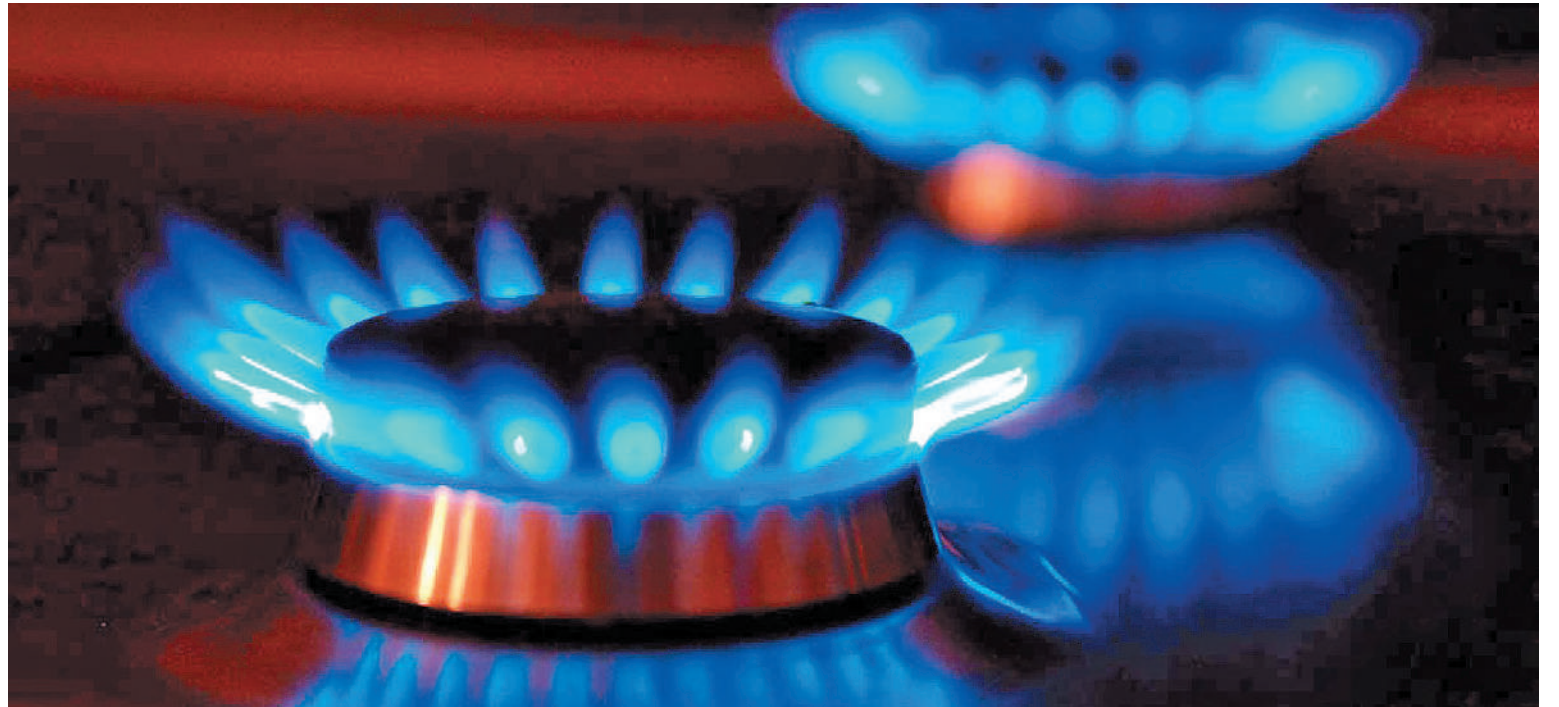
La propuesta oficial prevé determinar los ingresos totales del grupo conviviente y un porcentaje de ese ingreso usualmente aplicado a pagar la factura de energía.

De esta manera, la propuesta oficial prevé determinar los ingresos totales del grupo conviviente y