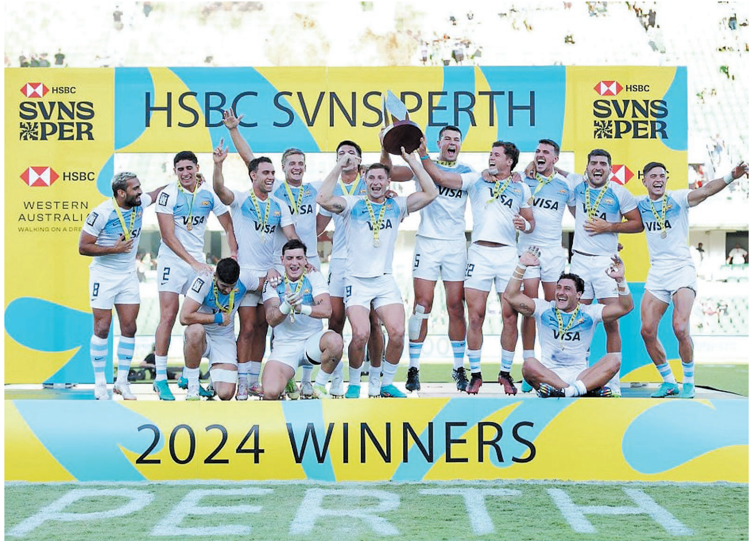
Argentina puso nuevamente el grito en el cielo, consagrándose por octava vez en la historia en una etapa del Circuito Mundial.

Además del nuevo título, el paso por tierra australiana dejó otro