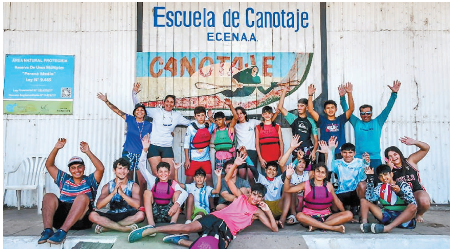
La travesía duró alrededor de ocho horas.

Escuela Municipal de Canotaje informa que se encuentran abiertas las inscripciones para sumarse a las actividades que se realizan en la sede de la Ecena, en la zona del Puerto Nuevo.