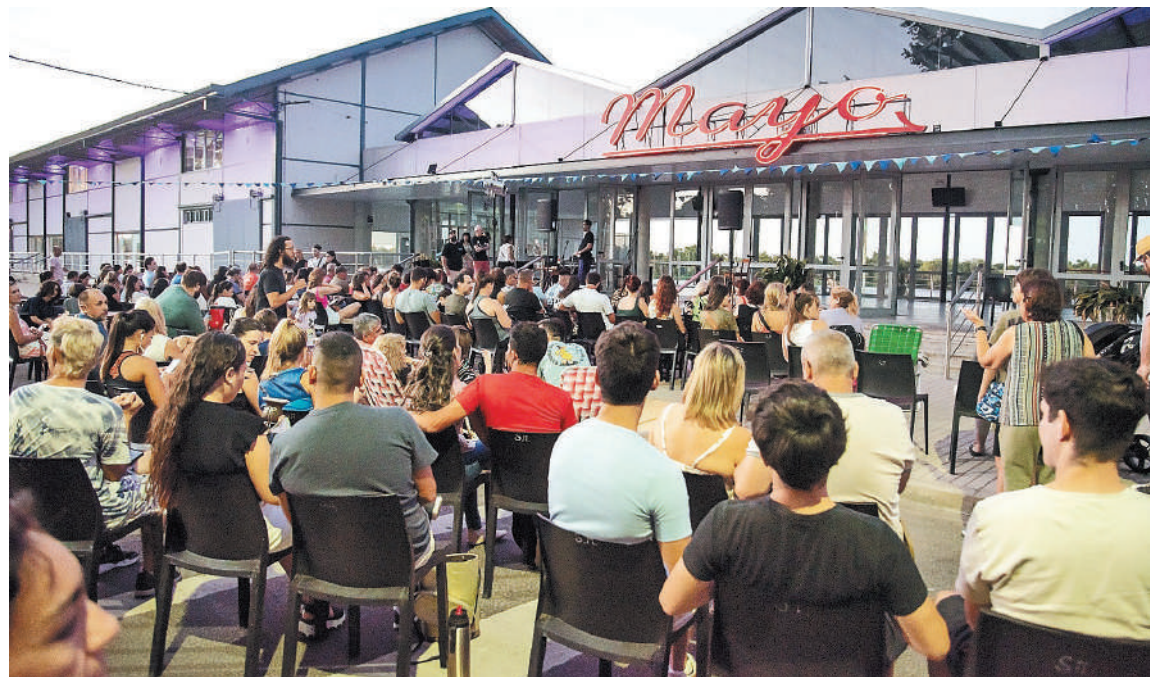
Humor frente al río, el jueves 8 de febrero a las 20, en la Sala Mayo.