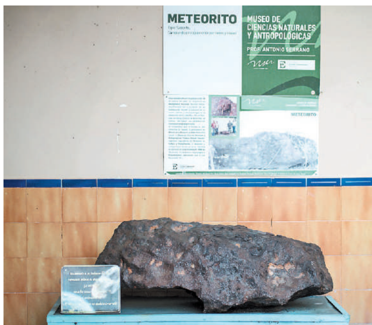
De color oscuro, con una similitud a una gran piedra y con una historia de un recorrido sorprendente, los cuerpos celestes son el atractivo de quienes visitan el Museo Prof. Antonio Serrano.

Así, los cuerpos celestes fueron trasladados al edificio de calle Gardel y permanecen ahí desde entonces. El ingreso de las rocas a la casona es recordada por los empleados como una verdadera odisea. Se utilizaron máquinas para levantar los fragmentos, que intentaron entrar a la carga por la parte de atrás del edificio, por un gran patio abierto cuyo piso no habría resistido el peso, según recuerdan. Entonces, las piezas fueron arrastradas hacia el interior, quedando la más grande en la galería, en una base de cemen-