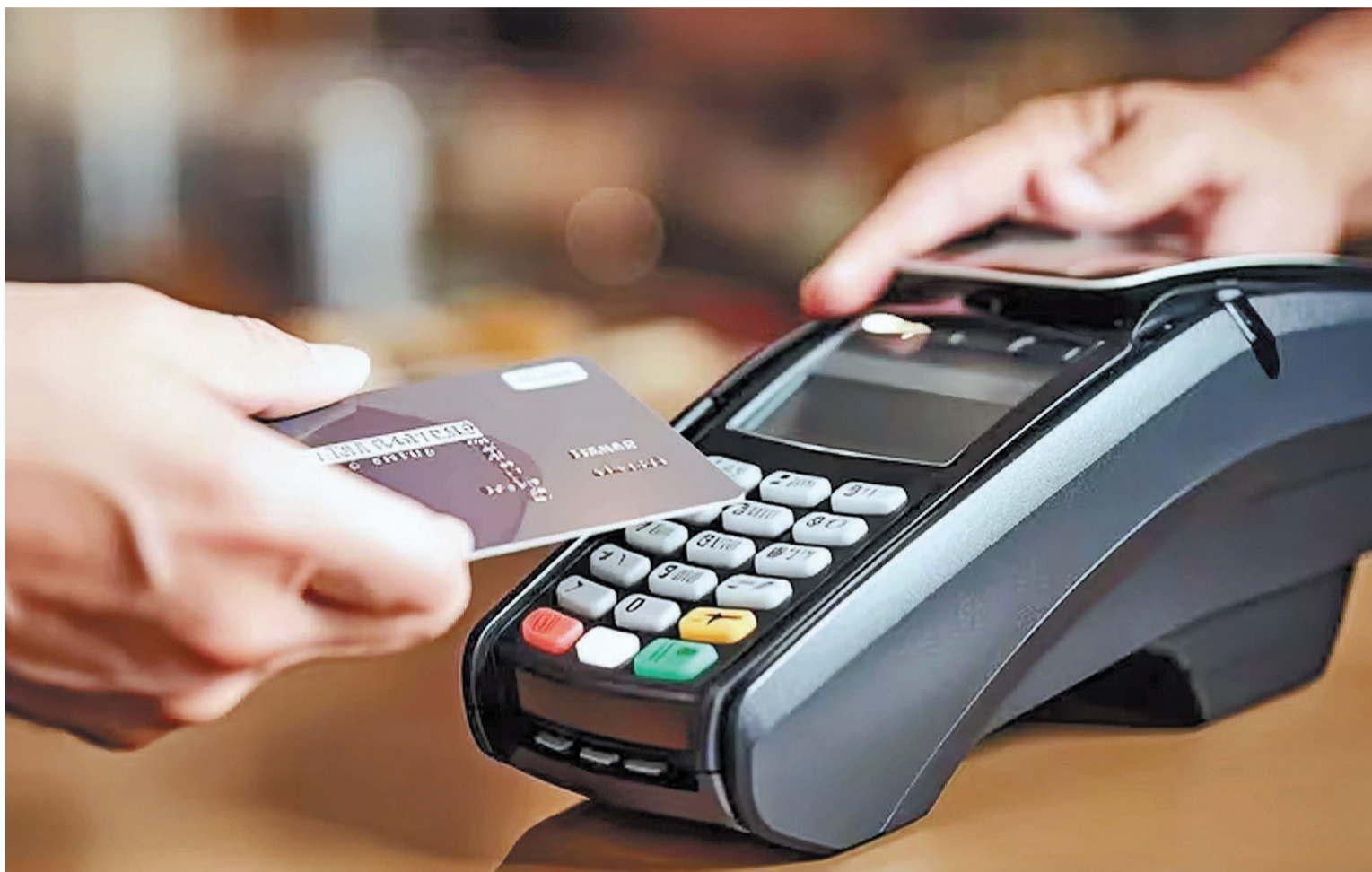
El programa es muy utilizado por los ciudadanos para comprar en los comercios adheridos.

González, precisó que “las cuotas del nuevo programa serán de tres y seis, mientras que la tasa de referencia es el 85% de la tasa del plazo fijo que actualmente es del 110% anual. Esta es la tasa de referencia para trabajar, dentro de lo que es el mundo financiero argentino es una tasa bastante aceptable; no es la mejor, pero es la única herramienta nacional que se tiene para financiar las ventas en el país, como también con otras herramientas a nivel provincial”, afirmó en una entrevista con Urbana Play.