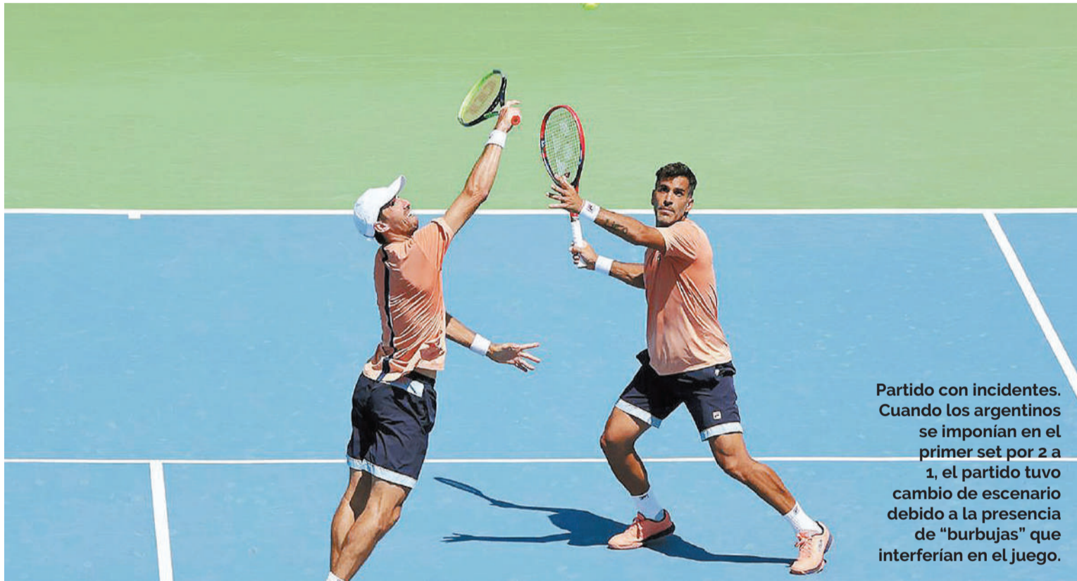
Partido con incidentes. Cuando los argentinos se imponían en el primer set por 2 a 1, el partido tuvo cambio de escenario debido a la presencia de "burbujas" que interferían en el juego.

Finalmente, el partido culminó con un resultado histórico. Bopanna y Ebden ganaron el enfrentamiento por 6-4, 7-6(5), sellando de este modo su lugar en las semifinales, donde se enfrentarán al chino Zhang