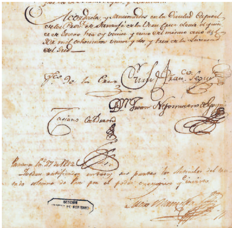
Firmas del tratado Cuadrilátero.

En el tratado reservado se solemniza una alianza y liga ofensiva contra españoles y portugueses o cualquiera otro poder extranjero que atentara contra la in-