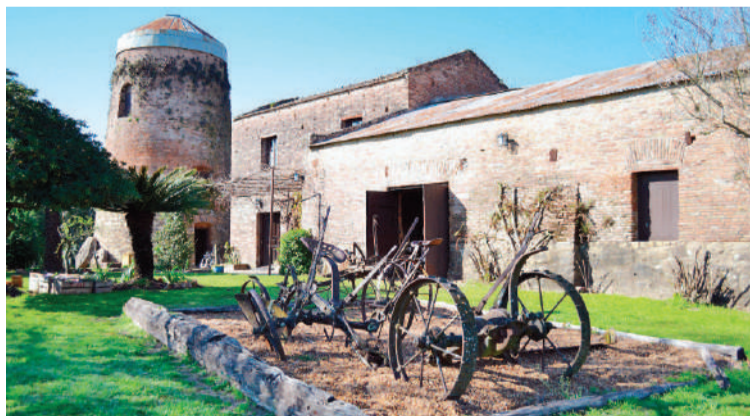
El Molino Forclaz con nuevas propuestas para vacaciones.

La institución permanece abierta al público con recorridos por las instalaciones, de martes a domingos, de 9 a 13 y de 17 a 21, mientras que cuenta con una cartelera especial que se desarrolla por las