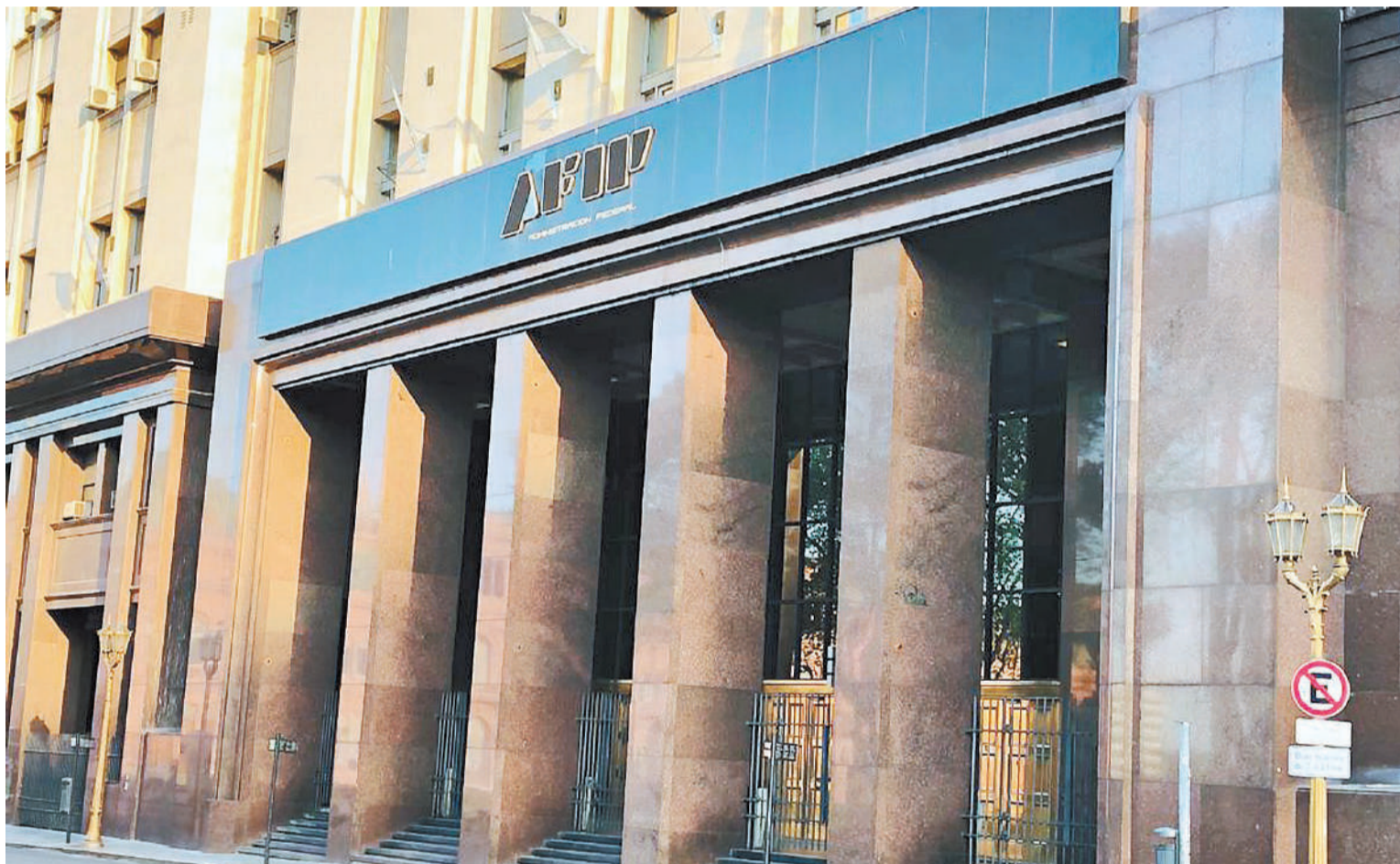
El Gobierno quiere aumentar el número contribuyentes registrados y pondría en marcha el plan a partir del año que viene.

Con las firmas del presidente Javier Milei, del jefe de Gabinete, Nicolás Posse, y del ministro de Economía, Luis Caputo, el mensaje señala que la iniciativa tendrá como fin “simplificarlo, lograr un aumento de la base de contribuyentes registrados e ir reduciendo la presión fiscal a partir del 1° de enero de 2025 en adelante”.