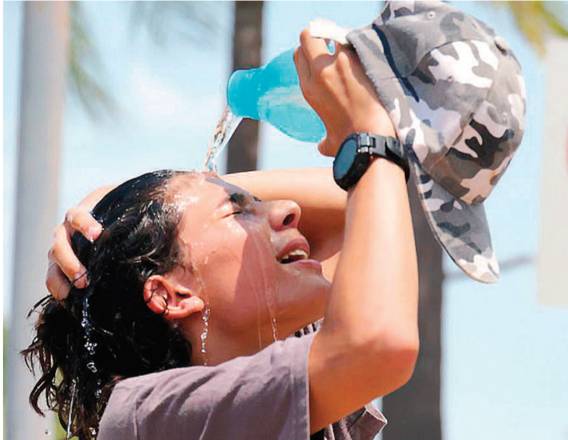
Aconsejan hidratarse al exponerse a altas temperaturas como también antes, durante y después de realizar ejercicio físico.

mienda consumir a lo largo del día al menos dos litros u ocho vasos de agua potable.