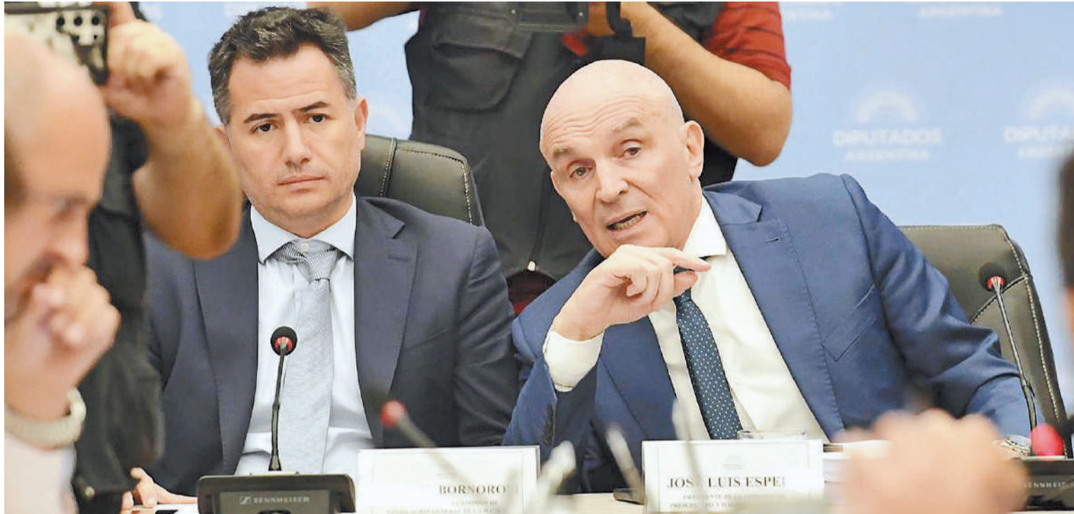
José Luis Espert, de La Libertad Avanza, defiende la posición oficial en Diputados.