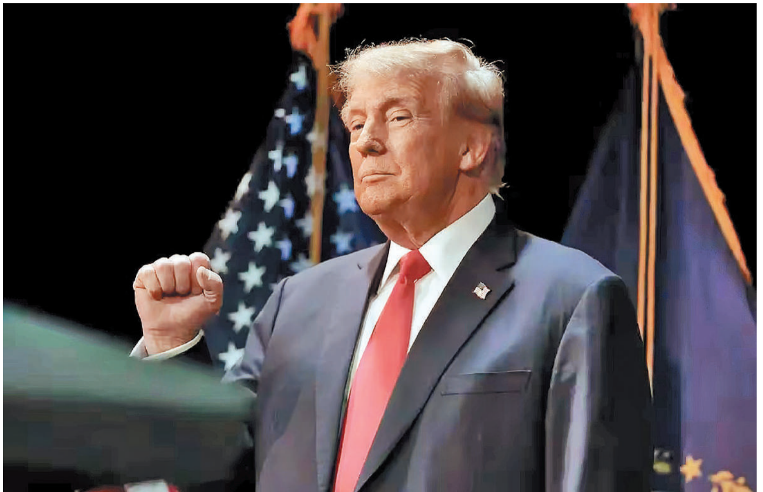
El precandidato republicano intentará volver al poder de Estados Unidos.

Mientras tanto, Haley rechazó la presión que podría significar el favoritismo de su competidor: “En Estados Unidos tenemos elecciones,