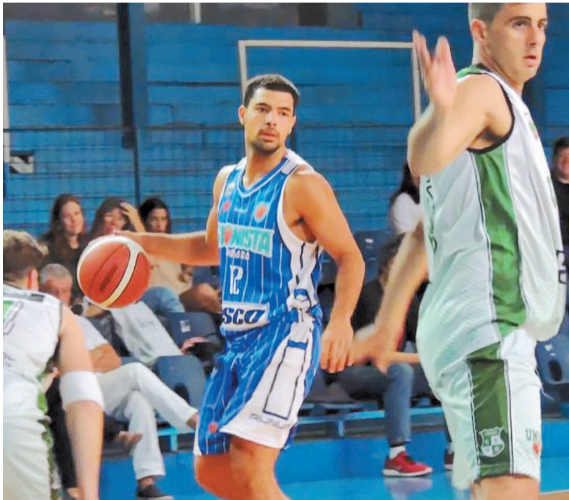
Sionista y Unión de Crespo, los representantes de la capital entrerriana. Ambos conformarán el Grupo B con cinco conjuntos más, entre los cuales se encuentra un santafesino.

Por su parte, el Grupo B lo integran Atlético Rosario del Tala, Ferro de San Salvador, Sportivo Peñarol, Sionista, Gimnasia y Esgrima de Santa Fe, Unión de Crespo y Sportivo San Salvador.