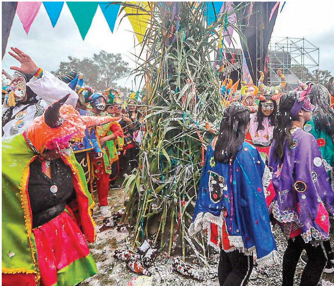
Habrà una mixtura de comparsas folclóricas, indígenas, autóctonas, artísticas, además de murgas y bailarines de pin-pin.

Al respecto, Melano acotó que participarán "unas 45 agrupaciones de la ciudad y arribadas de otras localidades, como Perico, San Salvador, Palpalá, Humahuaca y Libertador", lo que "suma un montón para aumentar la calidad