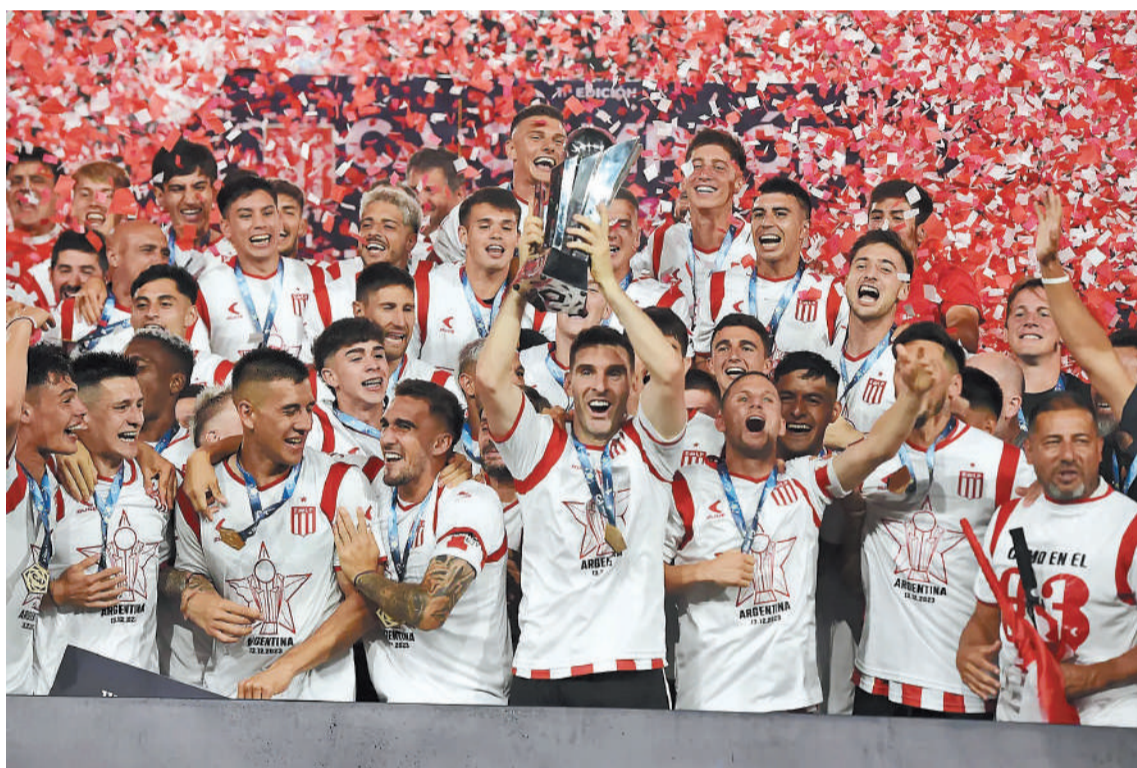
La Copa Argentina inicia hoy en cancha de Lanús, con la presentación del Campeón, Estudiantes de La Plata, que enfrenta a Argentino de Monte Maíz.

Además, se concretará el debut de Javier Correa en lugar de Guido Carrillo, quien será preservado para el partido del domingo por la Co-