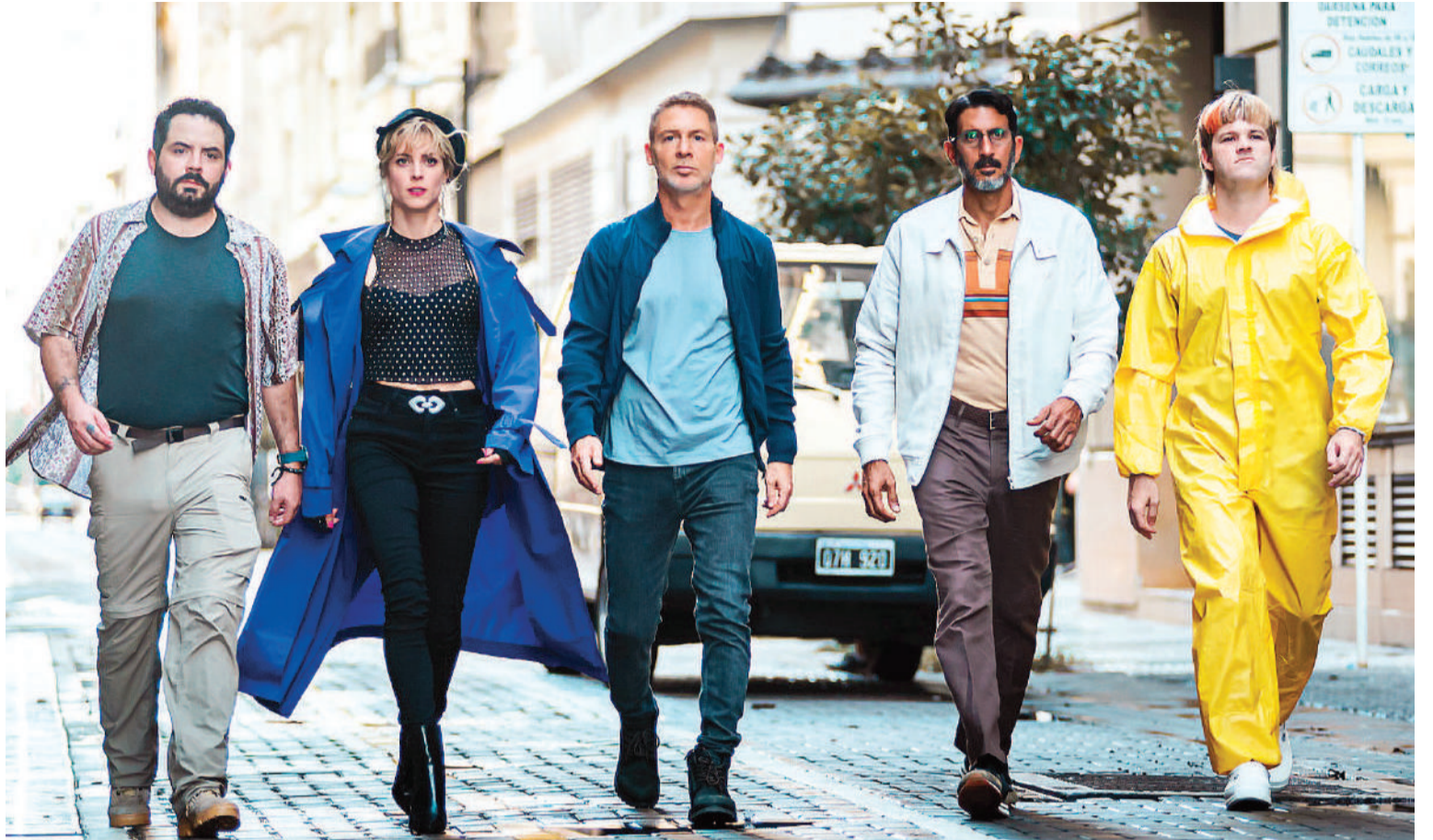
Jaque mate, estreno en Cine Sunstar y Las Tipas.

Wish 3D: 16.00 y 20.30 Wish 2D: 17.00 Aguas siniestras: 22.30 Patos 3D: 16.30, 18.30 y 20.45 Patos 2D: 17.30 Muchachos, la película de la gente 2D: 19 Wonka 2D: 19.15 El niño y la garza 2D: 18.00 (subt) Jaque Mate 2D, estreno (cast): 21.30 Rituales mortales 2D, estreno (cast): 22.30 Masha y el oso 2D, estreno (cast):