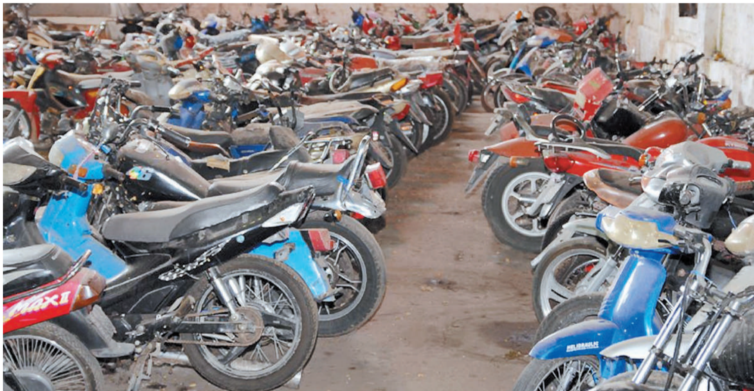
En los depósitos hay motos que están en esos lugares desde hace años.