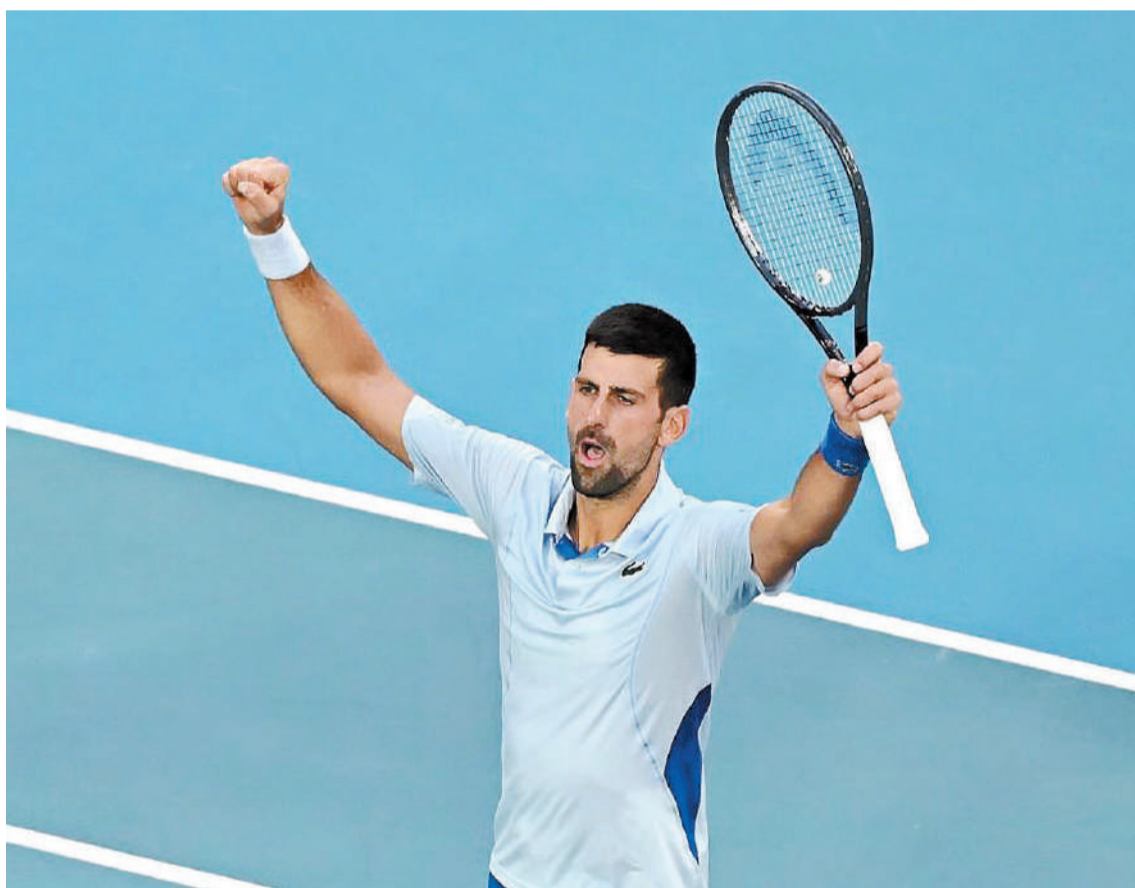
Estadística descomunal. El serbio no conoce la derrota en el Australia Open desde el año 2018. Sin participar de tan solo una edición desde entonces, han sido 33 victorias consecutivas.

El serbio Novak Djokovic, número uno del mundo, se clasificó ayer como semifinalista del Abierto de tenis de Australia, que se desarrolla en la ciudad de Melbourne, al vencer al estadounidense Taylor Fritz, 12° en el escalafón, en cuatro sets.