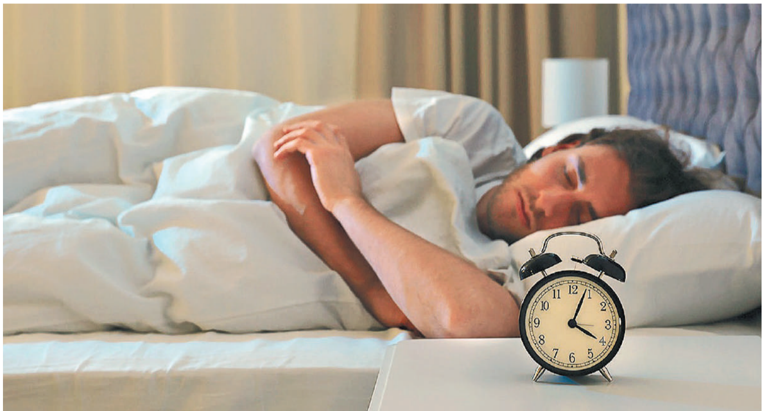
Un adulto sano debería dormir al menos 7 horas por día para tener una mejor salud mental.