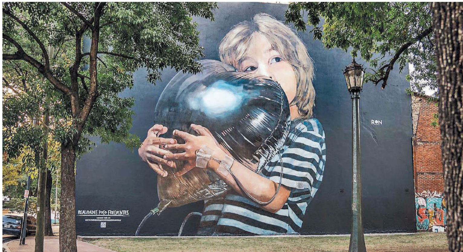
Mural realizado por el artista Martín Ron en referencia a la enfermedad.

Como parte de su tratamiento, en su infancia Villalba tuvo que ser sometido a una intervención quirúrgica para corregir el estrabismo, a inyecciones de bótox y dos veces estuvo a punto de atravesar por una cirugía experimental de rea-