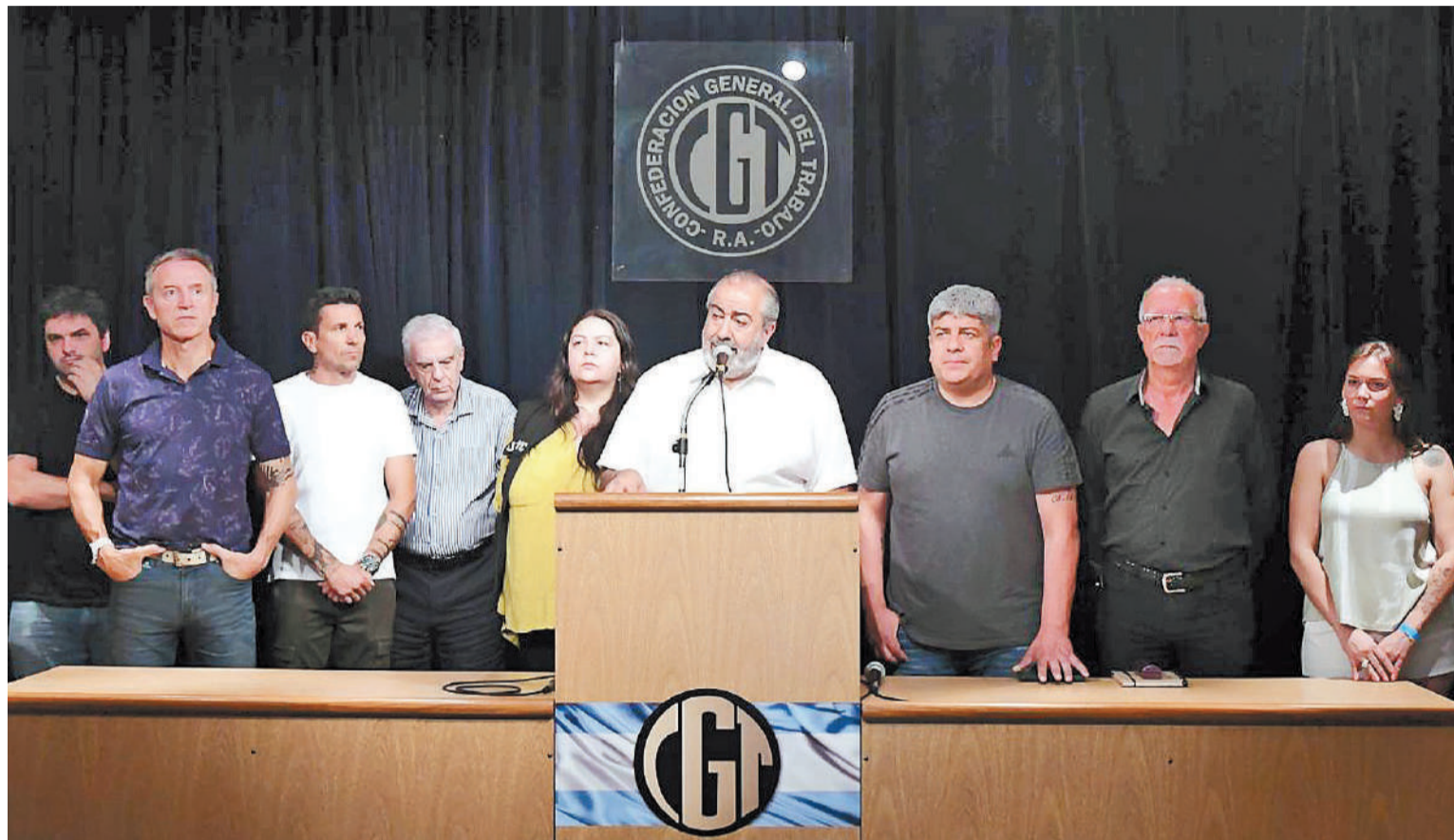
Las centrales obreras pararán durante 12 horas en todo el país y se movilizarán hacia el Congreso.

aberración unilateral que ya está en queja en el Comisionado de Derechos Humanos de la Organización de las Naciones Unidas (ONU). Subir y filmar a la gente arriba de un micro solo se hace en dictadura", aseguró Daer.