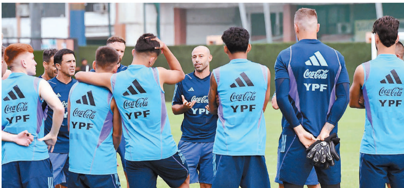
Argentina está obligada a ganar ante Perú, para no pasar sobresaltos en busca de la clasificación en el Grupo B.

Tras el empate agónico del debut ante Paraguay, el elenco que conduce Javier Mascherano se enfrentará este miércoles a la selección peruana, por la jornada 2 de la Zona, del torneo que se juega en Venezuela. El juego comenzará a las 20.