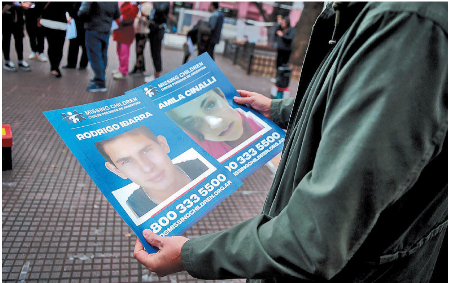
Evidentemente, contar con los beneficios de las redes supera ampliamente los riesgos que ellas mismas suponen.

Durante 2023 hemos logrado, también a través de redes, activar el programa de Reconocimiento Facial, con Google. Desde mediados de año difundimos un álbum con las fotos de chicos perdidos que los usuarios pueden compartir cliqueando en los links de nuestros bios. Una herramienta más que permite encontrar coincidencias,