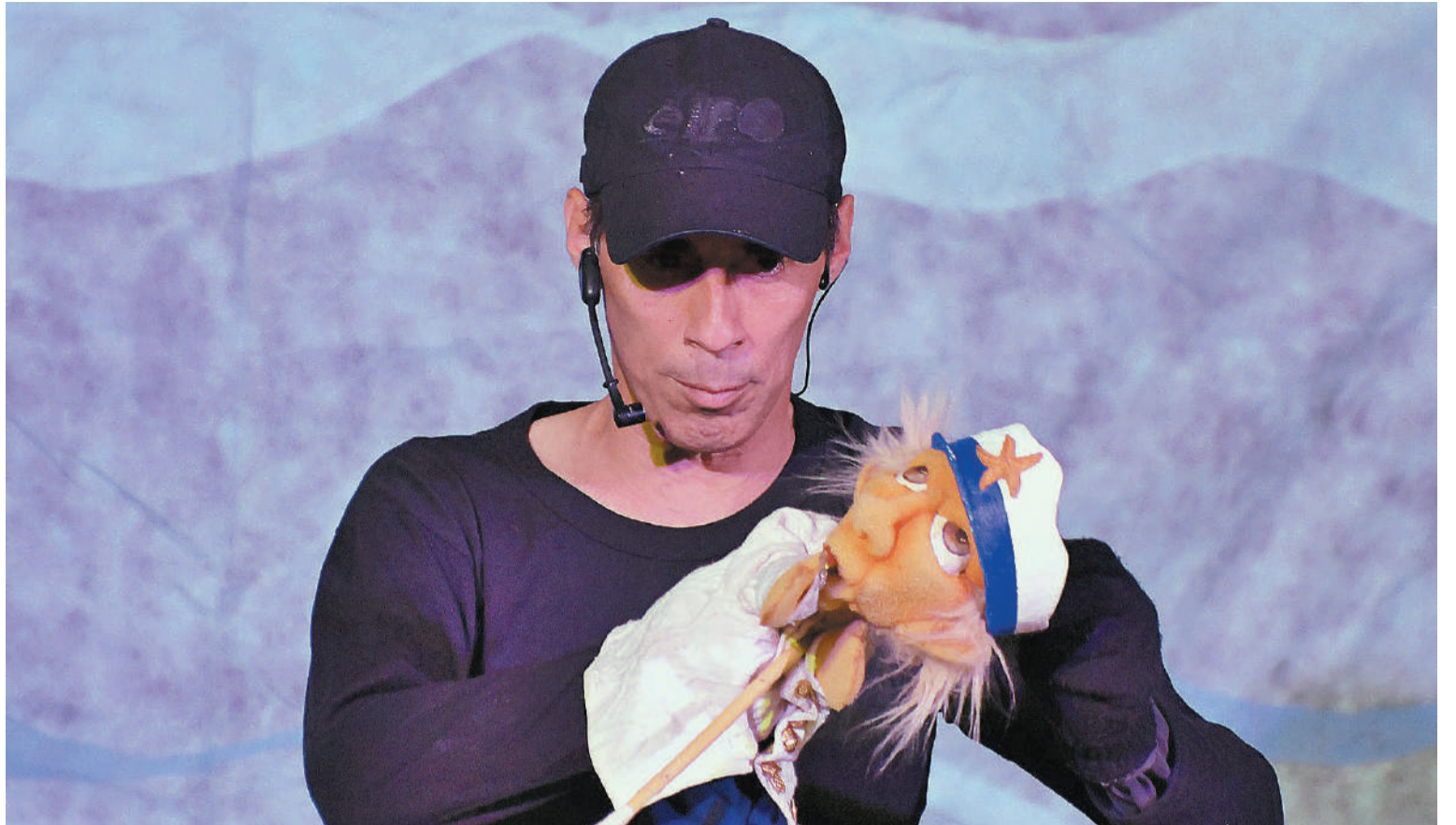
Títeres con "Salvemos a la flor", de Marcelo Amorosi, hoy a las 20 en la Biblioteca Provincial.

El miércoles 31 de enero a las 20, en Sala Mayo, Show de Stand Up que tendrá de anfitriones a los comediantes de Litoral Stand Up Comedy. Entrada libre y gratuita.