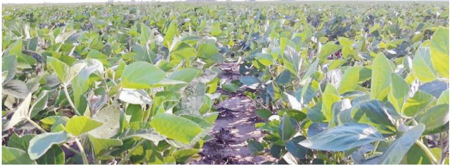
En la zona que comprende a Paraná, el promedio del último lustro es de 1.770 kg/ha.

Se realizaron los cálculos económicos considerando un paquete tecnológico aplicado para cada una de las cuatro zonas, aportados por la red de colaboradores del SIBER. Entre los datos del informe, todas las labores están consideradas a valor de las tarifas de servicios de contratistas. En el caso de la cosecha se consideró un valor fijo de U$S 70. Los planteos son evaluados en campo propio y también con la inclusión del arrendamiento. Se tomó un valor de arrendamiento equivalente a ocho quintales de soja/ha/año para la zona Sur - Oeste y de cin-