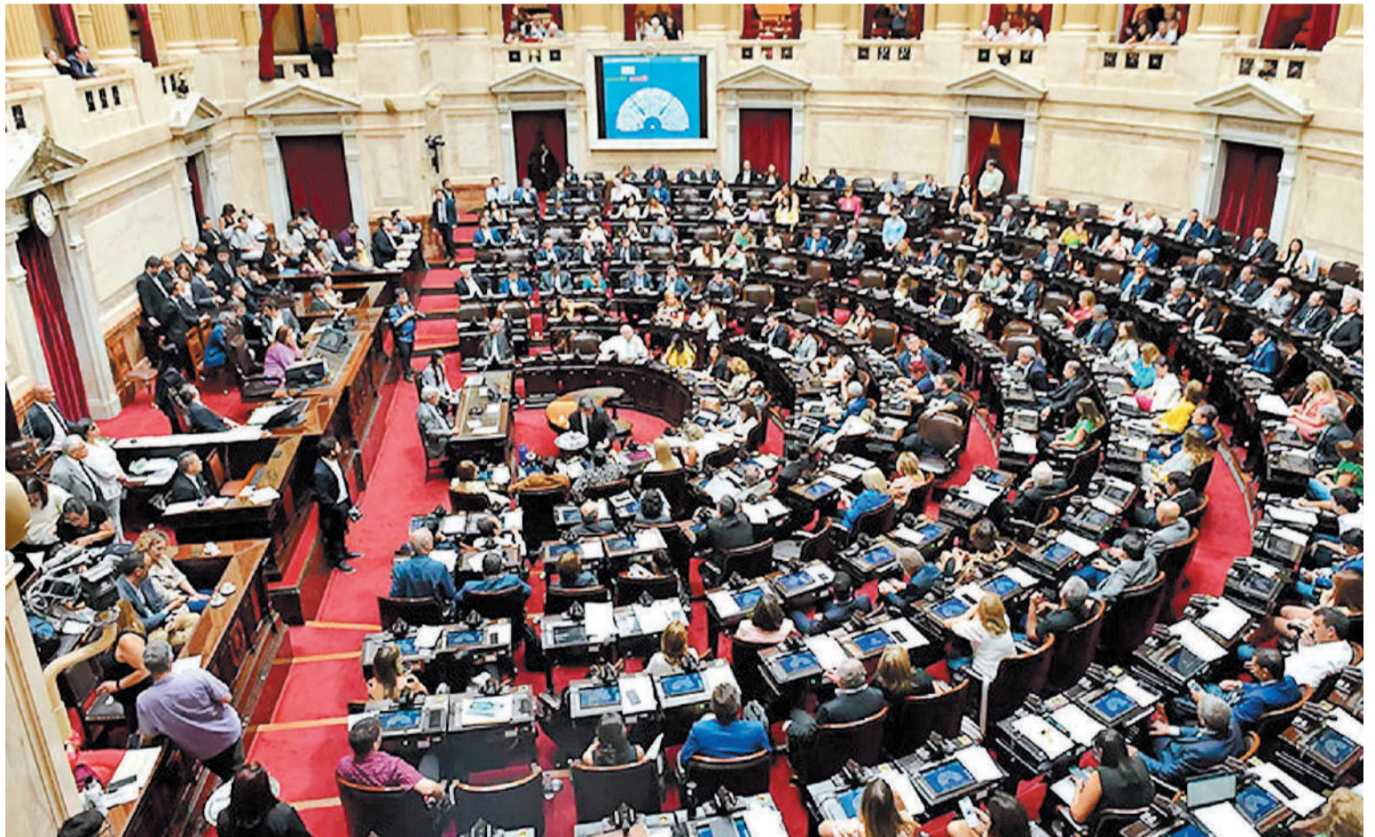
El oficialismo contará con el dictamen de mayoría que se discutirá el jueves en el recinto de sesiones.

REUNIONES. Al cierre de esta edición, los cambios se estaban terminando de redactar para incorporar en el despacho de mayoría que el oficialismo va a proponer firmar en el plenario de comisiones y por eso