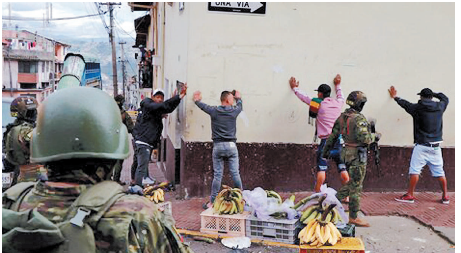
Desde el 9 de enero, las fuerzas armadas ecuatorianas realizaron 85 operaciones contra “grupos terroristas”

enero la media de asesinatos había sido de 27,6 por día. Tras conocerse el 7 de enero la fuga de Macías, líder de la banda Los Choneros y vinculado al cártel mexicano de Sinaloa, que cumplía 34 años de cárcel en la provincia de Guayas, Ecuador registró una cadena de hechos violentos.