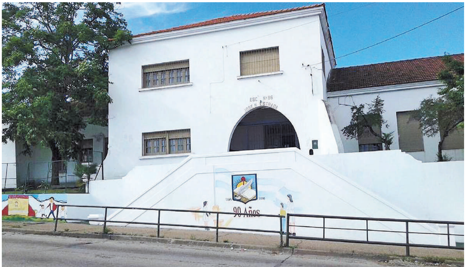
La institución está ubicada en Laurencena y Avenida Ramírez.

sonal investigativo de la Jefatura Departamental Paraná, continuaron investigando a las familias de las personas individualizadas como autores del ilícito.