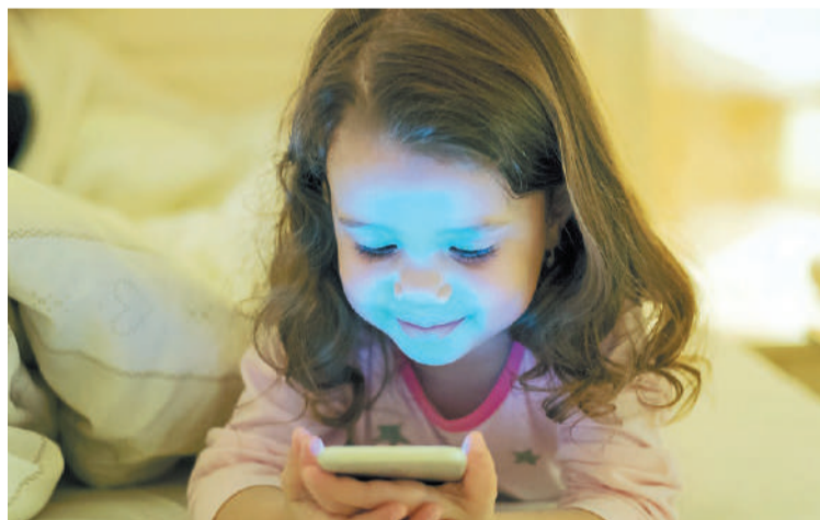
Recomiendan eliminar o bloquear el ruido que distrae y la mayor cantidad de luz posible a la hora de dormir.

TRASTORNOS DEL SUEÑO. Respecto a los trastornos del sueño, advirtió que son "sumamente frecuentes" y ejemplificó con una investigación reciente que en Estados Unidos el 35% de la población adul-