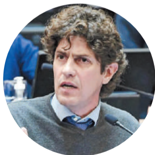
Martín Lousteau, presidente de la Unión Cívica Radical (UCR) y senador nacional

“Si Milei tiene tan poca tolerancia a la frustración, le va a ser difícil la Presidencia”