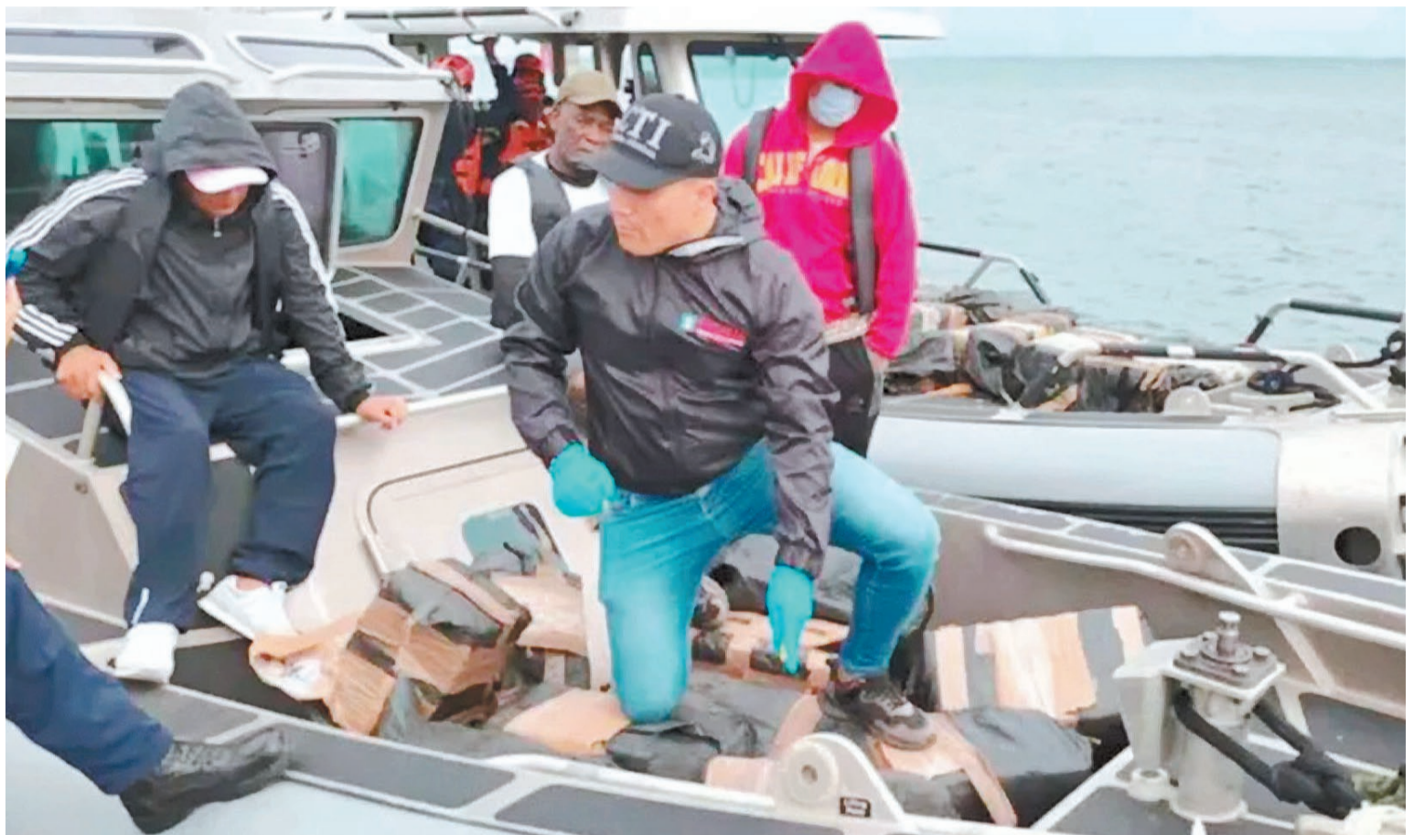
Uno de los operativos se llevó a cabo a unos 60 kilómetros de la costa de Esmeraldas (noroeste de Ecuador).