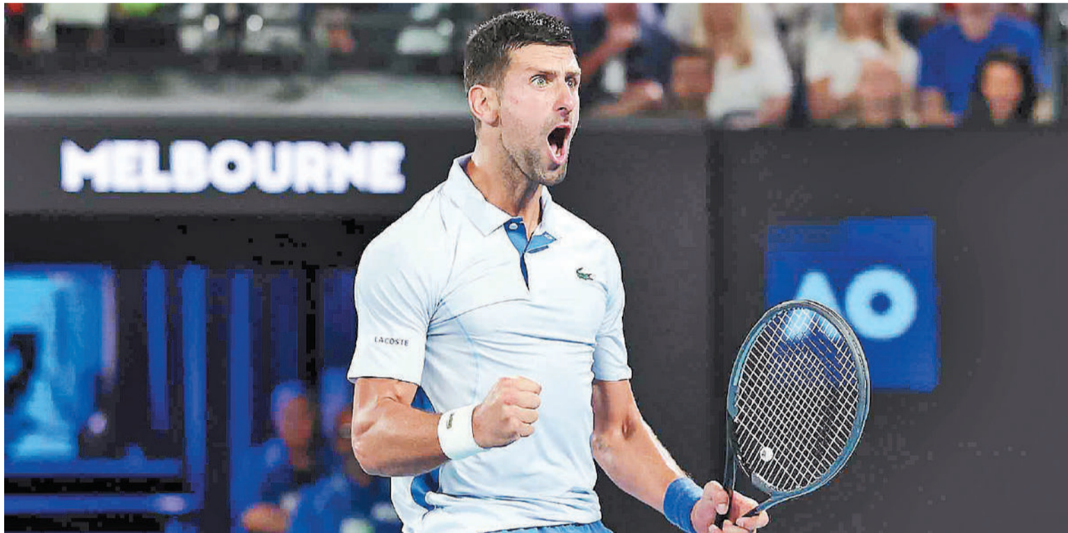
“Disfruto de la competición. La motivación está ahí. Eso es lo más importante que un deportista debe tener y cultivar”, señaló Djokovic tras su partido ante Mannarino en la sala de prensa.

francés reducido ante la superioridad de su rival.