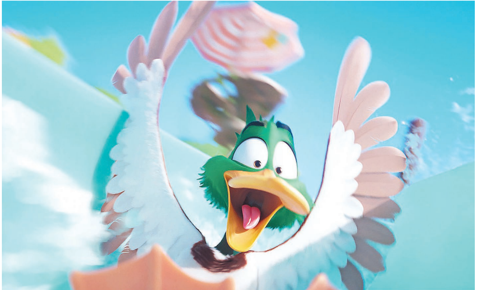
"Patos", diariamente en los cines Círculo, Sunstar y Las Tipas.

Patos 3D: 18:30 | 20:30 Sobrevivientes: 22:00 Aguas Siniestras: 20:00 | 22:20 Muchachos 2D: 14:00 Beekeeper: Sentencia de Muerte 2D: 20:15 Wish 2D: 16:10 | 18:00 | 18:20 Patos 2D: 14:30 | 16:20