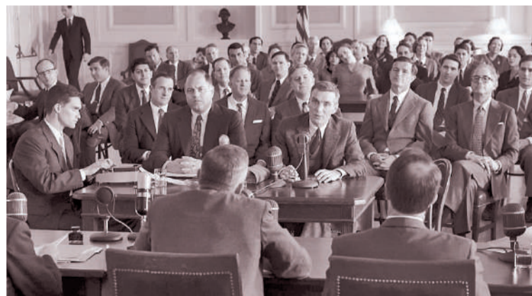
“Oppenheimer”, el más reciente filme de Christopher Nolan sobre “el padre de la bomba atómica”.

Además, recibió ocho galardones en los Critics' Choice Awards del último 14 de enero, donde obtuvo la estatuilla a Mejor película y donde tanto Nolan, Murphy, Downey Jr. y el compositor Ludwig Göransson fueron reconocidos -una vez más en sus respectivas categorías.