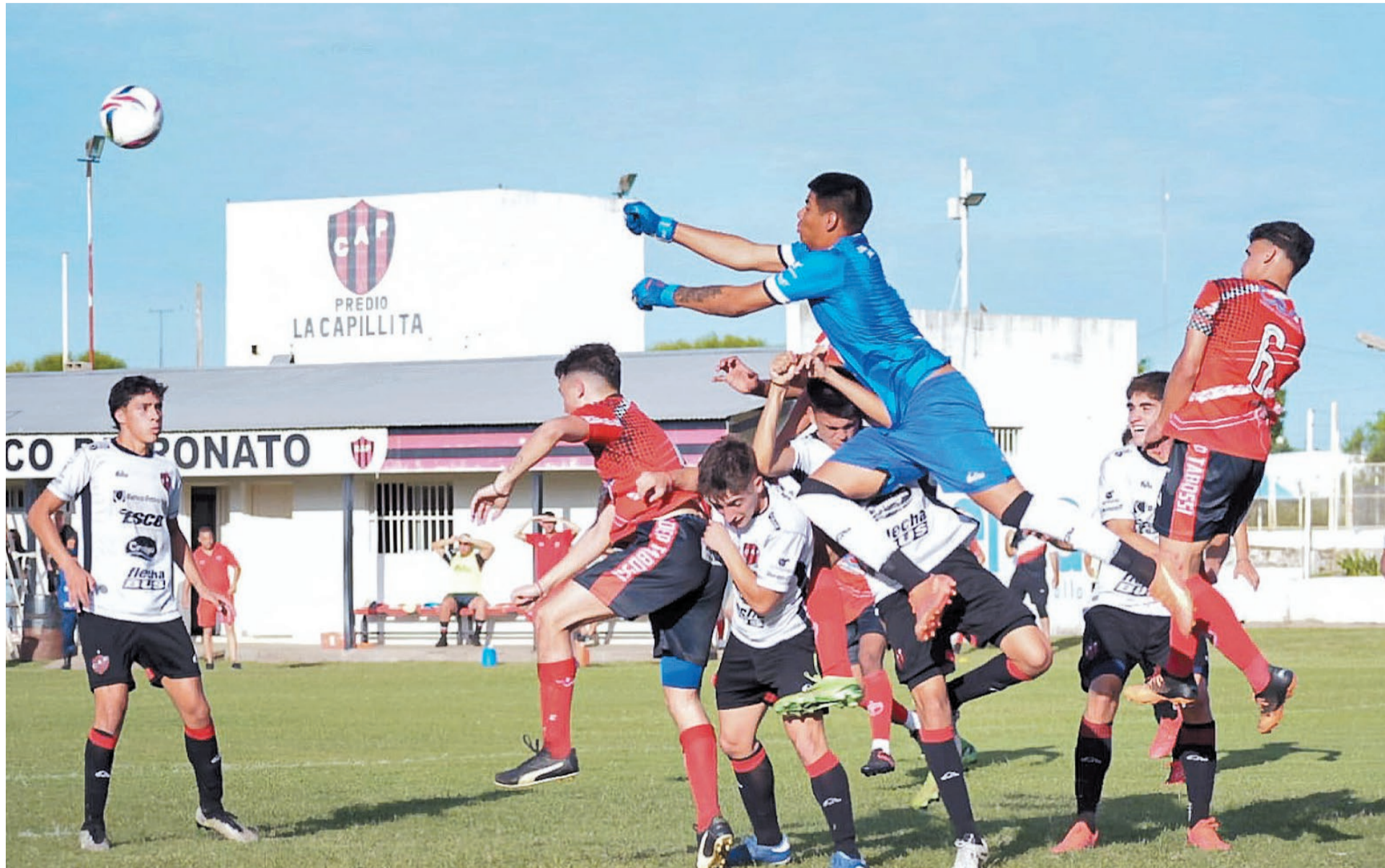
Patronato debutó en la Copa Entre Ríos con victoria 1 a 0 ante Deportivo Tabossi, en el marco de la primera fecha.