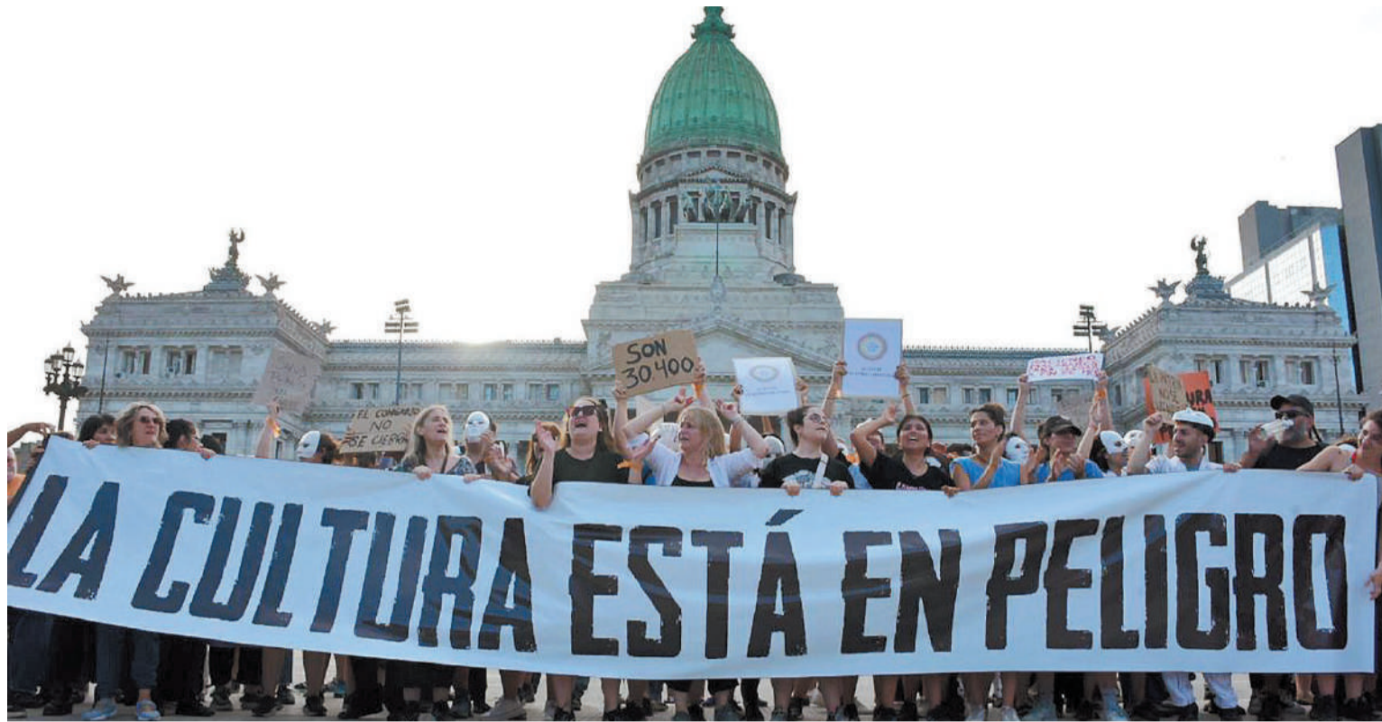
La movida en defensa de la cultura llegó días atrás al Congreso Nacional.