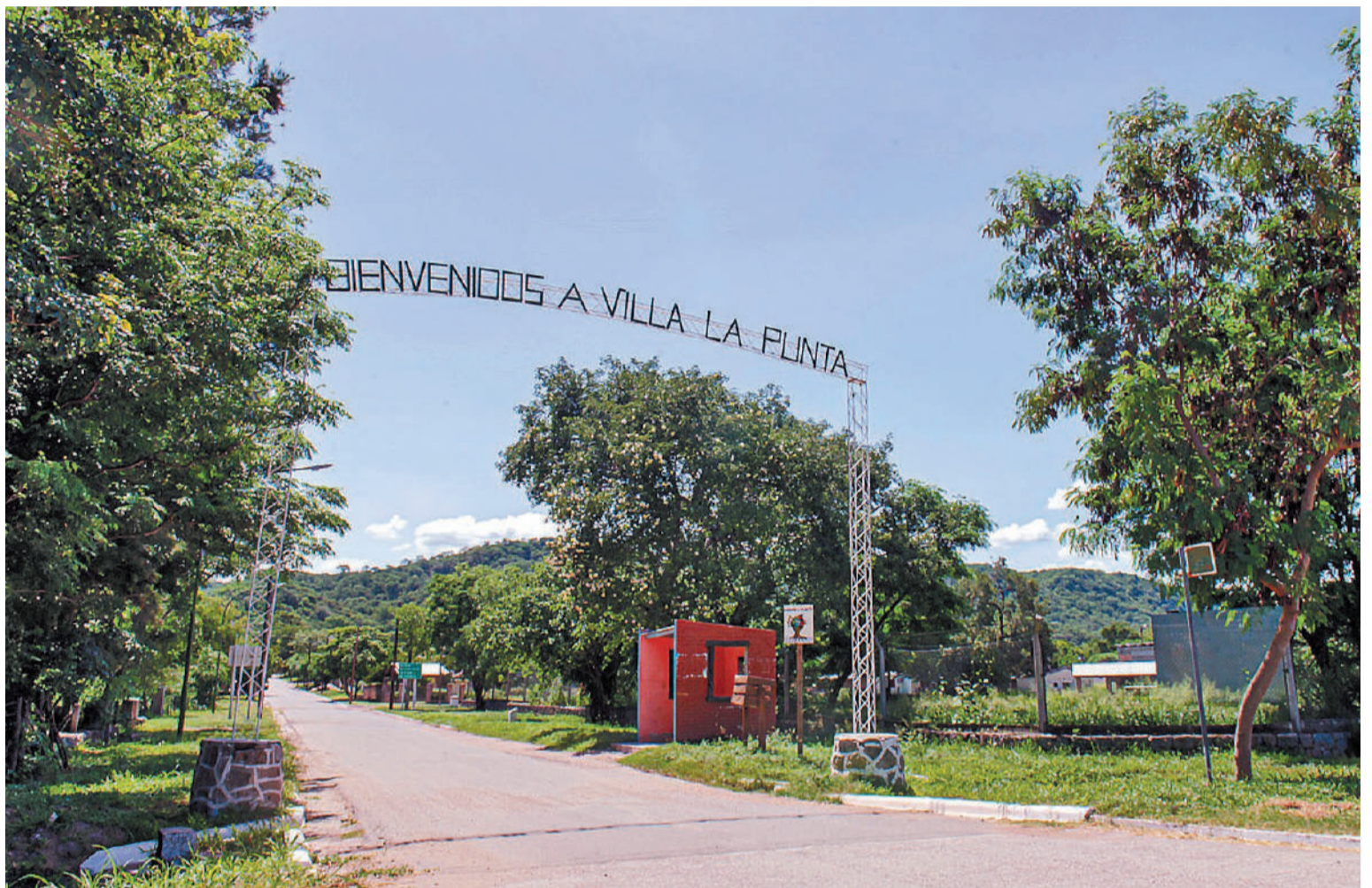
Villa La Punta está ubicado en la ladera oriental de las sierras de Guasayán, a unos 92 Kilómetros de la capital de Santiago del Estero.

Chilca, Quebrada de Calapuchín, Quebrada de Pérez y Pozo de Leiva.