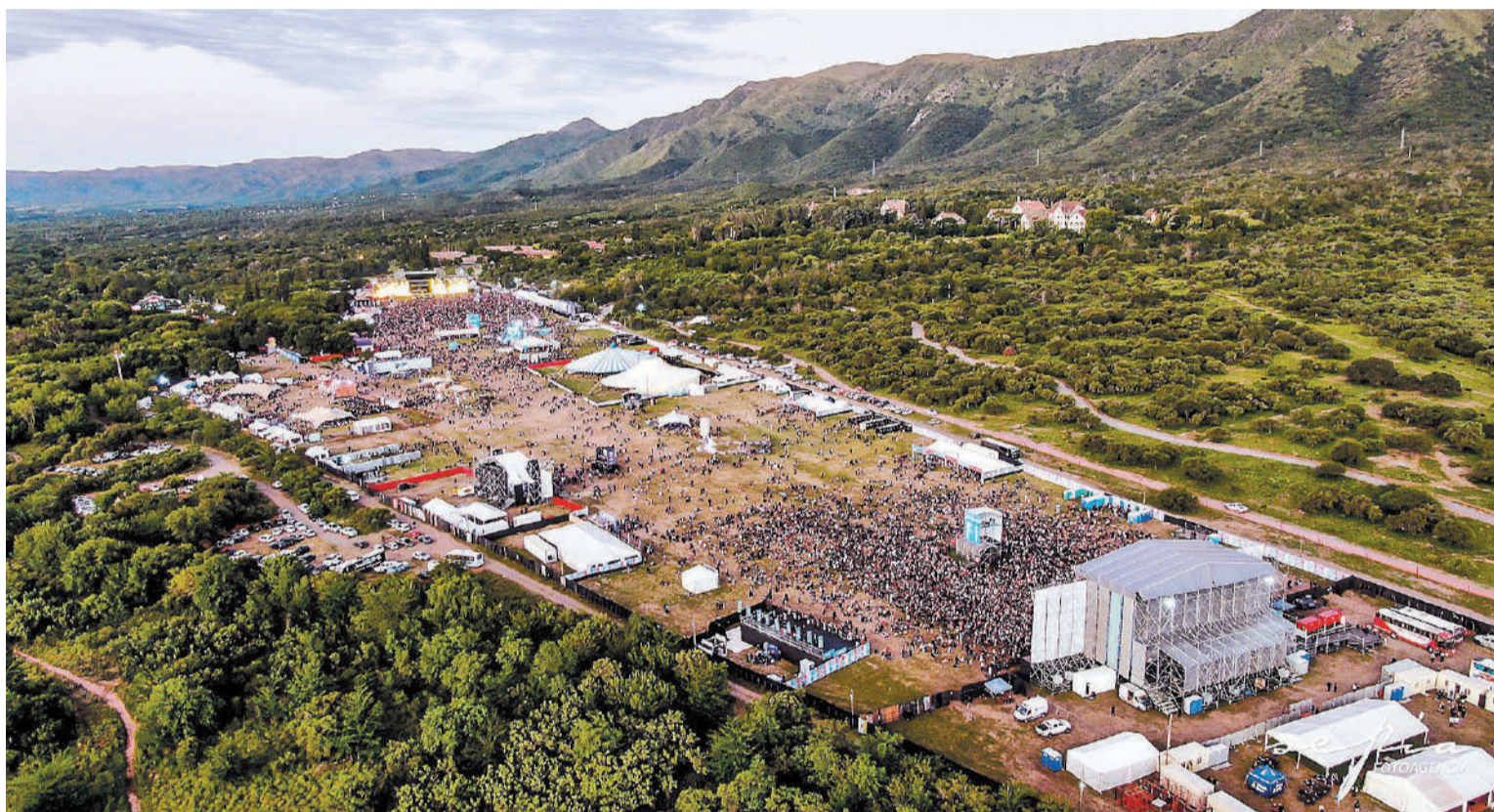
Cosquín Rock ya lanzó su grilla.

En la sede Montaña se destacan Bandalos Chinos (18.10), Miranda! (19.30), Lali (21) y Tiago PZK (22.30); lo central en Paraguay co-