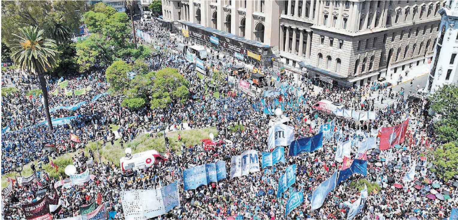
Organizaciones sociales volverán a salir a la calle, como ya lo han hecho en las últimas semanas.