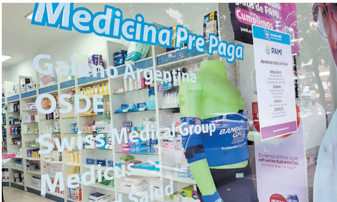
La Defensoría del Pueblo de la Nación expresó su preocupación por los últimos aumentos que han impuesto las empresas de medicina prepaga.

El pronunciamiento del ente se produjo luego de que las principales empresas del sector anunciaron subas muy elevadas y coordinadas en las cuotas los meses de enero y febrero. Algunos de sus directivos llegaron a admitir que están dispuestos a perder afiliados en caso de que no puedan las cuotas.