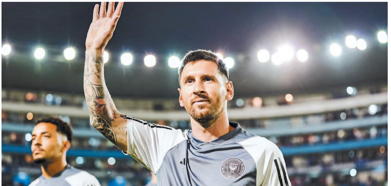
El capitán de la Selección Argentina, Lionel Messi, jugará hoy su segundo partido de preparación, en la fría ciudad de Dallas.

El astro argentino disputará hoy un nuevo juego de preparación en la ciudad del estado de Texas, ante la franquicia local que participa en la Major League Soccer (MLS). El juego ante FC Dallas se disputará desde las 20 en el estadio Cotton Bowl.