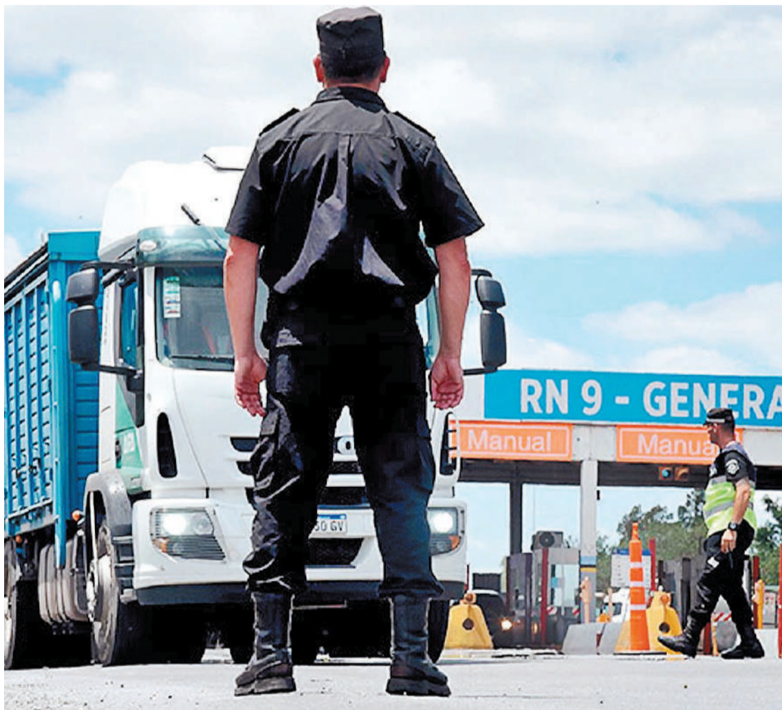
Se estima que habrá un intenso movimiento en los puertos sobre el río Paraná.

El tema estuvo en agenda también en la reunión que Maximiliano Pullaro mantuvo el viernes