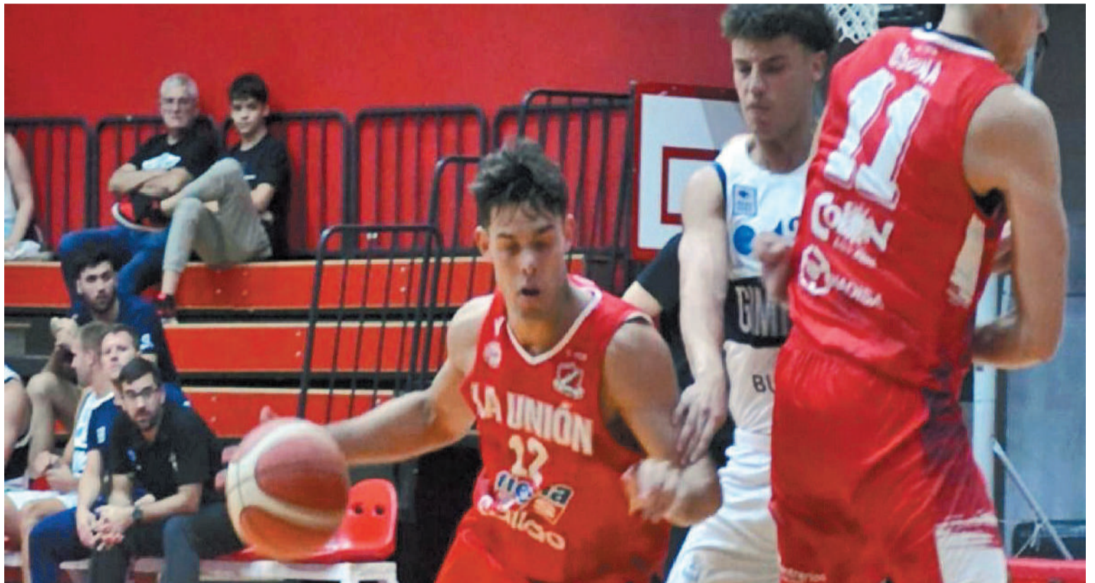
El elenco de Colón marcha noveno en la tabla, a cuatro unidades de la cima.

El equipo entrerriano, La Unión de Colón, le ganó en su estadio a Gimnasia por un gran marcador de 104 a 80 en el marco del partido correspondiente a la conferencia Sur de la Liga Argentina de Básquet. Además, el otro equipo de la zona, Rocamora confirmó un reemplazo por lesión.