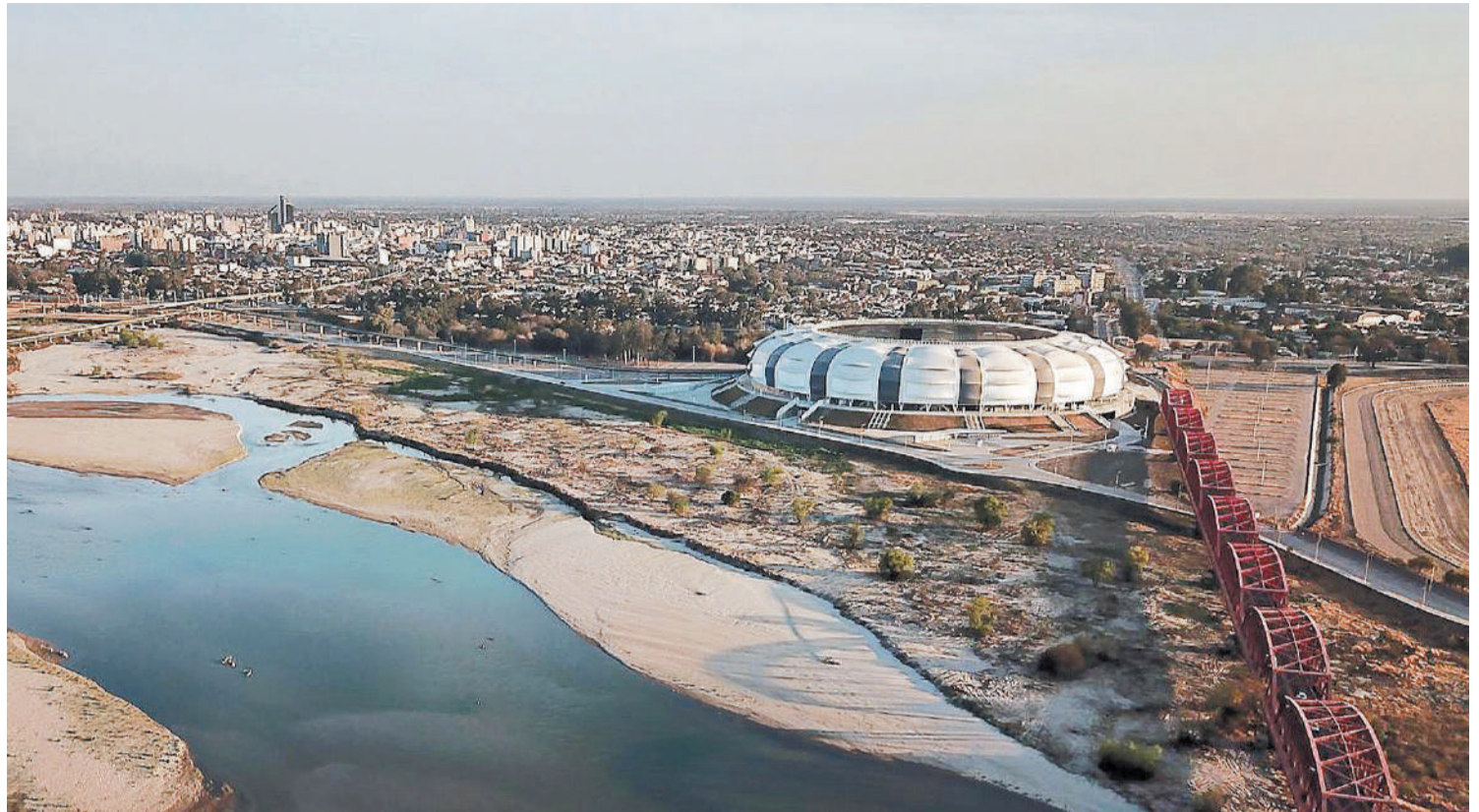
La región norte procura acciones tendientes a potenciar la llegada de turistas.

“Estamos hablando de vacaciones más cortas, más próximas, sin desplazarse demasiado, vacaciones como antes se llamaban gasoleras, digo antes