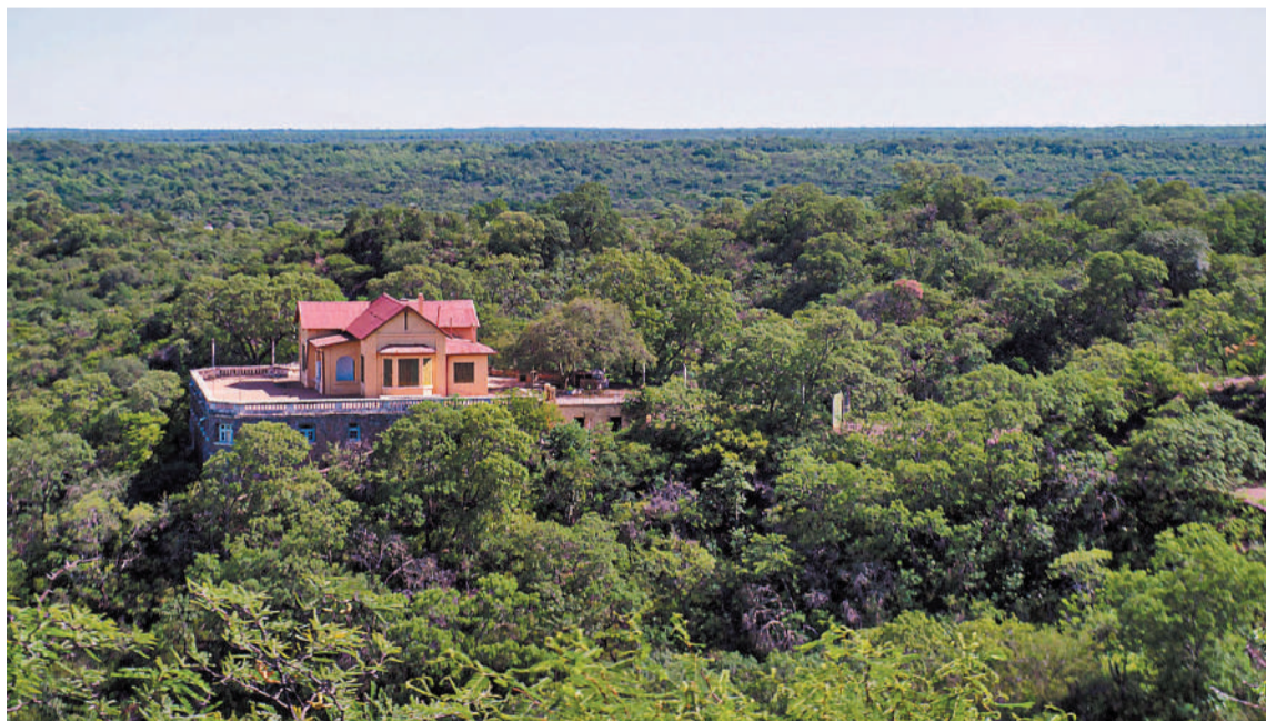
Villa La Punta está siendo considerado por los turistas por sus atractivos paisajes.

Por otra parte, Bravo remarcó la continuidad en Santiago del Estero de citas deportivas de primer nivel nacional e internacional, como polos convocantes de turistas, y al respecto mencionó una nueva cita de la Pro League de hockey sobre césped (14 al 19 de febrero) con la participación de los seleccionados masculinos y femeninos de Argentina, Alemania y Bélgica.