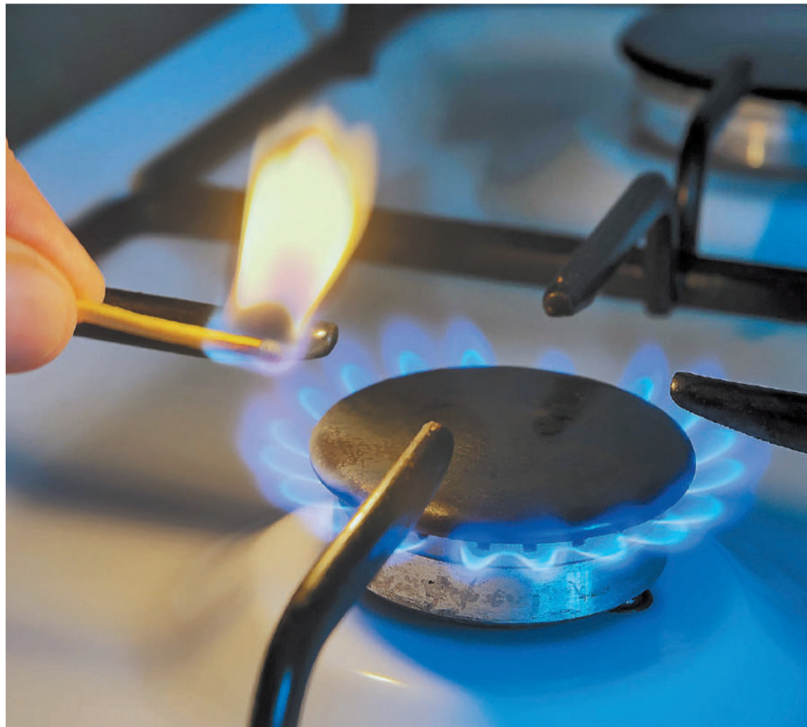
En febrero comienza la primera etapa de los aumentos en las tarifas de gas.

Para entonces, ya definida la etapa del recorte de subsidios, corresponderá establecer el nuevo esquema tarifario con la suma de otros tres ítems: el traslado al precio final de los costos de transporte, el de los márgenes de distribución y, además, la implementación de un índice de ajuste mensual, tal como se había estableci-