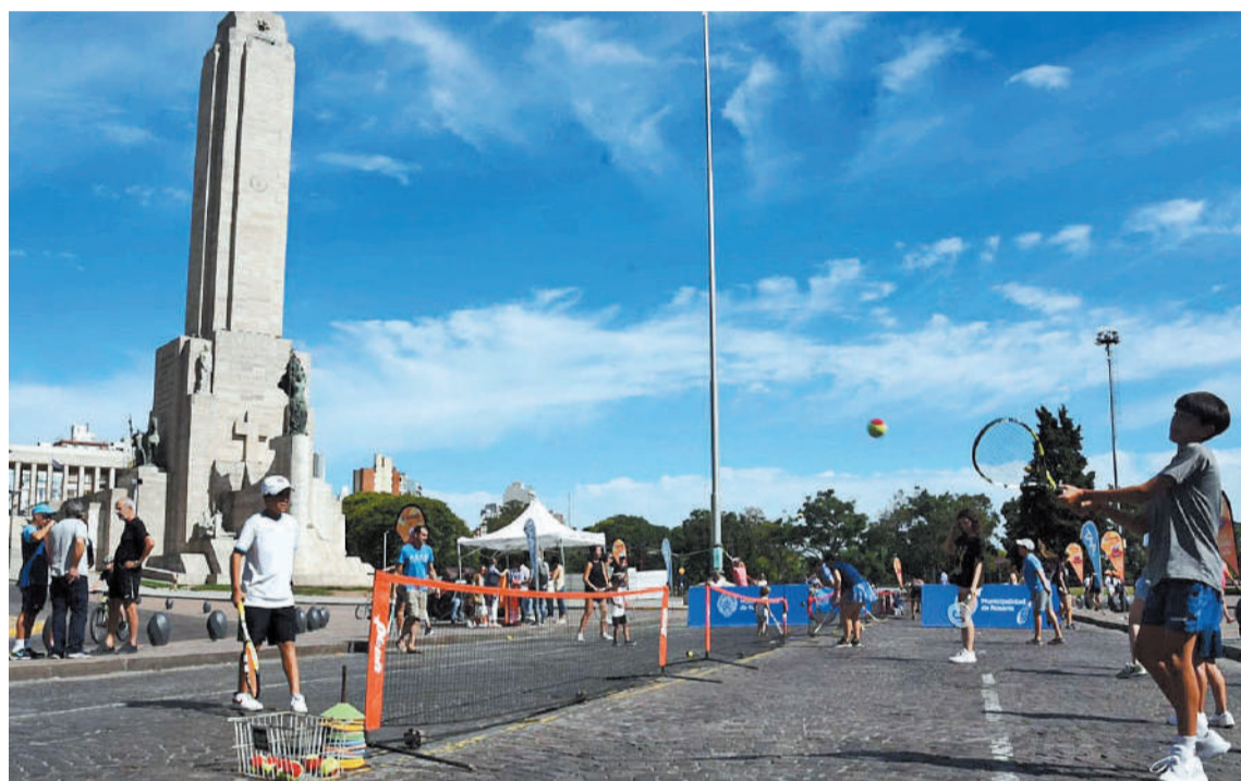
La cuna de la bandera será sede de la Copa Davis en el Jockey Club y así viven las vísperas a las orillas del río Paraná. Las entradas ya están a la venta.

Luego, agregó: "En 116 años de historia Rosario nunca fue sede de Copa Davis, la única vez que vimos la Copa fue cuando la ganamos y trajeron el trofeo, pero no la com-