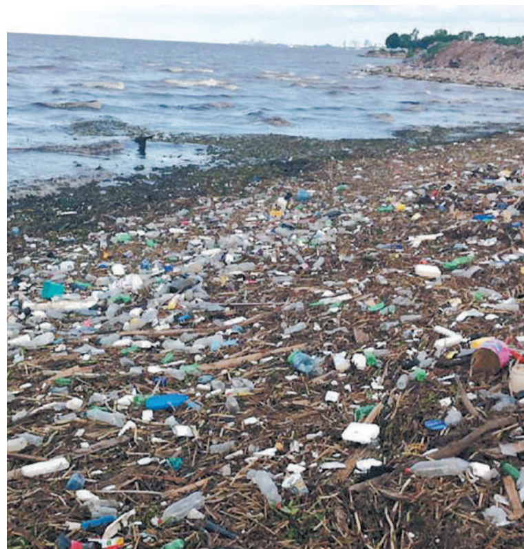
Las sustancias riesgosas alteran el sistema endocrino y causan enfermedades como diabetes, endometriosis e infertilidad.