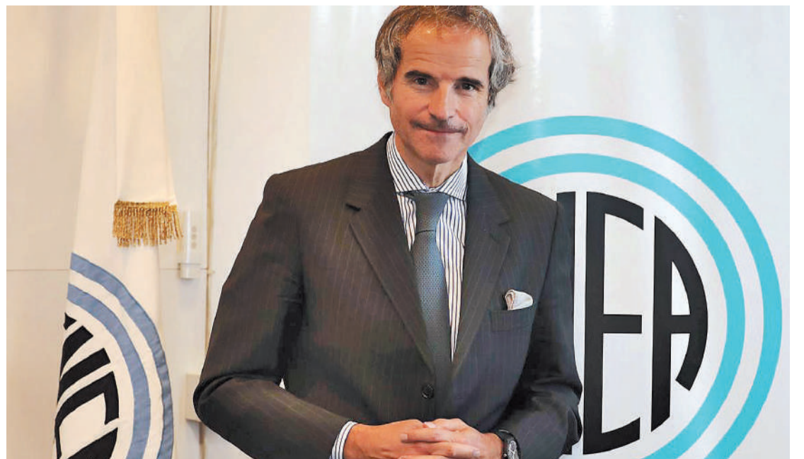
Rafael Grossi, director general del Organismo Internacional de la Energía Atómica (OIEA).

Un equipo de investigadores recogió muestras de agua desde uno de los laboratorios del buque Almirante Irizar, en el marco del proyecto Nutec Plastics que se realiza durante la Campaña Antártica de Verano (CAV) para detectar la presencia de microplásticos por primera vez desde el Río de la Plata hasta la Antártida.