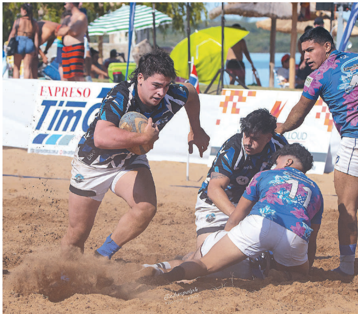
El Seven Internacional de la Playa, un mojón en la historia del rugby entrerriano.

Este sábado desde las 14 en la Isla del Puerto de Concepción del Uruguay tendrá lugar la XXXIII Edición del Seven Internacional de la Playa. De la partida serán 13 equipos de distintos puntos del país y del Uruguay. El CUCU prepara un gran evento.