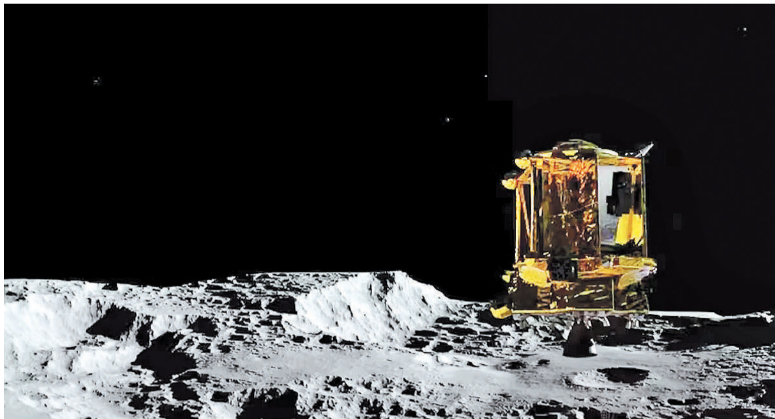
La sonda espacial japonesa Slim hizo historia al llegar a la Luna (JAXA).

DETALLES. SLIM no fue el primer intento de aterrizaje lunar de Japón. Un pequeño módulo de aterrizaje llamado OMOTENASHI se lanzó hacia la luna como parte de la misión Artemis 1 no tripulada de la NASA en noviembre de 2022, pero la pequeña sonda japonesa no llegó a su destino. Y en abril pasado, la nave espacial Hakuto-R, construida por la empresa ispace con sede en Tokio, se estrelló durante su intento de aterrizaje después de que sus sensores se confundieran por la accidentada topografía de la luna.