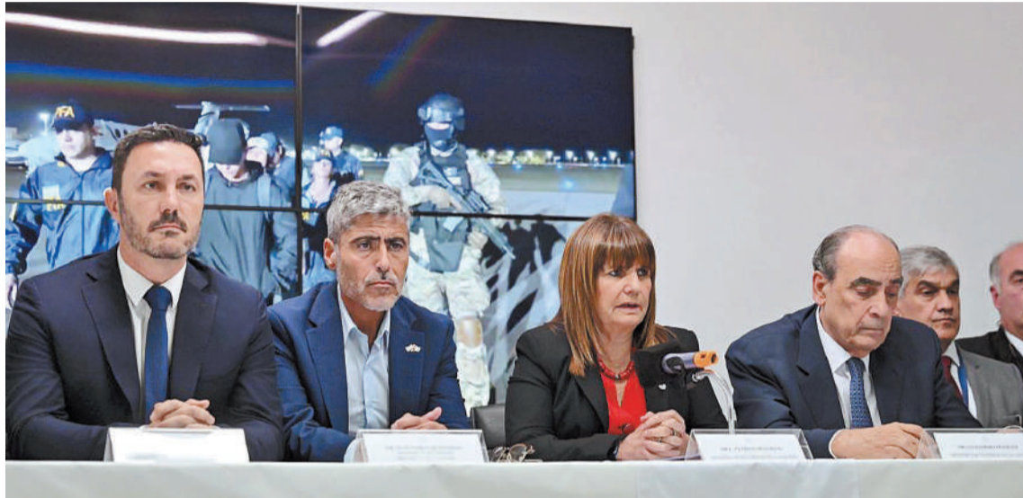
La noticia fue confirmada ayer por las autoridades argentinas en una conferencia de prensa.

"Hace pocos días nos sorprendimos con una situación de altísi-