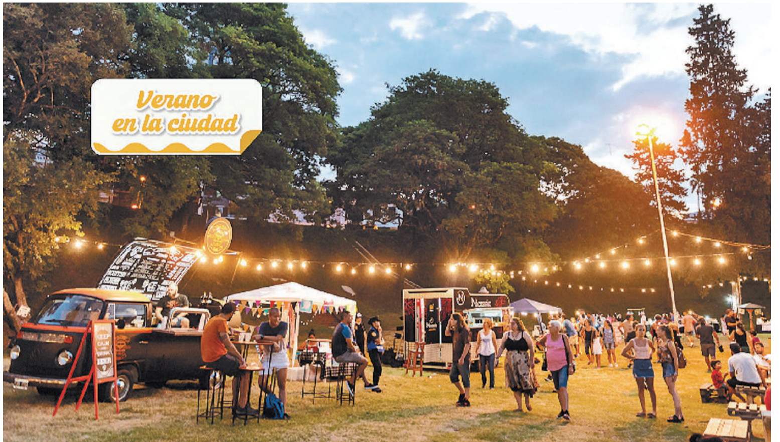
Hoy y mañana desde las 20, en el Puerto Nuevo y en la Plaza Mujeres Entrerrianas habrá Paseo Nocturno con gastronomía y emprendedores.

Wish 3D: 16.00, 18.15 y 20.30 Wish 2D: 17.00 Aguas siniestras: 22.30 Patos 3D: 16.30, 18.30 y 20.45 Patos 2D: 17.30 El juego de la Muerte: 21.45