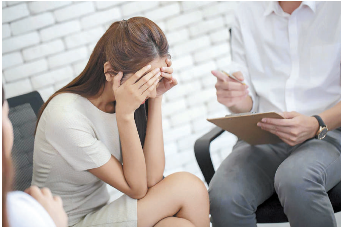
La eremofobia puede tener profundas ramificaciones en la vida diaria de quienes lo experimentan.

A TENER EN CUENTA. El sujeto necesitará explorar, con ayuda de psicoterapia, qué es lo que le provoca el miedo excesivo a la soledad o a las ideas que tiene de ésta. Indagar por qué necesita la compañía constante de un otro. En qué momento comenzó este miedo. A la vez, será de gran utilidad una terapia enfocada en la gestión del manejo del estrés, gestionar habilidades sociales y resolución de problemas.