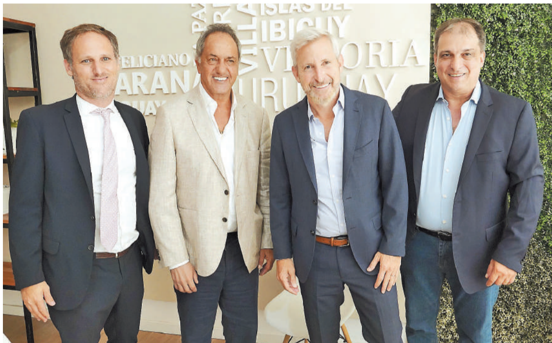
Frigerio y Scioli, junto a los empresarios brasileños.

En este marco, en el artículo 4° se instruye a las autoridades de los Entes Descentralizados, Autárquicos, Sociedades y Empresas del Estado, designadas por el Poder Ejecutivo, a "ajustar el régimen salarial respectivo a lo dispuesto en el artículo 1° del presente".