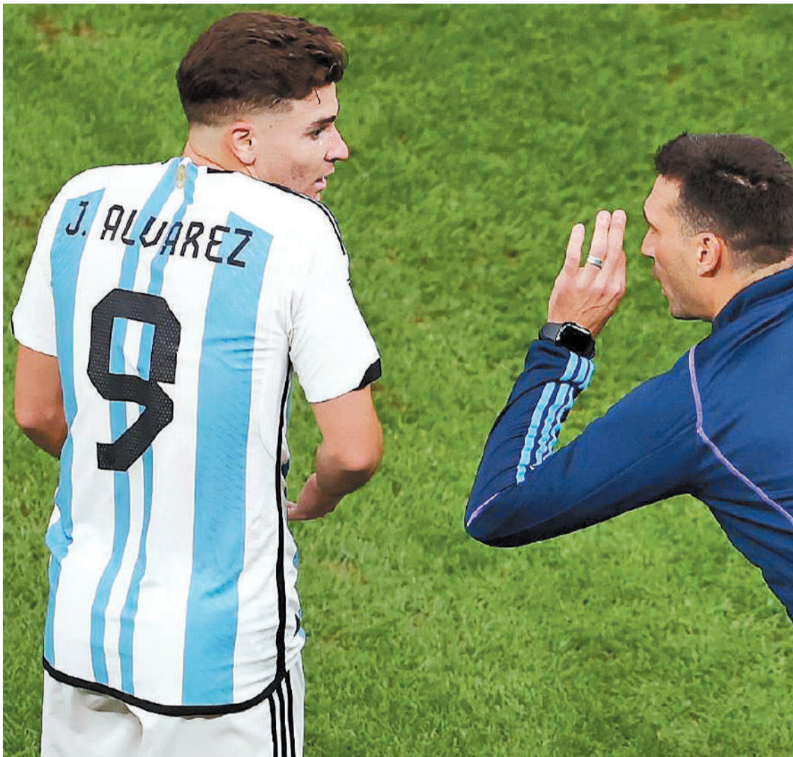
Julián Álvarez fue importante en la obtención de la Copa del Mundo para Argentina, el delantero apuesta a la continuidad del proyecto.

Con respecto a su presente y sus objetivos con el City, Julián detalló: “En lo personal, quiero seguir creciendo como jugador y persona. Después colectivamente intentaremos con el grupo lograr lo que hicimos el año pasado y ganar todas las competiciones”.