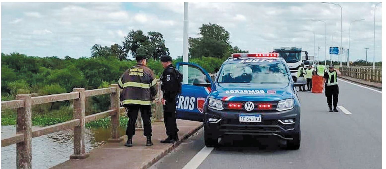
El cuerpo apareció en la orilla debajo del puente del aliviador casi 48 horas después del accidente.

Luego de retirar el camión, buzos tácticos encontraron fallecido al chófer del vehículo protagonista del accidente en la ruta 168. La víctima apareció en la orilla debajo del puente del aliviador en dónde se produjo el choque