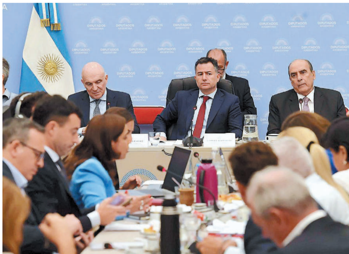
Continúa el debate del proyecto de la ley ómnibus y comienzan a darse los primeros acuerdos entre los diferentes bloques.

Entre los puntos se encuentran limitar el plazo de vigencia de la emergencia solicitada por el Ejecutivo, la metodología de aumento de las jubilaciones y la eliminación de las retenciones a las economías regionales, además otros ítems.