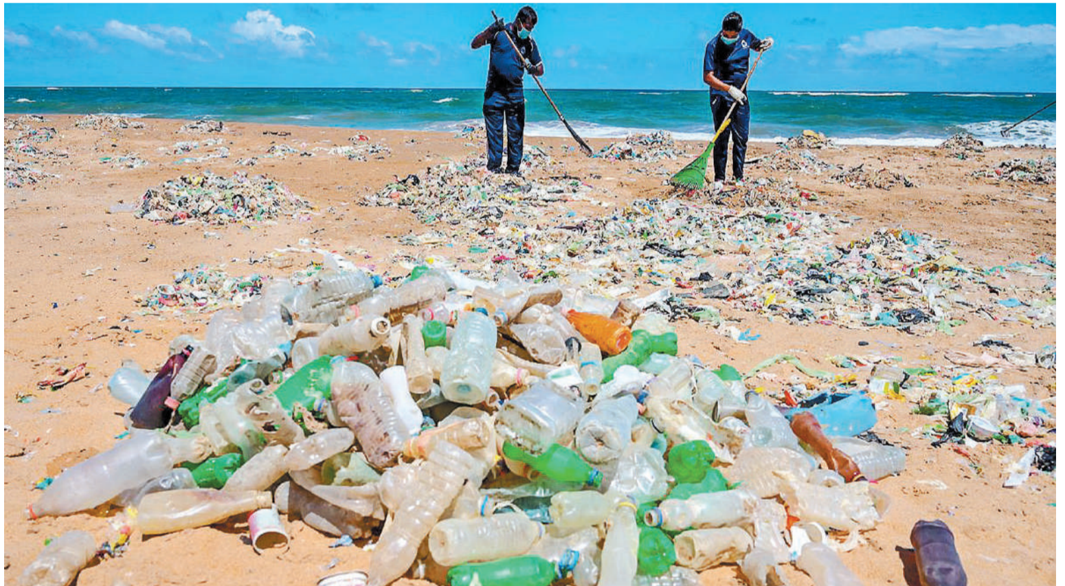
El 24% de los químicos presentes en los plásticos son de “alta preocupación” para la salud humana.

Investigadores del Conicet advirtieron que casi la mitad de los 13.000 químicos que se utilizan en la producción del plástico no tienen información toxicológica en bases de datos regulatorias, lo que provoca una “anarquía química”. Las sustancias riesgosas alteran el sistema endocrino y causan enfermedades como diabetes, endometriosis e infertilidad.