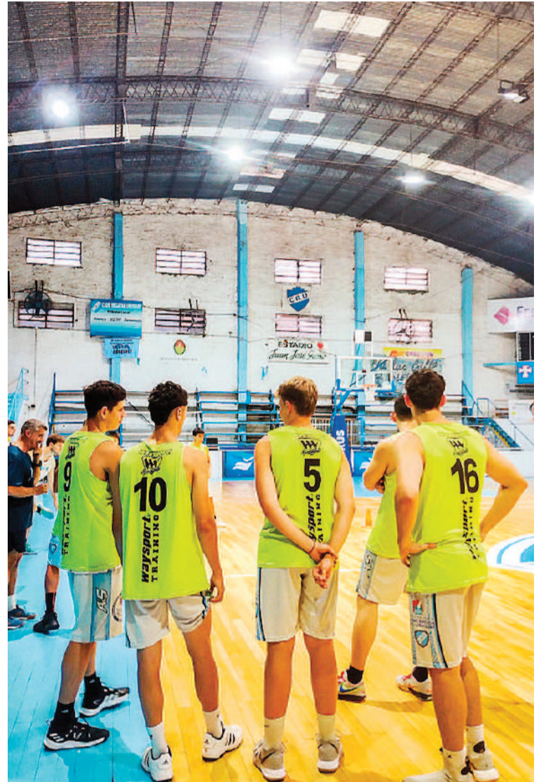
Regatas en acción. Con una base de jugadores de la temporada anterior, llegan caras conocidas que saben cómo representar al Celeste.

Uruguay, campeón del Pre Federal Conferencia 1, y Deportivo Ferrocarril de San Salvador, campeón del Pre Federal Conferencia 2.