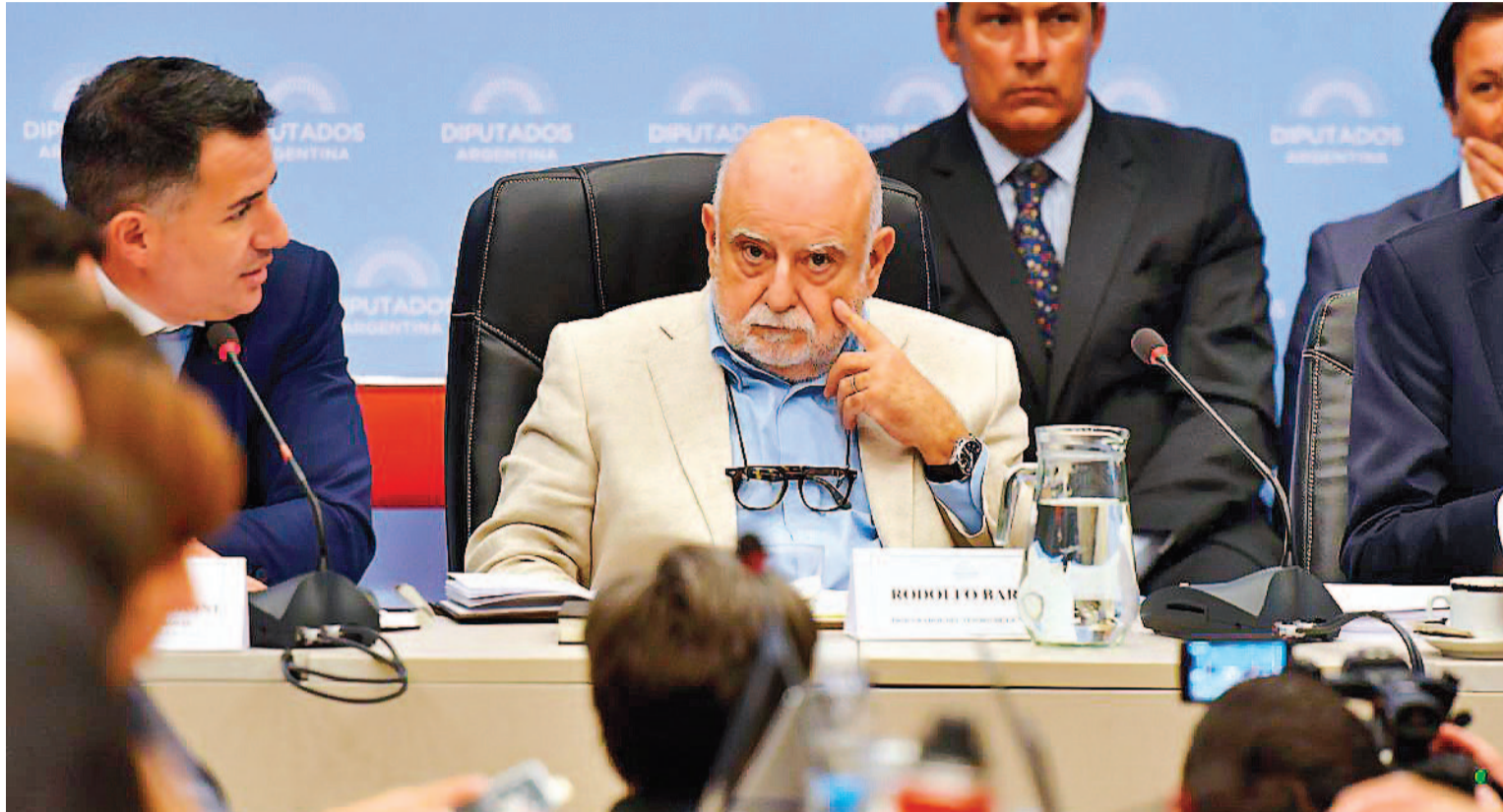
Rodolfo Barra, Procurador del Tesoro, uno de los impulsores de la ley de "Bases".