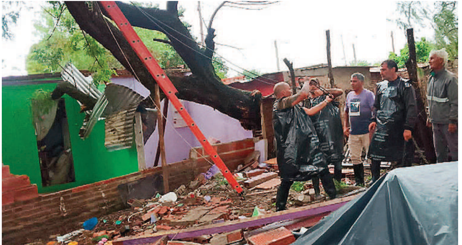
El temporal provocó graves desastres y accidentes en distintos puntos de la ciudad.

bre la edificación y ante la emergencia, los vecinos avisaron a la Municipalidad, y a través de la Secretaría de Servicios Públicos, Arquitectura y Protección Civil se pudo brindar asistencia.