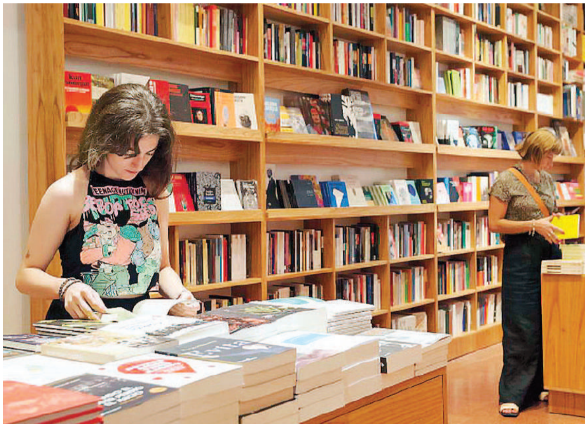
Para los investigadores, derogar la Ley del libro no permite proyectar ni la internacionalización ni la exportación. Tampoco pensar en políticas públicas que potencien la industria nacional.

Este número toma relevancia cuando se compara con lo que sucede por ejemplo en Brasil, donde hay 2200 librerías, 1,01 cada 100 mil habitantes. En el caso de México,