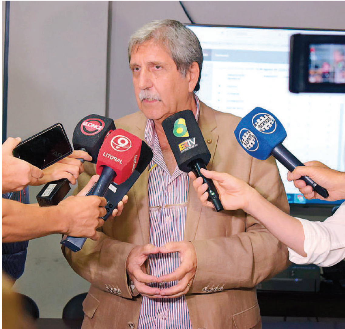
“Con el propósito de descomprimir los establecimientos de mayor complejidad y disminuir los ingresos, estamos reorganizando y potenciando a los centros de salud”, comentó Grieve.

cilazo profundizó en la situación sobre dengue y aseveró que los casos confirmados son, hasta el momento, 54 y en algunas localidades de la provincia, ya se registran casos autóctonos. “En comparativa con años anteriores, se evidencia un adelanto de la situación epidemiológica y la mayoría son importados, principalmente notificados en personas que viajaron al Norte argentino y también al extranjero”, afirmó.