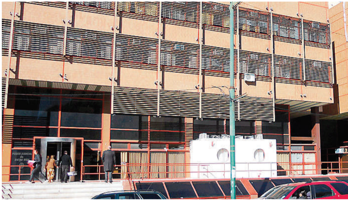
La resolución se concretó en el Tribunal Oral Federal de Concepción del Uruguay.

DEFENSA. La defensa, al solicitar el beneficio, refirió que “la si-