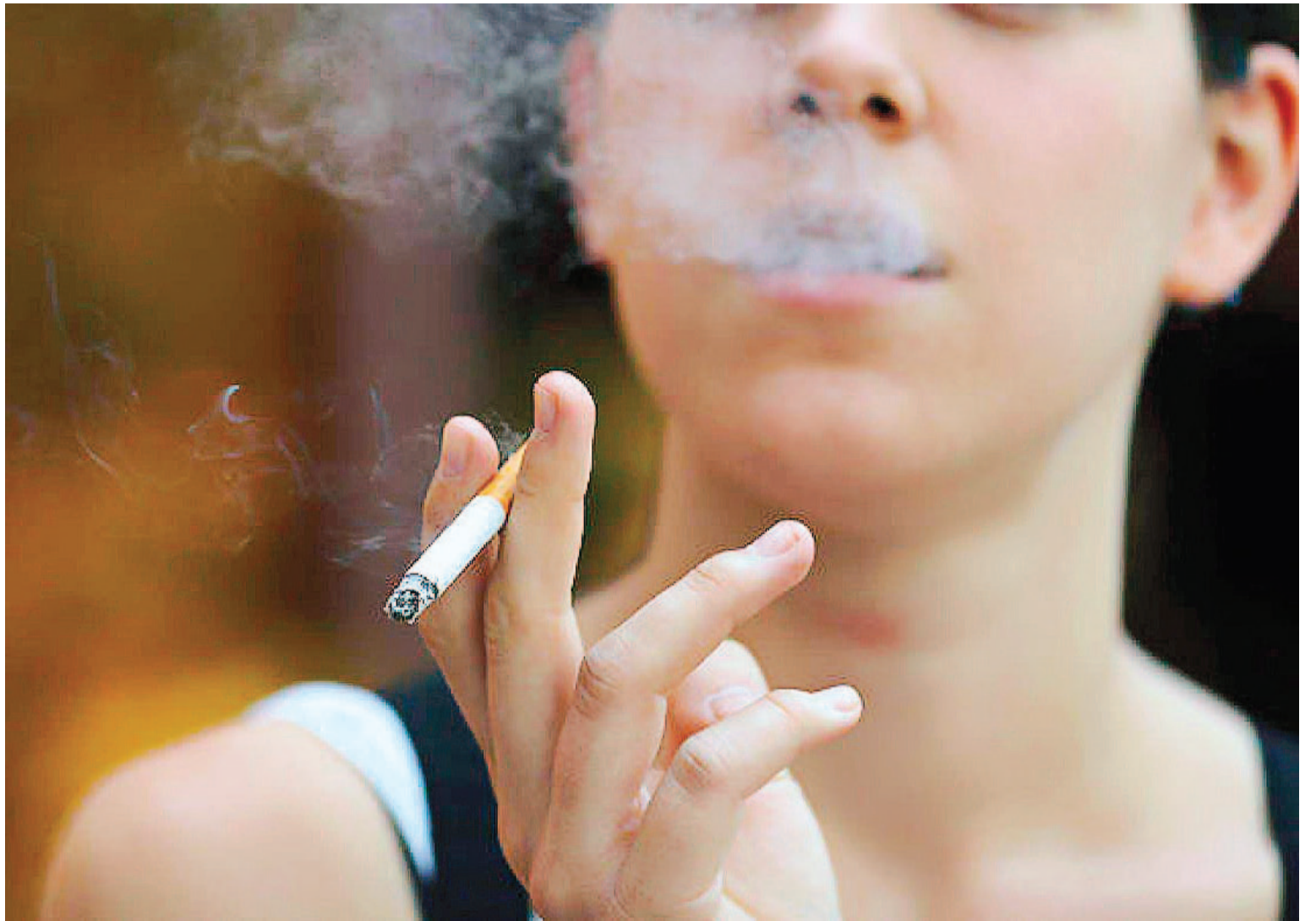
La mayoría de las encuestas nacionales se muestra sistemáticamente que los niños de entre 13 y 15 años consumen tabaco y productos con nicotina.

“Fortalecer el CMCT de la OMS es una prioridad de salud global descrita en los Objetivos de Desarrollo Sostenible. La OMS está dispuesta a apoyar a los países en la defensa de medidas de control del tabaco basadas en evidencia frente a la interferencia de la industria”, concluyó el documento.