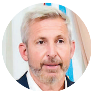
Rogelio Frigerio, gobernador de Entre Ríos

“Le presenté al director de la Anses la deuda que el organismo mantiene con la provincia”