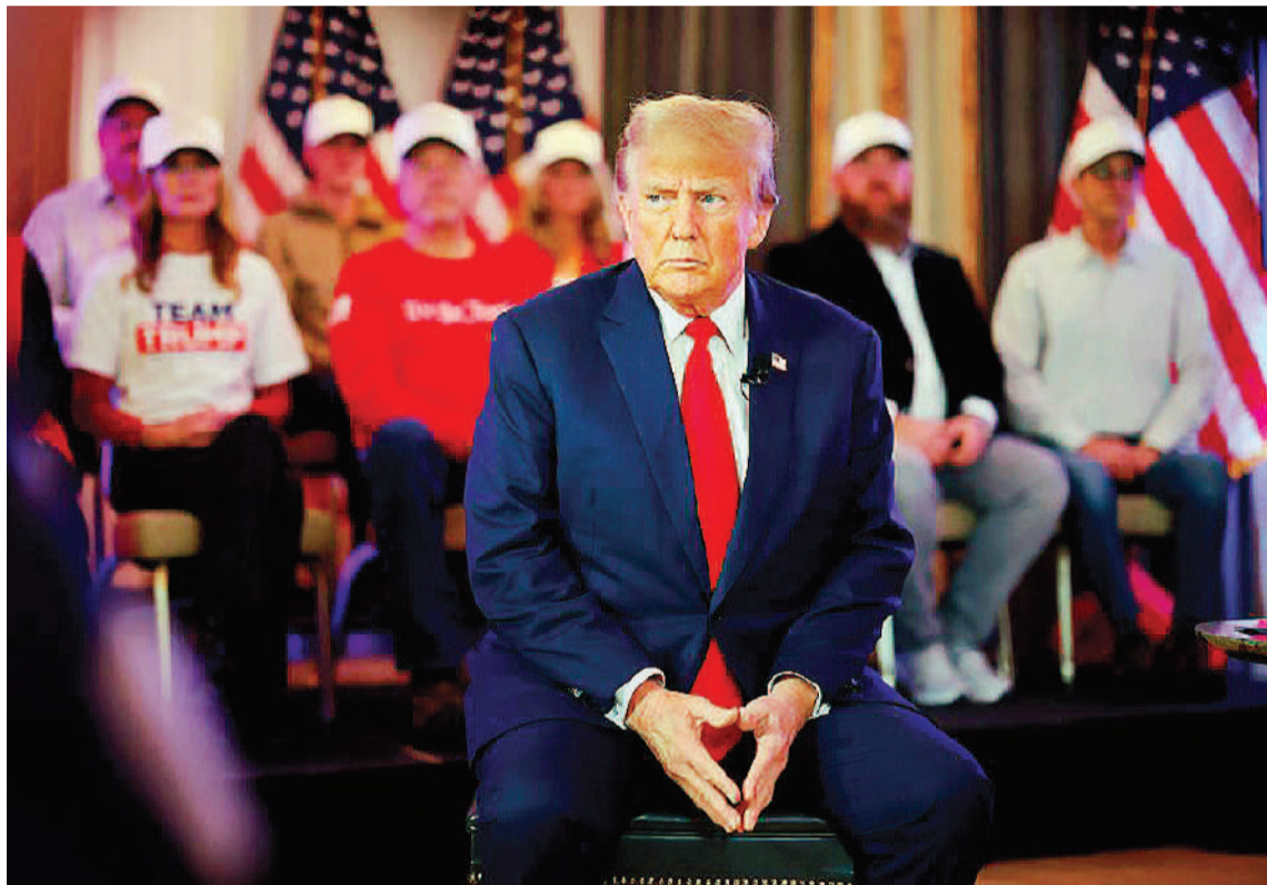
Trump vuelve a sentarse en el banquillo de los acusados en plena campaña electoral.

El jurado también determinó que Trump difamó a Carroll en una publicación de octubre de 2022 en su red social Truth Social, en la que calificó las acusaciones como