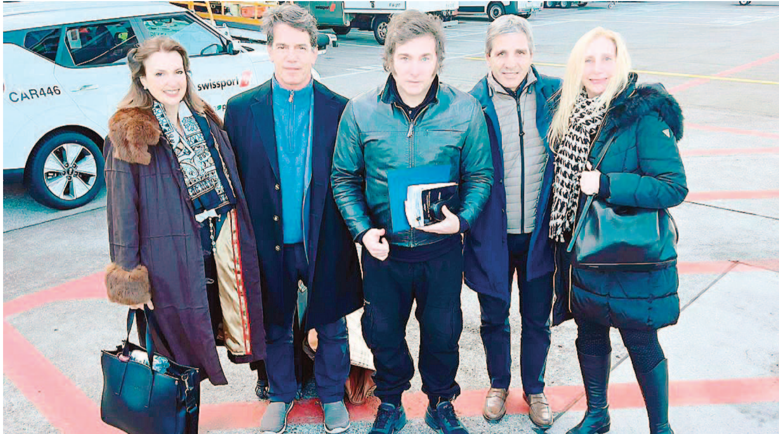
Milei aseguró que durante su exposición de hoy, va a transmitir el mensaje de "que la libertad es la llave para la prosperidad".