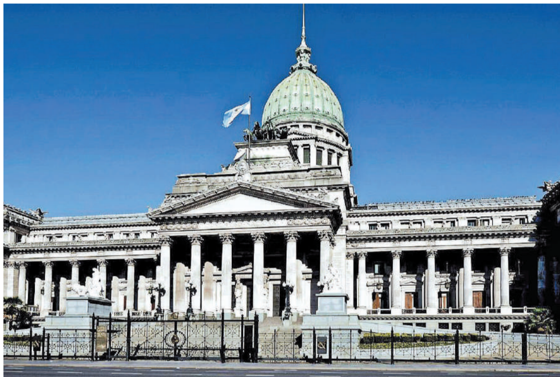
El Poder Legislativo tiene diez días hábiles para su tratamiento en la Comisión Bicameral de Trámite Legislativo.

El legislador peronista argumentó que, de acuerdo al artículo 99 inciso 3 de la Constitución Nacional, “la composición de la referida co-