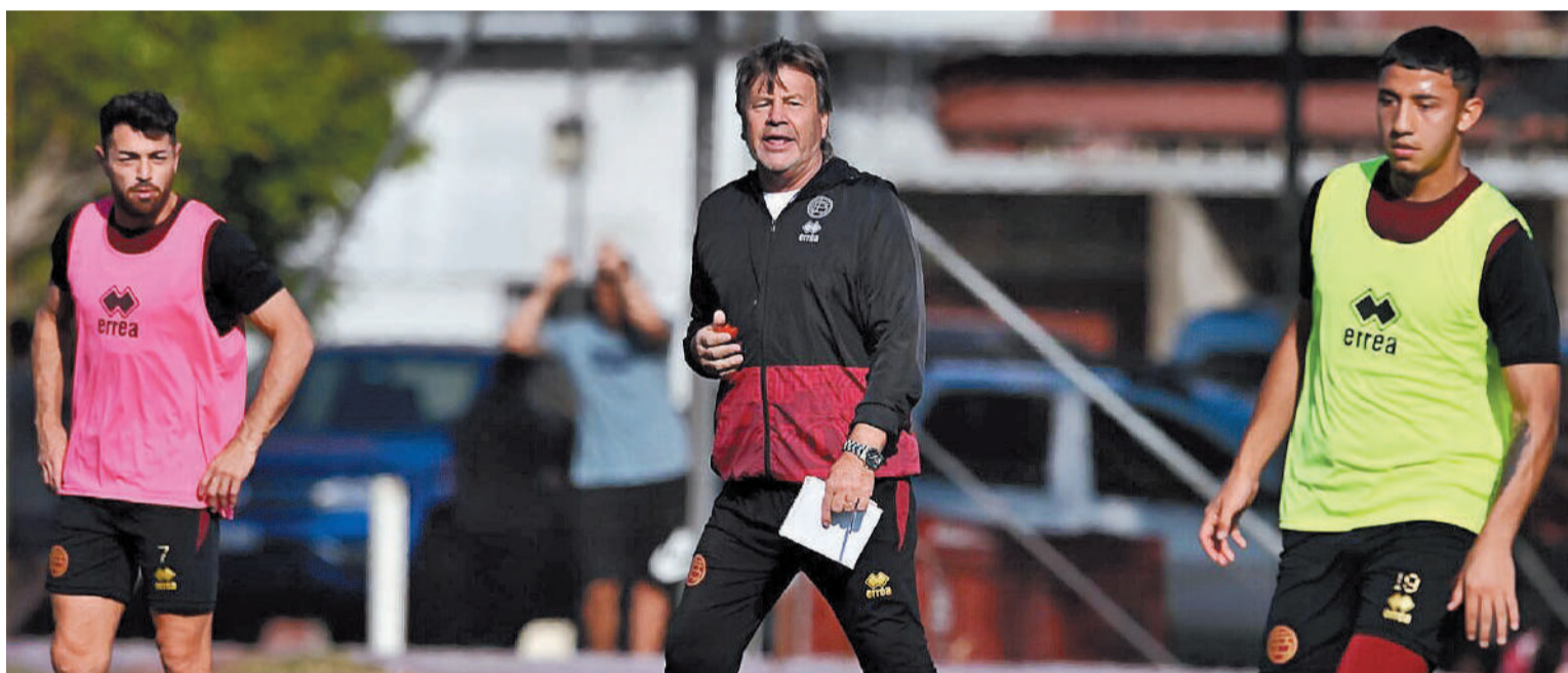
“No está difícil solo para nosotros, todos los equipos están con pocas incorporaciones”, dijo el DT sobre el mercado de pases.

El Club Atlético Lanús tendrá dos desafíos importantísimos de cara a este año. Es que en el inicio de la competencia, arranca último en la tabla general y a contracara, disputará la Copa Sudamericana. En conferencia de prensa, el entrenador Ricardo Zielinski, se manifestó acerca de los objetivos granates .