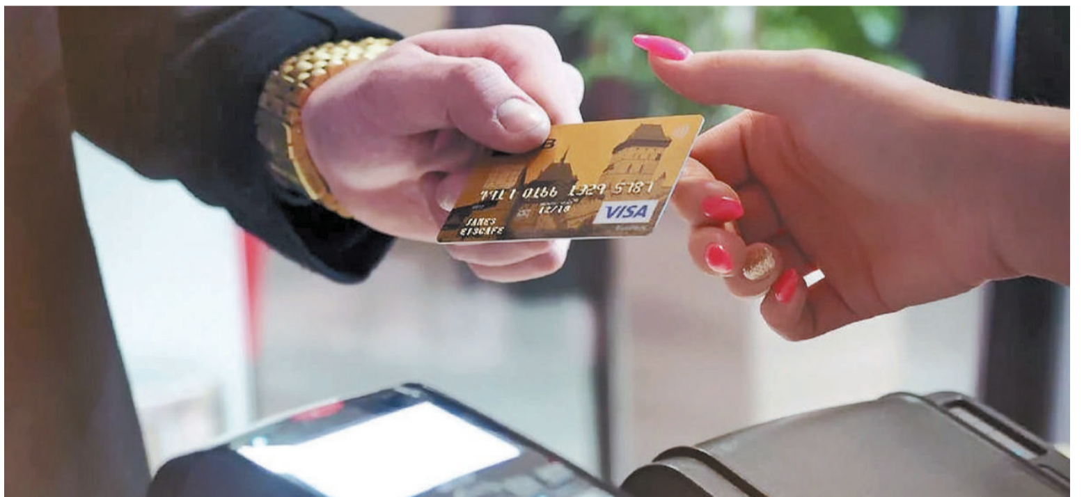
El programa Ahora 12 está vigente hasta el 31 de enero.

El objetivo será sostener los niveles de venta de los principales rubros de consumo popular. La Secretaría de Comercio define con un grupo de bancos la letra chica de la tasa de interés que se aplicará en la nueva etapa.