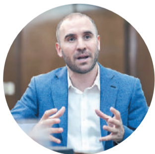
Martín Guzmán, ex ministro de Economía

“La dolarización ya comenzó, se está preparando el terreno, el Gobierno no tiene otro plan”