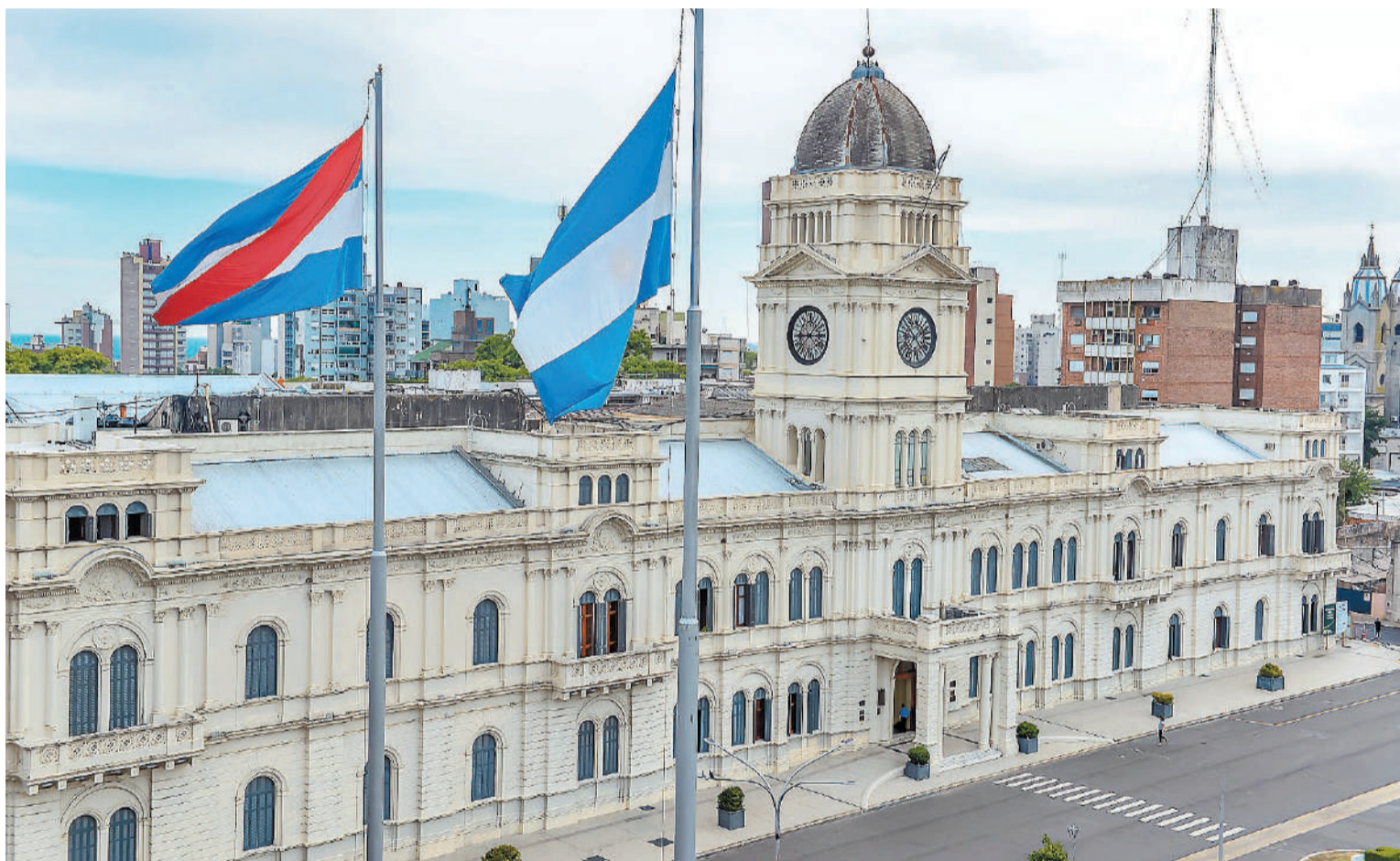
La ley de ministerios fue aprobada en la Legislatura y fue promulgada el pasado jueves.

Gobernación, la Coordinación de Gabinete, con rango de Secretaría Ministerial.