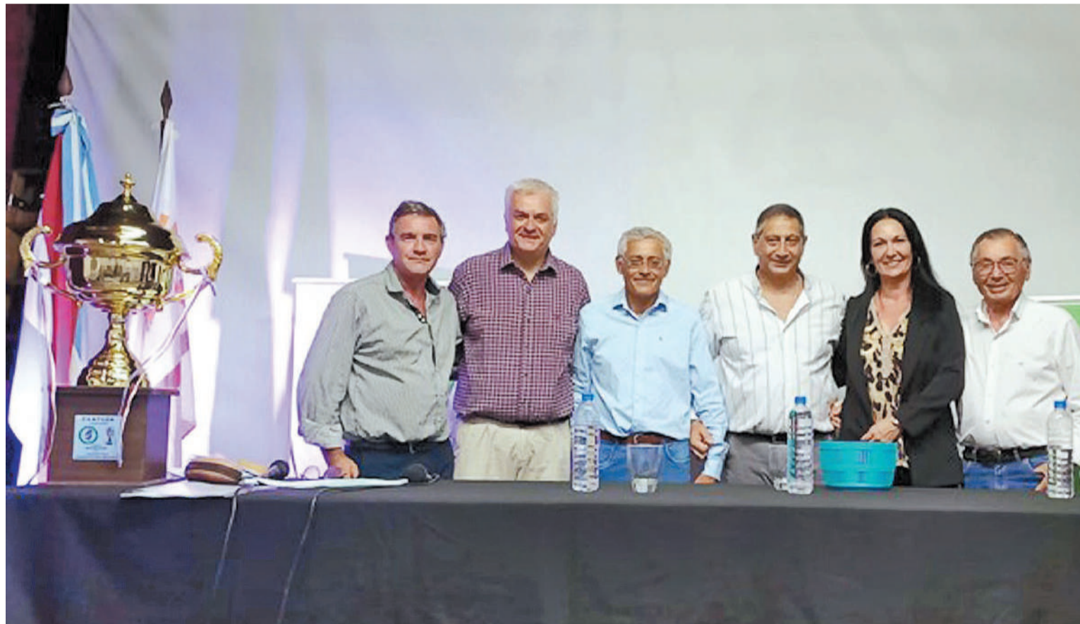
La imagen del trofeo, presente en el sorteo realizado en el Centro de Cultura de la ciudad de Federación, con la asistencia de distintas autoridades de la Federación Entrerriana de Fútbol.

El certamen provincial ajusta detalles de cara a su inicio. La Federación Entrerriana de Fútbol definió los grupos que conformarán la Copa Entre Ríos 2024 masculina. Con fecha de inicio para el fin de semana del día 13 de este mes, son 47 equipos divididos en 11 zonas de cuatro y una restante, con tres clubes.