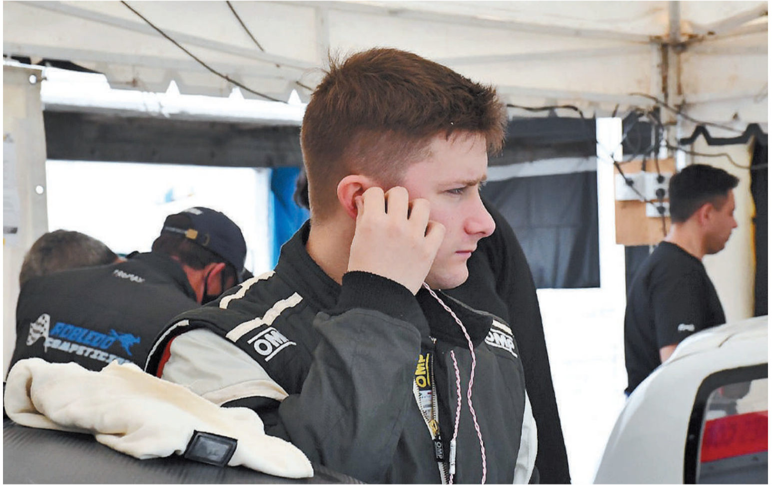
“Estamos con grandes expectativas para este 2024”, sostuvo Dreiling.

“Para este año retomamos nuestro proyecto original que era correr en la Clase 3. La premisa es estar a partir de la tercera o cuarta fecha con el Peugeot 208 que estamos