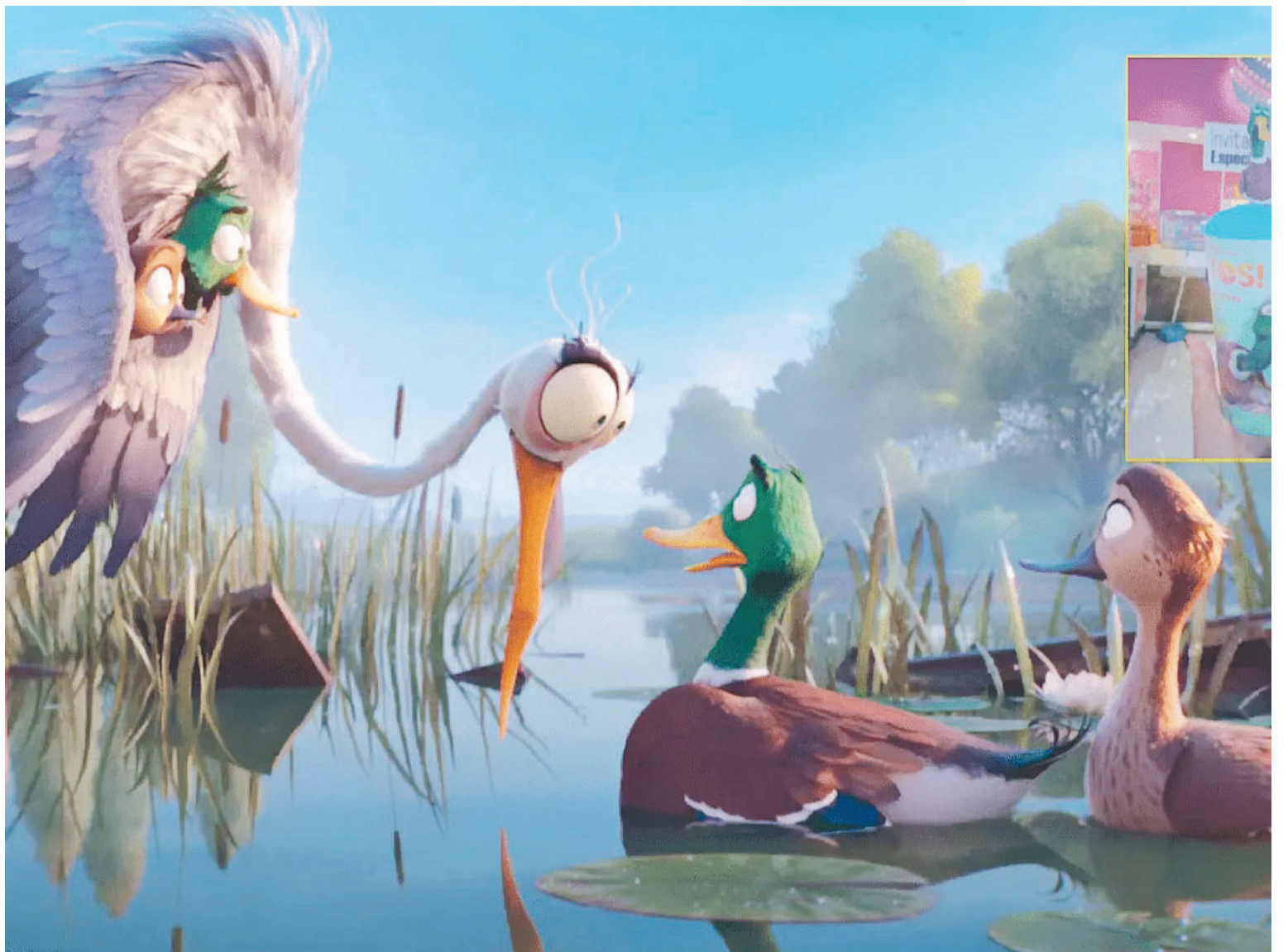
"Patos", diariamente en cines Círculo y Sunstar.

Los viernes 2 y 16 de febrero, festival de música en vivo, feria de emprendedores y patio gastronómico