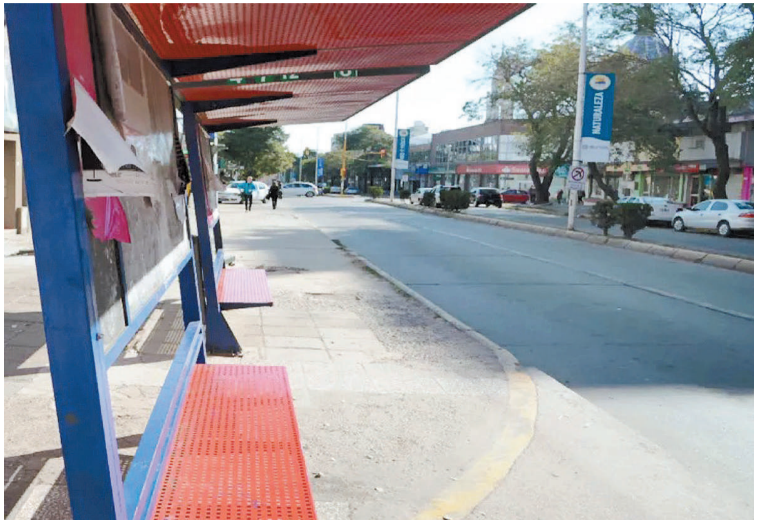
La capital provincial y su zona circundante están otra vez sin servicio de colectivos.

SALARIOS. "El paro por es por tiempo indeterminado hasta que