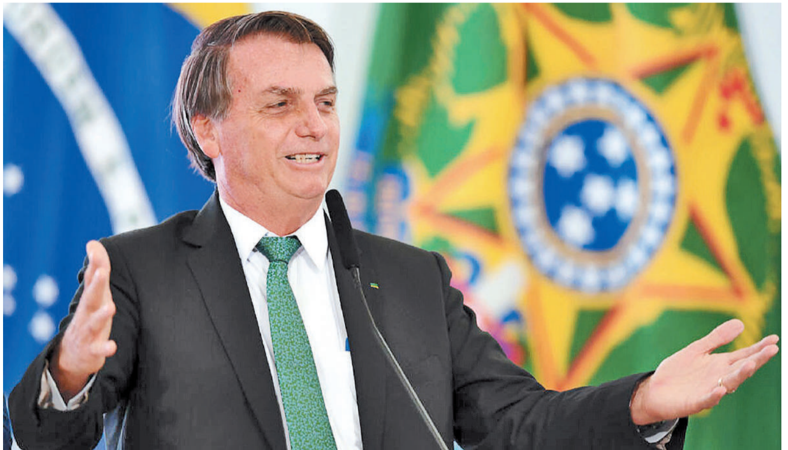
El ex presidente brasileño Jair Bolsonaro vuelve a estar en el foco. Esta vez por espionaje.