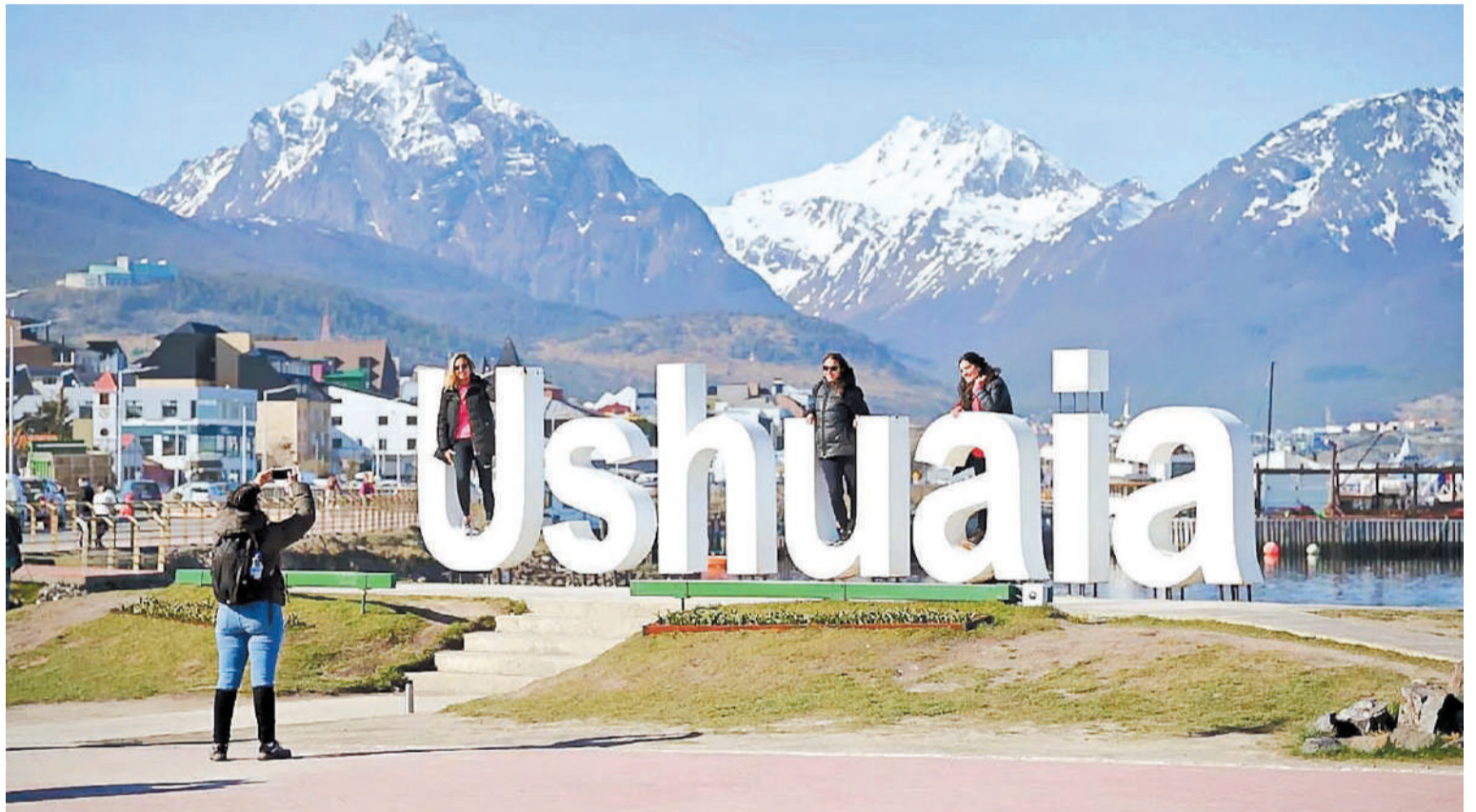
Ushuaia, uno de los destinos para visitar en vacaciones de verano.

Llegar hasta el Fin del Mundo puede significar un esfuerzo económico, en especial para familias o grupos numerosos, pero la ciudad de Ushuaia, en Tierra del Fuego, también ofrece un amplio menú de posibilidades de bajo costo una vez instalados en el destino.