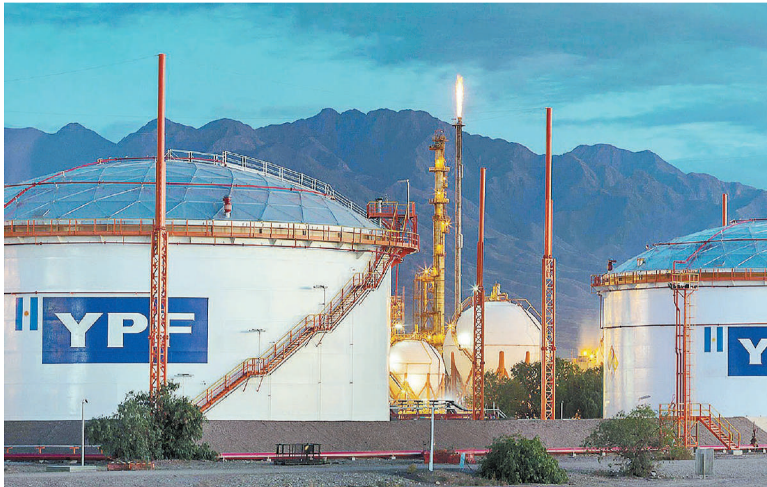
YPF figura entre las empresas y organismos comprendidos en el proyecto de ley para privatizar, junto con Aerolíneas Argentinas, Banco Nación, Casa de la Moneda, Correo e INTA, entre otros.