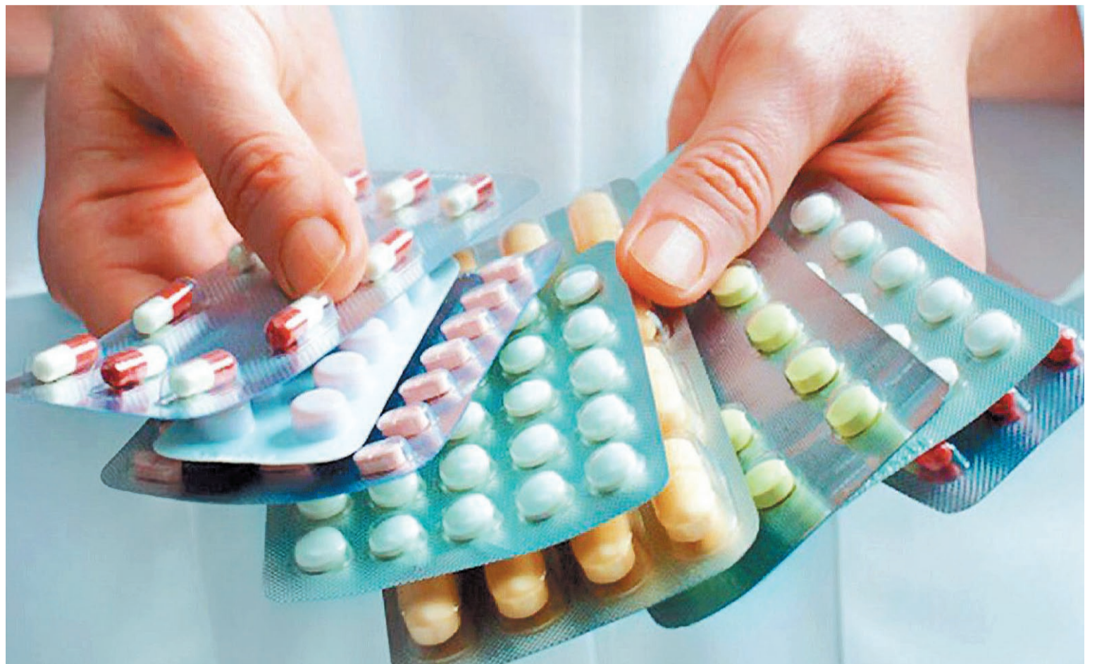
Autorizan la comercialización de medicamentos en locales que no sean farmacias

quier figura jurídica permitida por la legislación vigente. Con el Decreto de Necesidad y Urgencia (DNU) número 70/2023, queda autorizada la venta de medicamentos de venta libre en otros comercios que no sean farmacias, además de que se podrán brindar ciertas prestaciones de salud en farmacias.