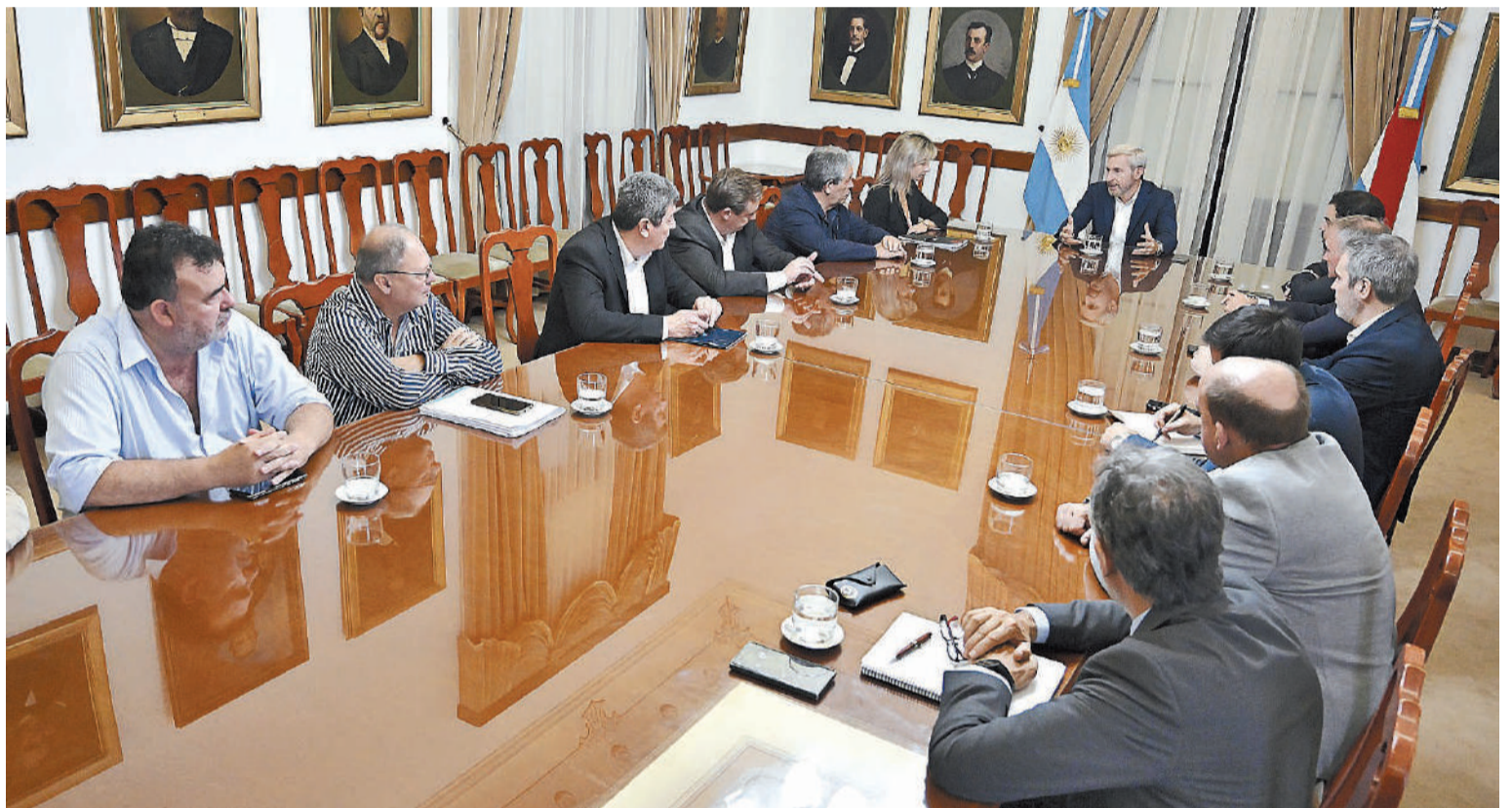
La deuda en la obra pública se reparte en 15.000 millones a las empresas, 6.800 millones a deudas judicializadas por certificados vencidos y 1.000 millones a la UEP.

Además, se definió incluir una cláusula de adhesión para que aquellos municipios que así lo requieran puedan incorporarse a los mismos términos del acuerdo.