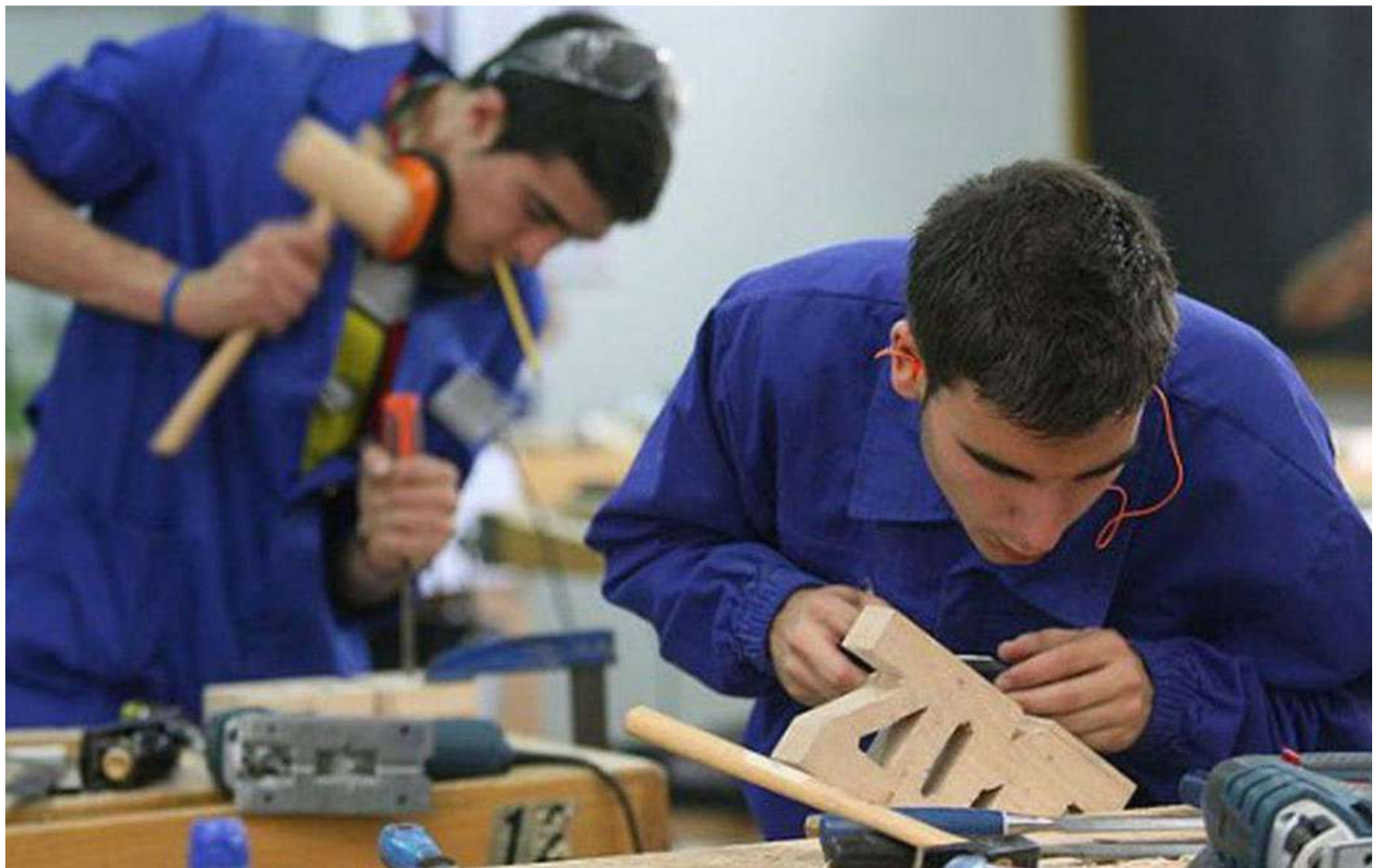
Según el informe, el número de desempleados disminuyó 1,4% respecto al mismo período del año pasado.

Actividad Económica (EMAE) acumuló una merma del 1,4%, afectada por la sequía.