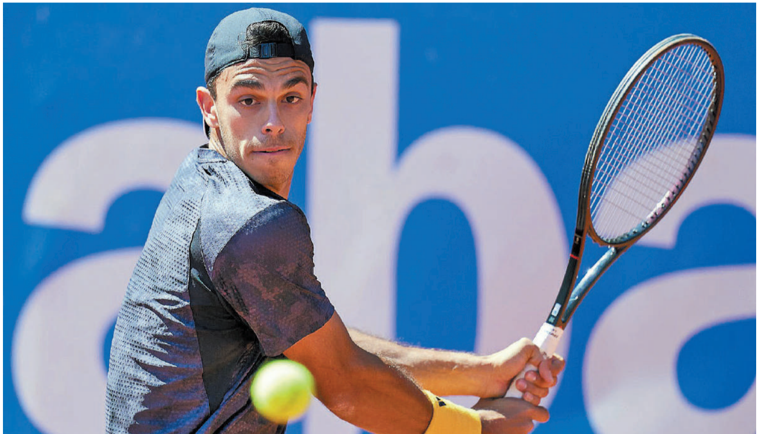
“Creo que fue un gran año, el mejor de mi carrera”, se sinceró el tenista bonaerense número 21° del ranking ATP.

El tenista argentino Francisco Cerúndolo brindó un pantallazo de lo que será la próxima temporada, en la que ya se encuentra trabajando. Durante la jornada de ayer, luego del entrenamiento describió lo que fue este año e hizo énfasis en la planeación sobre el 2024 y las competencias que tendrá.