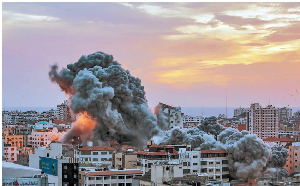
Ya se registraron más de 20 mil muertos y la Franja continúa destruyéndose.

MÁS DETALLES. La Franja de Gaza está sin electricidad por un bloqueo