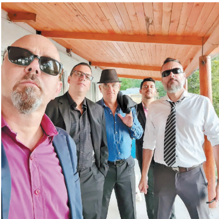
Genitales Argentinos, hoy a las 21 en el Almacén de los 33.

Este sábado 23, en el horario de 18 a 00, se presentará una nueva jornada de Casa Feria con shows en vivo y feria para las infancias. Será en Chavela Casa Espacio (Misiones 448).