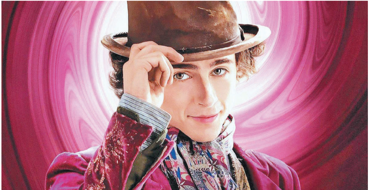
Wonka, diariamente en cines Círculo y Sunstar.

Este sábado, desde las 21, Jam Ska Reggae en el Almacén de los