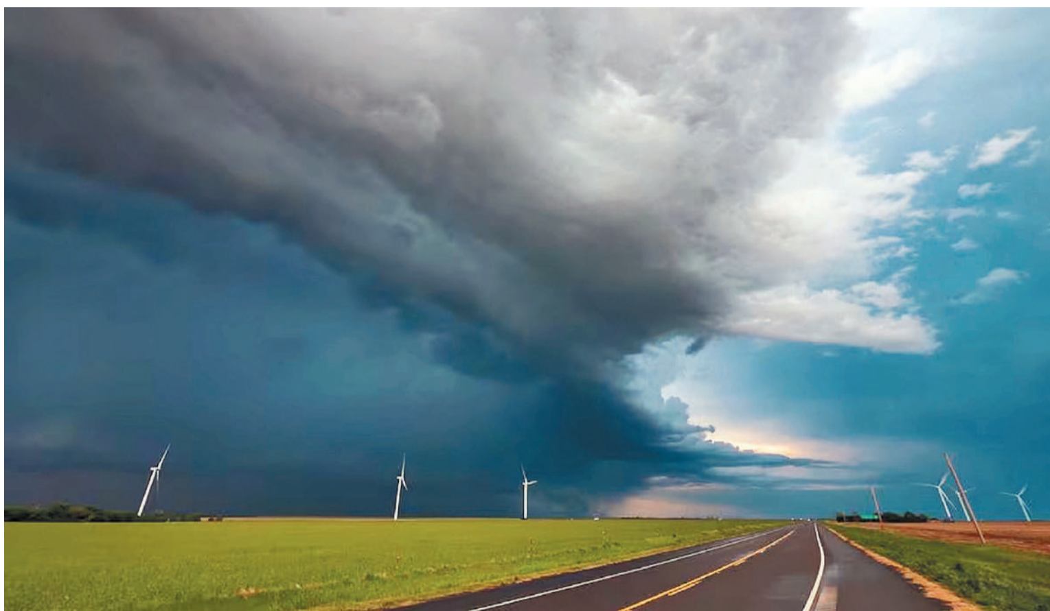
Estiman que los efectos positivos de El Niño sobre el Cono Sur serán perturbados por una fuerte interferencia de los vientos polares

Según indicó el informe mensual de la Bolsa de Cereales de Buenos Aires, habrá vientos polares que generarán ‘anomalías’. La Mesopotamia podría ser afectada por lluvias intensas. El fenómeno climático ‘se disipará’ en otoño.