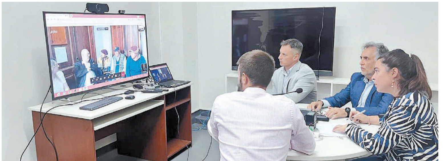
La audiencia de mediación conjunta se efectuó bajo la modalidad virtual.