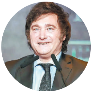
Javier Milei, Presidente de la Nación.

“Puede ser que haya gente que sufre el Síndrome de Estocolmo; están abrazados y enamorados del modelo que los empobrece”