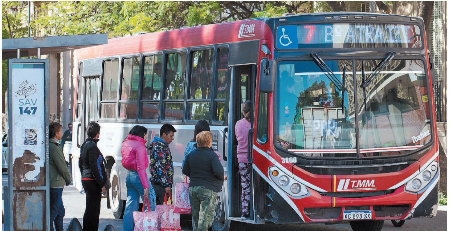
Paraná y el Área Metropolitana inician un nuevo día sin servicio de transporte urbano.

TARÍA DE TRABAJO. De acuerdo a lo emitido ayer por la cartera laboral provincial, los choferes debían retomar de inmediato los recorridos en Paraná y el área metropolitana, mientras que Buses Paraná no puede ni debe tomar ningún tipo de represalia contra los trabajadores.