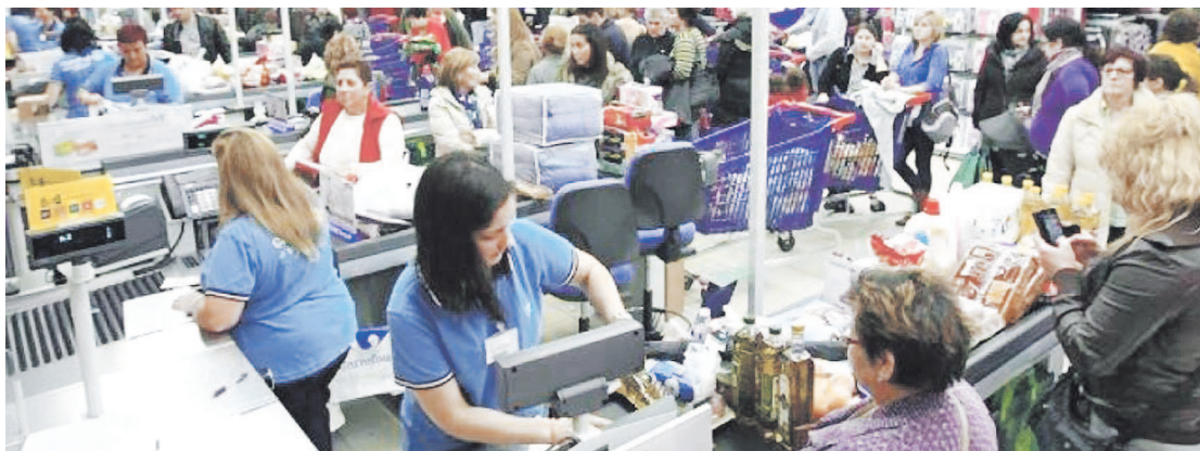
CAME reconoció la necesidad de una recomposición salarial, pero pidió que los aumentos sean diferenciales por región, tamaño y tipo de empresa.

L a Confederación Argentina de la Mediana Empresa (CAME) reconoció la “necesidad de una recomposición salarial” para la reactivación del consumo,