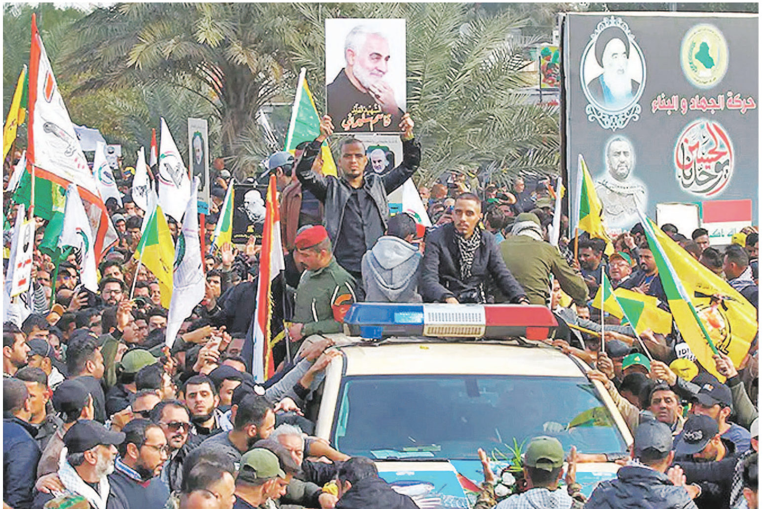
Al grito de “¡Muerte a EEUU!”, miles de personas despidieron a Soleimani.

En la procesión, integrada en su mayoría por hombres con uniforme militar negro, sobresalían las banderas de Irak y de las milicias respaldadas por Irán, cuyos combatientes han demostrado una ferocidad lealtad a Soleimani.