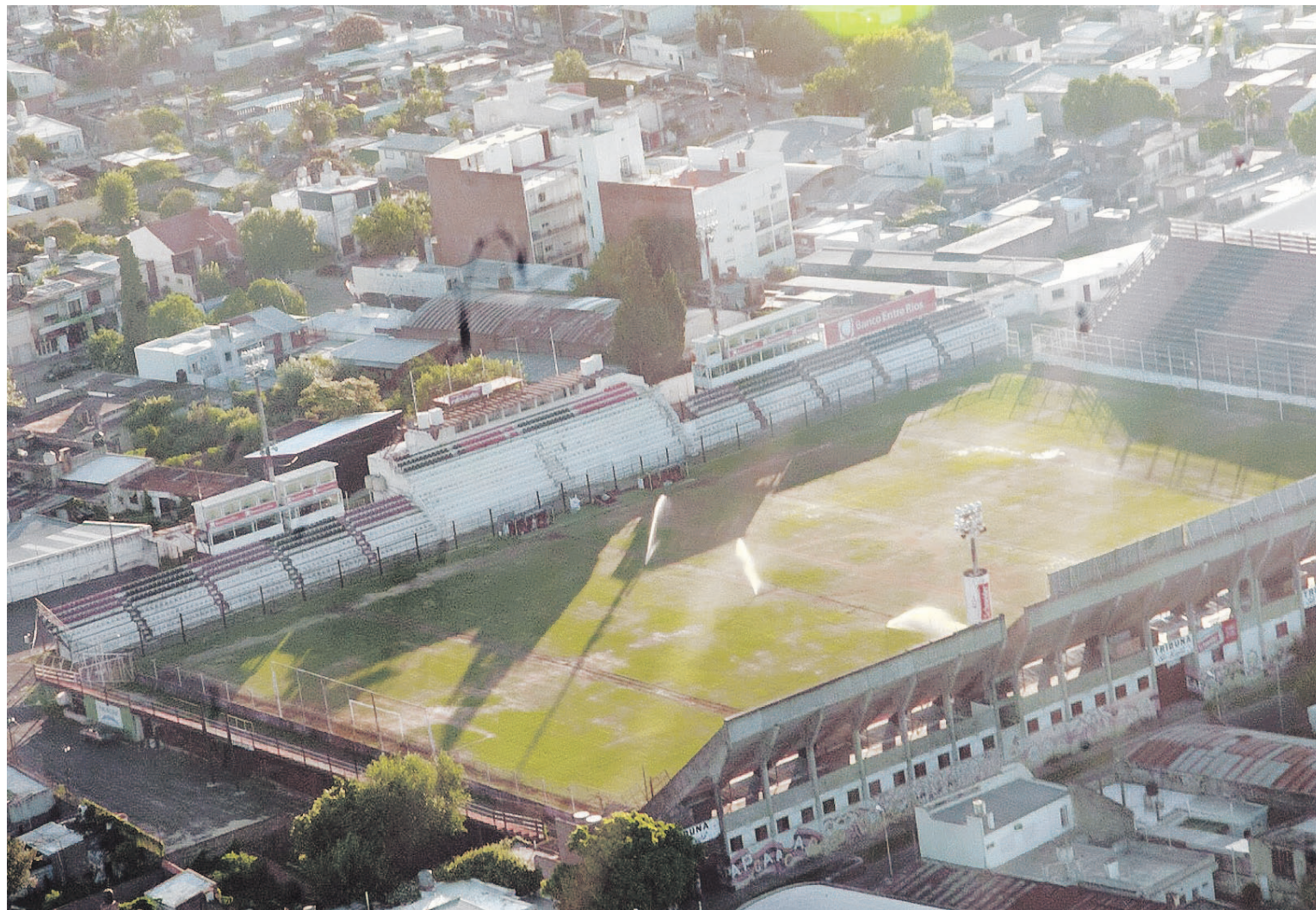
Vista aérea tomada este fin de semana del estadio Presbítero Bartolomé Grella. El campo de juego luce con algunas franjas marrones donde fueron insertadas las nuevas líneas de riego. Se ven además los chorros de los aspersores.

▶ SUPERLIGA. Patronato reacondicionó con una importante inversión el campo de juego del Grella