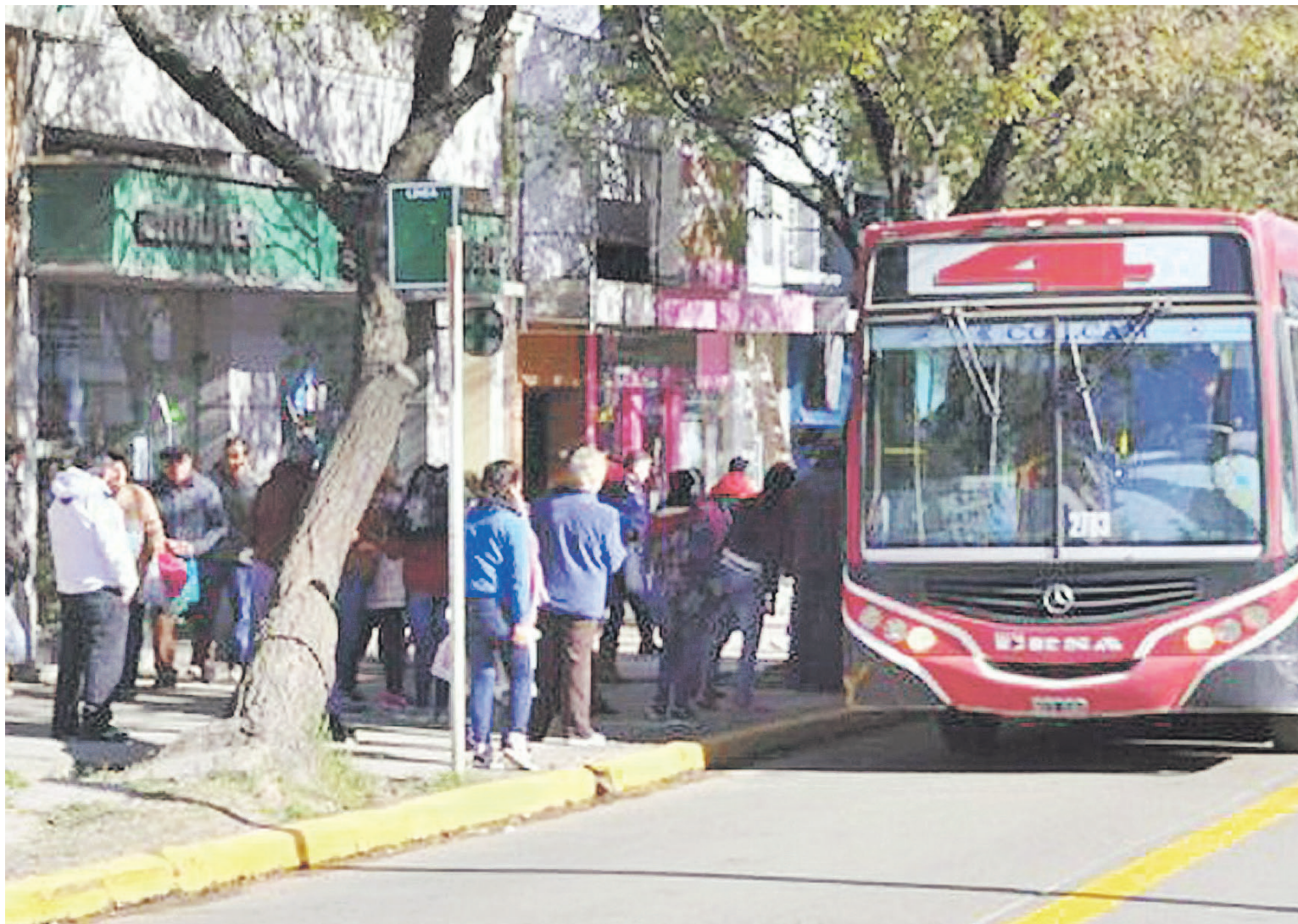
En Paraná también podría aplicarse el congelamiento de los precios del transporte.

reunión con el ministro Meoni a fin de analizar esta cuestión.