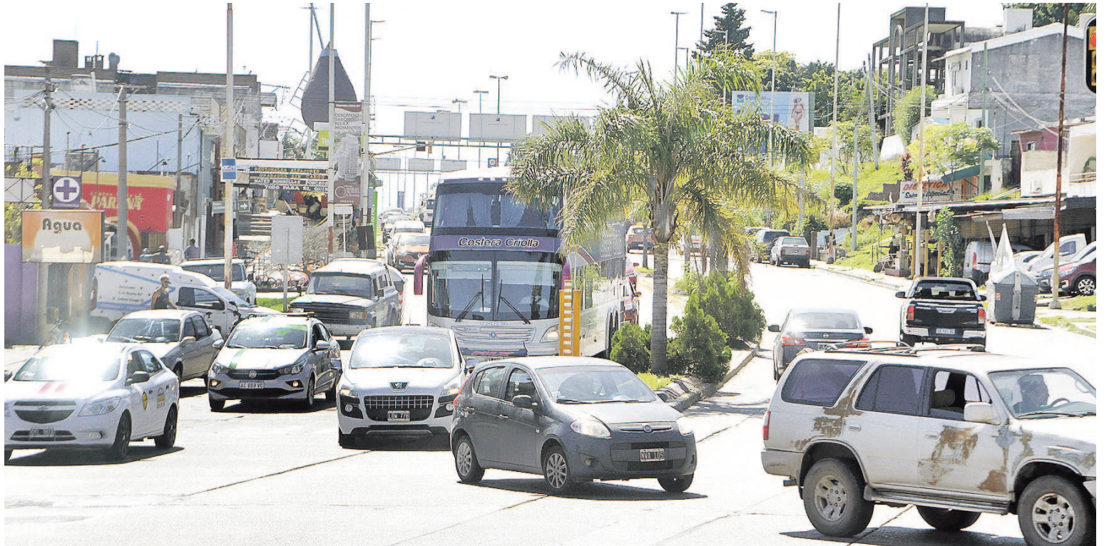
Avenidas Uranga y Ramírez, un verdadero nudo vial.

CAMBIO DE CARÁCTER. Los memoriosos recordarán que hace algunas décadas atrás, el cruce de Laurencena-Uranga y Ramírez era un nudo que ponía a prueba los mecanismos de transmisión y los sistemas de freno de caravanas de camiones que encontraban en el Túnel Subfluvial un punto de contacto. Con los años, el tránsito pesado ha tendido a disminuir y son los autos y camionetas los que dominan la escena, al menos en ese