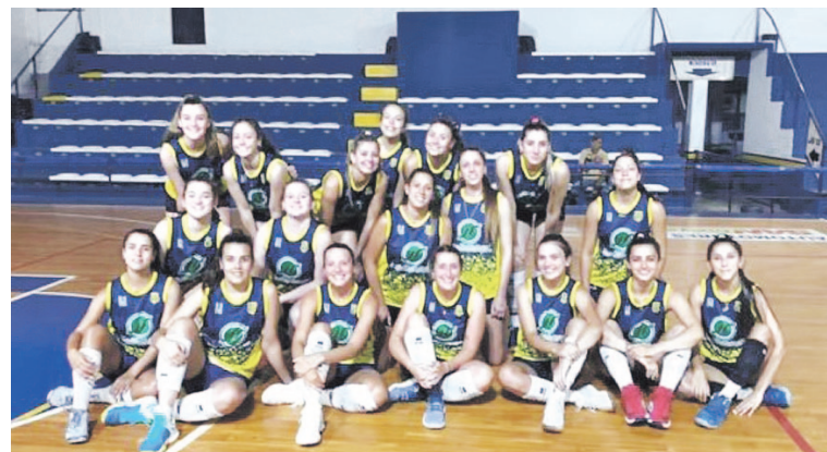
San José ya le apunta al inicio de la Liga Argentina Femenina.