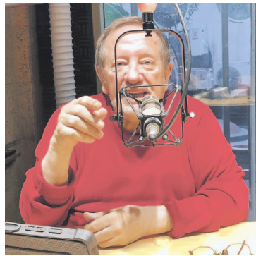
«Las diez puertas», obra del hábil narrador Elvio Gandolfo.

En "Las diez puertas" Elvio Gandolfo articula con precisión y audacia relatos que dan cuenta de separaciones, despedidas y enamoramientos que permiten realizar un recorrido por géneros, ya que hay cartas, cuentos eróticos y ciencia ficción, para desafiar las formas de percepción de los vínculos.