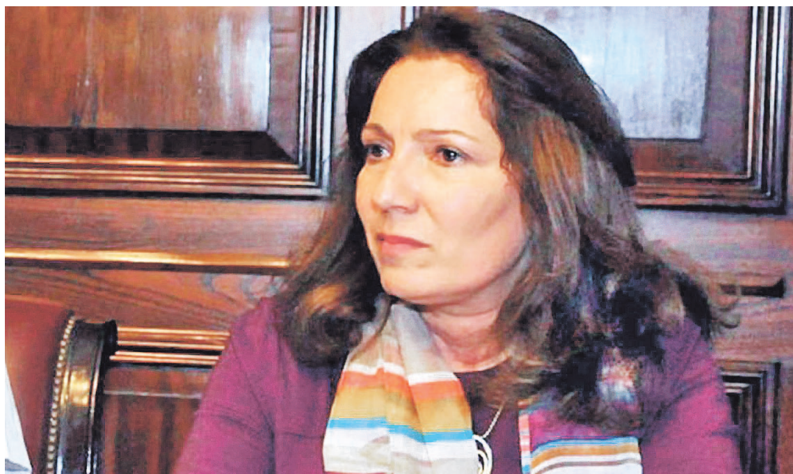
Caamaño pidió informes sobre la cantidad de personal y las tareas de cada uno, caso por caso.

Desde la intervención se cuestionó el procedimiento por consi-