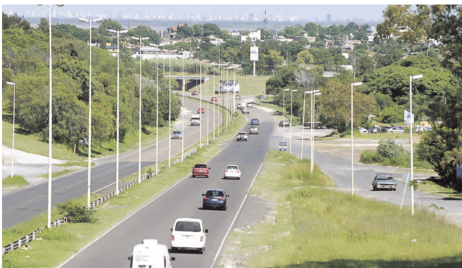
Circular a altas velocidades es una norma no escrita en la Circunvalación José Hernández.

En fin, lo que ayer favoreció la vinculación de puntos distantes hoy entorpece la comunicación de un lado y del otro de la ruta, lo que puede ser resuelto con un programa integral que reconozca y abarque los nuevos usos de la avenida como tal y de sus espacios circundantes.