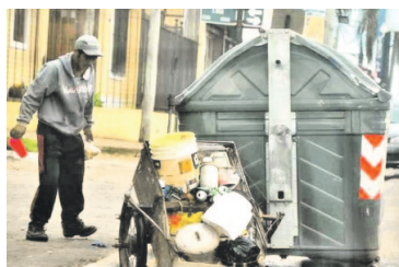
El impacto de las políticas de 2018 y 2019 han sido notablemente perjudiciales para numerosos conciudadanos.

—La lógica es sustentabilidad primero y redistribución después. Habrá que ver si están todos de acuerdo. El que tiene que poner no lo verá justo, pero así es la situación política: elegimos un gobierno y el gobierno toma las decisiones en un marco democrático.