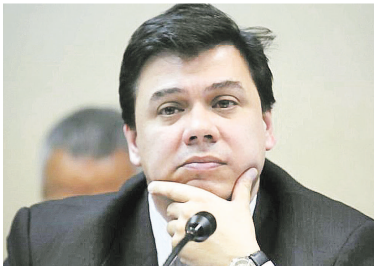
Moroni adelantó que “la decisión política ya está tomada, están terminando de redactar” los aumentos para docentes y estatales.

El Gobierno oficializó ayer el aumento de salarios de 4.000 pesos para los trabajadores del sector privado, que será a cuenta de futuras paritarias. Ratificó además, que esta semana se anunciará un esquema “muy parecido” de incremento para los trabajadores estatales y los docentes.