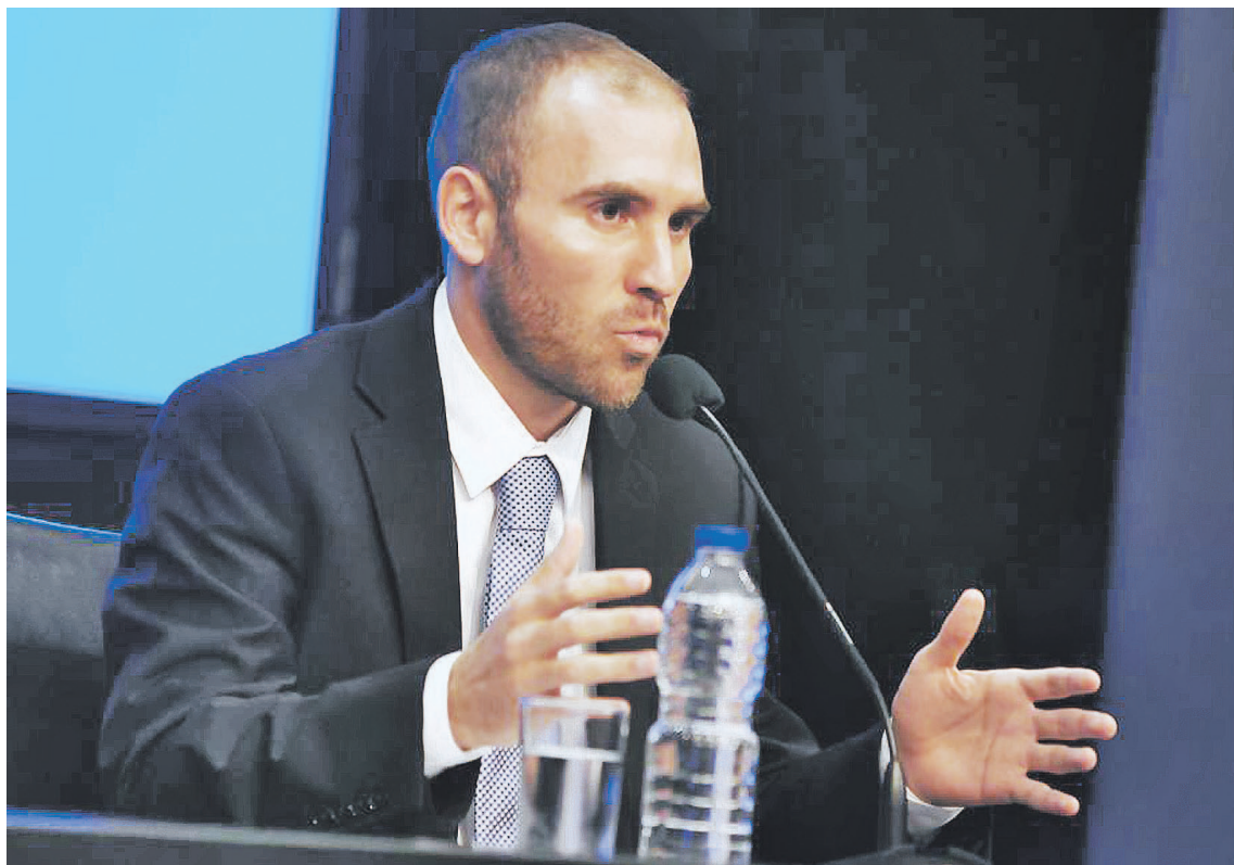
La clave de los congelamientos, y eso lo sabe bien el ministro Martín Guzmán, no está en cómo entrar sino en cómo salir.

El Gobierno intenta estabilizar la economía inmovilizando algunas variables clave mientras cobra solidez el ajuste fiscal sustentado en la suspensión de la cláusula de indexación de las jubilaciones y el aumento de impuestos.