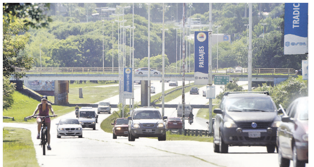
El camino parte en dos esta parte de la ciudad y dificulta la conexión norte-sur.