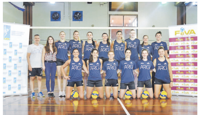
La selección nacional femenina se alista para ir por su plaza olímpica.

Además de Argentina-Perú, la jornada inicial tendrá el cruce de Venezuela-Colombia. En tanto el miércoles, jugarán: Argentina-Venezuela y Perú-Colombia. Mientras que el jueves, harán lo propio Perú-Venezuela y Argentina-Colombia.