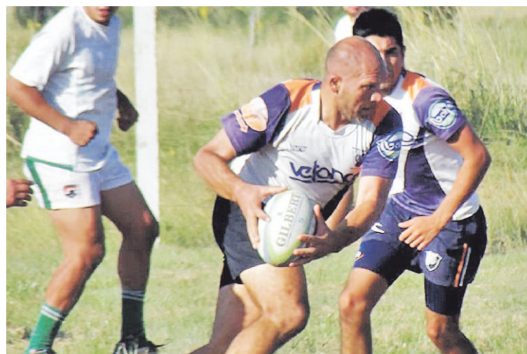
San Martín palpita su tradicional certamen de la mejor manera.

La ovalada empezará a moverse desde las 15 y concluirá con un gran tercer tiempo. En este sentido, ya definieron su presencia equipos de San Martín, Salto Grande de Concordia, Curiyú de Chajarí, Ñandubay de Curuzú Cuatiá, Unión de Crespo, un representante de Monte Caseros y otro Federal. No obstante, hasta ayer por la tarde aún se esperaban más confirmaciones.