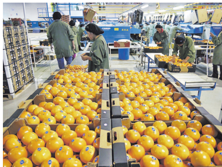
El fortalecimiento de las economías regionales impulsará a la industria entrerriana.

—No creo que estas medidas tengan un gran impacto en la economía en general. Es un dinero que está destinado a personas de menores ingresos que probablemente gastan en bienes de la canasta básica alimentaria total y eso quizá impulse algunos sectores en un primer momento, pero no creo que sea el gran impulso económico. Faltan otras medidas para reactivar la economía, además de incentivar el consumo interno: financiamiento en condiciones adecuadas y alivio en la carga impositiva, sin ir más lejos.