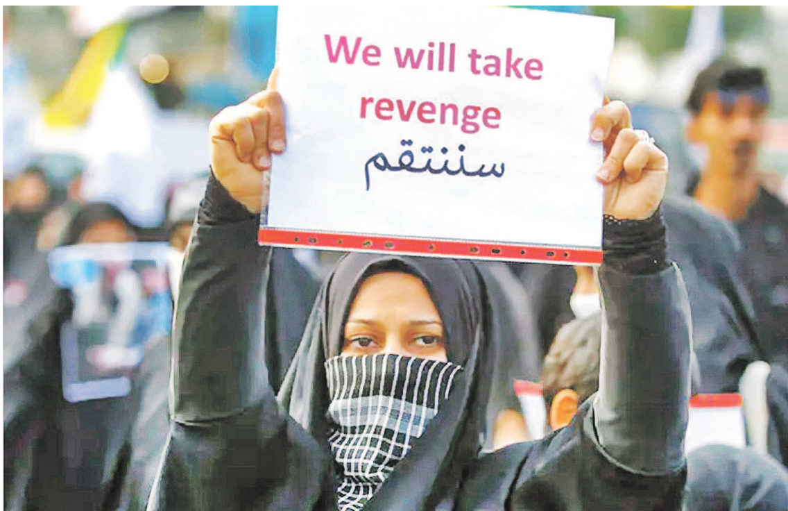
Durante las manifestaciones pudieron verse carteles que decían: “Nos vengaremos”.

Sin embargo, son días felices para Trump. Probablemente, cuando se recuerde su presidencia, el 2 de enero de 2020 será evocado como una de las fechas claves para entender el modo de hacer política de este empresario republicano