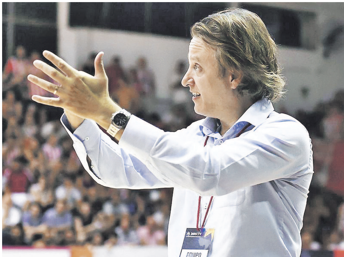
Sorpresa en el ámbito del básquet nacional, tras la baja en su cargo del paranaense Müller.

Al quinteto venezolano lo condujo a la conquista del Campeonato FIBA Américas 2015, con el que se clasificó a los Juegos Olímpicos