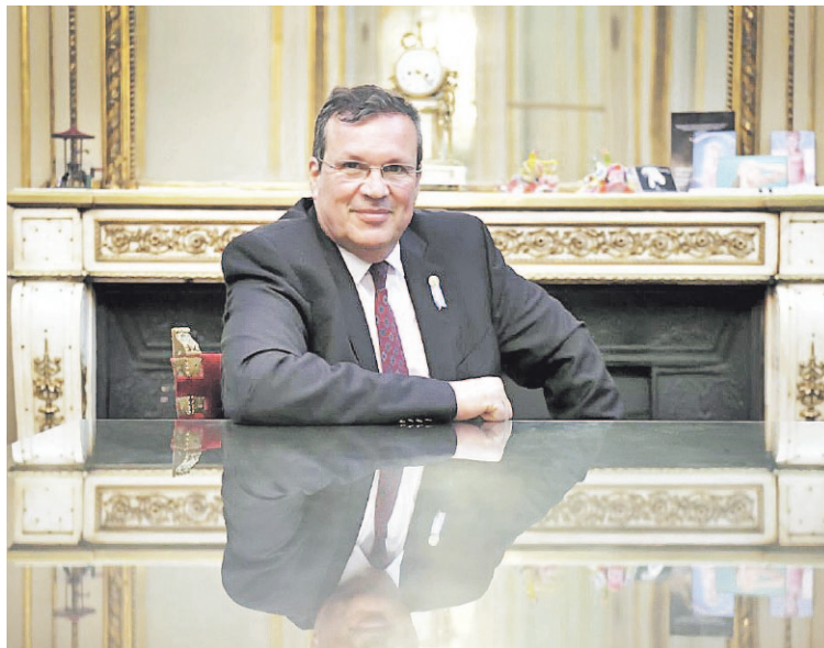
"Soy de los que saben que la cultura puede mucho", destaca Tristán Bauer. Para el Ministro, "el desafío es poner a la cultura al servicio de la reconstrucción" del país.

El Ministro de Cultura de la Nación traza un panorama del sector que comprende la cartera a su cargo mientras perfila sus primeras medidas. No desconoce la magnitud de la crisis, pero destaca la potencia de la cultura en su rol transformador "al servicio de la reconstrucción" del país.