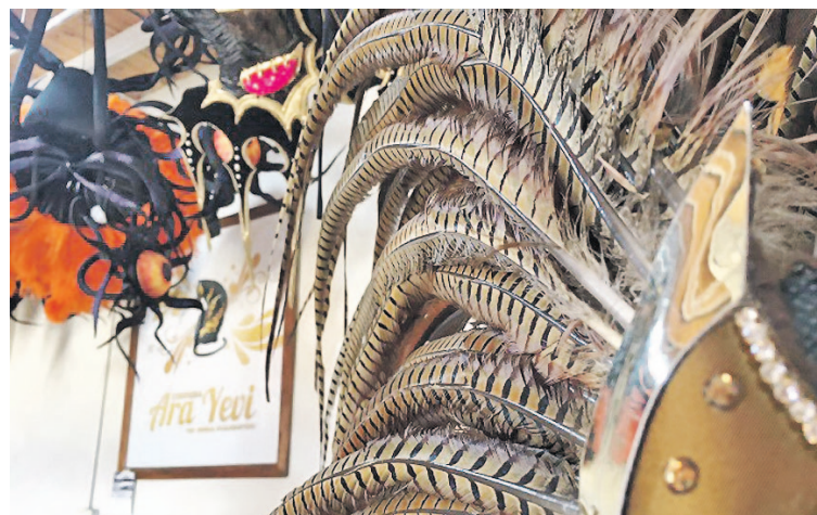
Un espaldar tiene como mínimo 300 plumas.

Entreguémonos entonces a esta magnífica licencia, que año a año se reedita bajo la protección colorida de la alegría. Celebremos esta alquimia bestial y divina, y que el carnaval obre su magia", expresa el argumento del Club Tiro Federal para explicar el tema de su comparsa.